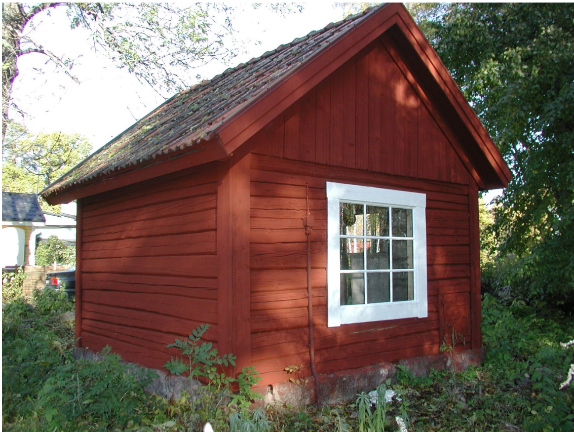
Hönshuset med nytt fönster och bytt timmerstock under fönstret.

Fastighetsägaren har beviljats bidrag för att frilägga grunden från vegetation och annat skräp. Rötskadade timmerstockar har reparerats, främst under det större fönstret. Vidare har hönsluckan och rötskadade knutbrädor lagats. Två fönster har nytillverkats efter länsstyrelsens principskiss och trasiga fönsterfoder har lagats. Trasigt taktegel byts ut lika befintligt och övrigt tegel justerats. Väggarna har målats med Falu rödfärg och fönster med vit oljefärg. Dörren har tjärats.