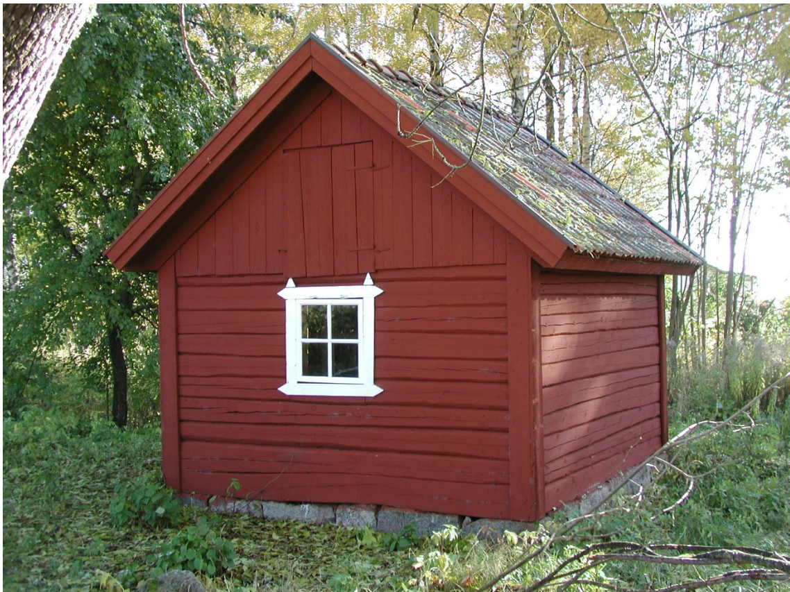
Det nytillverkade lilla fönster med foder i schweitzerstil.