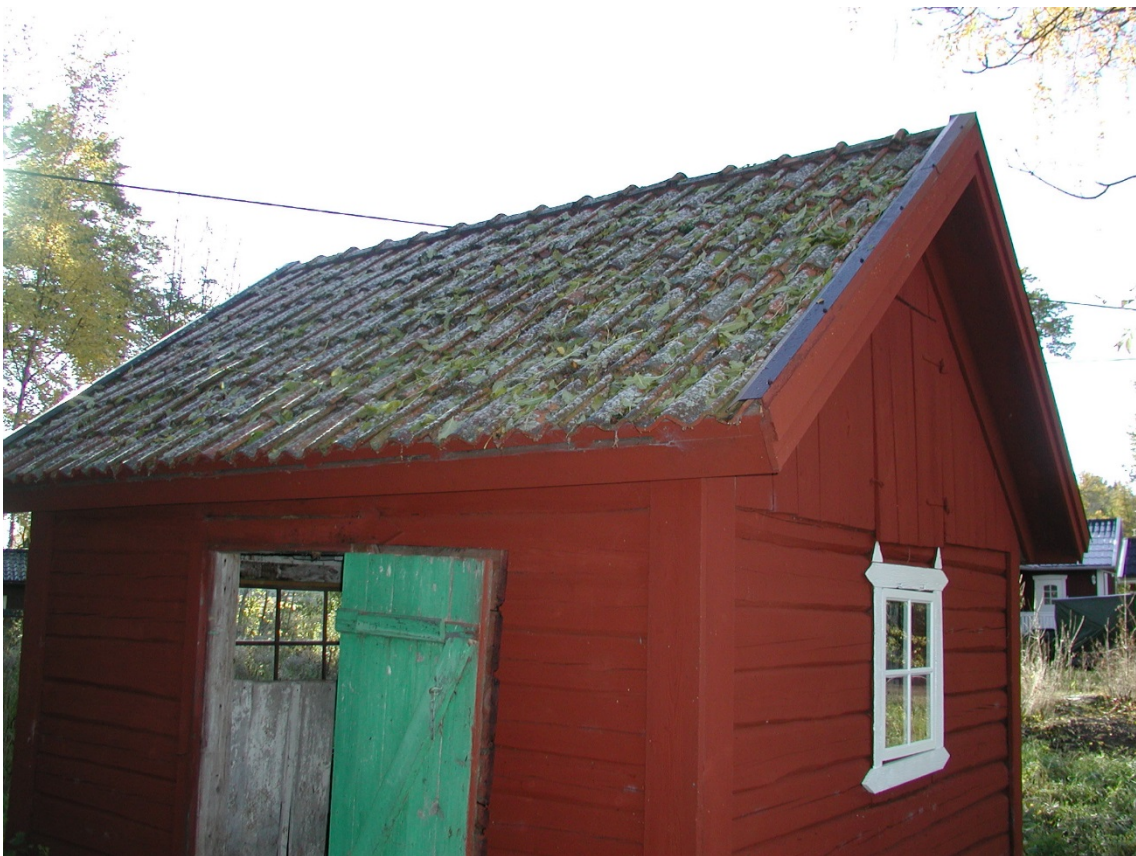
Den äldre plankdörren.