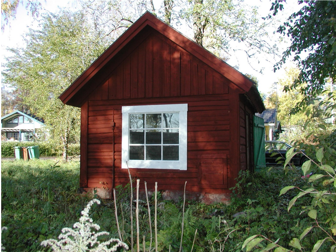
Till höger syns den lagade hönsluckan.