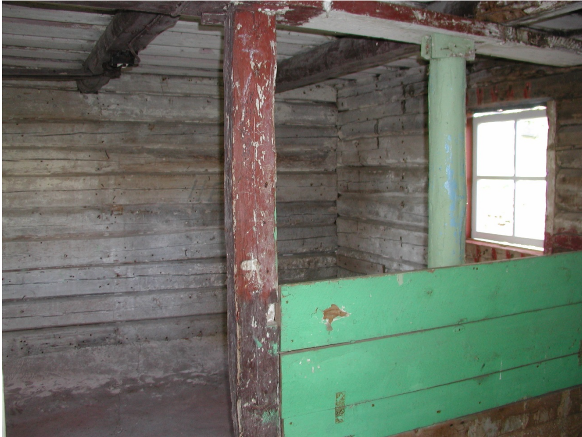
Det lilla fönstret inifrån höns huset. Delar av den äldre inredning är bevarad.