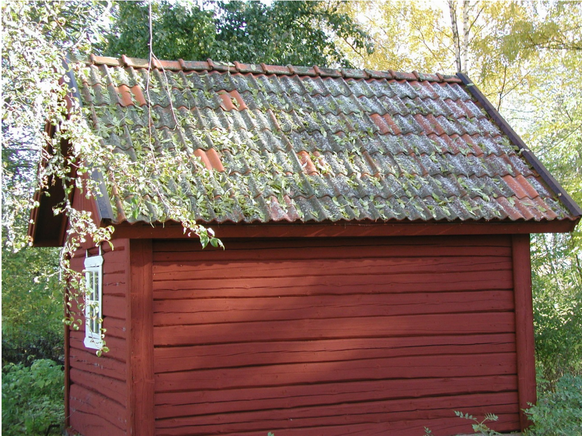
Nya takpannor har lagts där gamla varit trasiga, resten har justerats i rätt läge.