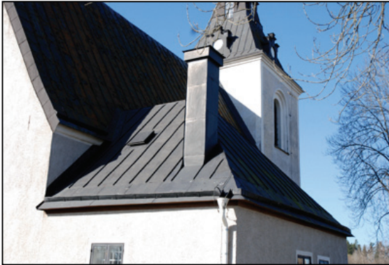
Bild 10. Kyrkan från nordöst innan takomläggningen.

Ävennockfalsar dubbelfalsades. Vid fästning av de nya fotrännorna användes galvad kulturkrok av formaten 6 x 25 mm.