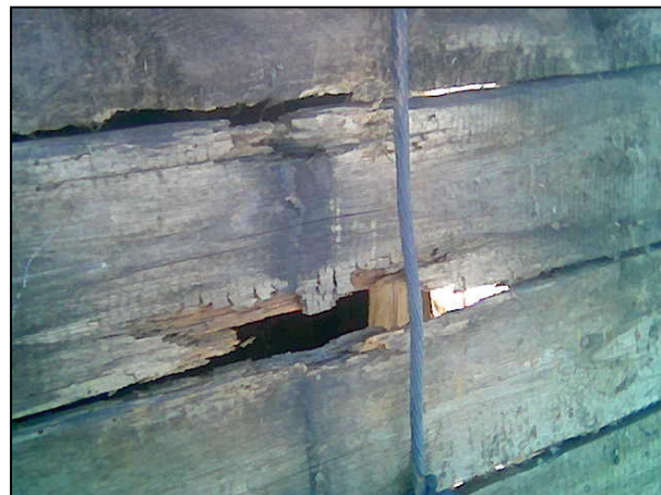
Bild 4. Åskledarfästet har orsakat rötskador.

Innan plåtläggningen lades underlagspapp av kvalitet YAP 2200 som fästes med pappspik. På taket lades svart, fabriksmålade plåt av märket Prelac Nova från Lindab. Plåten lades i utformning likt befintlig. Vissa skillnader uppkom dock jämfört med tidigare täckning. När underliggande trä togs bort i listerna var täckningen tvungen att bli annorlunda. Runt tornfönstren bestod tidigare täckning av plåt i småformat 45 x 59 cm. Den nya täckningen blev något förenklad. Vid fästning av de nya fotrännorna användes galvad kulturkrok av formaten 6 x 25 mm som senare målades svart. På ljudluckorna fanns korrosionshål vilka lagades före målning.