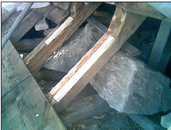
Bild 3. Ilusning av nytt virke i tornets stomme.