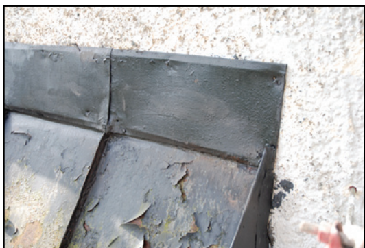
Bild 14. Utseende på ståndskiva innan takomläggning

Mindre putsarbeten utfördes vid ståndskivornas anslutning till fasaden.