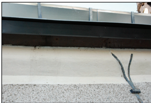
Bild 12. Långhusets takfot med EF plåt.

På sakristian förstärktes plåten i skarvarna mot skorsten och långskepp då takbrädor saknas. Sakristians gamla taklucka ersattes med en ny. Skorstenen beslogs med ny plåt likt föregående i falsindelning.