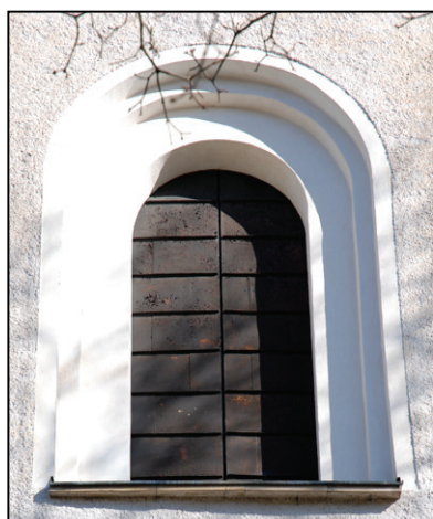
Bild 8. Ljudlucka innan restaurering