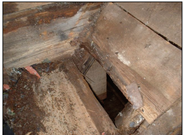
Bild 2. Samma område efter plåten avlägsnats