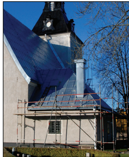
Bild 11. Kyrkan från nordöst efter takomläggningen.

På sakristian förstärktes plåten i skarvarna mot skorsten och långskepp då takbrädor saknas. Sakristians gamla taklucka ersattes med en ny. Skorstenen beslogs med ny plåt likt föregående i falsindelning.