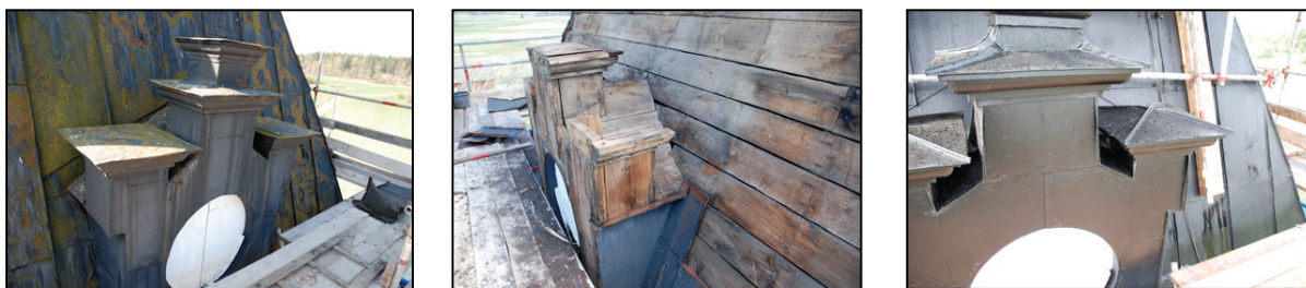
Bilder 5, 6 och 7. Visar tornets norra huv med äldre plåttäckning, efter plåten avlägsnats samt med ny plåttäckning.