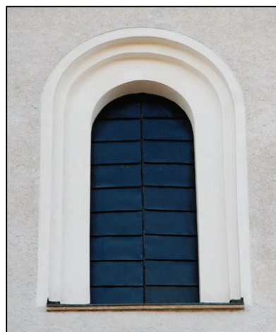
Bild 9. Ljudlucka efter restaurering

Målning av tornet utfördes av Kumlins takmåleri, plåten grundades med Pentur Primer och målades därefter två gånger med Pentur Kultur, NCS 9500N, som slätströks med pensel.