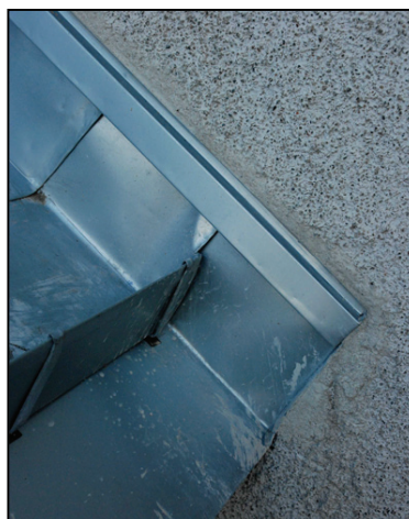
Bild 15. Utseende på ståndskiva efter takomläggning. Putsning utfördes längs skarvarna mellan putsyta och plåt

Länsmuseet slutbesiktigade och godkände den 19 oktober 2007 utförda byggnadsvårdsåtgärder.