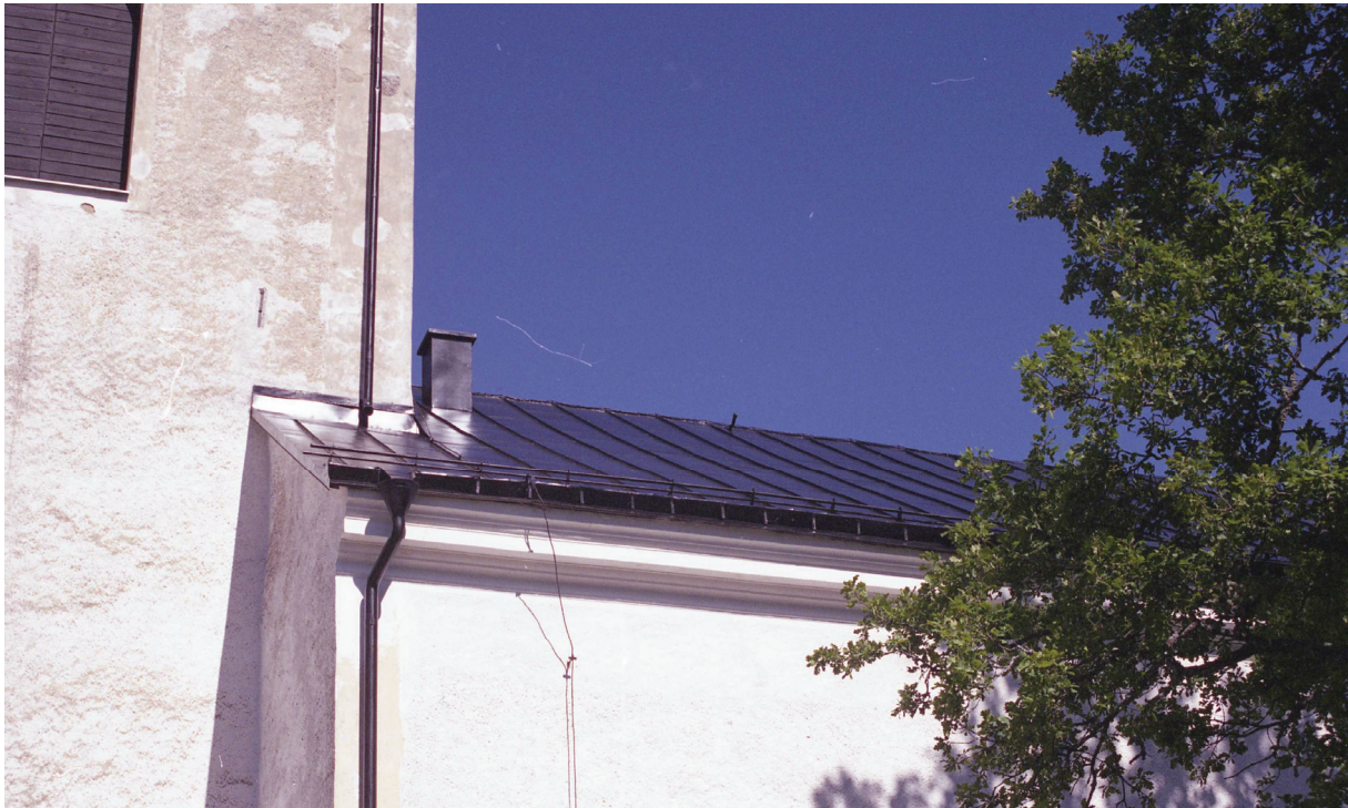
Bild 10: Nymålat tak och lagad takfot vid slutbesiktning, foto från söder.