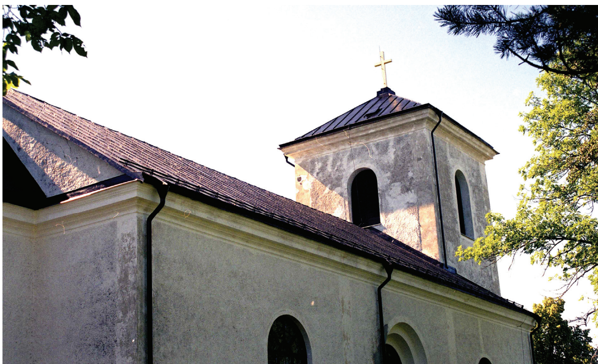
Bild 6: Nymålat torntak med omförgyllt kors vid slutbesiktning, foto från nordost.