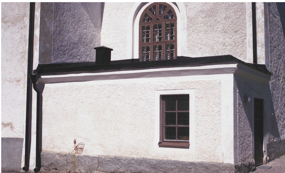
Bild 8: Lagad takfot samt nymålat tak på sakristian vid slutbesiktning.