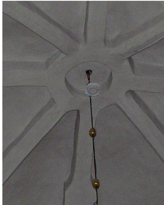
Bild 8: Inmålad montageplåt