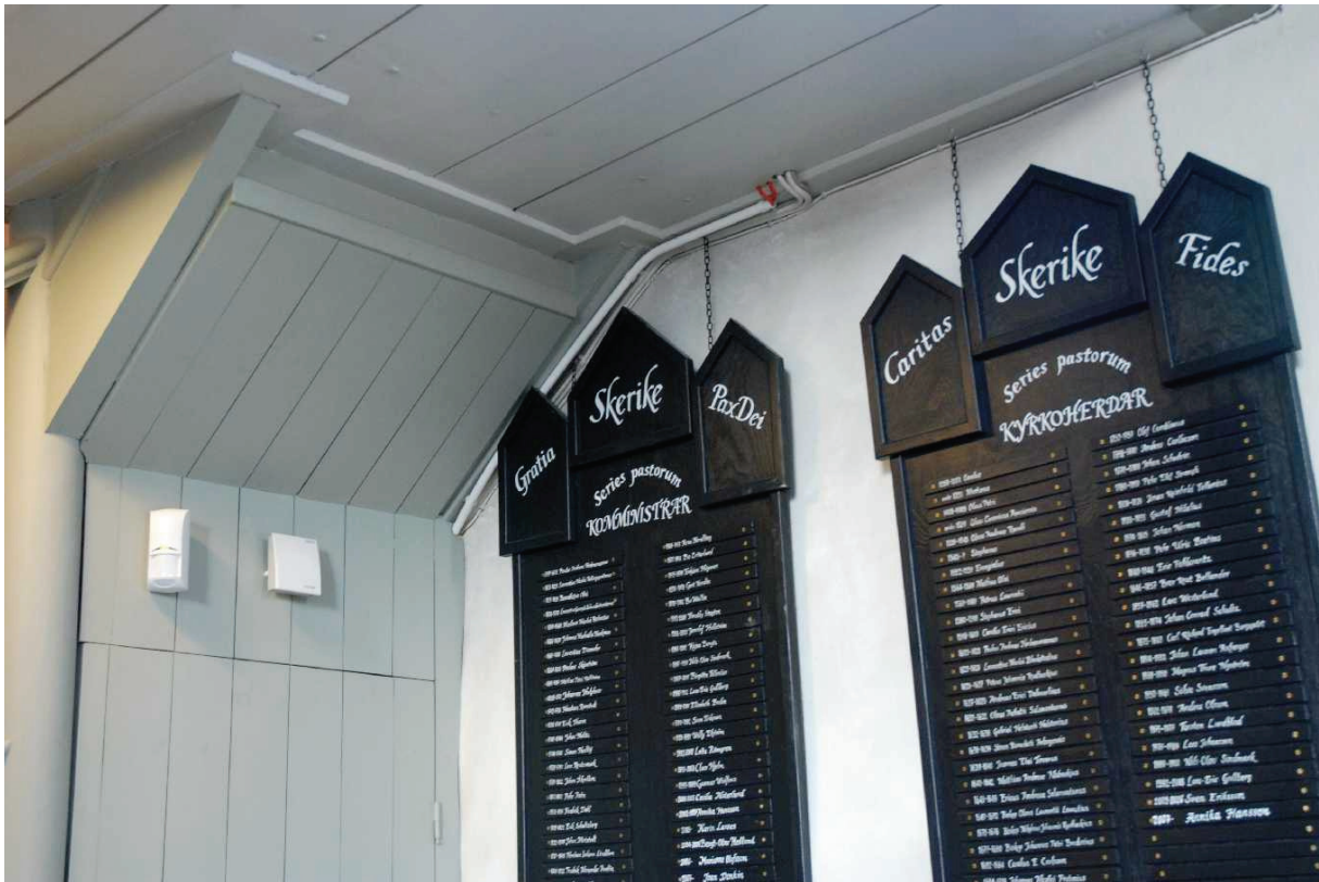
Bild 3: Ledningsdraging i hörn med ännu ej infärgade röda sladdar.