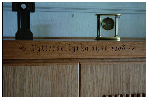
Bild 10. Inskuren text på antependieskåpets krön.