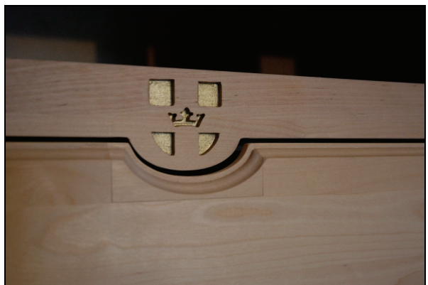
Bild 6. Detalj av dekoren på skåpets krön.

Till lådsatsen har använts botten av vällagrad björkplywood, limmad med WBP-lim (water boil proof) – ett plastlim som inte ger ifrån sig formaldehyd. Sidor, bak- och framstycke är av massiv björk. På sidostyckena har även en tunn, miljöklassad spånskiva använts för styvheten och för att uppnå bra fästegenskaper vid en eventuell målning. Den miljöklassade spånskivan ger inte ifrån sig någon formaldehyd. På frontens sidor har blocklamell använts. Mindre furudelar ingår som t.ex. vissa av reglarna. Krönet har en dekoration i form av ett inskuret