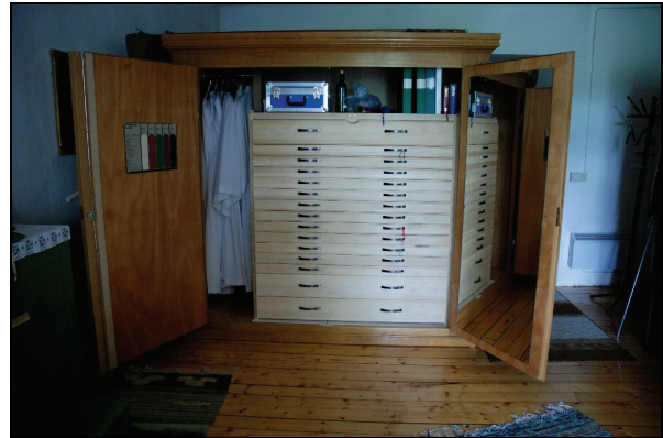
Bild 3. Stora skåpet, exteriört syns ingen skillnad. Bild 4. Stora skåpet med ny lådsats.