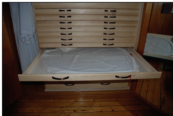
Bild 5. Lådsats med utdragen låda.

Det större skåpet byggdes om för att kunna inhysa en större lådsats. Det var tidigare tvådelat med en avskiljande mittenvägg. Skåpet förlängdes bakåt vilket lett till en ca 30 cm bred spalt mellan sakristians vägg och skåpets äldre bakre avslut då lådsatsen skjuter ut på baksidan. Lådsatsen är placerad i skåpets högra del och i vänstra delen finns en mindre klädstång för upphängning av albor mm. Lådsatsen har en luftspalt i underkant.