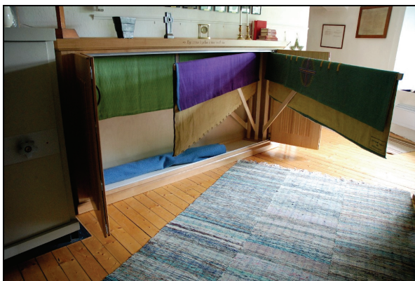
Bild 9. Upphängningen av antependierna är planerad att förbättras.

Det nybyggda antependieskåpet är försett med viktörrar som löper på skenor. Skåpets stomme är till största delen av massiv ek. Dörrar, översida och sidopaneler är tillverkade av eklamell. Skåpets botten och baksida är av vällagrad björkplywood. Några detaljer är tillverkade av furu, t.ex. golvreglar och mittregel. En inskuren text: ”rytterne kyrka anno 2008” pryder krönet. Varje dörrsektion är dekorerad med fjorton parallella, vertikalt ställda träribbor. Hängarna är av massiv björk och björkplywood. Dessa skulle från början vara av metall men ändrades i samförstånd med beställaren. Antependierna ska förses med en fäll innehållande en förstärkningsskena för bättre upphängning, istället för dagens påsydda upphängningsringar vilka sliter på textilierna. Hängarna kommer att anpassas efter antependiernas nya upphängningssystem.