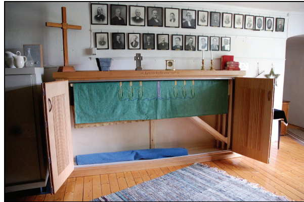
Bild 8. Skåpet är försett med viktörrar och trähängare för antependierna.