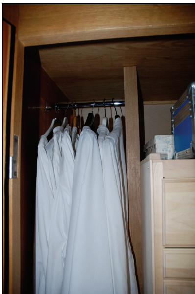
Bild 14. En klädstång för upphängning av albor m.m. sattes in i det stora skåpets vänstra del