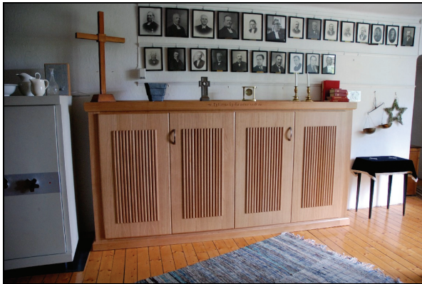
Bild 7. Det nya antependieskåpet.

kors med en krona i mitten. Dekorationerna har kolorerats i guld, i övrigt är skåpet omålat. Lådorna är hängda på stålskenor.