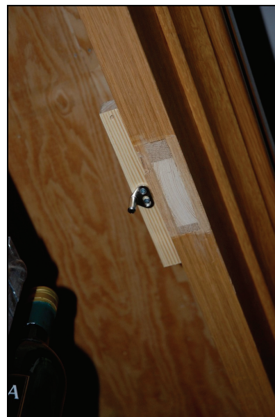
Bild 15. Indelningen av det stora skåpet förändrades vilket medförde att dörren fick byggas om och mittstolpen kapas.