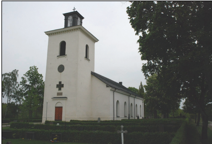
Bild 1. Rytterne kyrka, från sydväst.