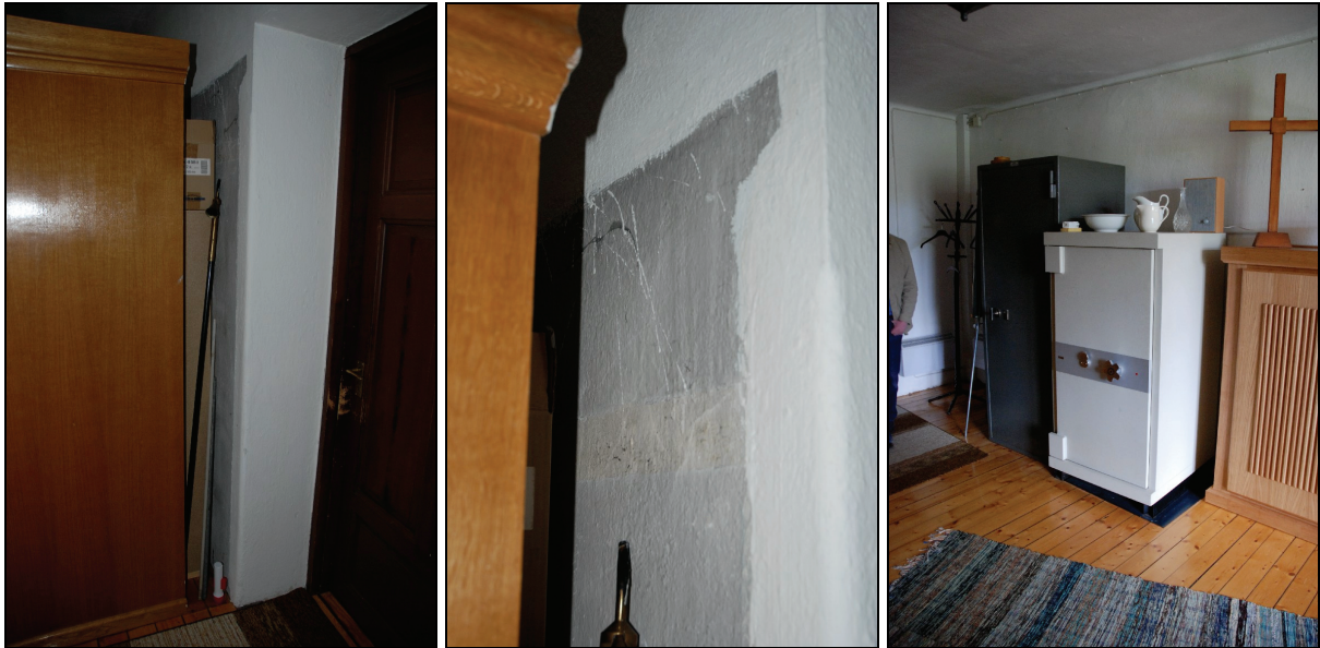
Bild 11, 12 & 13. Bakom det stora skåpet har uppstått en misspyrdande glipa mellan skåp och vägg, (vänster). Vid ommålning av väggen har skåpet stått kvar vilket ger ytterligare en anledning till att åtgärda glipan (mitten). Planer finns på att kläin värdeskåpen i sakristian för en mer enhetlig miljö (höger).

Ett utrymme har bildats mellan det större skåpet och sakristians södra vägg i och med att lådsatsen skjuter ut ca 30 cm på baksidan av skåpet. Det ingår inte i åtagandet för möbelsnickarna att åtgärda detta. Glipan är tämligen misspyrdande och man borde överväga att åtgärda detta t.ex. i samband med verkställandet av de planer som finns på att bygga in värdeskåpen, likt textilskåpen, för att få en mer harmonisk miljö.