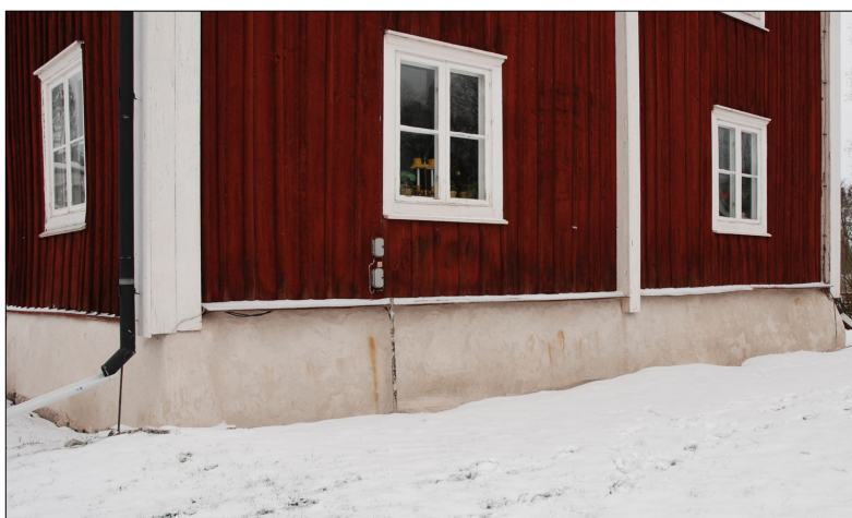
Grunden efter putsning med luftkalkbruk.

Utifrån en bit av den gamla grundputsen skulle en kulör tas fram. Detta drog ut på tiden varför grunden inte kunde avfärgas under 2009. Vintern 2009–2010 frös grunden sönder varför den måste lagas under sommar/höst 2010. Avfärgning av grunden blev klar i oktober 2010. Grunden avfärgades med traditionell luftkalkfärg. Ett antal färgprov togs fram utifrån en bit puts med en grå kulör på. Prov nummer 9 med 25 kilo kalkpasta 90, 3 kilo grön umbra och 0,4 kilo 98 bensvart överensstämde bäst med originalkulören varför denna användes vid avfärgning av grunden. De nya ventilerna har målats med traditionell linoljefärg i kulör samstämmig med kalkfärgen.