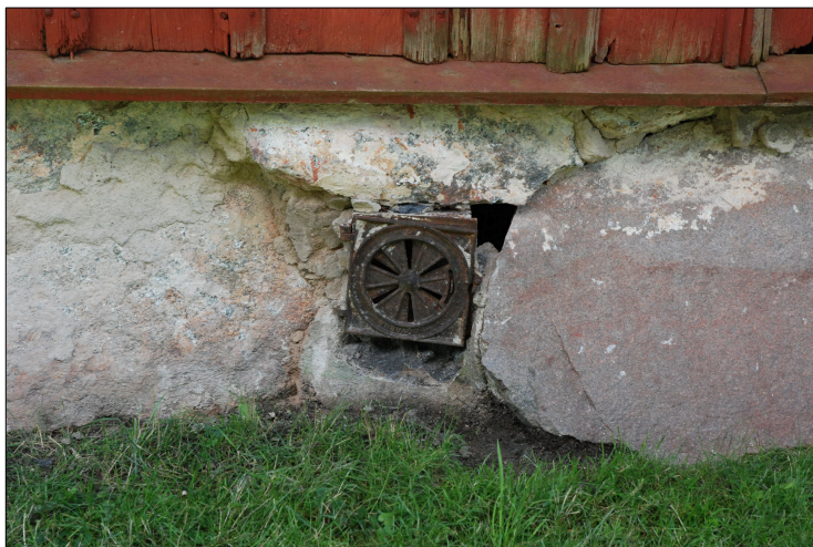
En av ventilerna från 1978.