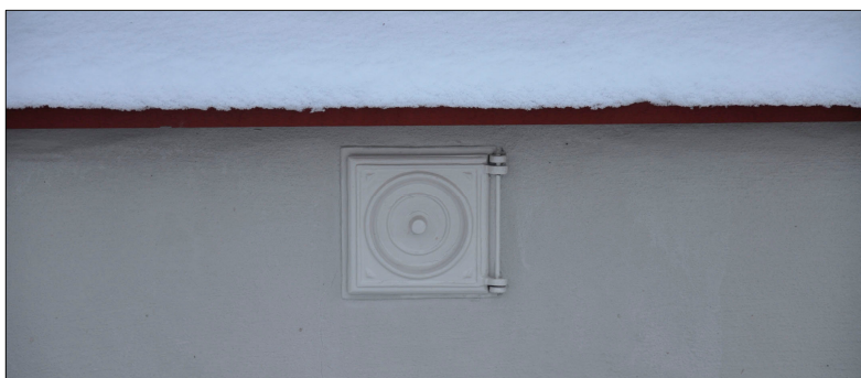
En av de nya ventilerna efter målning med linoljefärg.