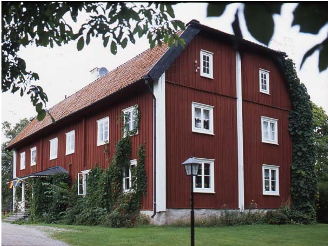
Munktorps prästgård 2004. Bildnr HA 315.

Byggnaden är uppförd i timmer i två våningar med vind. Fasaderna är klädda med locklistpanel målad med röd slamfärg. De många fönstren är kvadratiska och av tvåluftstyp med en spröjs och två rutor i varje båge. Till vinden finns smalare, småspröjsade fönster. Samtliga snickerier är vitmålade. Det brutna och halvvalmade taket är täckt med enkupigt lertegel och vindskivorna är svartmålade. Vattenavrinningen består av hängrännor och stuprör med skarpa vinklar, i svart kulör. Centralt på huvudfasaden finns en öppen veranda med snickarglädje, tillkommen vid slutet av 1800-talet. Ytterdörrarna är typiskt gustavianska. 1