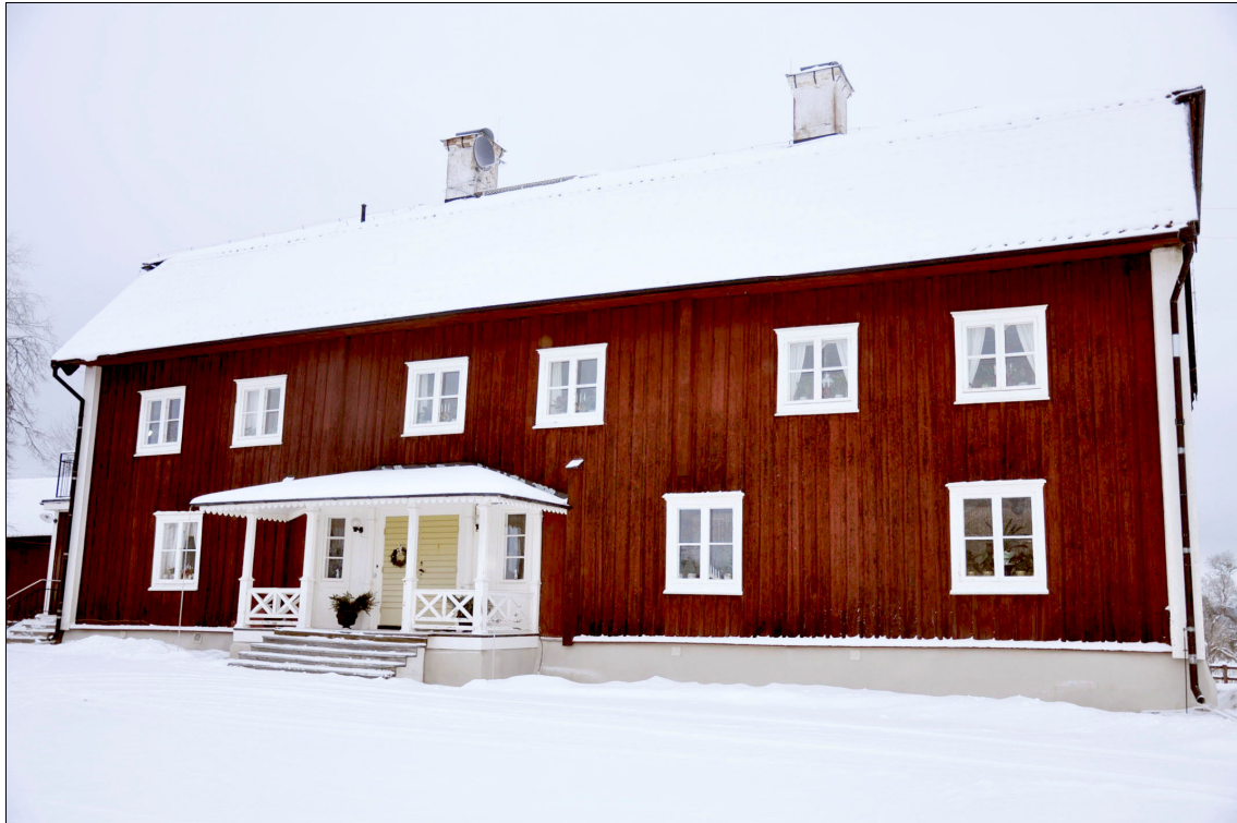
Munktorps prästgård efter restaurering av grunden.