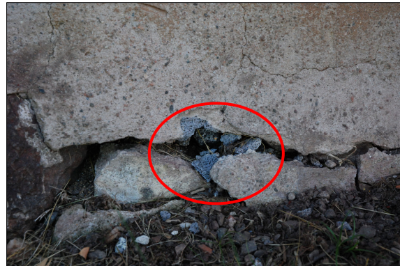
Det fanns vissa små lagningar med blå Ytong.

När i princip all puts var avlägsnad visade det sig att det inte fanns så mycket Ytong som befarat, däremot fanns ett större behov av lagning än tänkt. Östra fasadens sockel var i mittsektionen i sämre skick än man trott med stora håligheter i överkant vilket lett till att huset satt sig något. Håligheterna fylldes med sten och tätades med kalkbruk. De befintliga och trasiga ventilerna var av varierande sort och tillkom vid 1978 års restaurering på uppmaning av länsstyrelsen. De ersattes med enhetliga nytillverkade med likvärdigt utseende. Grunden frilades genom att ett schakt har grävdes runt om huset, cirka 20–30 centimeter ut från fasaden. Grunden putsades med rent luftkalkbruk.