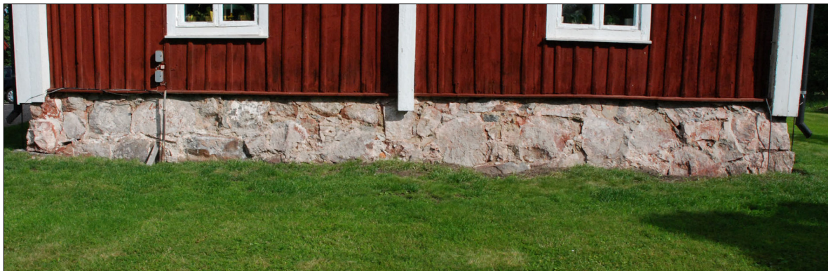
Grunden efter att putsen tagits bort.

När i princip all puts var avlägsnad visade det sig att det inte fanns så mycket Ytong som befarat, däremot fanns ett större behov av lagning än tänkt. Östra fasadens sockel var i mittsektionen i sämre skick än man trott med stora håligheter i överkant vilket lett till att huset satt sig något. Håligheterna fylldes med sten och tätades med kalkbruk. De befintliga och trasiga ventilerna var av varierande sort och tillkom vid 1978 års restaurering på uppmaning av länsstyrelsen. De ersattes med enhetliga nytillverkade med likvärdigt utseende. Grunden frilades genom att ett schakt har grävdes runt om huset, cirka 20–30 centimeter ut från fasaden. Grunden putsades med rent luftkalkbruk.