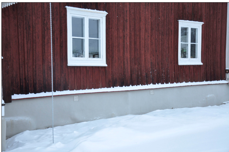
Grunden efter målning.