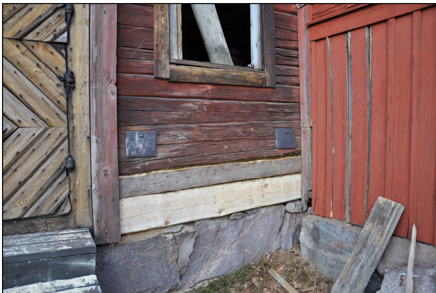
Mot söder fanns en mindre rötskada i syllen