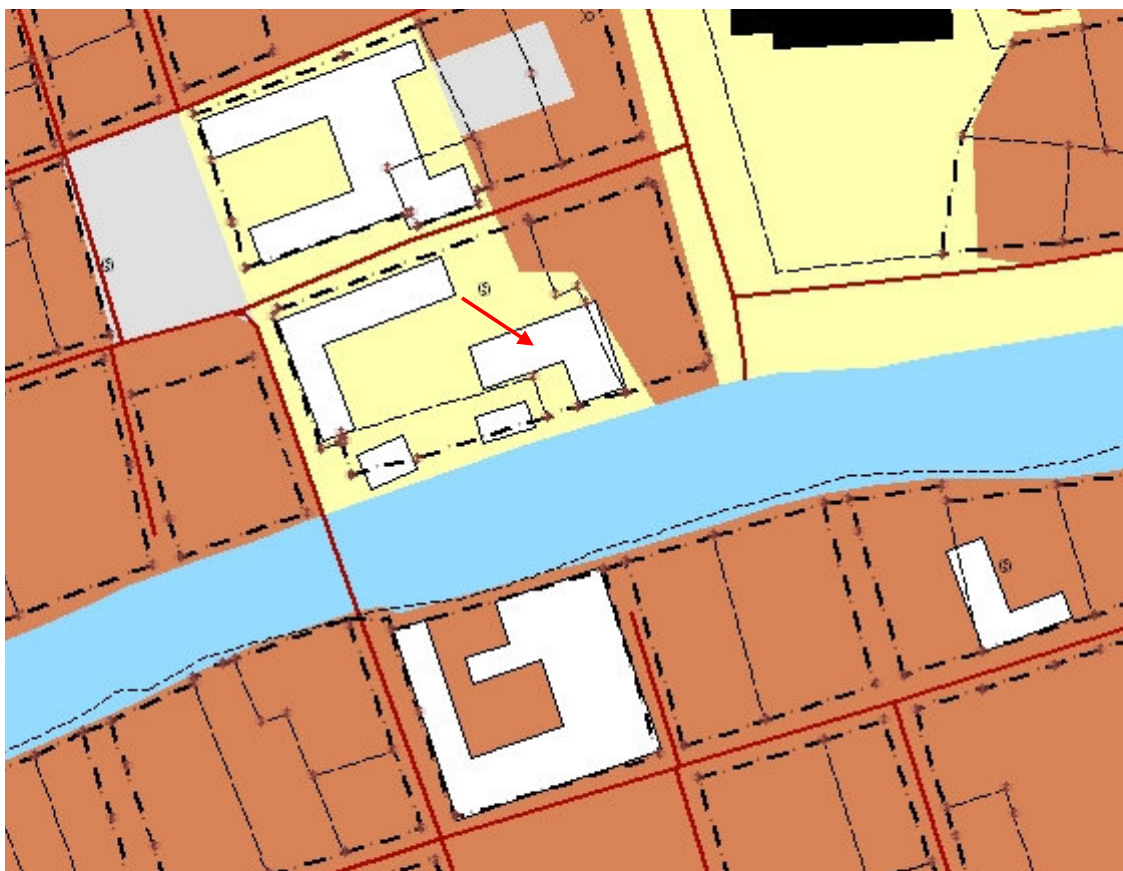
Utdrag ur digitala fastighetskartan 2004, skala 1: 2000. Den aktuella byggnaden är markerad med en pil.