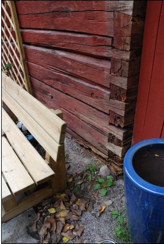
Mot grannfastigheten i öster var den laxade knutkedjan skadad.