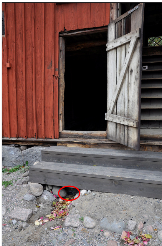
Vattnet från den norra fasaden leds genom byggnaden och ut på den södra gården.