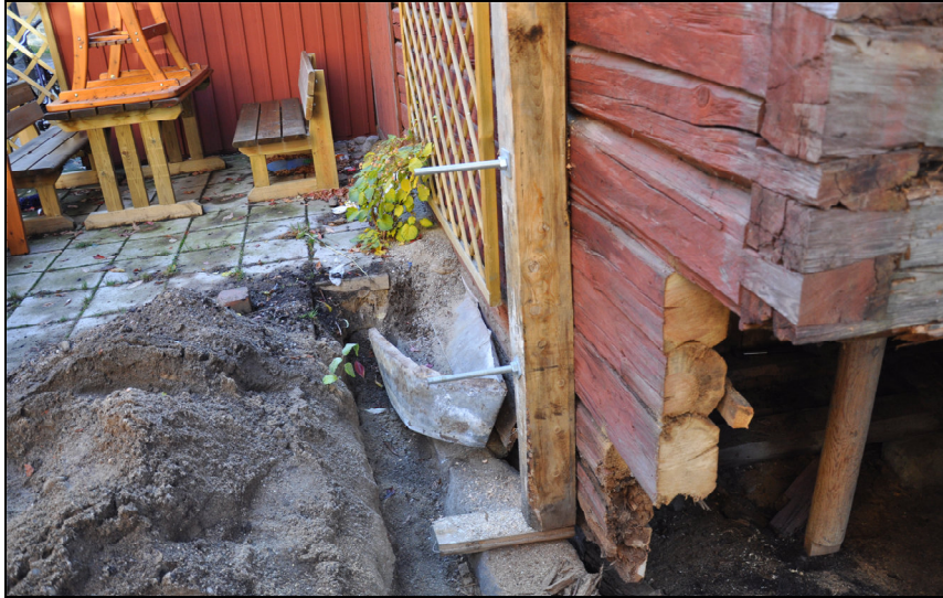
Marknivån i öster går upp till det tredje timmervarvet.