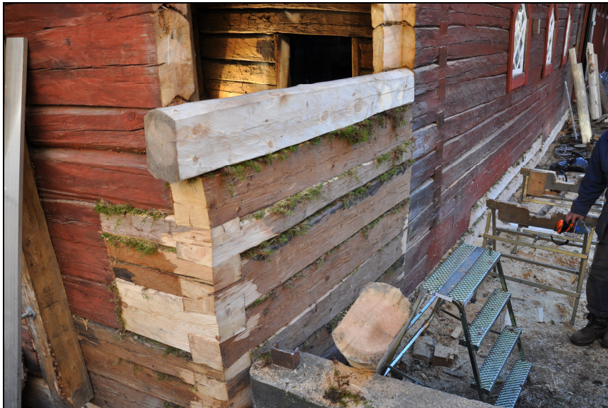
Hörnet lagades med handbilad kärnfuru och tätades med mossa.