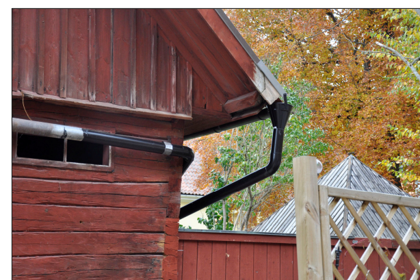
Vattnet från det östra takfallet leds runt byggnaden till stupröret i norr.