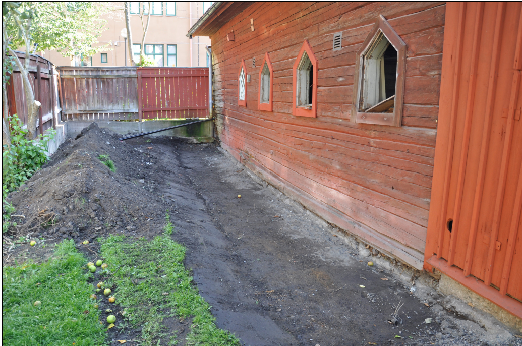
Längs med den norra fasaden grävdes marken ur så att syll och grund gick att inspektera.