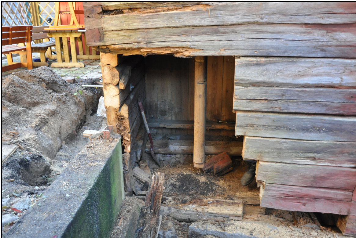
Det nordöstra hörnet under restaurering