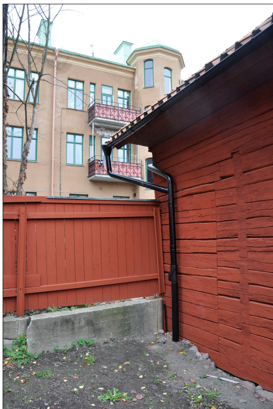
Vid byggnadens nordöstra hörn har stupröret förlängts så att det går ned i marken.