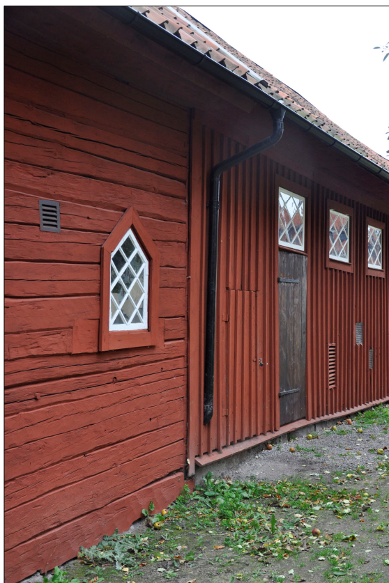
Det nya stupröret på den norra fasaden har letts in genom ett befintligt hål i fasaden.