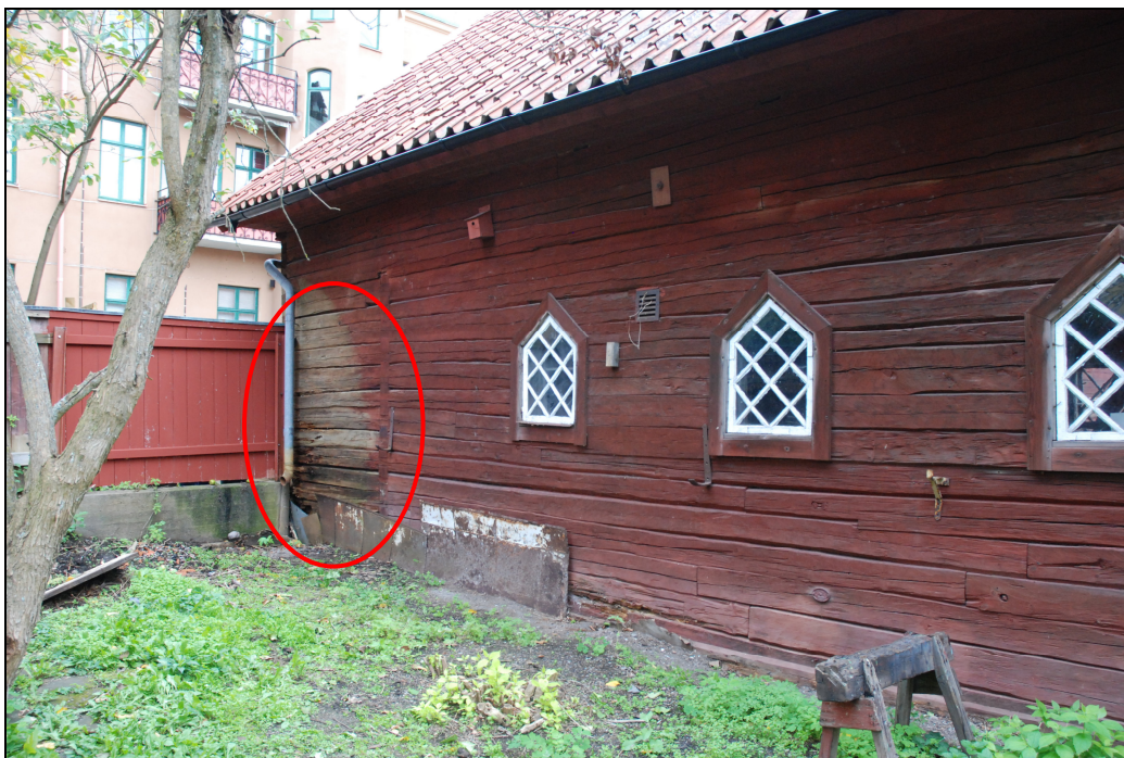
Det nordöstra hörnet var skadat på grund av bristande avvattnings.