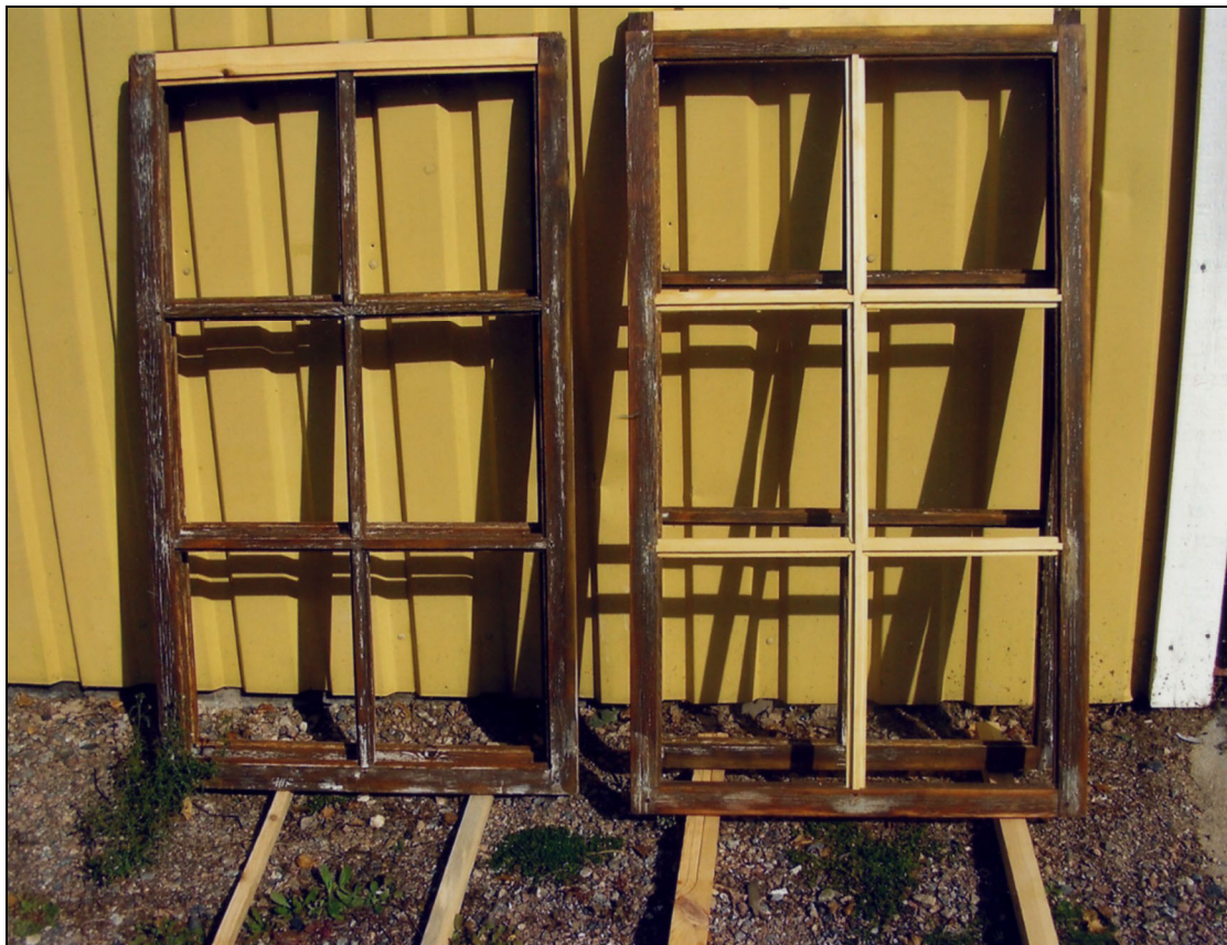
Bågar under renovering. Lagade under/överstycken och spröjs.