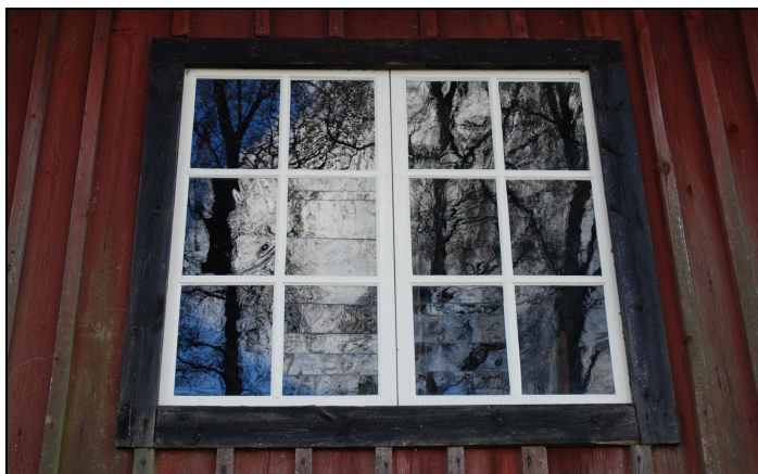
Östra fasadens fönster efter renovering. Rensor av skuret glas har återmonterats.