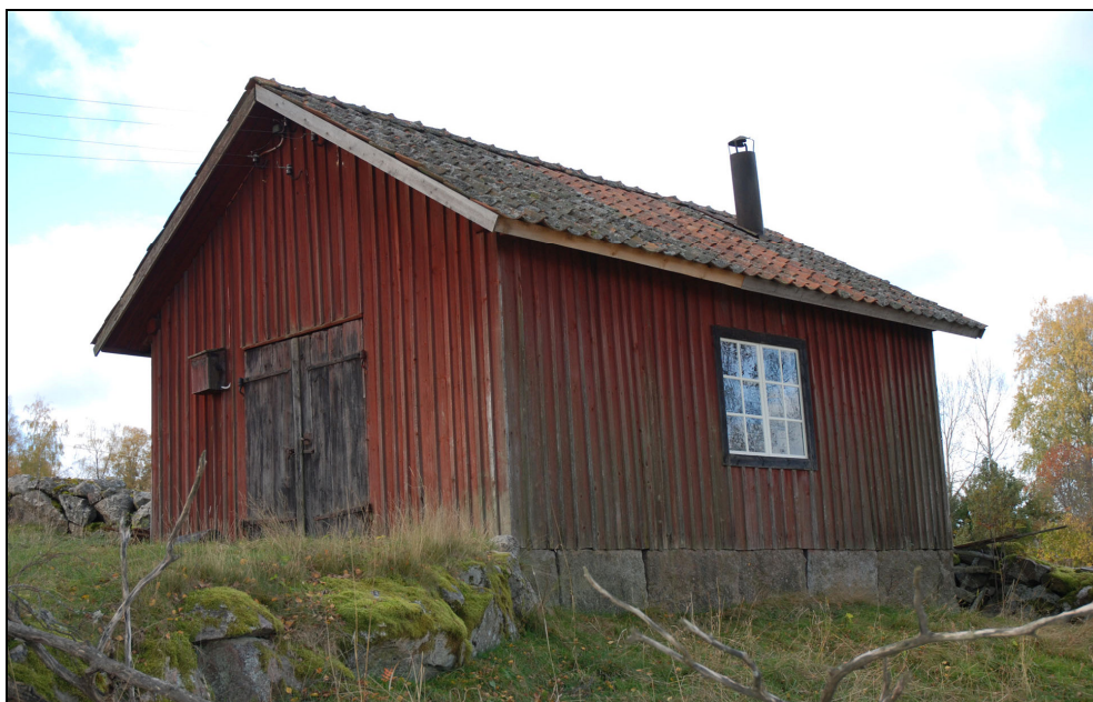
Smedjan efter renovering oktober 2010.