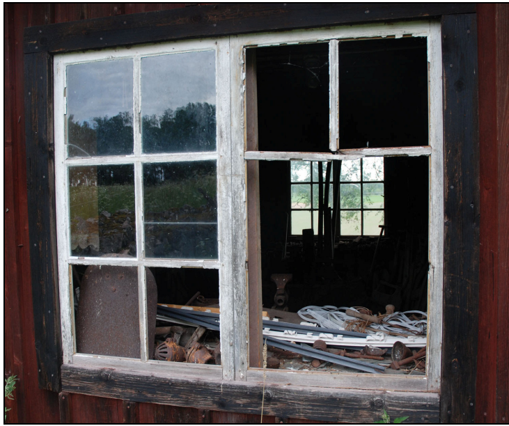
Västra fasadens fönster före renovering, höger båge i behov av nya delar och glas.