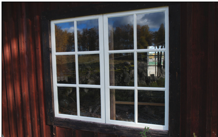
Västra fasadens fönster efter renovering.