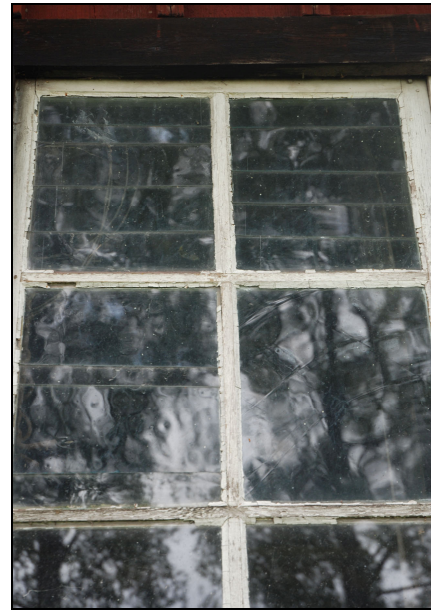
Glas skarvade med remsor av skuret glas, vänster båge på östra fasaden.