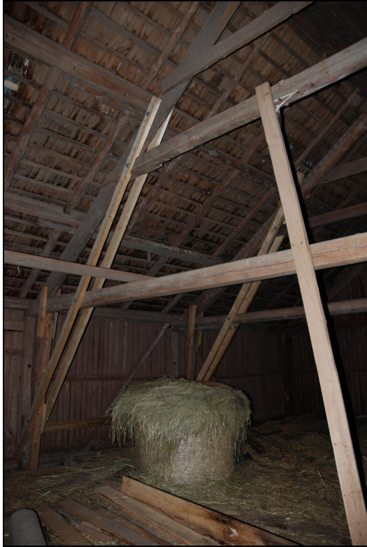
Högben och extra sträva monterad på skullen över ladugården.