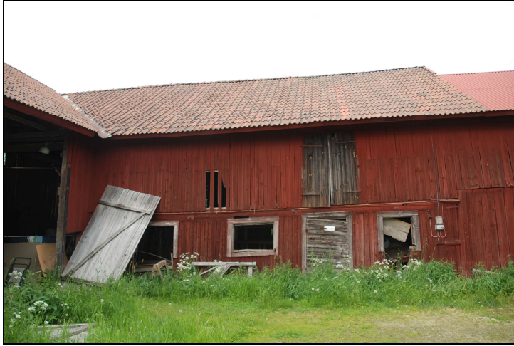
Ladugårdens södra fasad innan renovering.