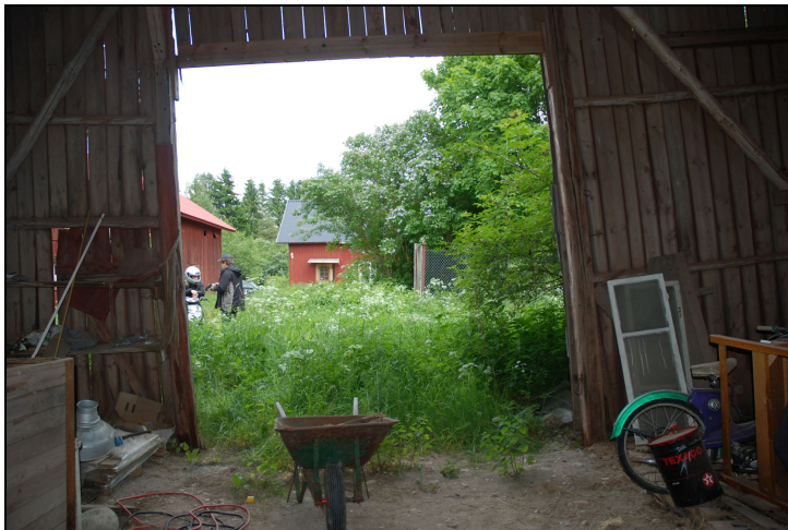
Bilden visar tydligt hur sned stommen är.