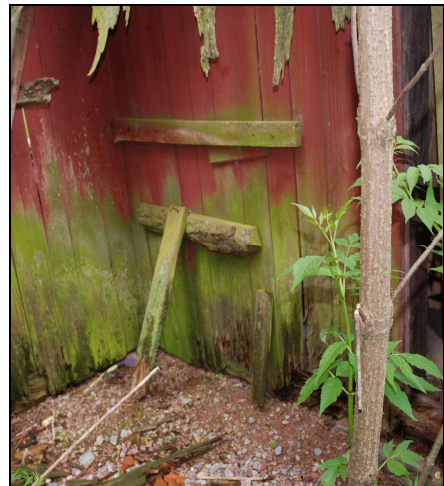
Rötskadad panel, västra fasaden.