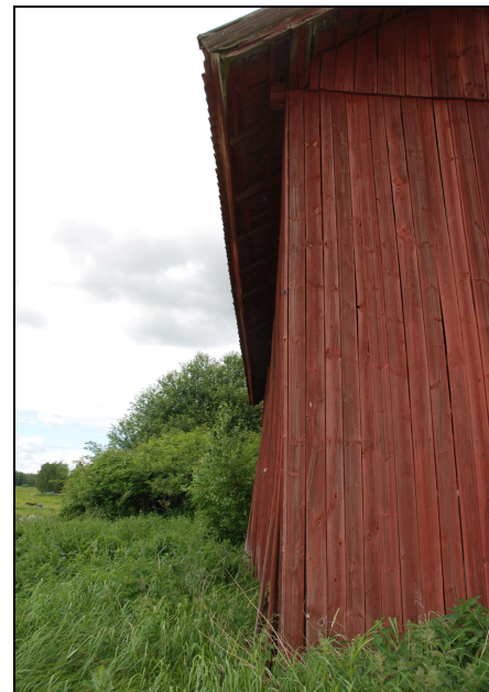
I logens vägg syns hur byggnaden kalvat.