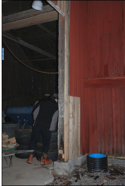
Stolpe uppriktad, plint gjuten och panel lagad.