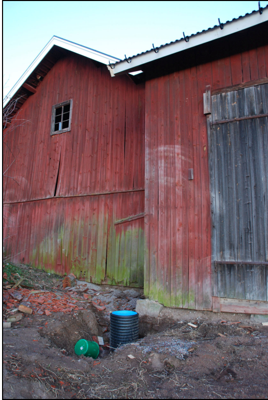
Växtlighet har röjts och dränering grävts ned.