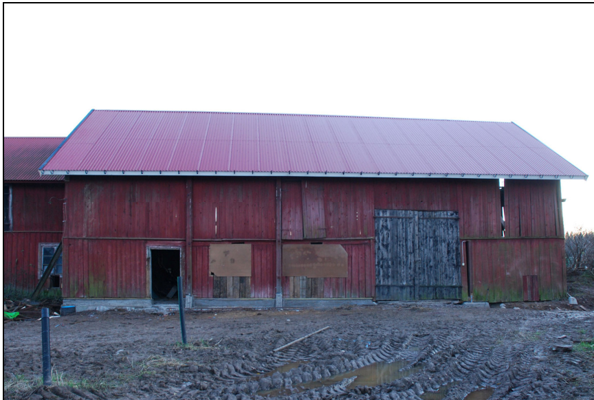
Ladugård och loge från norr

Takteglet plockades av och röd trapetskorrugerad plåt lades istället, undertak av spån behölls. Genom att lägga plåt i stället för tegel minskades vikten från taket vilket var positivt med tanke på byggnadens något bristfälliga viktfordelning. Plåten ger också viss skivverkan vilket hjälper till att staga upp och hålla mot vindkrafter. Nya vindskivor och fotbrädor monterades samt hängrännekrokar. Kring byggnaden röjdes växtlighet och marken dränerades. Invändigt bilades cementgolvet bort längs med syllen. Stommen riktades upp och rötskadade delar byttes ut. På några ställen i logen skarvades syllen. Fyra högben monterades på de ställen där extra förstärkning i stommen krävdes. På några ställen monterades även snedsträvor. Rötskadat stående timmer, under fönstren i ladugårdsdelen, ersattes med återanvänt timmer. Under ladugårdsdelen var syllen helt uttjänt och ersattes med en gjuten sula på vilken syllpapp och en planka av tryckimpregnerat virke lades. Under några stolpar i logen göts cementplintar, men de stenar som låg stabilt behölls. Rötskadad och uttjänt panel skarvades med nya bitar. Skivor har monterats över fönsteröppningar i fasaderna.