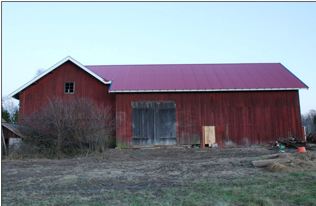
Loge från väster