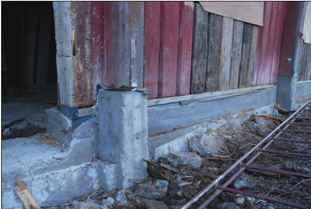
Sula under ladugårdsdelens norra vägg och nytt stående timmer under fönster.