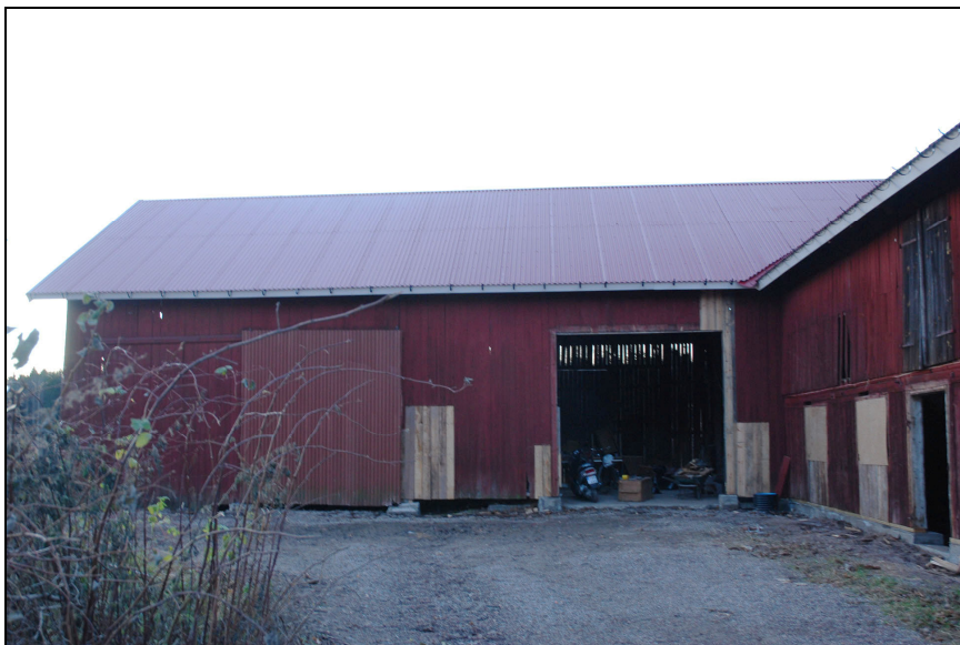
Loge från öster