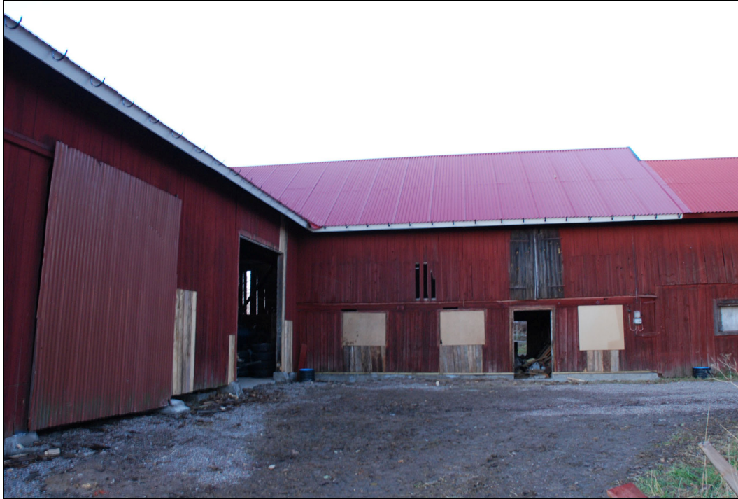
Ladugård från söder