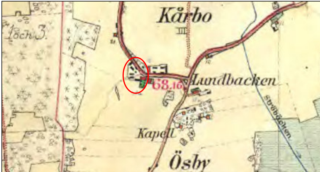
Häradsekonomiska kartan upprättad mellan åren 1905-11. Gården är inringad.