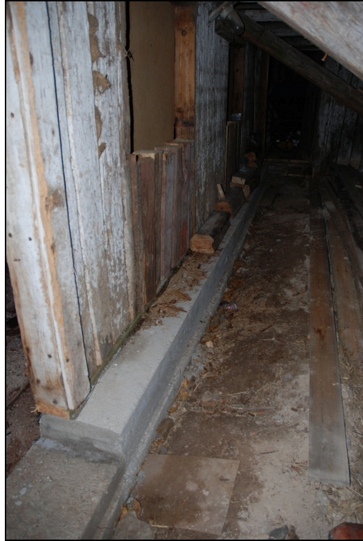
Cementgolvet har bilats bort vid väggens insida. Sula har gjutits under ladugårdsdelens väggar.