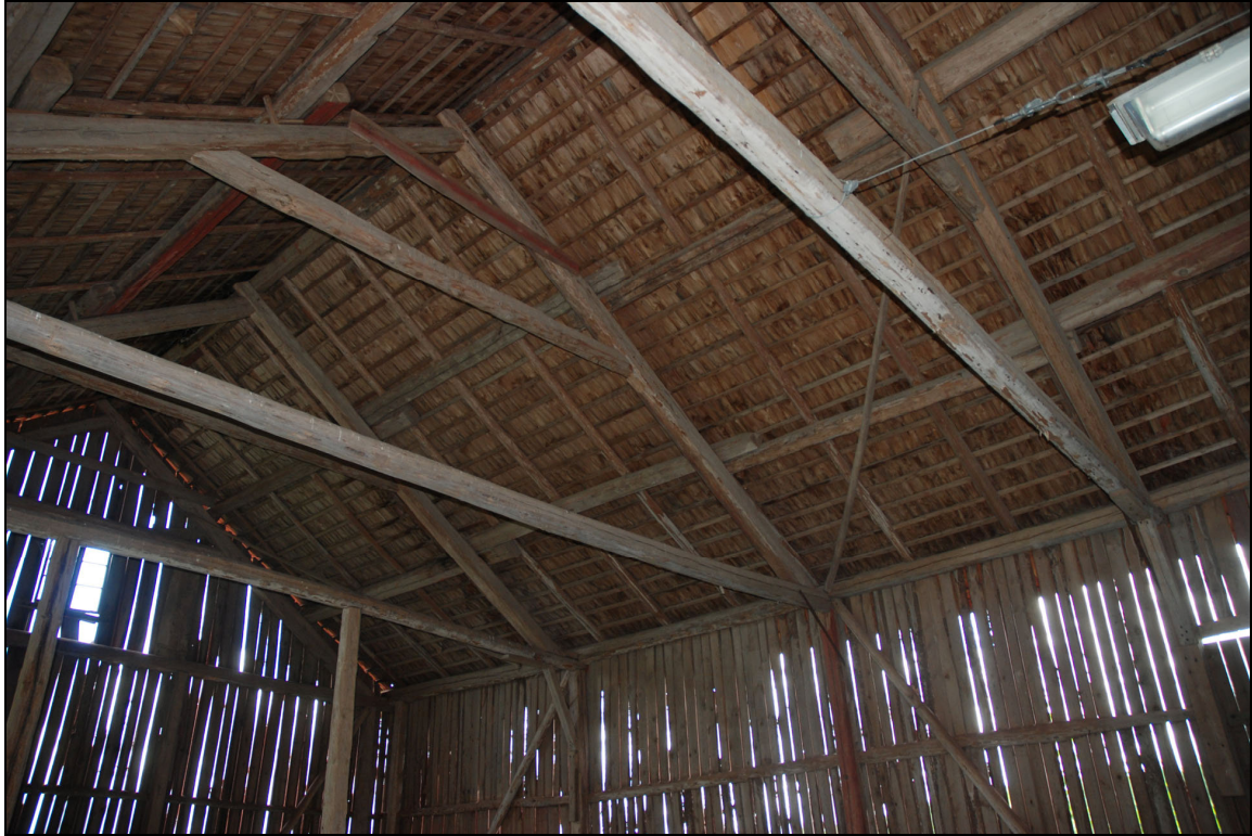
Logen invändigt, klent med stolpar och strävor i relation till byggnadens storlek, markförhållanden och vindkrafter på platsen.