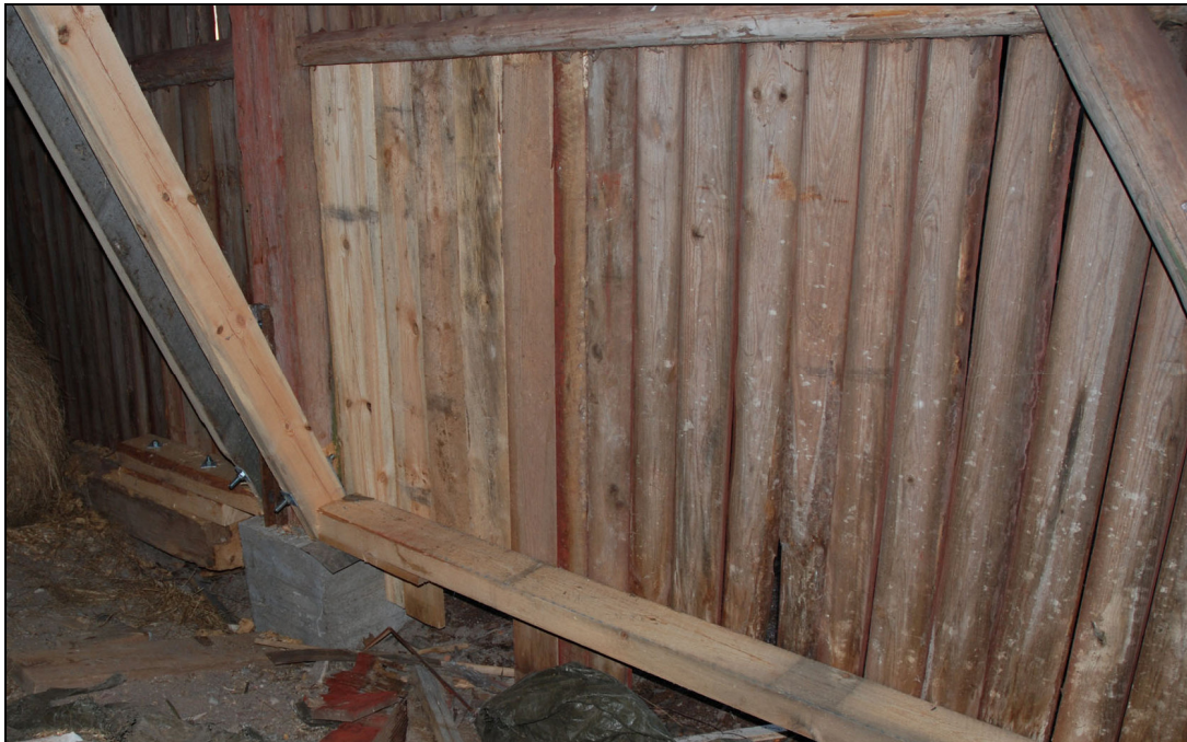
Vid logens västra fasad har syllen skarvats, plint gjutits under bärande del och ett extra högben monterats.