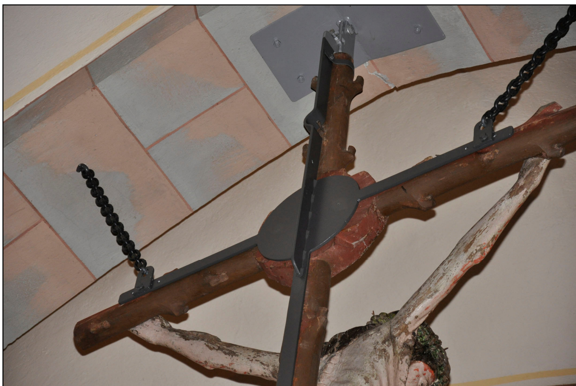
På baksidan av krucifixet är smidesbeslaget utformat som korset. Beslaget är fäst med skruvar i korsarmarna, i övrigt har ingen åverkan gjorts på krucifixet. Bildnr VLM_kmoIM-404