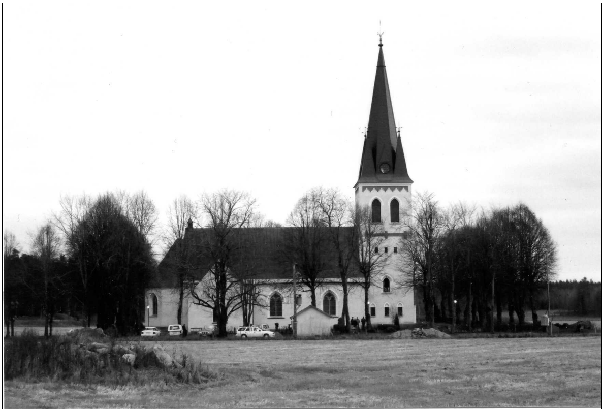
Tärna kyrka. Foto: Rolf Hammarskiöld 2000, VLM. Bildnr B 103 642:29, VLMs arkiv.

Tärna kyrka är uppförd i tydlig nygotisk stil och kyrkorummet är mycket välbevarat sedan ombyggnationen 1898.