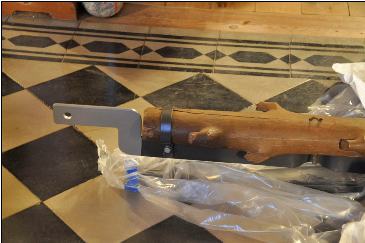
Upptill späandes smidesbeslaget fast runt korset.