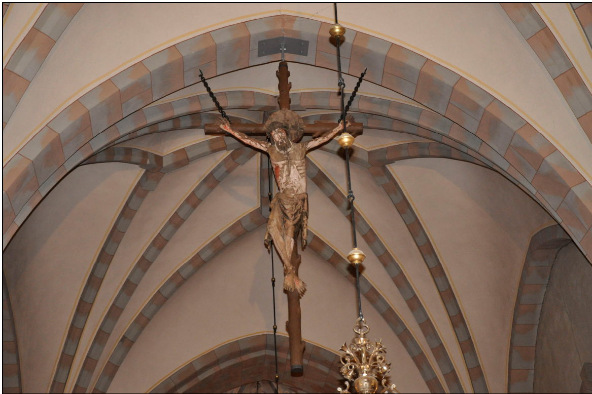
Krucifixet på plats i den andra valvbågen. Bildnr Vlm_kmoIM-402