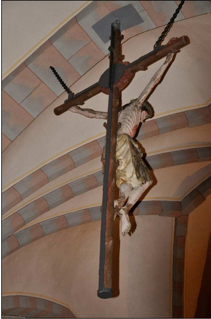
Krucifixet på plats i den andra valvbågen. Vlm_knoIM-403 till vänster, VLMS arkiv.