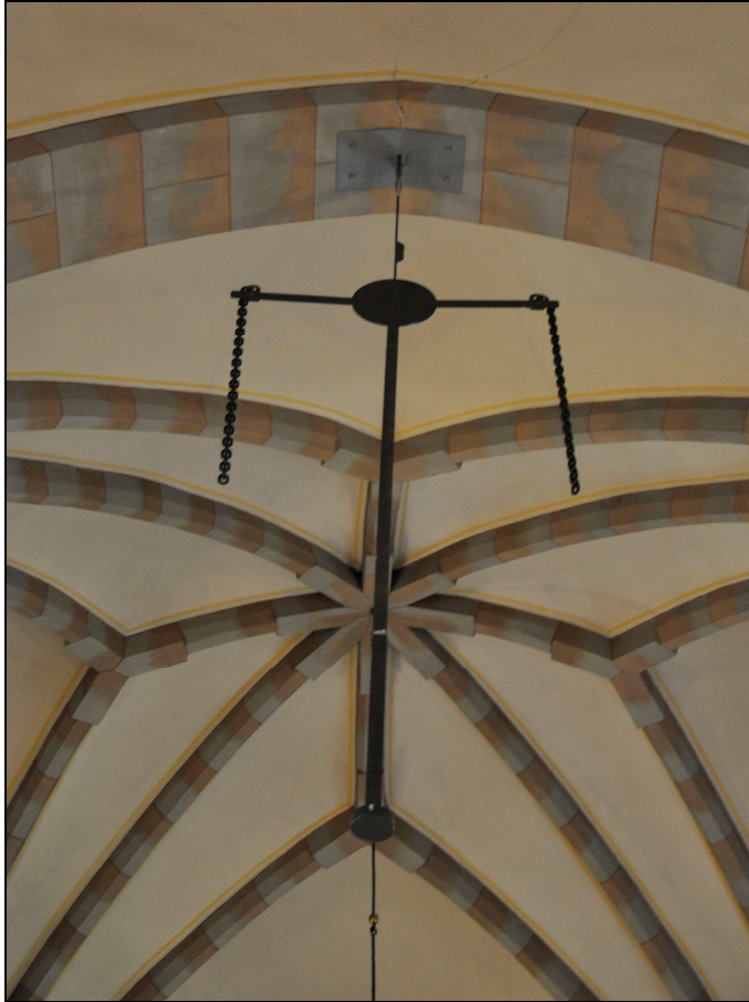
Provpupphängning av smidesbeslaget. Bildnr Vlm_kmoIM-444, VLMS arkiv.