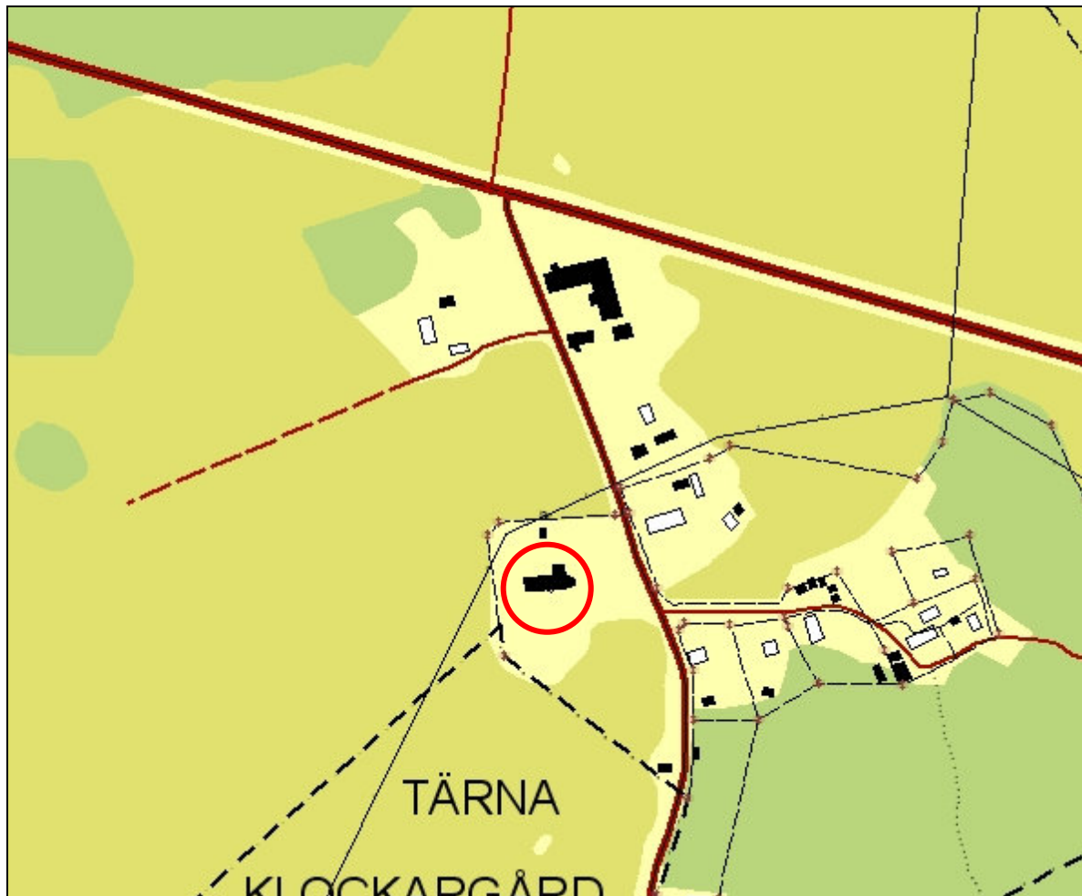
Utdrag ur digitala fastighetskartan 2004, skala 1:5 000. Tärna kyrka är inringad.

För beskrivning av triumfkrucifixet samt konserveringsåtgärder hänvisas till den separata konserveringsrapporten sammanställd av chefskonservator John Rothlind på konserveringsenheten vid Västerås kyrkliga samfällighet.