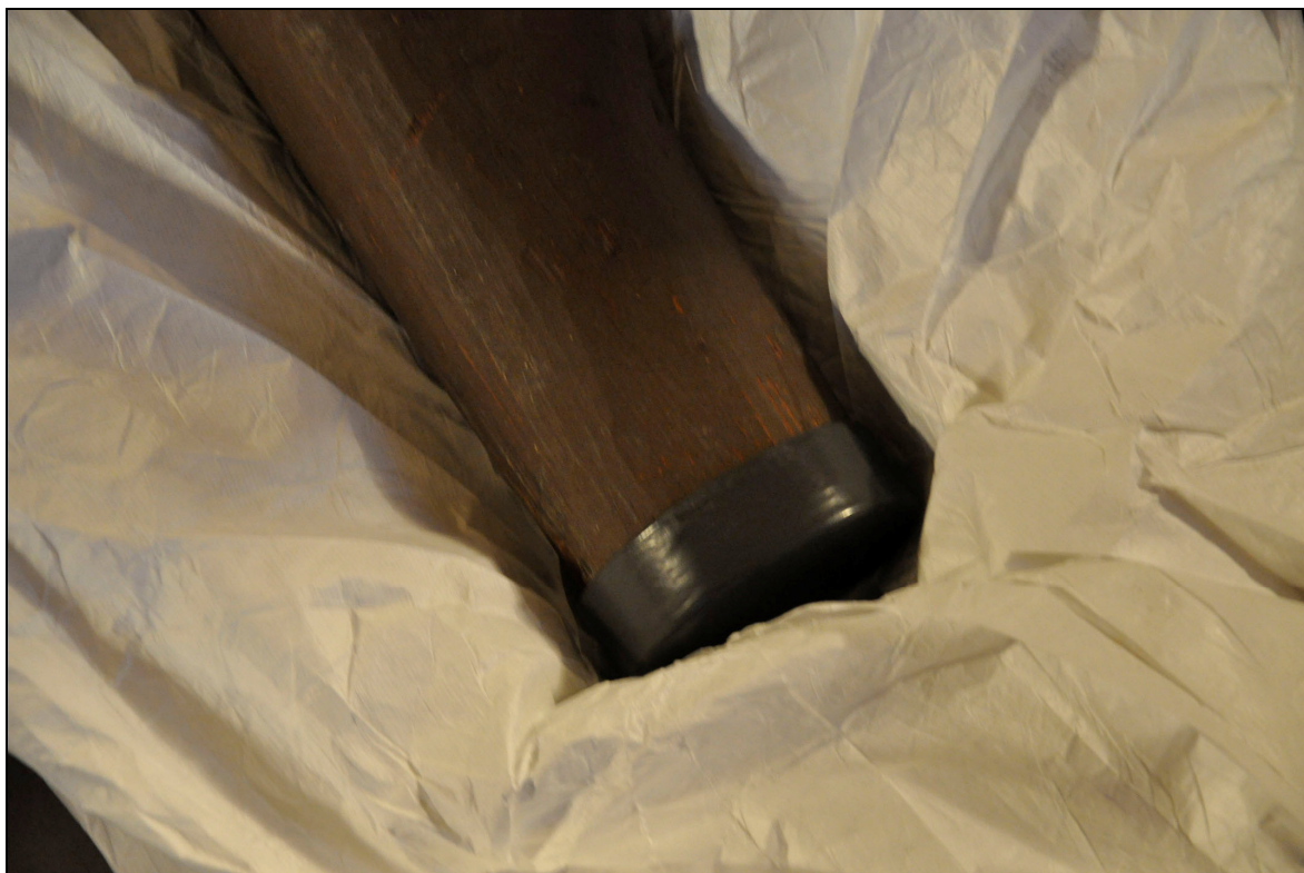
Ned till ställdes korset på en platta. Bildnr Vlm_kmoIM-432, VLMs arkiv.