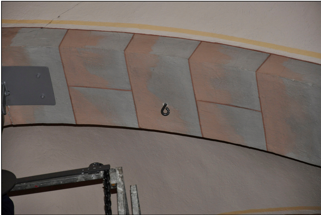
På vardera sidan om metallplattan sattes smidesöglor. Bildnr Vlm_km01M-465, VLMS arkiv.