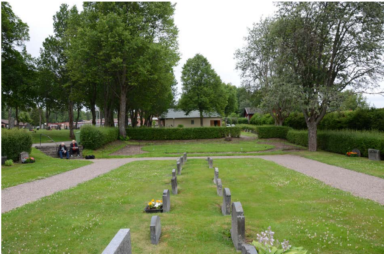
Askurnlunden under uppförandet.

Den nya askurnlunden är belägen i den yngre delen av begravningsplatsen. Den avskärmas på tre sidor av en häck och på den fjärde av en grusad gång. Placeringen blir avskild men bildar en tydlig årsring i kyrkogårdens historia. Utformningen har anpassats till omgivande kvarter. Urnlunden har uppförts i material av god kvalitet och som ska harmonisera med den övriga kyrkogården. Askurnlunden har en rund form och har två grusade entréer, en från söder och bårhuset och en från norr. Rundeln är belagd med gräs och fungerar som en gångyta från vilken två stenlagda gångstråk leder till cirkelrunda ytor med sittbänkar. Gräsytan omgärdas av en ca 1 meter bred yta där planteringar och minnesstenar i grå granit med namnskyltar placeras. Här har även två vattenspel placerats. Befintlig häck har bevarats och skapar en avskild miljö.