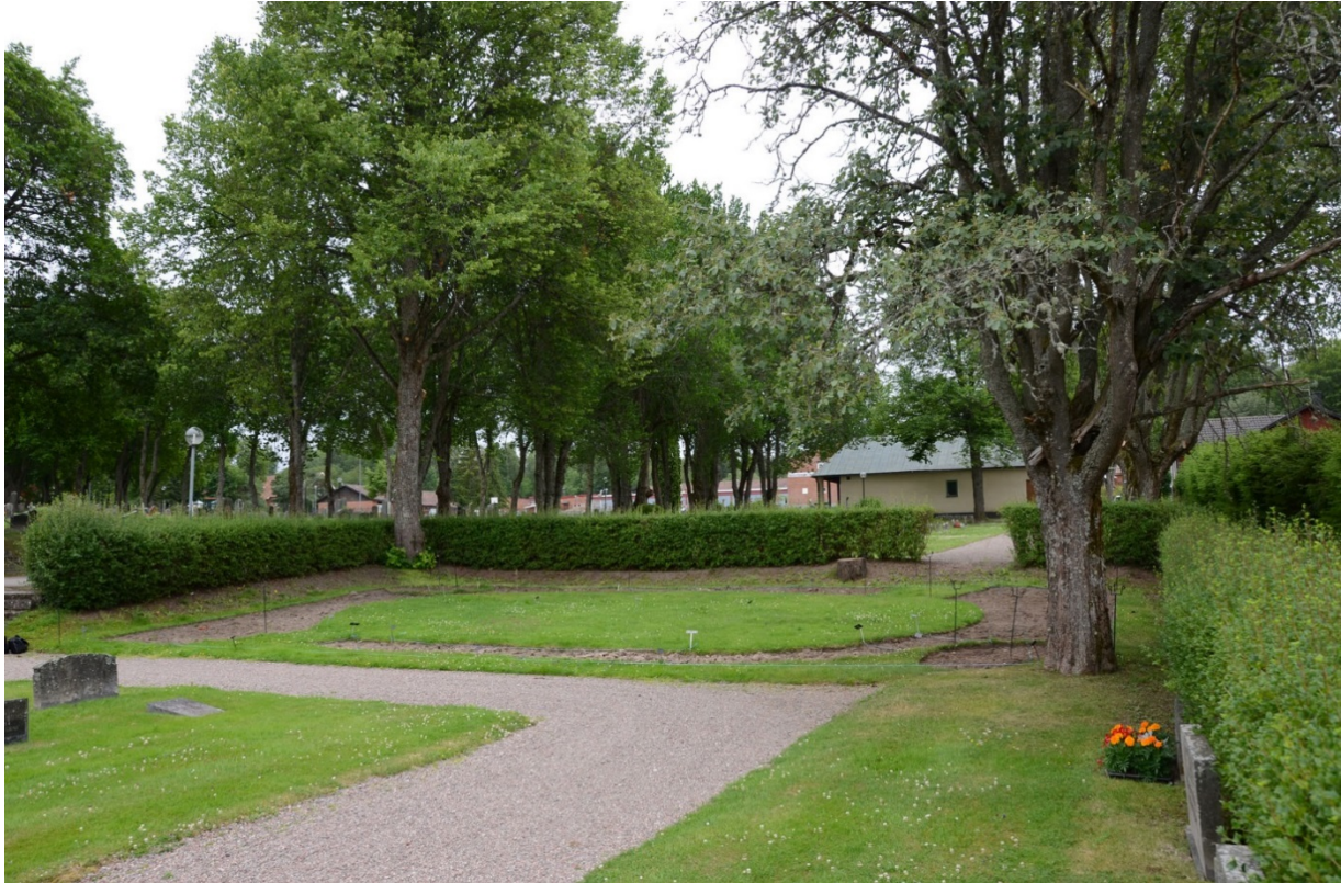
Askurnlunden med gravkapellet i bakgrunden.