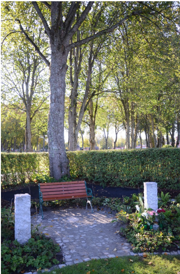
Cirklruna ytor med sittplatser.