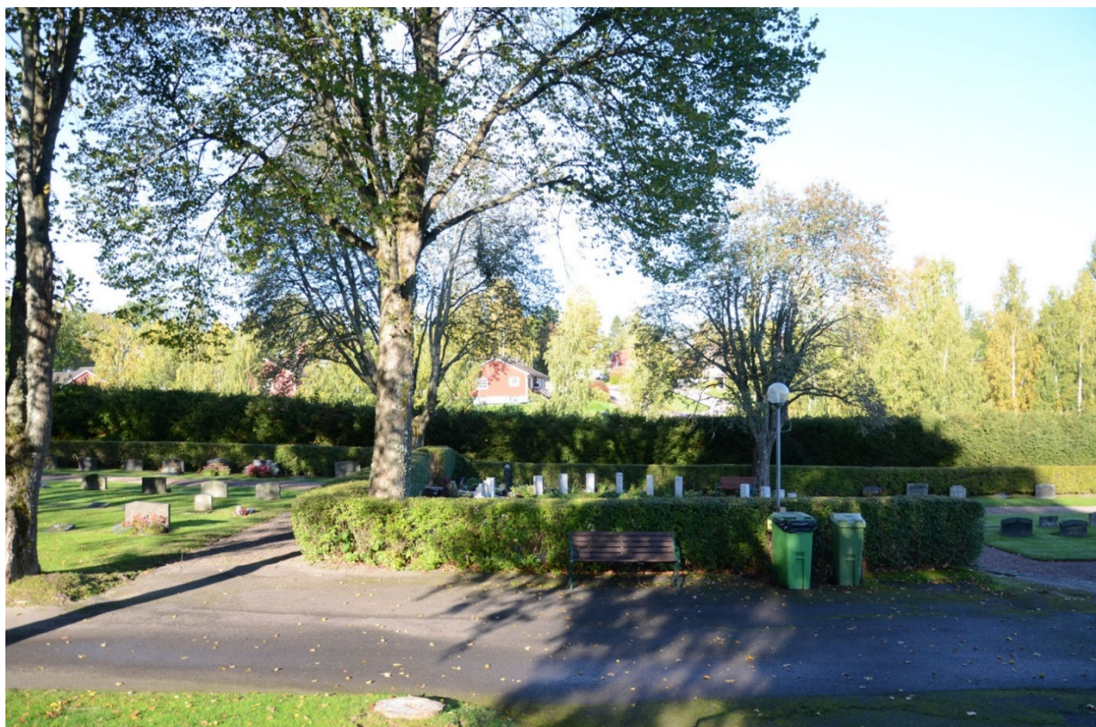
De äldre häckarna är bevarade och skapar avskildhet.