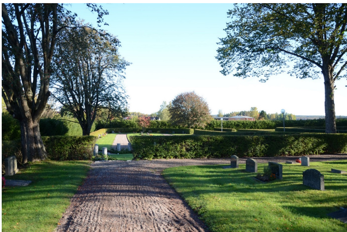
Askurnlunden sedd från söder.