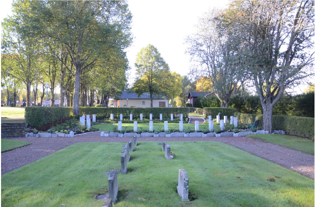
Askurnlunden vid färdigställandet.