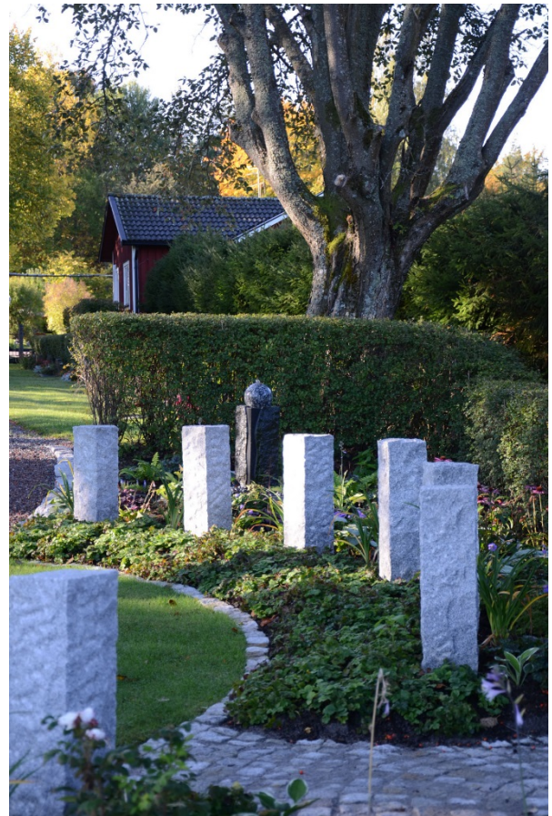
Vattenspel har placerats mellan minnesstenarna