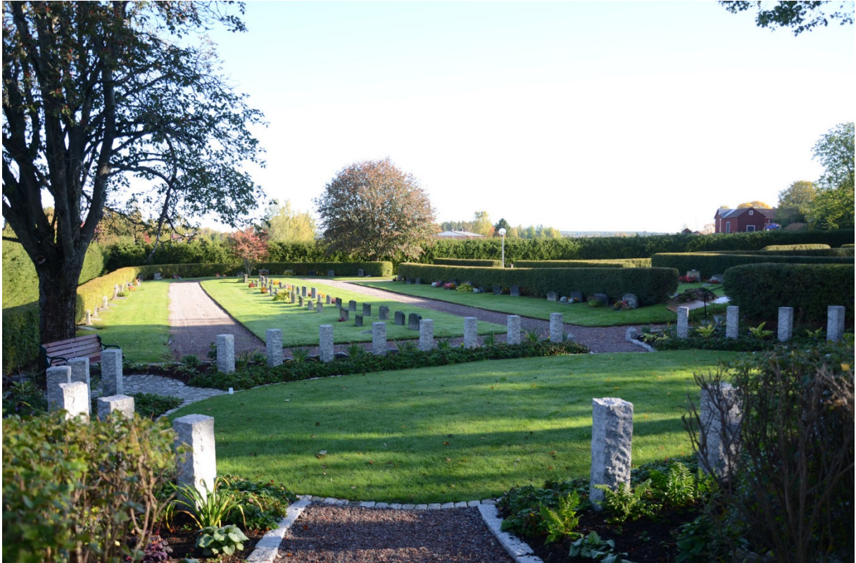
Askurnlunden med den gräsbelagda ytan.