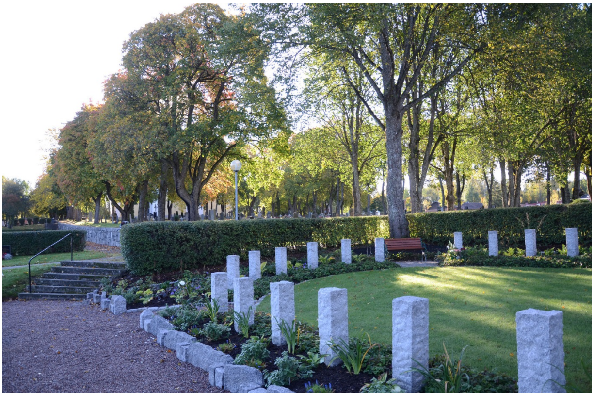
Grusgång leder in till askurnlunden.