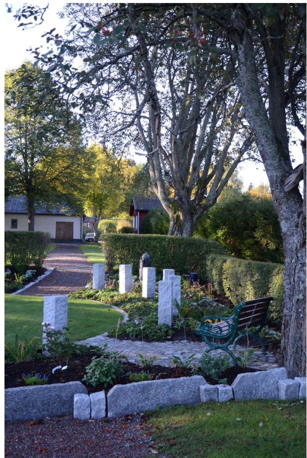
Samma vy efter iordningställandet.