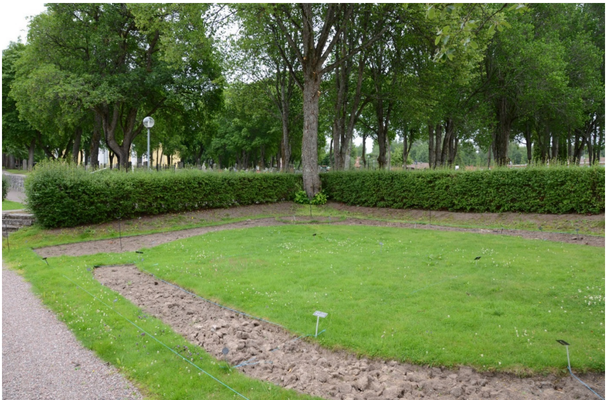
Askurnlunden mot sydväst.