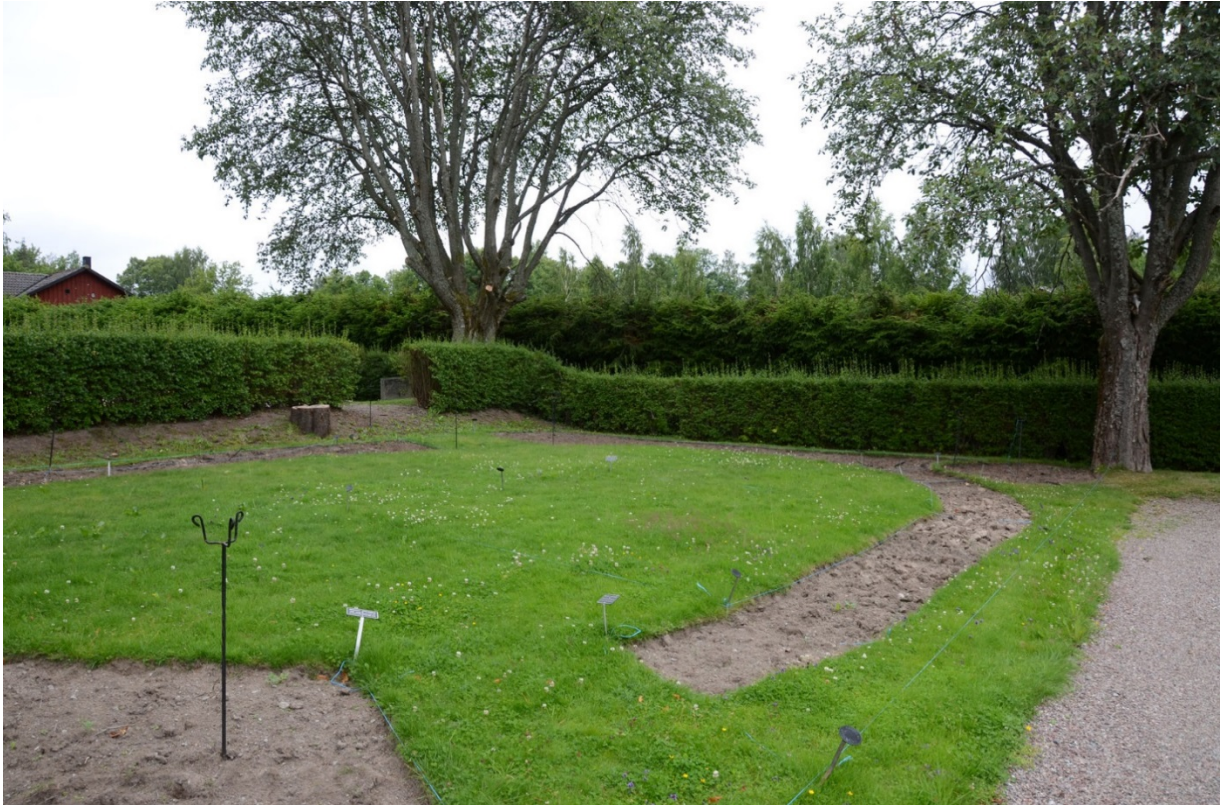
Askurlunden mot sydväst.