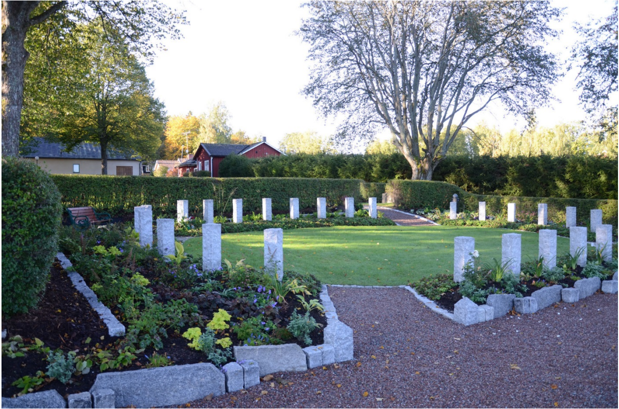
Askurlunden är omgärdad av sten.