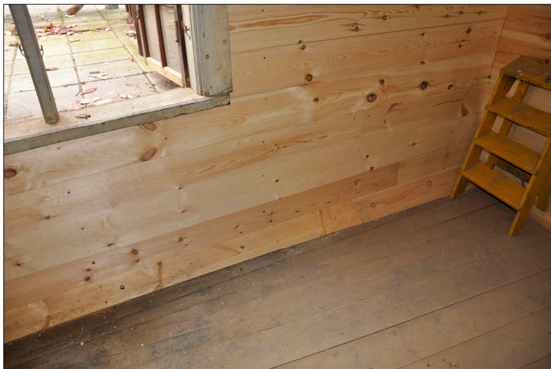
Den nedersta panelbrädan vinklades utåt samt förseddes med hål för att främja luftväxling och minska risken för nya rötskador.