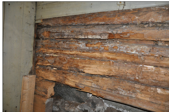
Stockarna var kraftigt rötskadade flera timmervarv upp på fasaden.