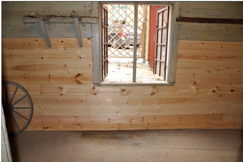
Väggen kläddes invändigt med ny panel.