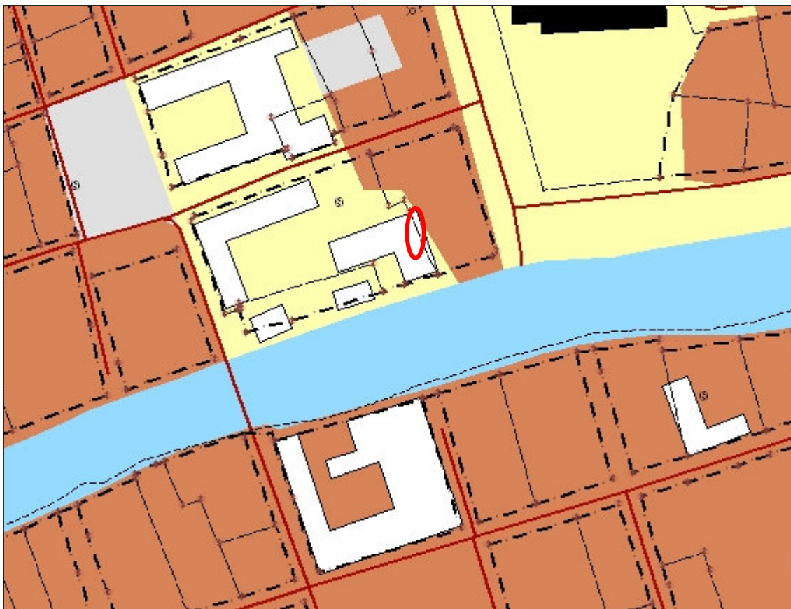
Utdrag ur digitala fastighetskartan 2004, skala 1: 2000. Det aktuella partiet är markerat med en ring.