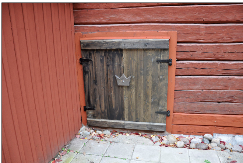
En nya fönsterlucka tillverkades.