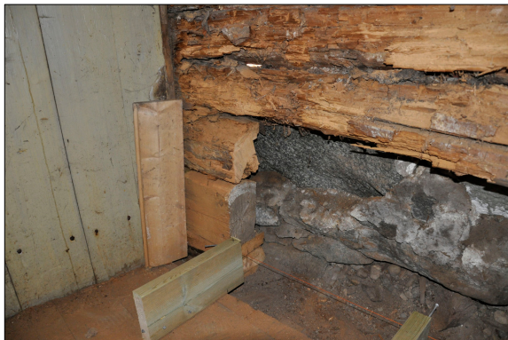
När de rötskadade stockarna tagits bort syntes den murade delen av den nya marknivån på grannfastigheten.

Upprustningen av uthuslängan påbörjades under 2009 och i samband med dessa upptäcktes att den höga marknivån på grannfastigheten hade orsakat omfattande rötskador på väggen till sadelkammaren.