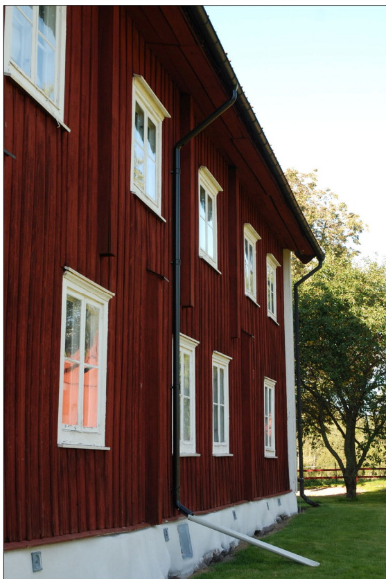
Det moderna stupröret var placerat centralt på den östra fasaden.