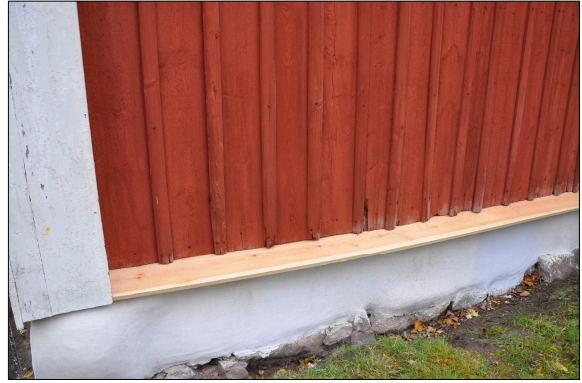
Den nya vattbrädan lämnades omålad 2009 på grund av hög fukthalt i träet.