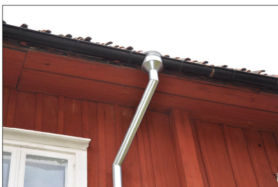
Den övre delen av det nya stupröret.