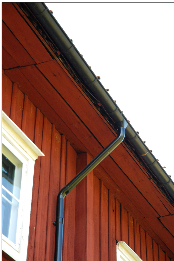
Den övre delen av stupröret.