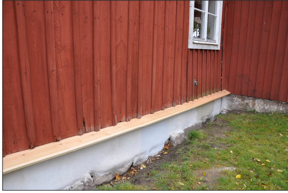
Vattbrädan tillverkades i högkvalitativ furu.