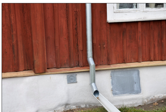
Den nedre delen av det nya stupröret.

Den nya vattbrädan tillverkades i högkvalitativ furu. Den är sex tum bred på alla fasader utom den södra där den gjordes bredare, åtta tum, eftersom grunden skjuter ut något mer än på övriga fasader. Ändringen gjordes i samråd med antikvarisk kontrollant. Bytet av vattbräda skedde hösten 2009 men eftersom målaren ansåg att fukthalten i träet var alltför hög skedde målningen först 2010.