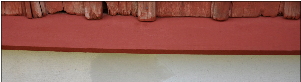
Vattbrädan målades med Falu rödfärg 2010.