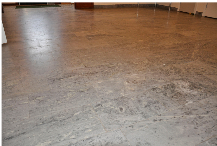
Bild 69. Marmorgolv i entréhallen. Bildnr Vlm_kmvMM-142