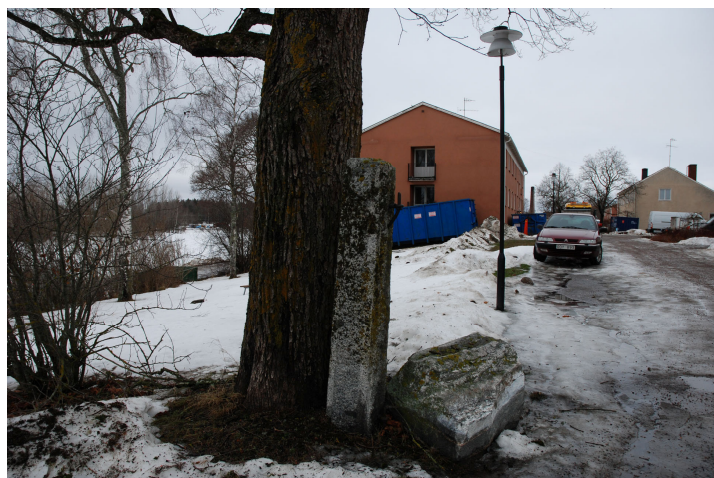
Bild 18. Björkgården från söder. Äldre grindstolpe i huggen granit. Bildnr Vlm_kmvLS-990