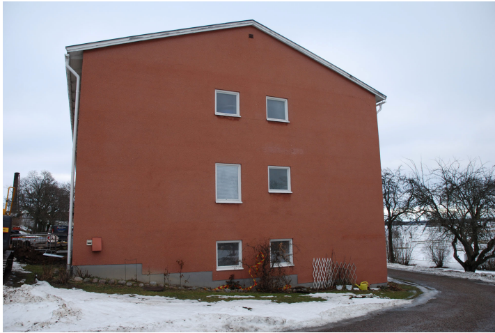
Bild 37. Lindgården åt öster. Bildnr Vlm_kmvLS-1032