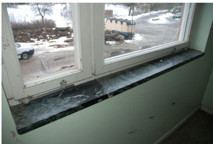
Bild 42. Detalj av fönster och fönsterbänk av marmor. Bildnr Vlm_kmvLS-1020