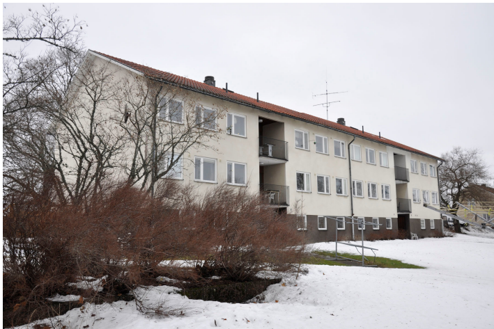
Bild 8. Aspården från sydost. Bildnr Vlm_kmvMM-158