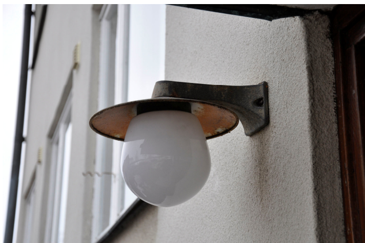
Bild 12. Utvändig belysningsarmatur av opalglas och koppar vid västra entrén. Bildnr Vlm_kmvMM-188