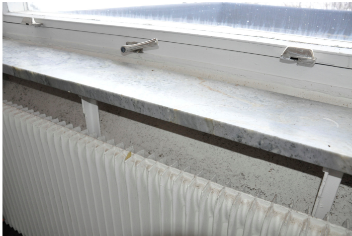
Bild 68. Detalj av fönster, fönsterbänk av marmor och radiator. Bildnr Vlm_kmvMM-146