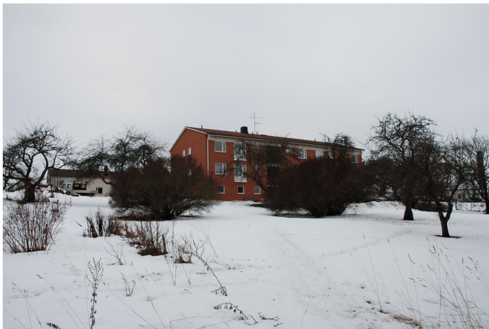
Bild 5. Del av den gamla fruktträdgården öster om Lindgården. Bildnr Vlm_kmvLS-1005