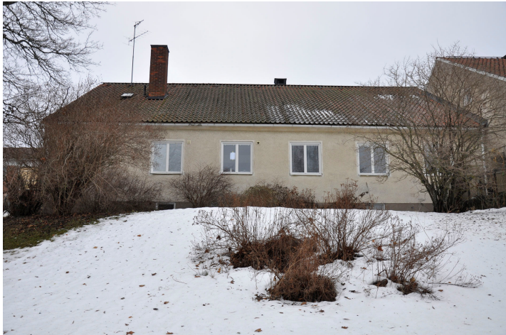
Bild 20. Lönngården, fasad åt öster. Bildnr Vlm_kmvMM-197