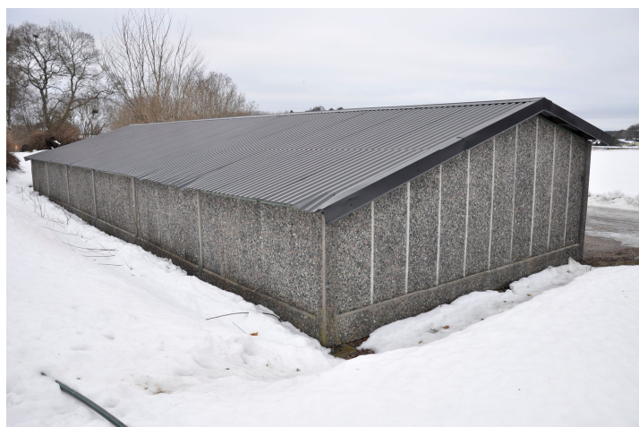
Bild 26. Garaget från nordost. Bildnr Vlm_kmvMM-238