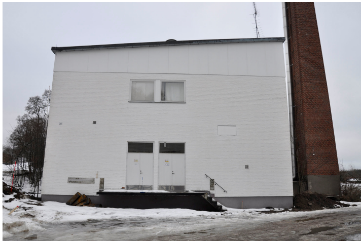
Bild 55. Panncentralen från norr. Bildnr Vlm_kmvMM-119