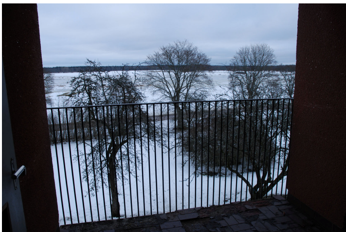
Bild 39. Vädblingsbalkong åt öster. Bildnr Vlm_kmvLS-1028