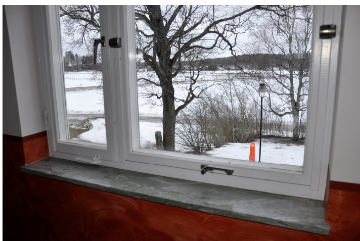
Bild 15. Trapphusfönster med fönsterbänk av marmor. Bildnr Vlm_kmvMM-177