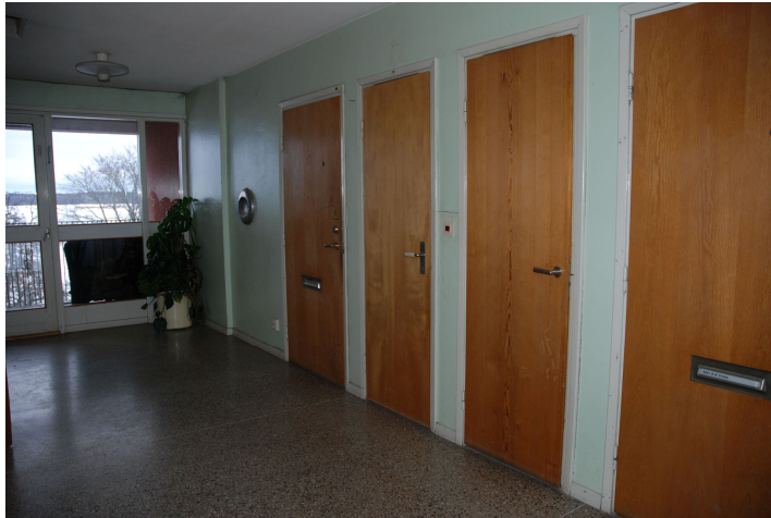
Bild 40. Trapphus med dörr till vädringsbalkong åt öster. Bildnr Vlm_kmvLS-1017