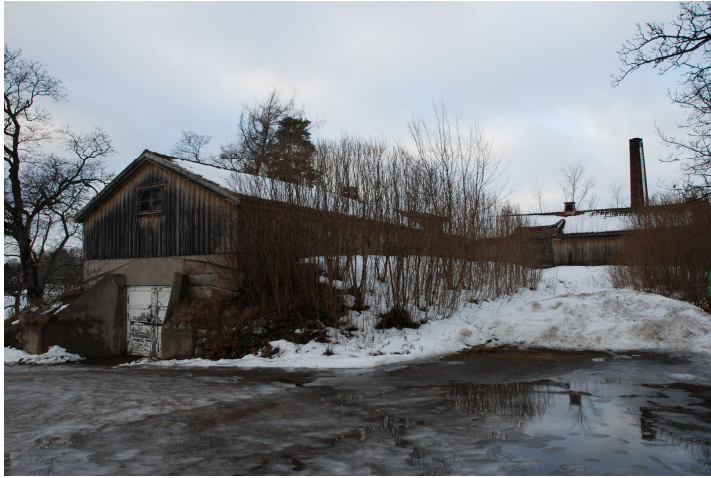
Bild 43. Jordkällaren från sydost. Bildnr Vlm_kmvLS-1045