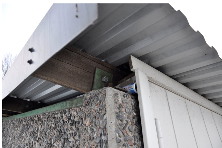
Bild 27. Garaget har väggar av betongelement med frilagd ballast och korrugerat plåttak. Bildnr Vlm_kmvMM-244