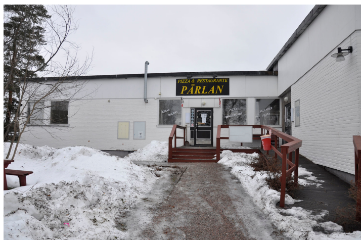
Bild 53. Panncentralen från söder med lastbrygga. Bildnr Vlm_kmvMM-72