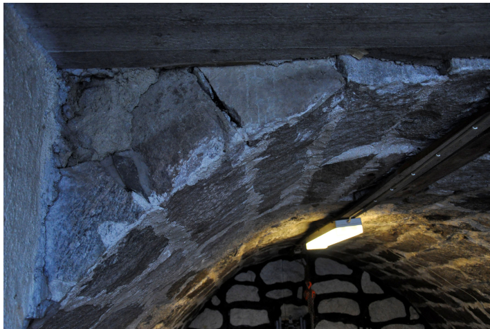
Bild 50. Detalj av källarvalvet åt söder. Bildnr Vlm_kmvMM-54