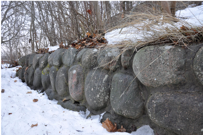
Bild 1. Stödmur norr om jordkällaren. Bildnr Vlm_kmvMM-62