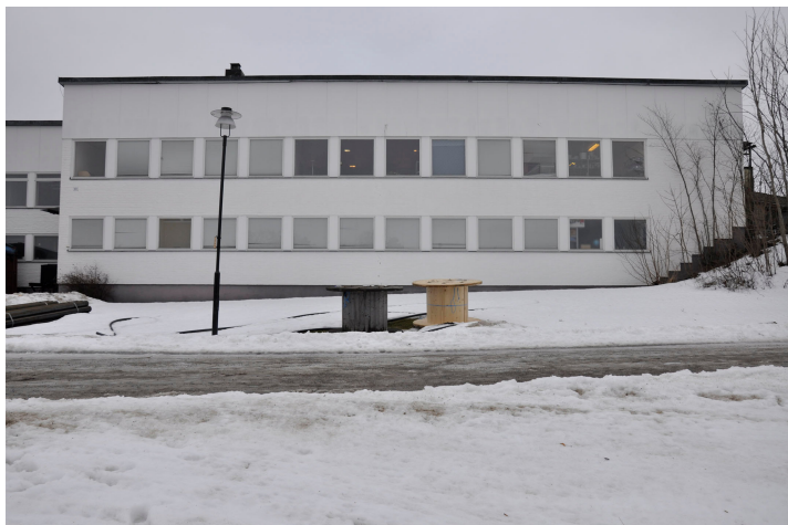
Bild 56. Panncentralen från väster. Bildnr Vlm_kmvMM-126