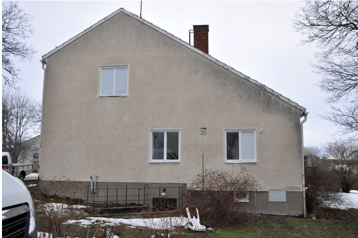
Bild 19. Lönngården, fasad åt söder. Bildnr Vlm_kmvMM-191