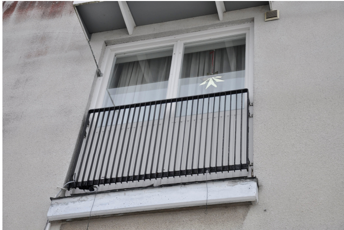
Bild 31. Fransk balkong på nordfasaden. Bildnr Vlm_kmvMM-216