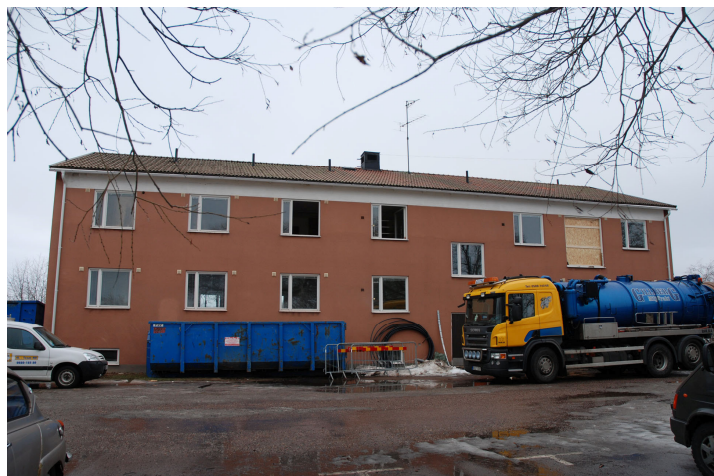
Bild 17. Björkgården från öster. Bildnr Vlm_kmvLS-985