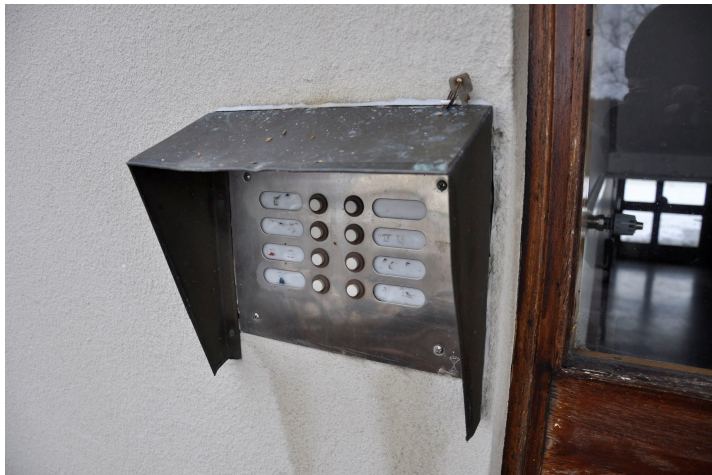
Bild 11. Ringklocka vid västra entrén. Bildnr Vlm_kmvMM-168