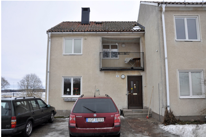
Bild 23. Västra fasaden på den förskjutna byggnadskroppen i norr. Bildnr Vlm_kmvMM-207