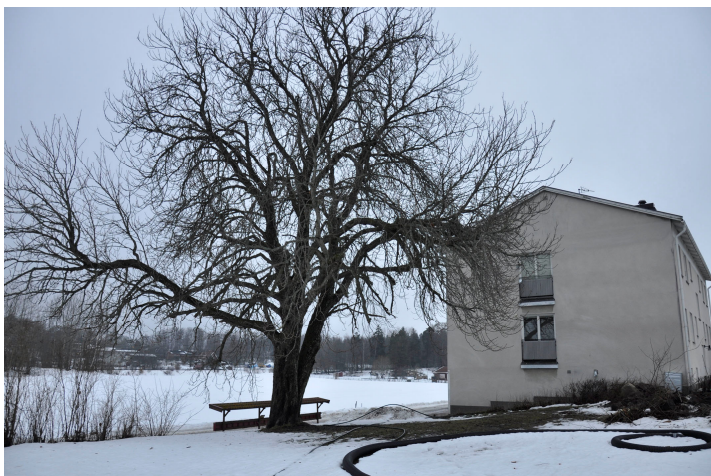
Bild 3. Kastanjetråd söder om Kastanjegården. Bildnr Vlm_kmvMM-30