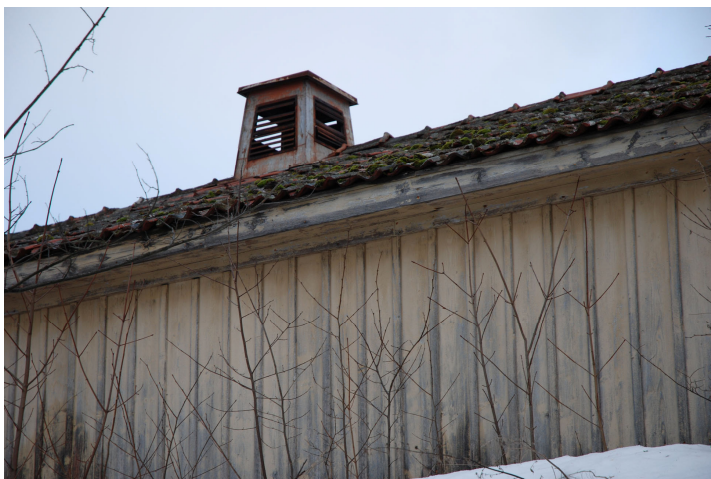
Bild 48. Detalj av fasad, tak och ventilationshuv. Bildnr Vlm_kmvLS-1060