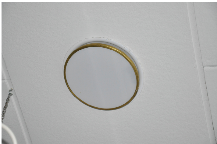
Bild 66. Belysningsarmatur i opalglas med mässingskant i matsalen. Bildnr Vlm_kmvMM-139