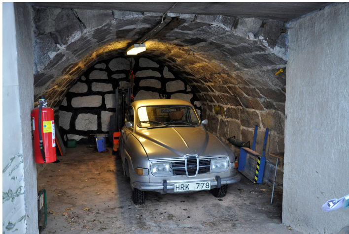
Bild 49. Källarvalv åt söder. Bildnr Vlm_kmvMM-52