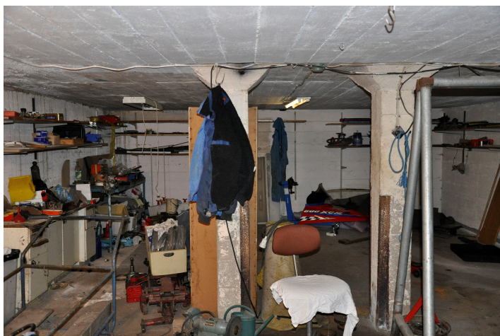
Bild 51. Källarutrymme med ingång från väster. Bildnr Vlm_kmvMM-57