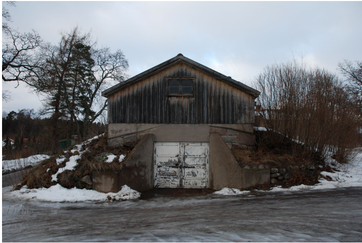
Bild 46. Jordkällaren från söder. Bildnr Vlm_kmvLS-1044