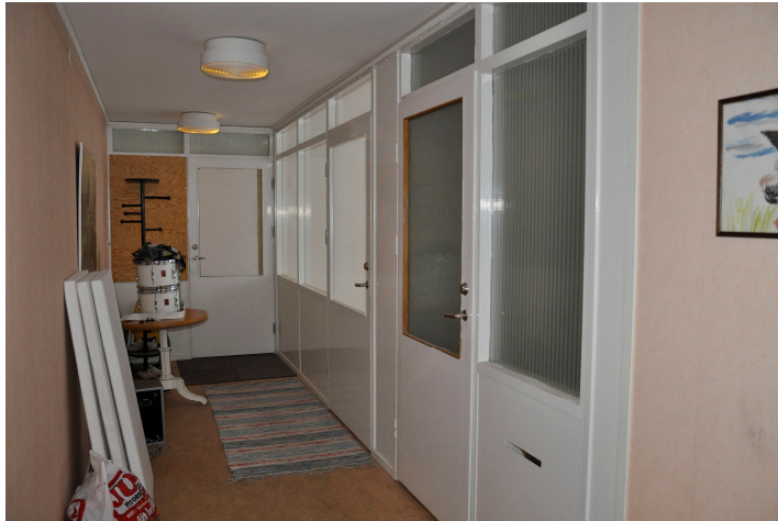
Bild 67. Korridor med f d kontorsrum. Uppglasade väggar och dörrar med etsat glas. Bildnr Vlm_kmvMM-146