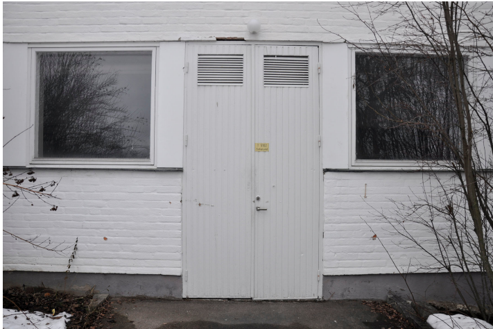
Bild 59. Entré åt öster till maskinrummet. Bildnr Vlm_kmvMM-83