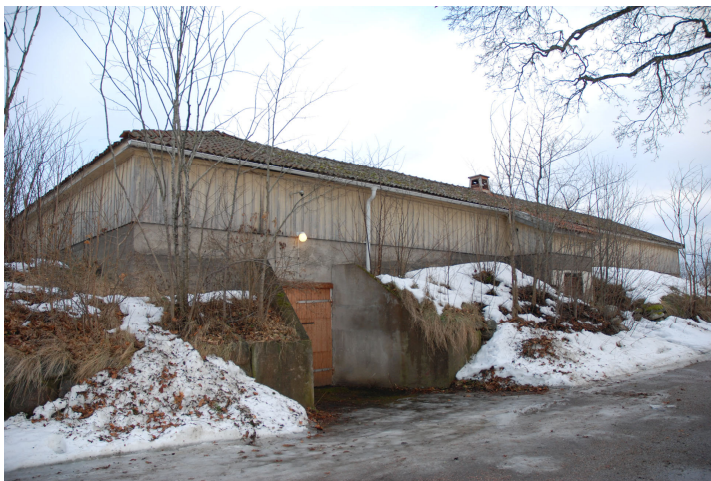
Bild 45. Jordkällaren från nordväst. Bildnr Vlm_kmvLS-1059