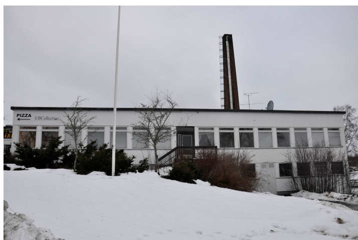
Bild 54. Panncentralen från öster. Bildnr Vlm_kmvMM-81