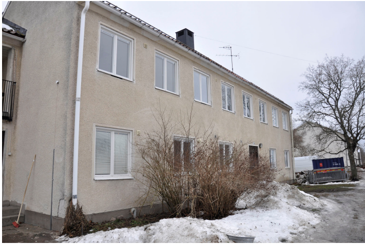
Bild 22. Västra fasaden. Bildnr Vlm_kmvMM-208