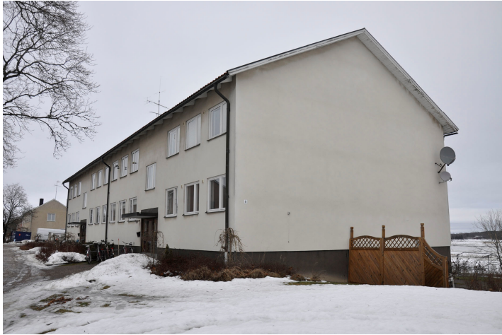
Bild 7. Aspården från sydväst. Bildnr Vlm_kmvMM-156