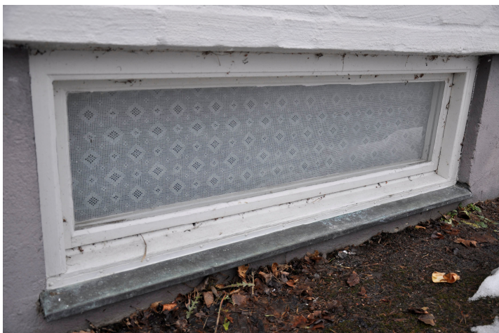
Bild 60. Källarfönster åt söder. Bildnr Vlm_kmvMM-68