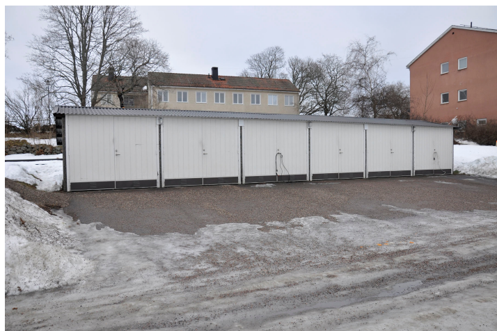
Bild 25. Garaget söder om Lönngården sedd från väster. Bildnr Vlm_kmvMM-236