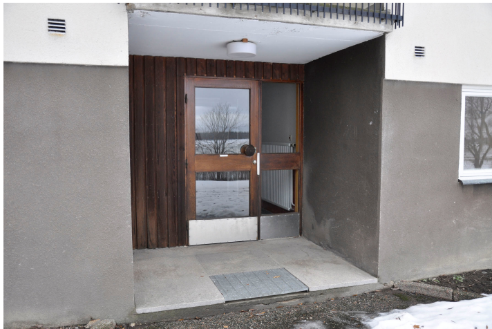
Bild 10. Entré åt öster. Bildnr Vlm_kmvMM-160