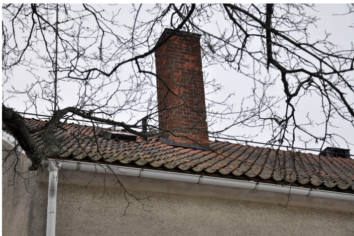
Bild 24. Del av östra takfallet med enkupigt lertegel och murad skorsten. Bildnr Vlm_kmvMM-202