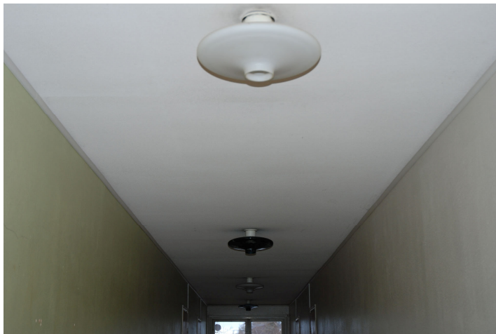
Bild 41. Belysningsarmatur i korridor. Bildnr Vlm_kmvLS-1020