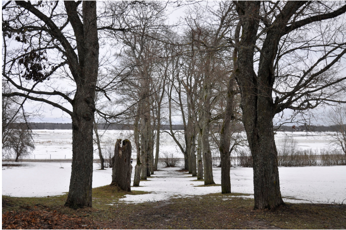
Bild 4. Allén sydost om Lönngården. Bildnr Vlm_kmvMM-196