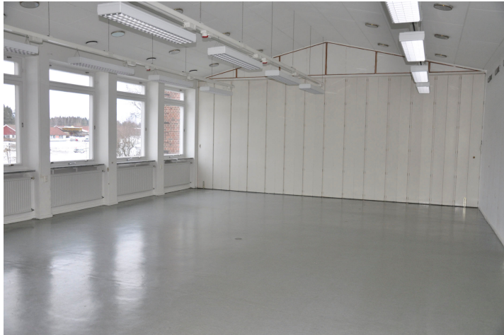
Bild 65. Matsalen med vikvägg med igensatt överljusparti. Bildnr Vlm_kmvMM-135