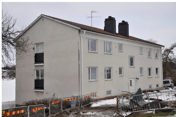
Bild 28. Kastanjegården från sydost. Bildnr Vlm_kmvMM-213