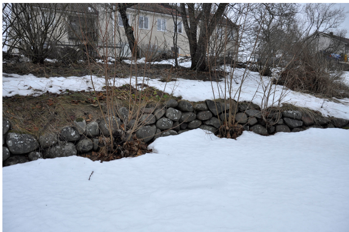
Bild 2. Stödmur i trädgården söder om Kastanjegården. Bildnr Vlm_kmvMM-29