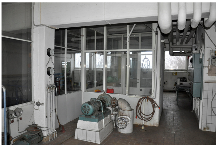
Bild 63. Panncentralen interiör från väster. Bildnr Vlm_kmvMM-96