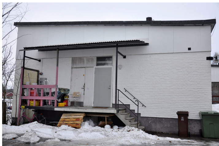
Bild 52. Panncentralen från söder med lastbrygga. Bildnr Vlm_kmvMM-63