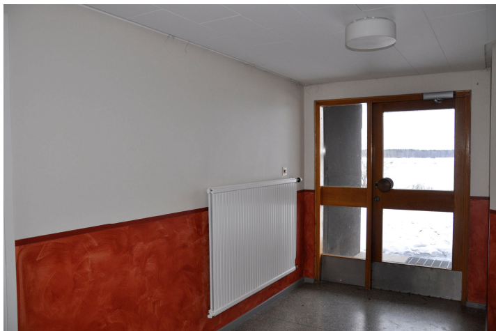
Bild 14. Trapphus, souterrängplanet, port åt öster. Bildnr Vlm_kmvMM-186