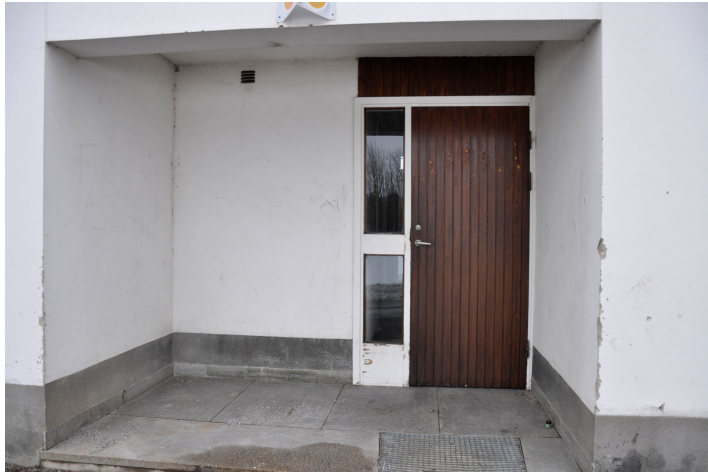
Bild 32. Entrédörr i souterrängvåningen åt väster. Bildnr Vlm_kmvMM-224