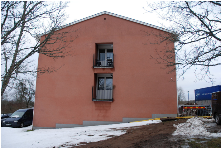
Bild 35. Lindgården åt väster. Bildnr Vlm_kmvLS-1031