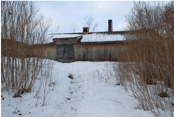
Bild 44. Jordkällaren från söder. Bildnr Vlm_kmvLS-1063