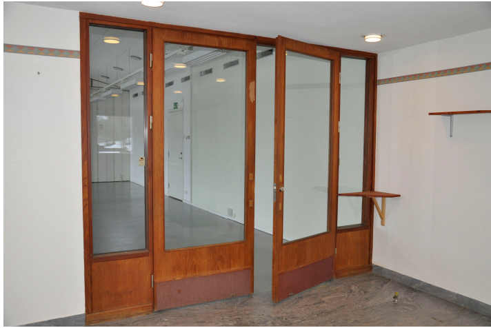
Bild 64. Uppglasat dörrparti mellan entréhallen och matsalen. Bildnr Vlm_kmvMM-133