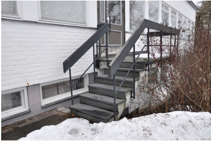
Bild 58. Entré åt öster till kontorsdelen. Bildnr Vlm_kmvMM-80