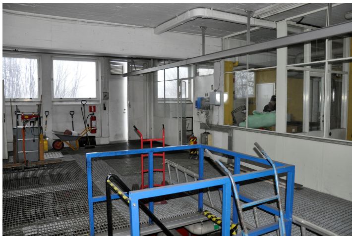
Bild 62. Panncentralen interiör från nordväst. Bildnr Vlm_kmvMM-92