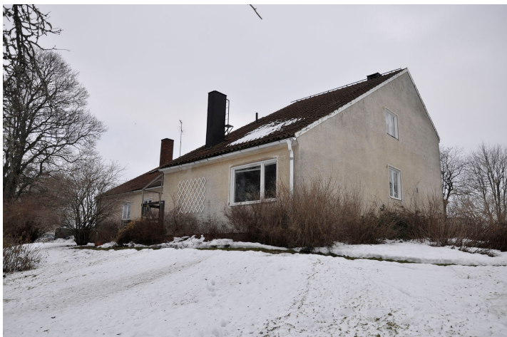
Bild 21. Lönngården från nordost. Bildnr Vlm_kmvMM-205