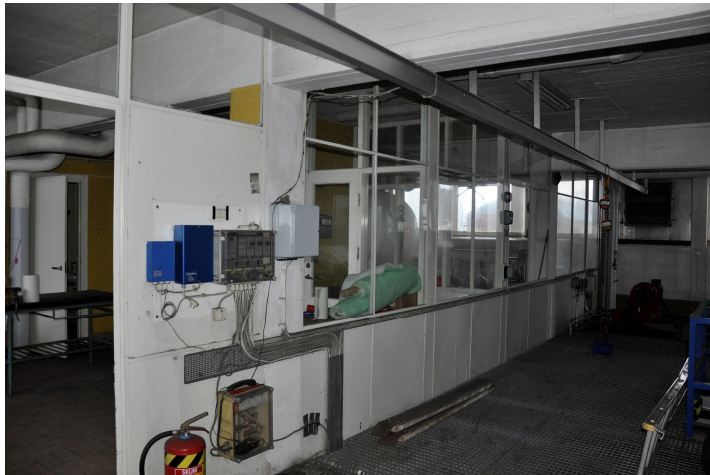
Bild 61. Panncentralen interiör från nordost.. Bildnr Vlm_kmvMM-86