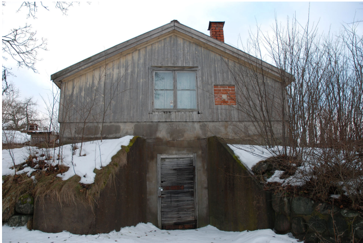
Bild 47. Jordkällaren från öster. Bildnr Vlm_kmvLS-1050