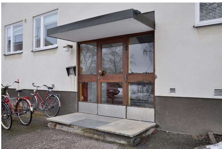
Bild 9. Entré åt väster. Bildnr Vlm_kmvMM-165