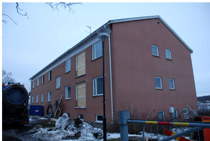
Bild 16. Björkgården från nordost. Bildnr Vlm_kmvLS-981