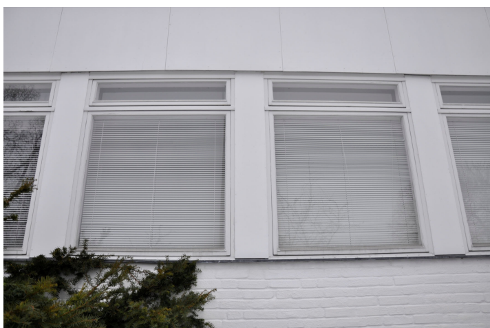
Bild 57. Detalj av fönsterband åt öster. Bildnr Vlm_kmvMM-78