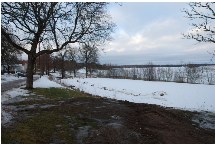
Bild 6. Fotbollsplanen norr om Lindgården och omgivningarna öster om Sofielund. Bildnr Vlm_kmvLS-1067