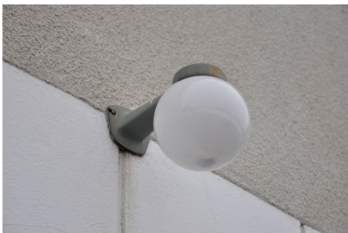
Bild 33. Belysningsarmatur vid garagedörrarna i väster. Bildnr Vlm_kmvMM-220