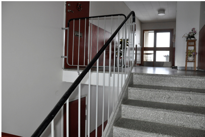
Bild 13. Trapphus, andra våningsplanet. Bildnr Vlm_kmvMM-182