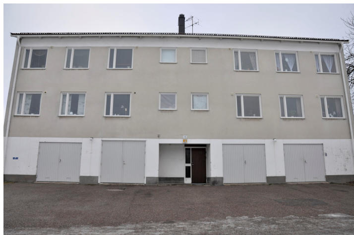
Bild 29. Kastanjegården från väster. Bildnr Vlm_kmvMM-221