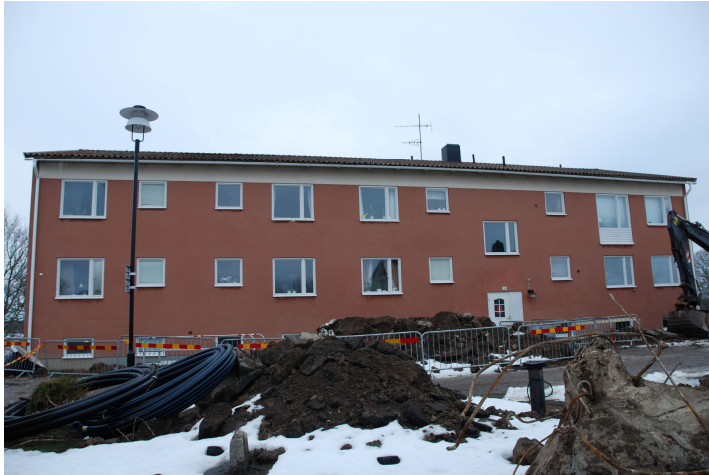
Bild 34. Lindgården åt väster. Bildnr Vlm_kmvLS-1029