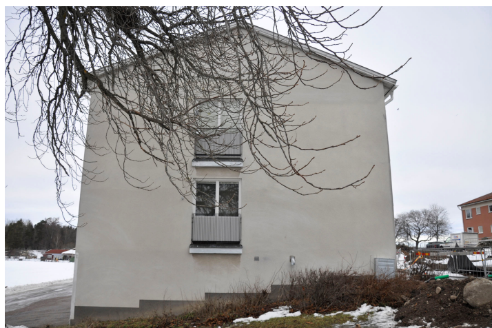
Bild 30. Kastanjegården från söder. Bildnr Vlm_kmvMM-222