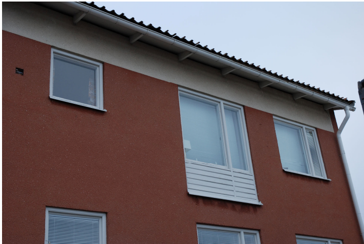
Bild 38. Detalj av västfasaden. Bildnr Vlm_kmvLS-1030