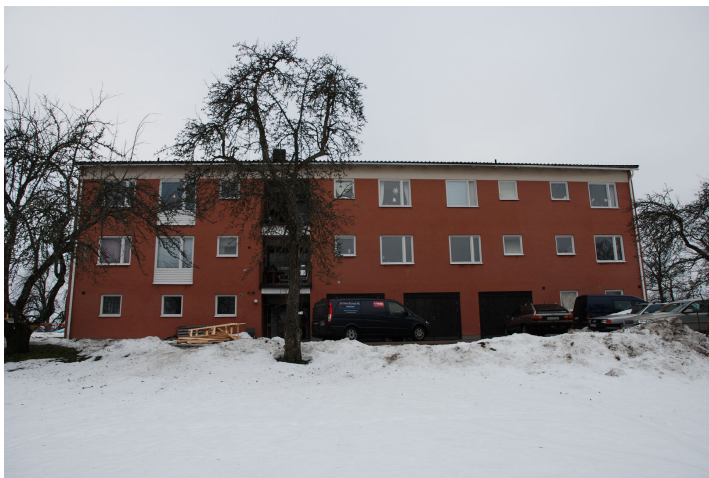
Bild 36. Lindgården åt öster. Bildnr Vlm_kmvLS-1008