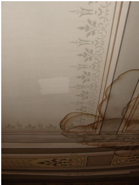
Vattenfläckar och rengöringsprov.