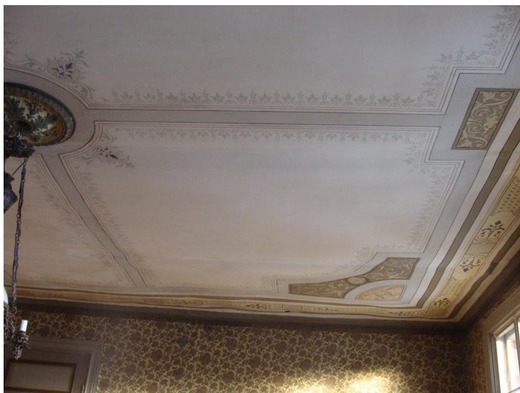
Skogsta, stora salen efter åtgärd.