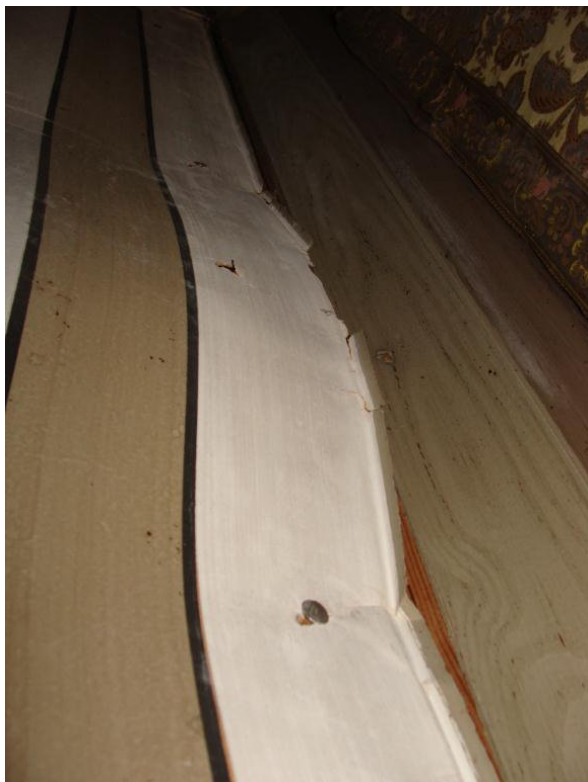
Lossnade kanter med tidigare lagningar längst väggen.