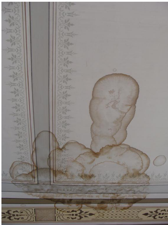
Vattenfläckar före åtgärd.