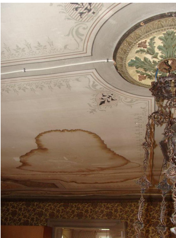
Vattenfläckar och mindre rengöringsprover.