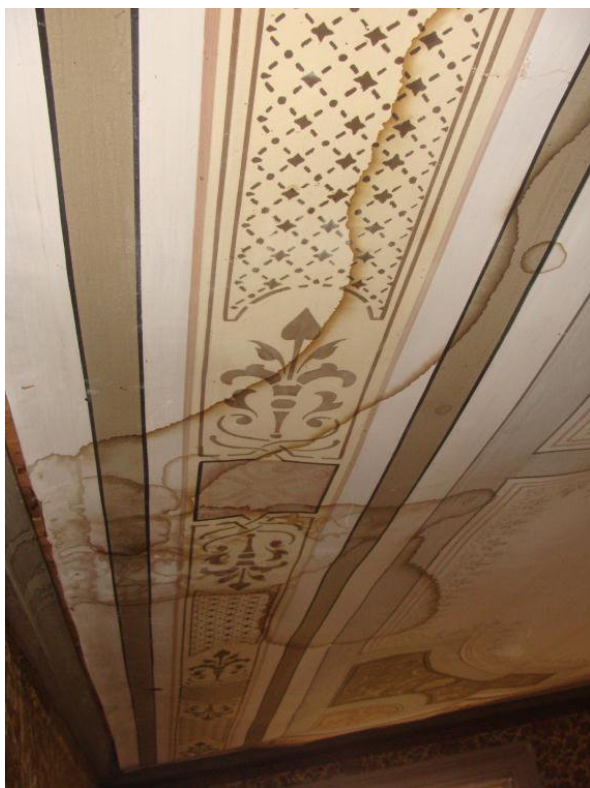
Vattenfläckar med lossnade kanter längst vägen.