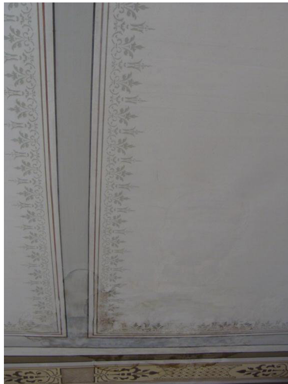
Vattenfläckar efter åtgärd.