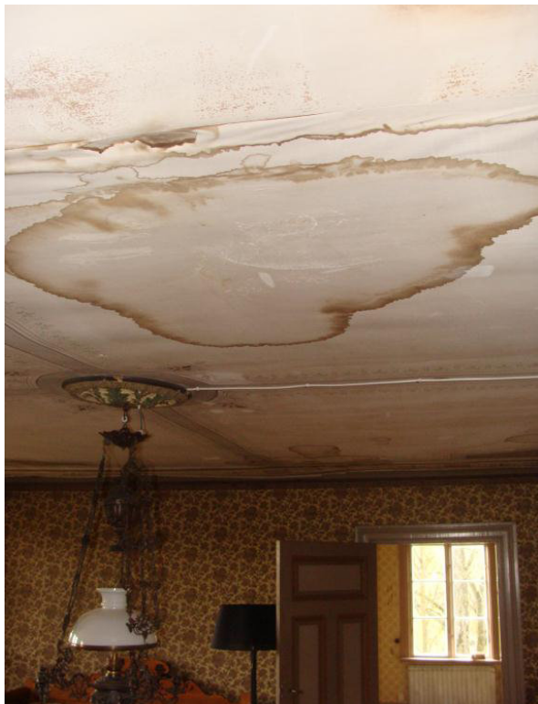
Skogsta, stora salen före åtgärd.