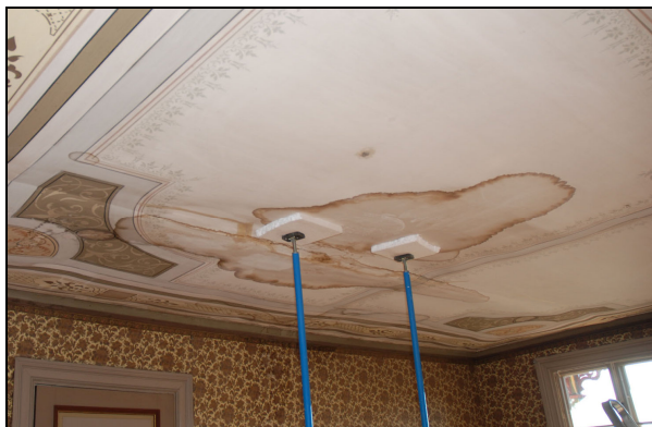
Vlm_kmvLS-818. Innan konservering. Pappen hålls på plats med stöttepelare.