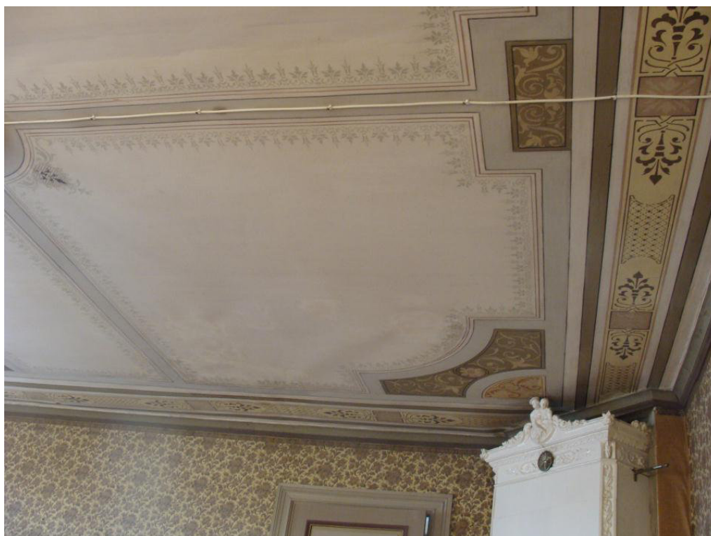
Skogsta, stora salen efter åtgärd.