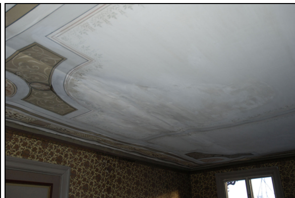
Vlm_kmvLS-890. Takyta efter konservering.