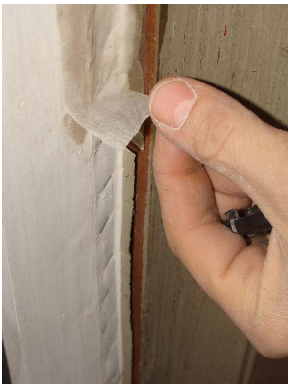
Fixering av lossnade kanter. Lagningen limmades över med japanpapper.