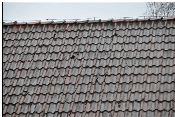
På stora delar av taket hade pannorna börjat spjälka. Bildnr Vlm_kmvIm-1232.