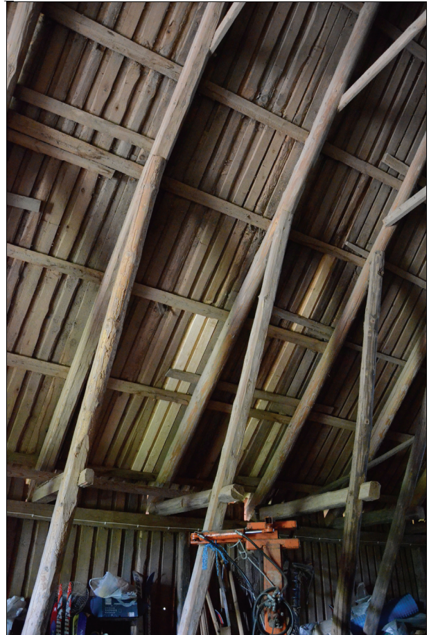
På undertaket gjordes mindre lagningar på de ställen som var rötskadade. Bildnr Vlm kmvIM-1430 och 1431.