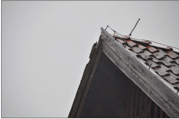
Vindskivorna var slitna och rötskadade. Bildnr Vlm_kmvIm-1234.