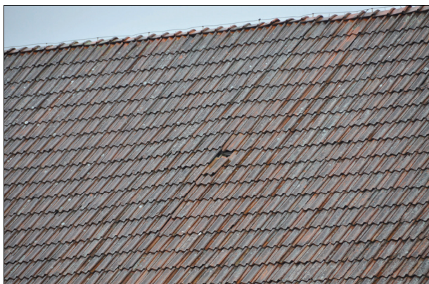
Flertalet tegelpannor hade glidit ur läge. Bildnr Vlm_kmvIM-1229.