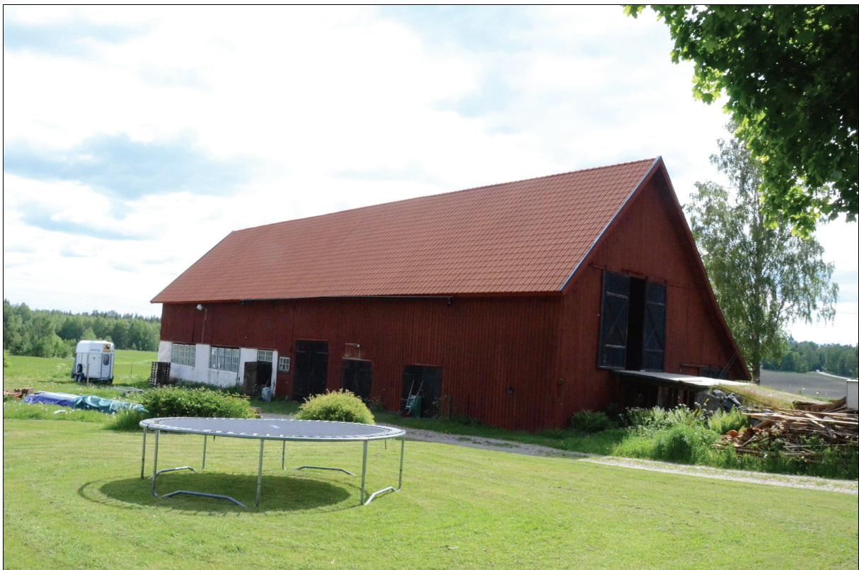
Byggnaden från nordost efter restaurering. Bildnr Vlm_kmvIM-1420.

Det befintliga teglet plockades ned. Undertaket lagades med material lika befintligt. På undertaket lades ny läkt och därefter nytt Vittinge tvåkupigt lertegel. Nya vindskivor monterades och målades med röd slamfärg. Vattbrädor av svartlackerad plåt.