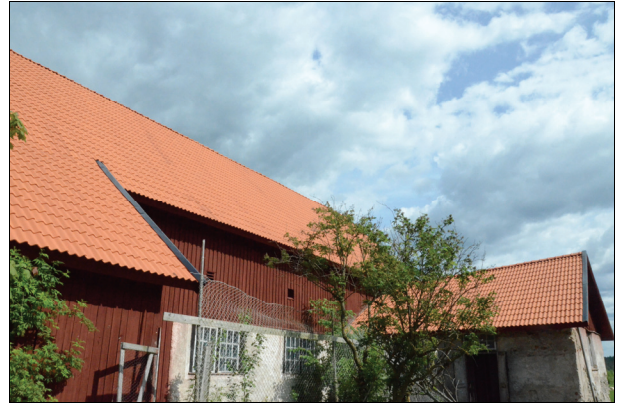
Byggnadens västra takfall efter takläggning. Bildnr Vlm kmvIM-1424 och 1425.