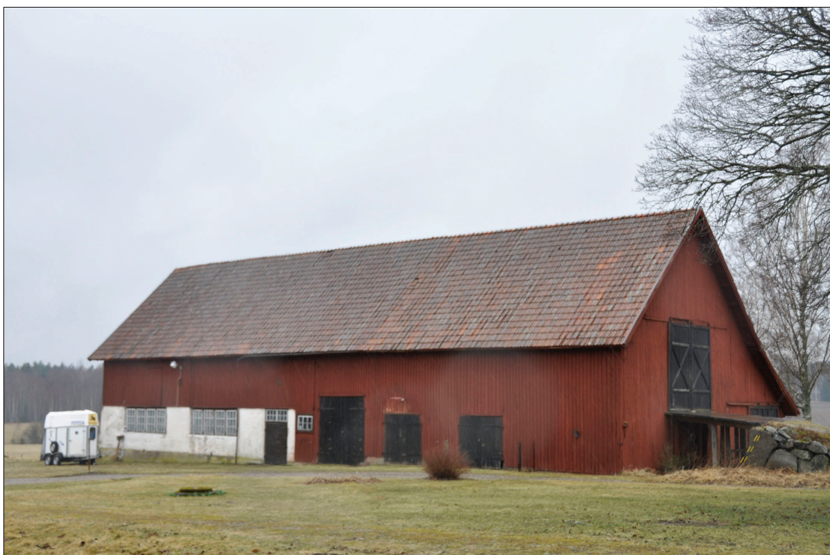
Byggnaden från nordost före restaurering. Bildnr Vlm_kmvIM-1228.

Byggnadens tegeltak är i dåligt skick på grund av ålder. Pannorna har glidit ur läge, vissa har ramlat ned och flertalet pannor spjälkar. På undertaket finns rötskador på grund av långvarigt vattenläckage.