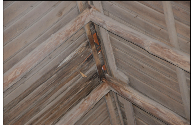
På undertaket fanns rötskador på grund av långvarigt vattenläckage. Bildnr Vlm_kmvIM-1243.