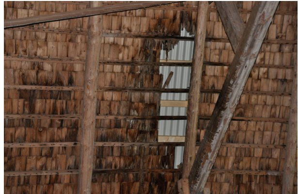
I och med den nya taktäckningen har rötangreppen i undertaket stoppats. Bildnr Vlm_kmvIM-1987 och 1988.