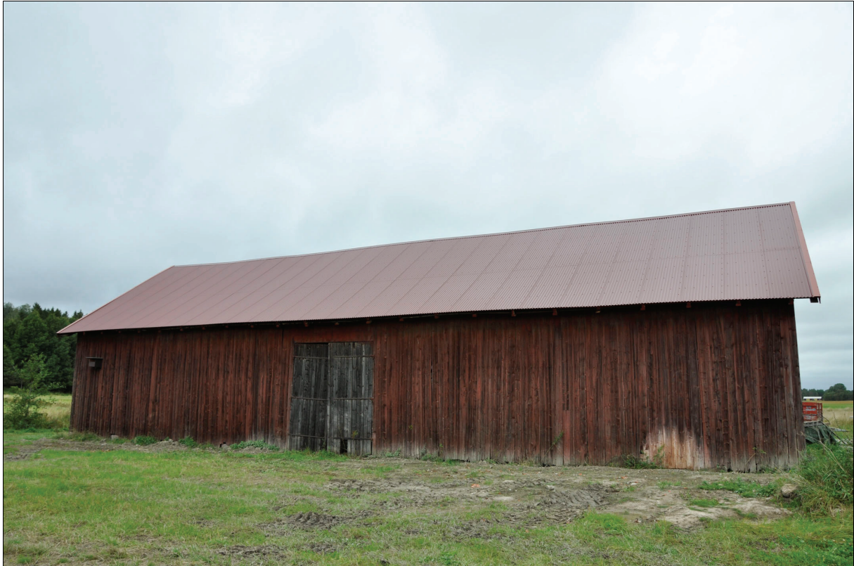
Byggnadens södra fasad efter restaurering. Bildnr Vlm_kmvIM-1984.