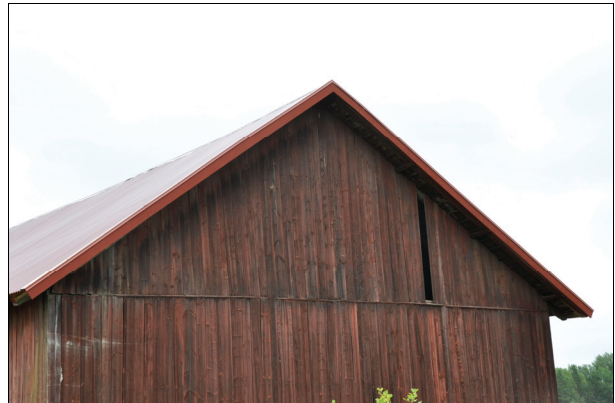
Nya vindskivor av trä målades med röd slamfärg. Bildnr Vlm_kmvIM-1991.