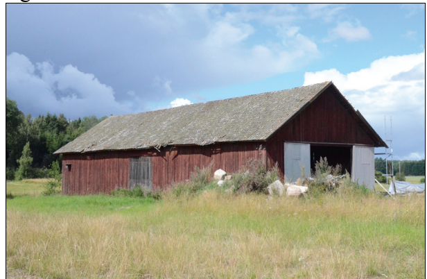
Byggnadens södra fasad före restaurering. Flera takpannor hade ramlat ned. Bildnr Vlm_kmvIm-1302.