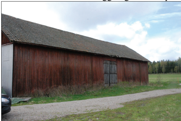
Byggnadens norra fasad före restaurering. Bildnr Vlm_kmvIM-1300.

Byggnadens tak var inte tätt med takläckage, isärglidna och spruckna samt nedfallna pannor. Taket var i behov av omläggning och komplettering.