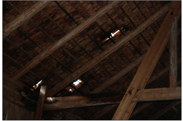
I byggnadens undertak fanns rötskador på grund av en längre tids vattenläckage. Bildnr Vlm_kmvIM-1294 och 1296.