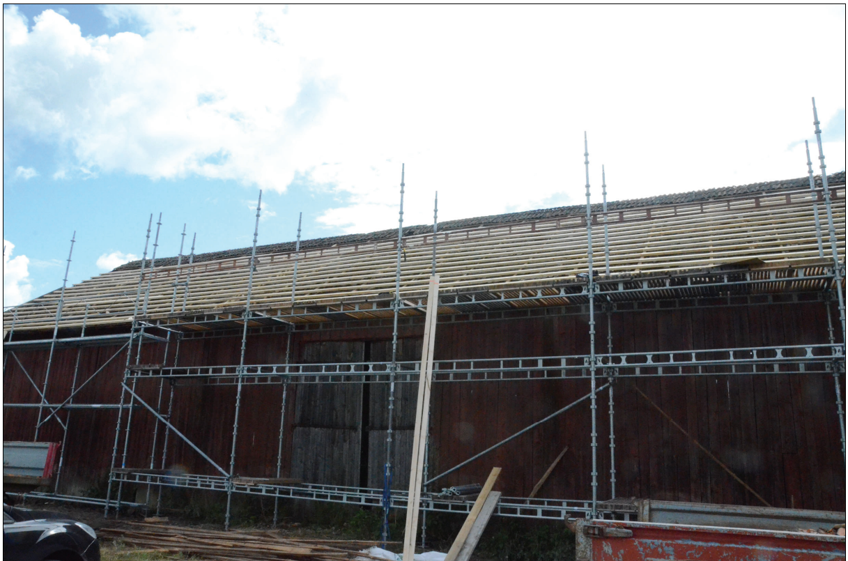
På det befintliga undertaket lades ny läkt. Bildnr Vlm_kmvIM-1529