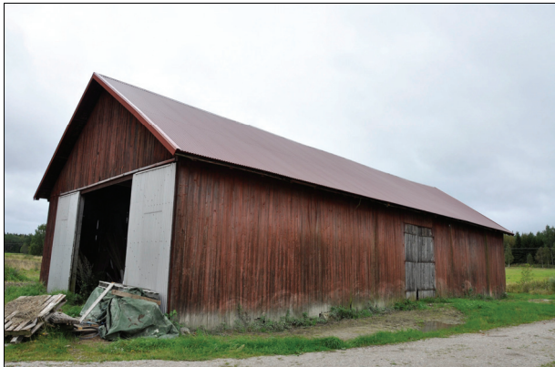
Byggnadens norra fasad efter restaurering. Bildnr Vlm_kmvIM-1982.