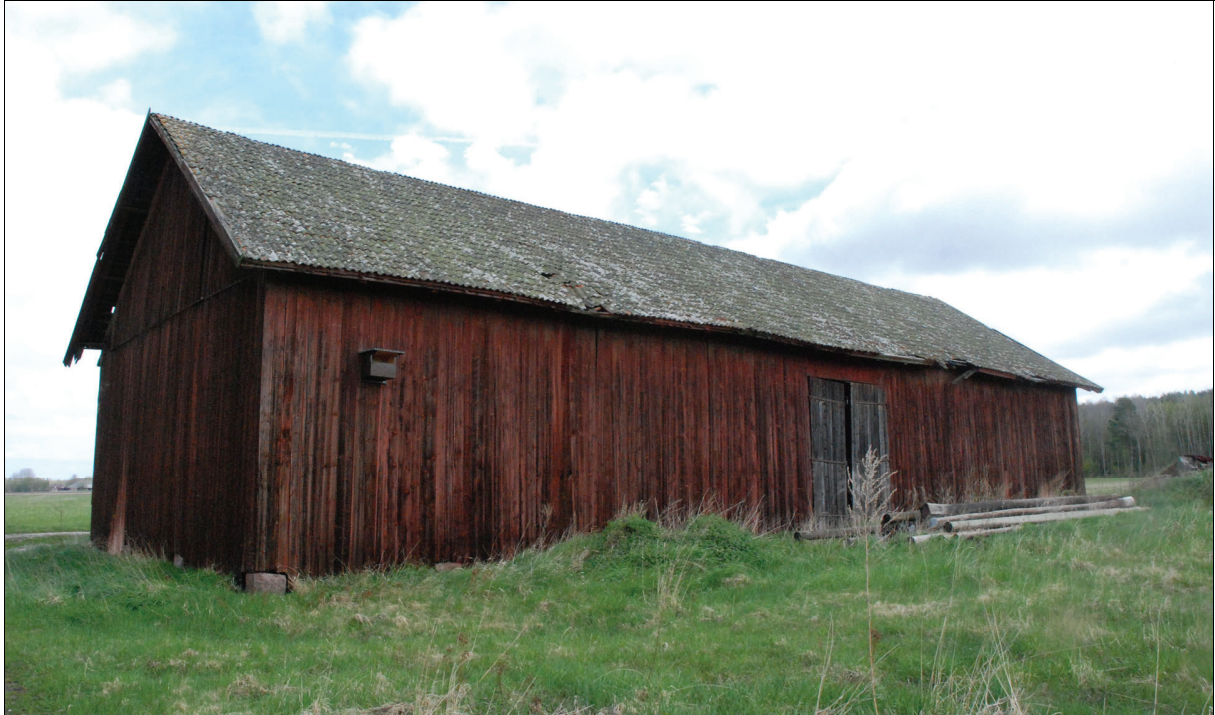
Byggnaden före restaurering. Bildnr Vlm_kmvIM-1303.

Logen är uppförd i stolpverk. Fasaden är i slätpanel som är målad i röd slamfärg. Taket är täckt med tvåkupigt lertegel på ett undertak av äldre pärt.