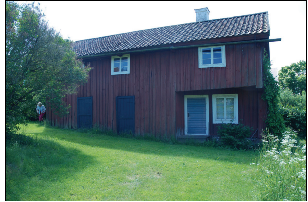
Byggnaden från nordväst före restaurering. Bildnr Vlm kmvIM-1470.