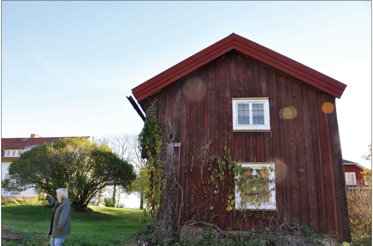
Byggnadens västra fasad. De nya vindskivorna målades med röd slamfärg. Bildnr Vlm_km01M-2321.