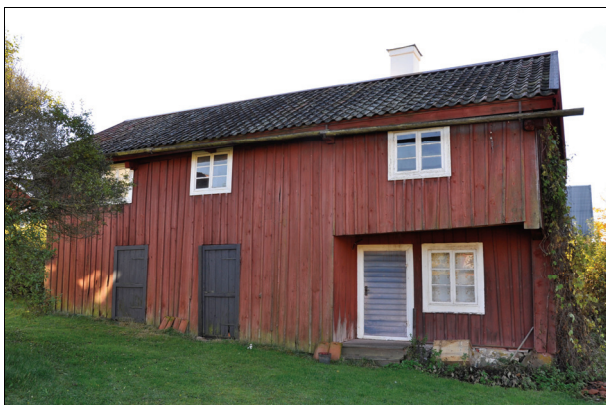
Byggnadens norra fasad efter takomläggningen. Bildnr Vlm_kmvIM-2319.

Det befintliga teglet plockades ned för återanvändning. Rötskador i undertaket lagades med material lika befintligt. På undertaket lades ny läkt och därefter lades det gamla enkupiga lerteglet tillbaka. Begagnat enkupigt lertegel användes vid komplettering. Nya vindskivor, vattbrädor och nocktäckning gjordes i furu. Vattbrädor och nocktäckning tjärades med ljus trätjära medan vindskivorna målades med röd slamfärg. Skorstenen vitmålades och tätades vid fästet mot taket.