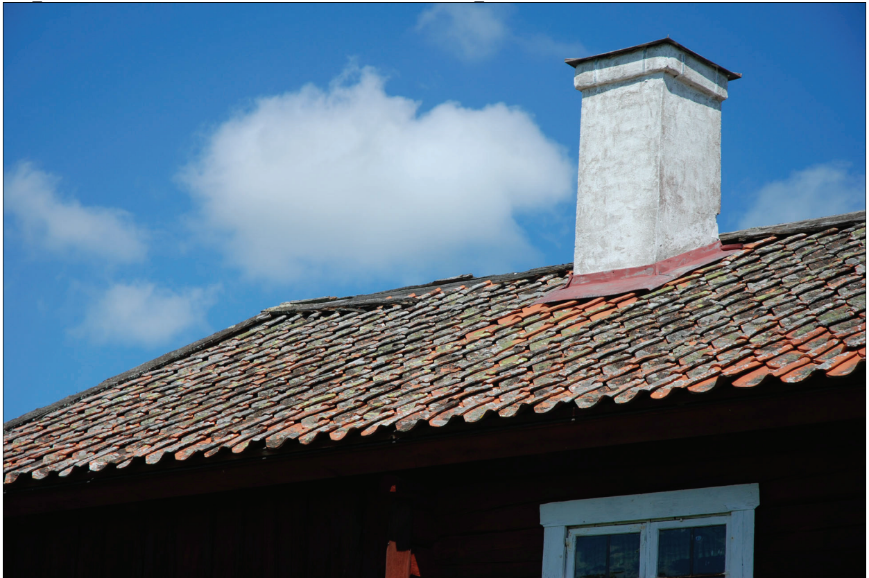
Nockbrädorna var i dåligt skick. Bildnr Vlm kmvIM-1508.