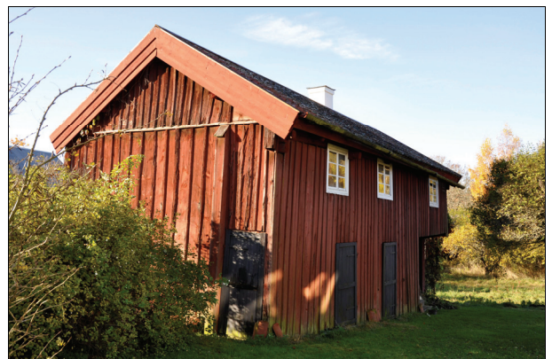
Byggnaden från nordöst efter takomläggning. Bildnr Vlm_kmvIM-2320.