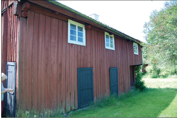
Byggnaden från nordöst före restaurering. Bildnr Vlm kmvIM-1469.

Nock- och vattbrädor var trasiga och fattades helt på ett par ställen. Teglet var gammalt och slitet, en del pannor hade glidit ur läge. Ett fåtal rötskador fanns i undertaket på grund av långvarigt vattenläckage.