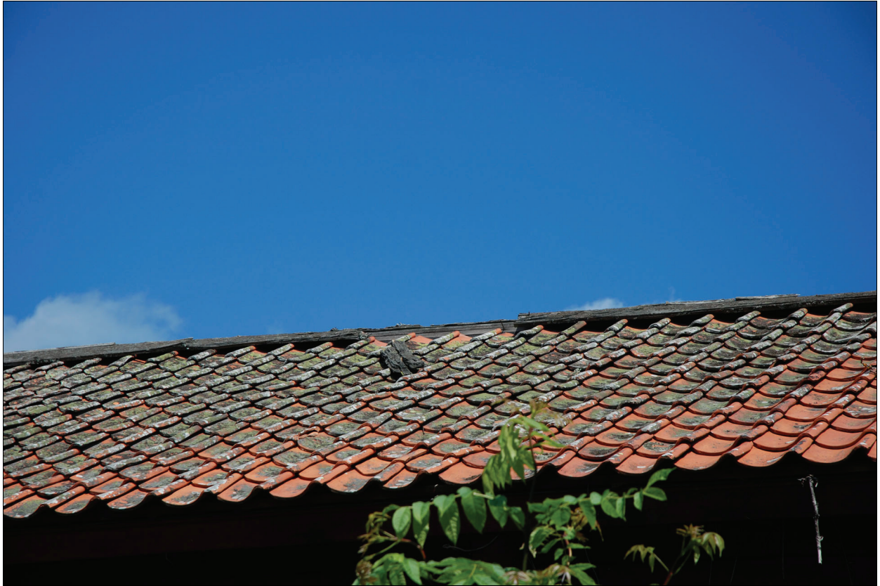
På flera ställen hade nocktäckningen ramlat bort. Bildnr Vlm_kmvIM-1507.