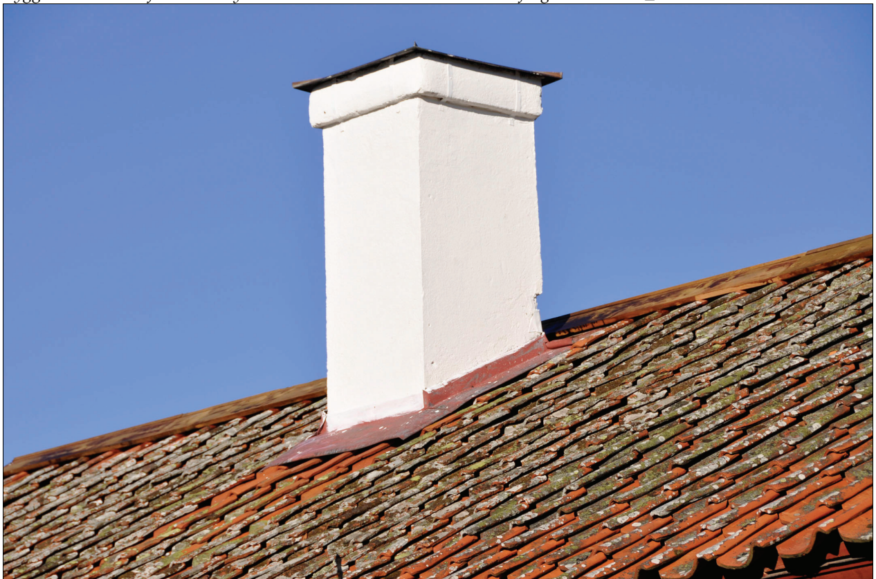
Skorstenen vitslammades och fästet mot taket lagades. De nya nockbrädorna ströks med ljus trämjera. Bildnr Vlm_km01M-2324.