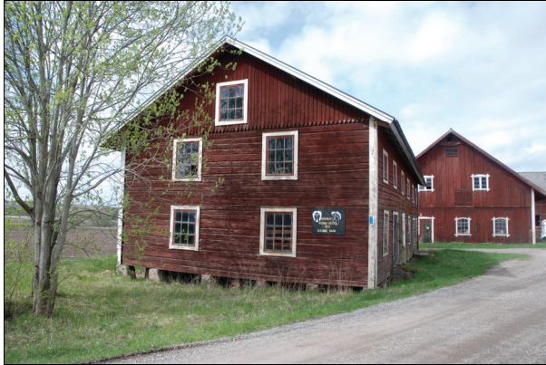
Byggnadens östra fasad före restaurering. Bildnr Vlm_kmvIM-1277.

Byggnadens fönster var i dåligt skick med flagnande färg och bortfallet kitt. På vissa bågar fanns rötskador.