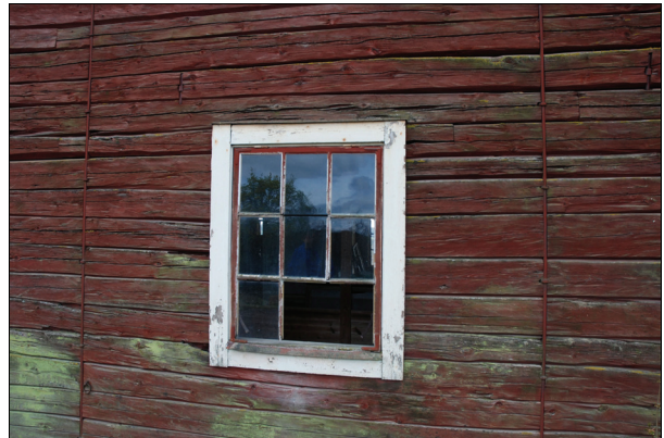
Ovan: ett fåtal fönster hade rötskador. Bildnr Vlm_kmvIM-1278.