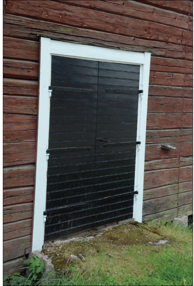
En av de nyttillverkade dörrarna. Vlm_kmvIM-1535.