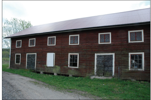
Byggnadens norra fasad före restaurering. Bildnr Vlm_kmvIM-1284.