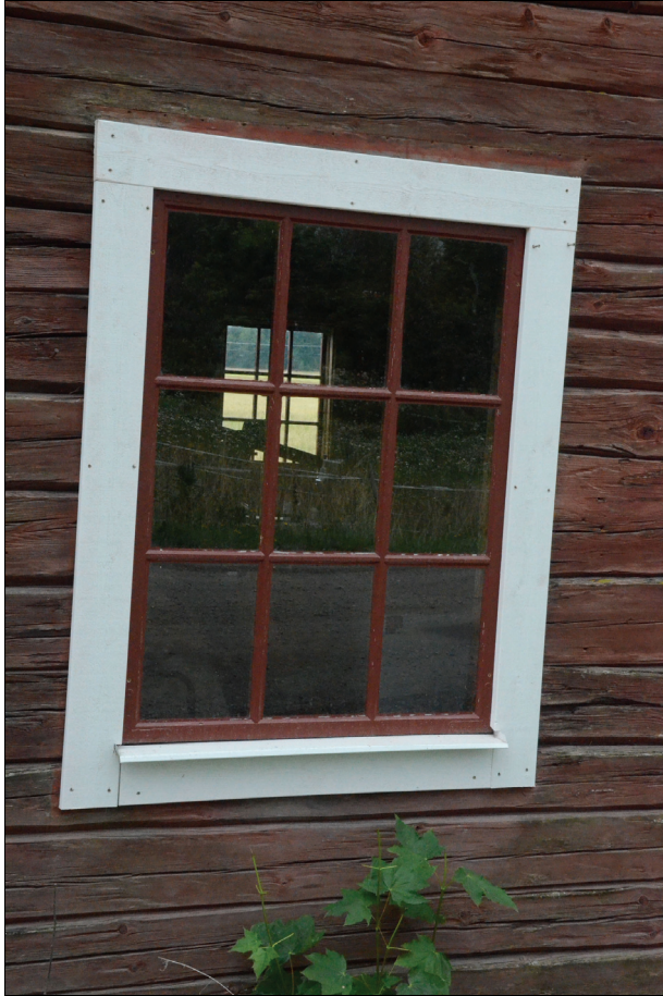
Ett av de nyttillverkade fönstren. Bildnr Vlm_kmvIm-1534.