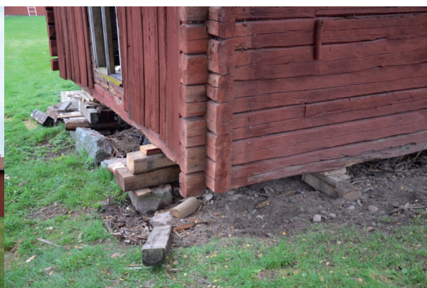
Byggnadens nordöstra hörn. Byggnaden har tillfälligt pallats upp inför åtgärder nästa år.