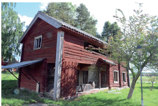
Byggnadens sydvästra hörn. Vlm_kmvIM-1394