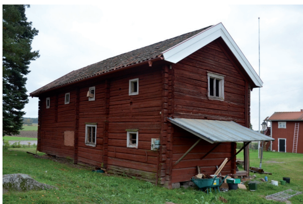
Byggnadens nordvästra hörn, nya vindskivor som målats vita.