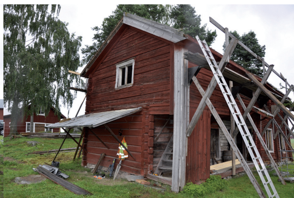
Byggnadens sydvästra hörn.