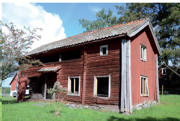
Byggnadens sydöstra hörn. Byggnaden har sjunkit och panelen börjar släppa från timmerstommen. Vlm_kmvIM-1397