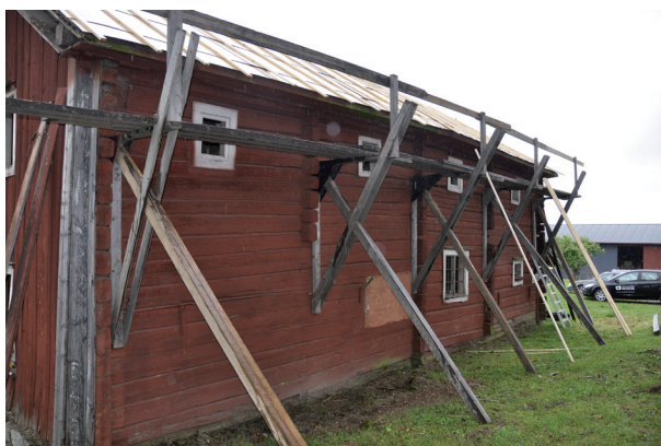
Byggställningar har kommit på plats och boarden har lagts på.