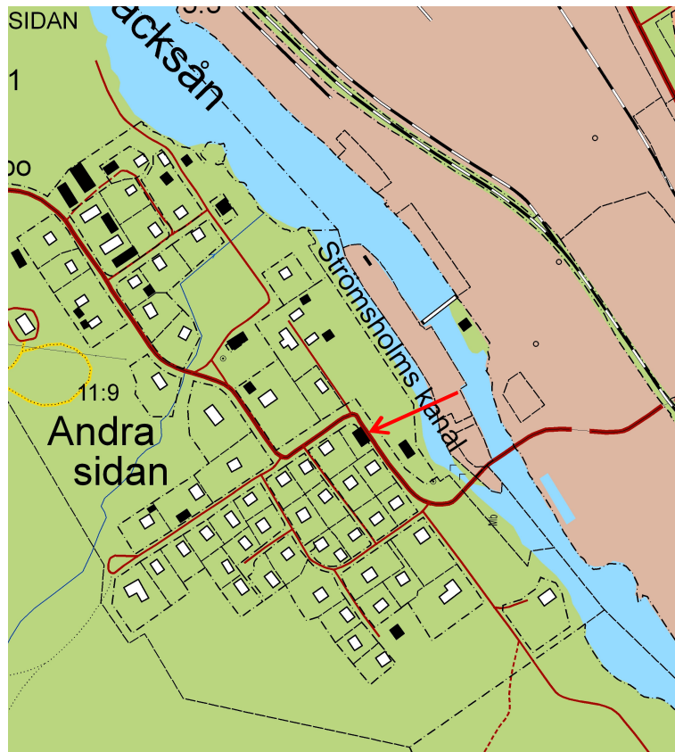
Röd pil markerar aktuell byggnad. Utdrag ur digitala fastighetskartan. Skala 1:20 000.

Fastighetsägaren till Vita magasinet beviljades bidrag till återställande av bjälklag efter traversdemontering samt renovering av fuktskada i golvbjälkar i Vita magasinet, Andra sidan 1:63, Västanfors socken, Fagersta kommun, Västmanlands län. Bidraget beviljades den 28 mars 2011 av Länsstyrelsen i Västmanlands län, dnr 433-10888-2009. Västmanlands läns museum fick uppdraget som antikvarisk kontrollant i ärendet. Den antikvariska kontrollen har utförts av byggnadsantikvarie Lisa Skanser, som även skrivit efterföljande rapport. Arbetena genomfördes under våren och sommaren 2011.