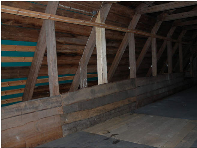
Nytt stödben, lagad del av innervägg och golv.

De första momenten innebar demontering av avsågad bjälke i väggen och demontering av fuktskadad del av bjälke. Virket hade kraftiga dimensioner och en av bjälkarna var 10 x 12 tum (30 x 25 cm). I väggen hade de gamla bjälkarnas ändträ täckts med näver. Hantverkarna lade tjärpapp vid aktuell renovering. Bjälklaget stämpades upp och skarvades med nya bjälkar, skarvarna dymlades ihop. Skarvar gjordes likadana som övriga skarvar som redan förekom på andra delar i konstruktionen, det vill säga halvt i halvt och dymlingar av kärnfura. Golvplank och del av innervägg på vinden samt stödben i en takstol lagades enligt likadant utförande som förlagan. Begagnat virke från magasinet, som höll samma dimensioner och hade likadan beredning som det tidigare, användes till innerväggen. Smidd spik användes.