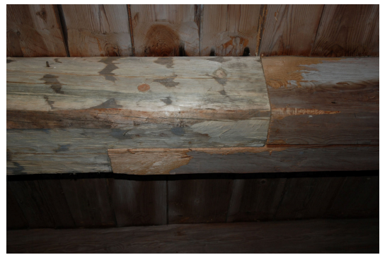
Närbild på skarvad och dymlad bjälke.