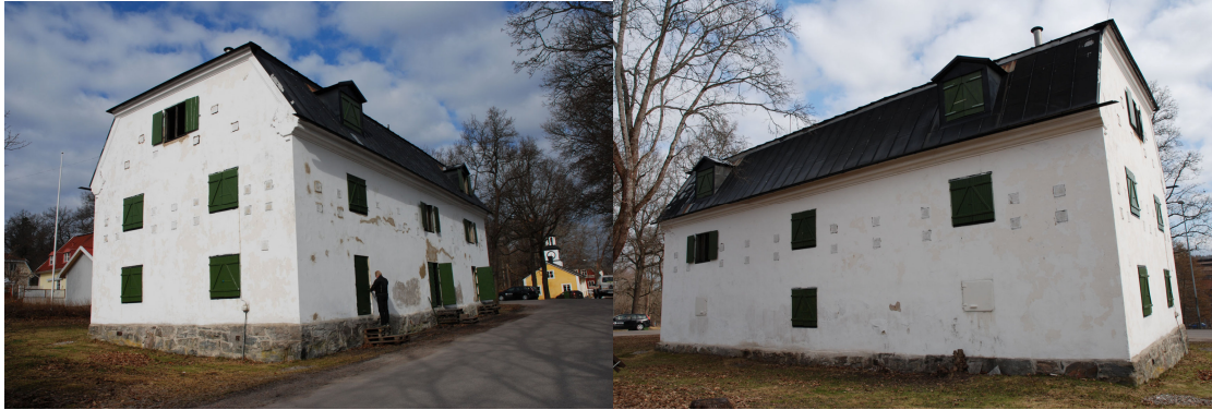
Från sydöst, Vlm_kmvLS-1248.

Numer ligger magasinet på en mindre avstyckad tomt. Dess östra fasad ligger nästintill i liv med den förbipasserande vägen. Kring byggnaden växer stora lövträd.