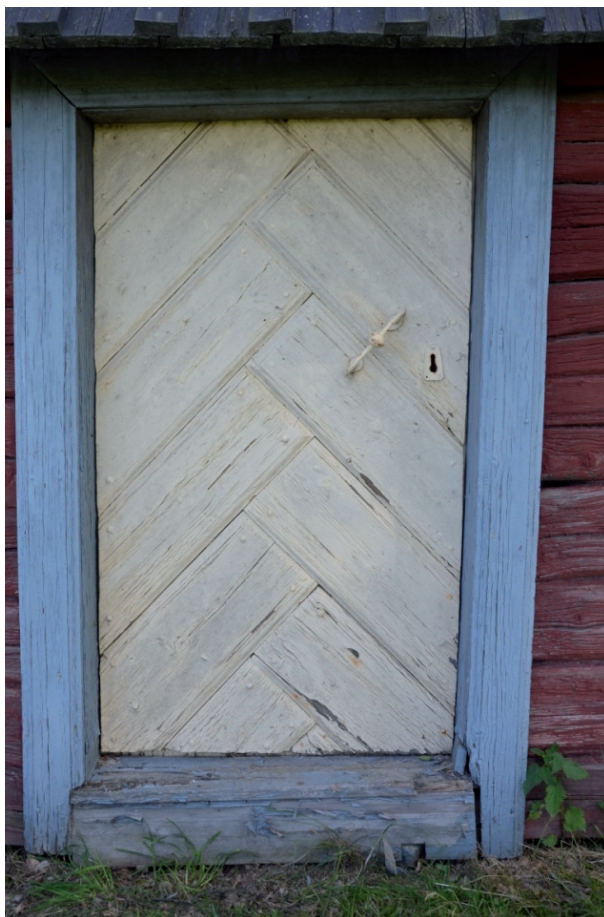
Dörren, tröskeln och fodren innan restaurering. Vlm_kmvFE-1354

Dörrbladet var målat med en oljefärg som på vissa ställen lossnat i större bitar, troligen en alkydoljefärg. Kulören hade blekts kraftigt. Dörrbladet plockades ned från gångjärnen och in till verkstad för skrapning och målning. Ursprungsfärgen syntes på flera ställen. Efter jämförelse med likare bestämdes att dörren målas med linoljefärg i kulören S3050-Y20R (Wibo färg AB). Fodren plockades också bort och togs in på verkstad. Ursprungsfärgen syntes även här på flera ställen där alkydoljefärgen har släppt. Efter jämförelse med likare bestämdes att dörren målas med linoljefärg i kulören S6020-R90B (Wibo färg AB).