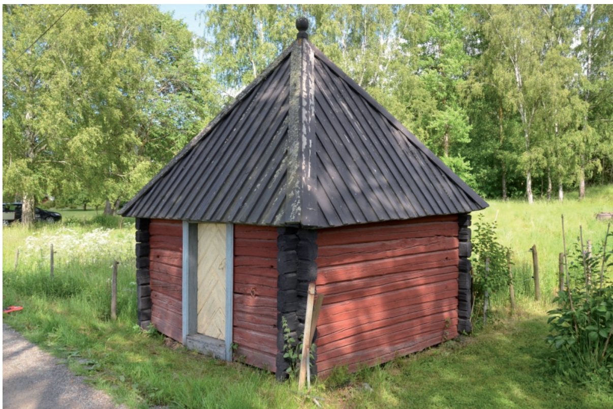
Rustboden innan restaurering. Byggnaden ligger precis vid vägen som går genom Tibble by. Vlm_kmvFE-1371.

Då underlaget inför projektet var översiktligt diskuterades de planerade åtgärderna igenom så att det inte var några oklarheter kring metoder och materialval.