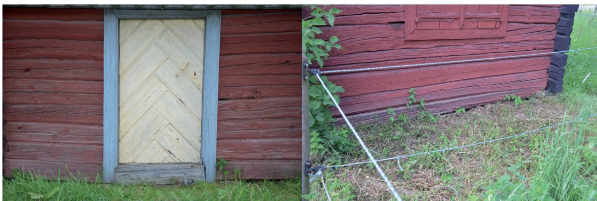
Syllen mot väster hade knäckts och stommen var skev. Vlm_kmvFE-1375

Markarbetena innefattade att schakta bort en vall som bildats mot byggnadens grund. Ett Ca 40 cm brett och 20 cm djupt schakt drogs längs byggnadens grund. Ytan släntades och förbereddes för att så nytt gräs.