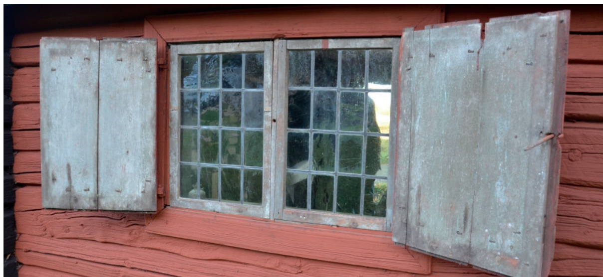
Fönstret på plats efter restaurering. Vlm_kmvFE-1900