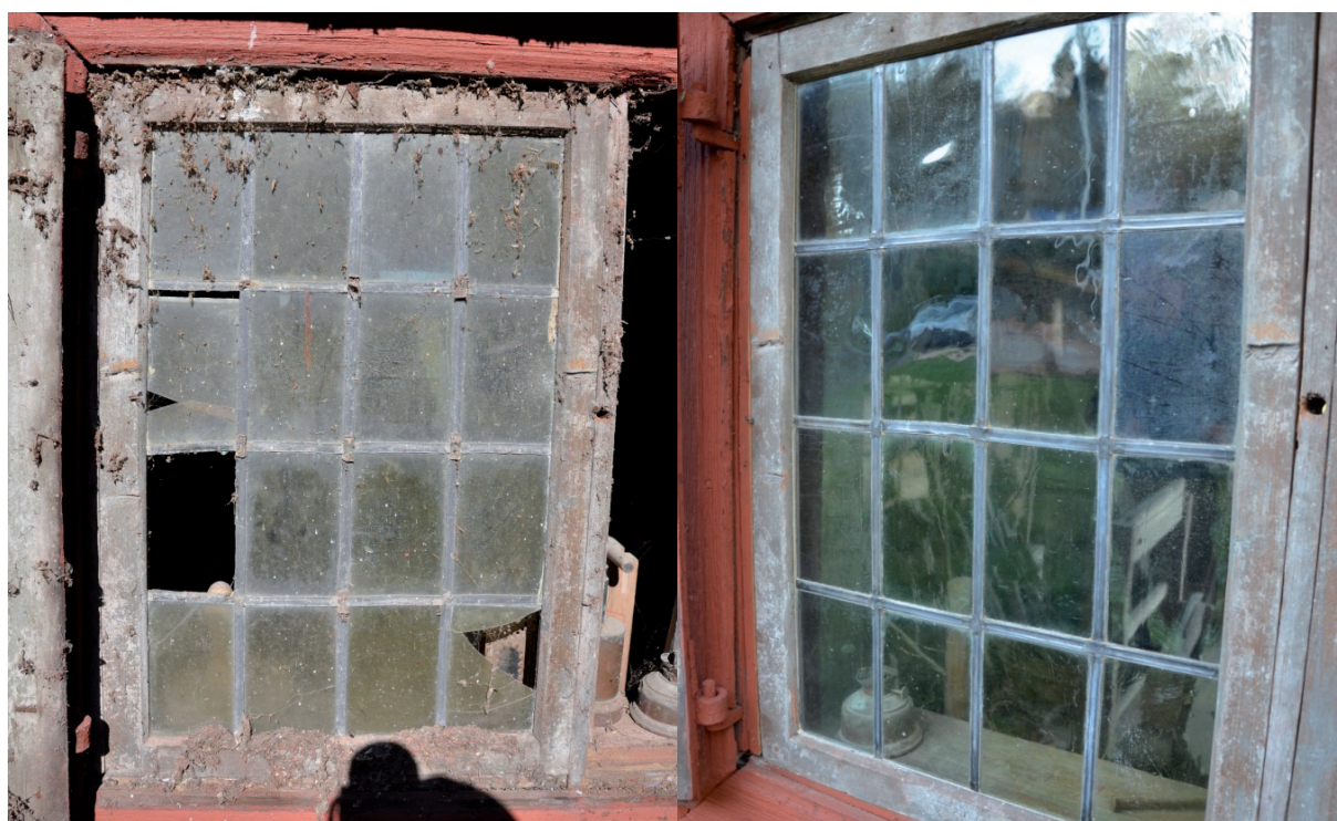
Fönstret innan restaurering, trasiga rutor och smuts. Fönstret efter restaurering. Vlm_kmvFE-1901 Vlm_kmvFE-1467

I byggnaden sitter två fönsterbågar med smårutiga blyinfattade fönster. Fönstren var i behov av rengöring och restaurering. Glaset är munblåst och 3 av rutorna hade spruckit. Fönsterbågarna plockades ur för att sedan fraktas till verkstad. Restaureringen utfördes av Blyfönster Specialisten. Fönstren rengjordes och blyinfattningen reparerades, trasiga glas ersattes med munblåst glas. Fönsterbågarna sattes sedan tillbaka i byggnaden.