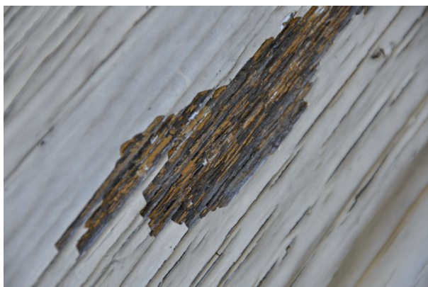
Ursprungsfärgen syntes på flera ställen på dörrbladet. Vlm_kmvFE-1472