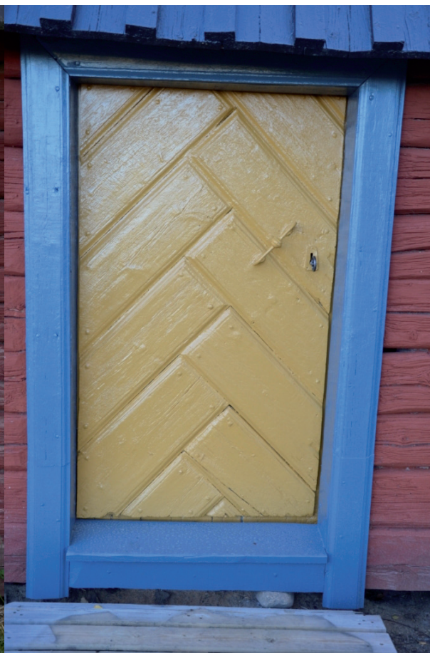
Dörren, tröskeln och fodren efter restaurering. Vlm_kmvFE-1891