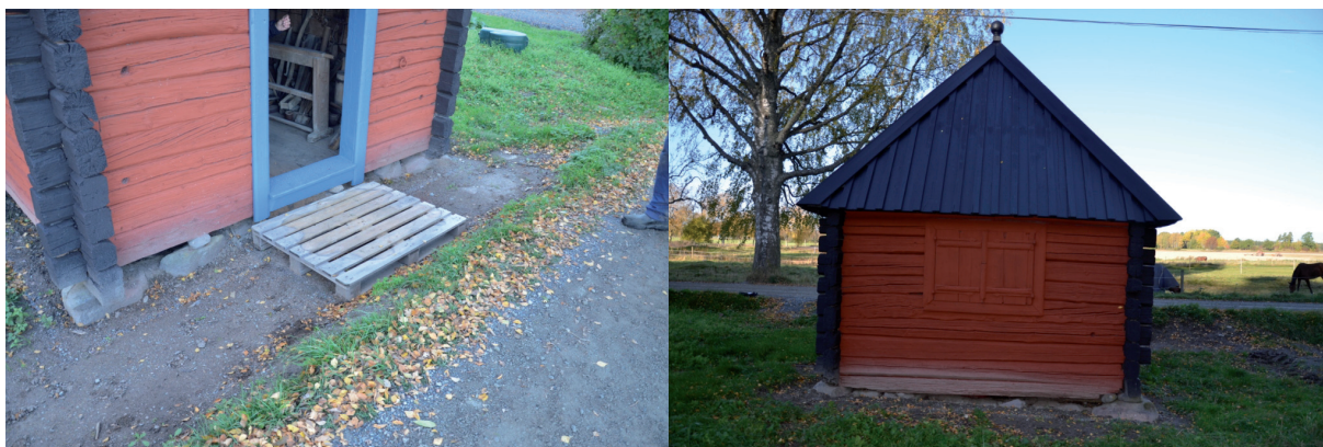
Syll, stomme och grund efter restaurering, fasad mot väster. Vlm_kmvFE-1898