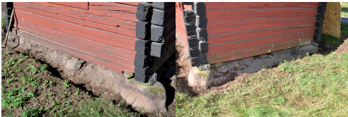
Bortschaktning av vall, österfasad. Vlm_kmvFE-1464