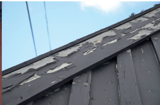
Färgbortfall på täckbräda. Färgen flagar i stora sjok. Vlm_kmvFE-1363