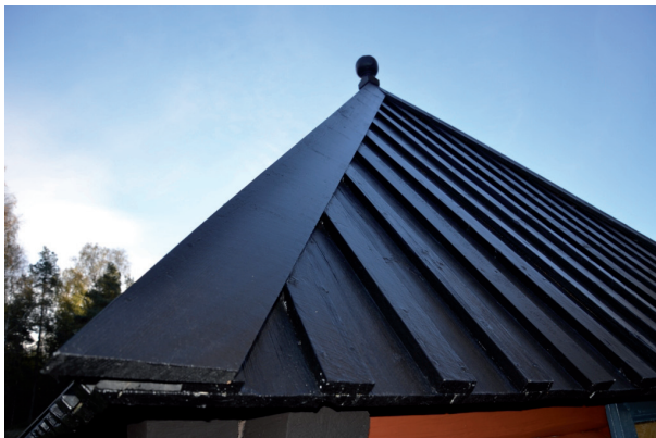
Taket efter reparation och målning. Vlm_kmvFE-1905