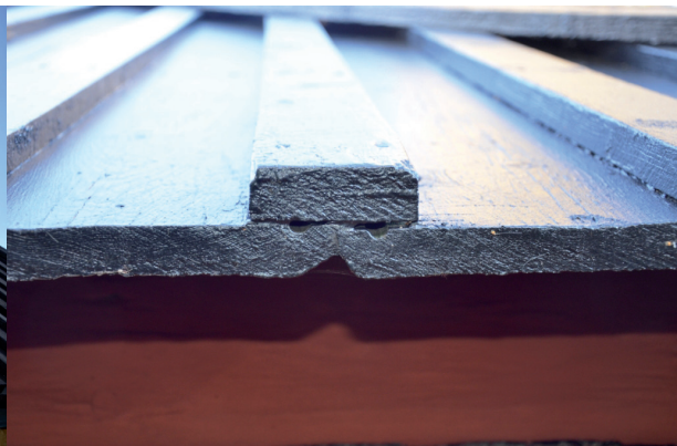
Närbild på vattränna i panelbrädorna. Vlm_kmvFE-1906