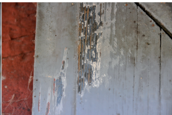
Ursprungsfärgen syntes även på fodren. Vlm_kvFE-1474