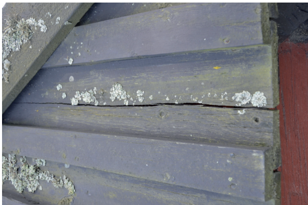
Spricka i panelbräda på taket. Vlm_kmvFE-1373

Delar av det nu liggande taket av locklistpanel är troligen från 1970-talet då rustboden genomgick en upprustning. Taket kontrollerades och skrapades ren från lav. Den svarta färgen (troligen en akrylatfärg) hade spruckit i stora flagor och härstammar från 1970-talets renovering. En diskussion fördes kring färgtypsval inför aktuell upprustning och det beslutades att taket skulle strykas med en svart akrylatfärg likt befintligt (Nordsjö, Tinova täckfärg). Ursprungligen var taket troligtvis omålat alternativt tjärat, men det fanns inga tecken på att akrylatfärgen bidragit märkbart till skadorna på taket. Målningen genomfördes i egen regi av Badelunda hembygdsförening som anlidade 3:12 Byggnadsvård. Av takets material gick stor del att bevara. 1 hel panelbräda, 1 locklist och 1 täckbräda byttes ut mot nytt virke.