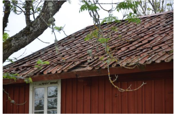
Skadorna på byggnadens tak var omfattande. Foto: Vlm_kmvFE-2966.