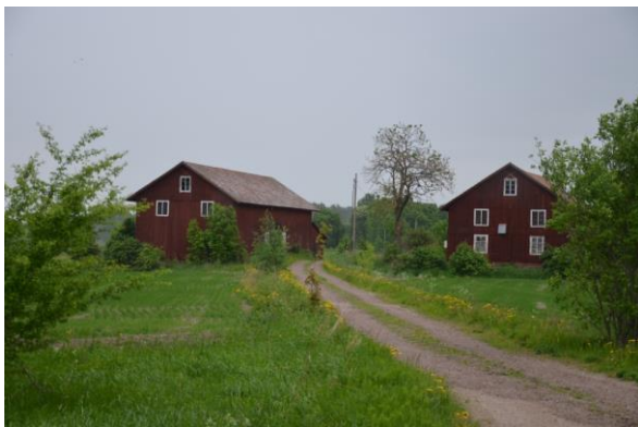
Ladan och logens placering i det öppna odlingslandskapet.