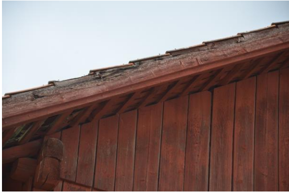
Vindskivans urtag för tegelpannorna.