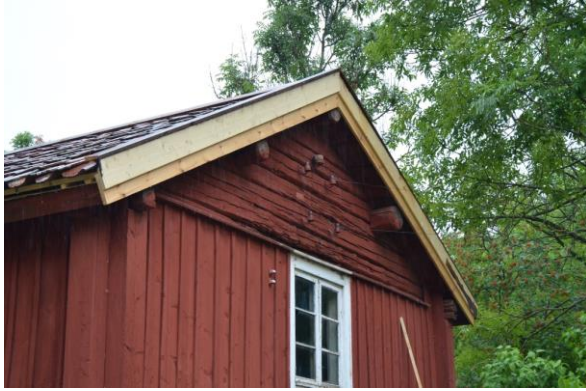
Nya vindskivor sattes på byggnaden, samt ny täckbräda.