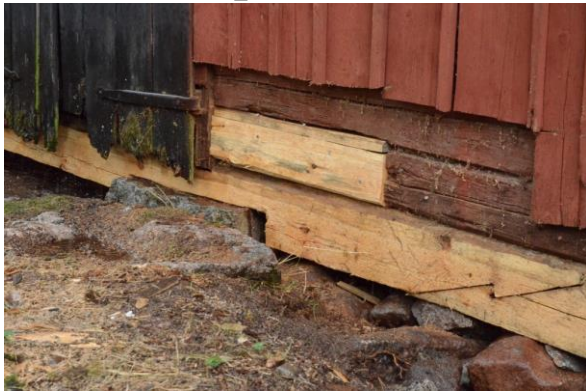
Den rötskadade syllstocken lagades och ersattes med nytt timmer.