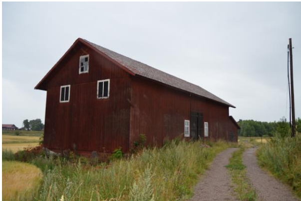
Logen efter åtgärderna.