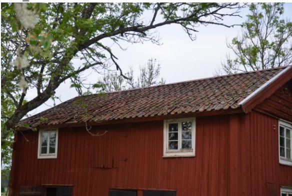
Läkten var rötskadad och taket böljade.