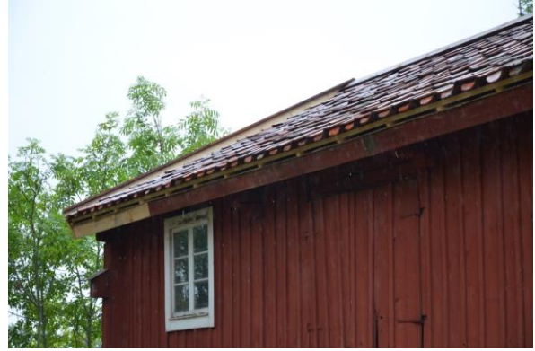
Takfotsbrädan reparerades och ny läkt lades på taket.