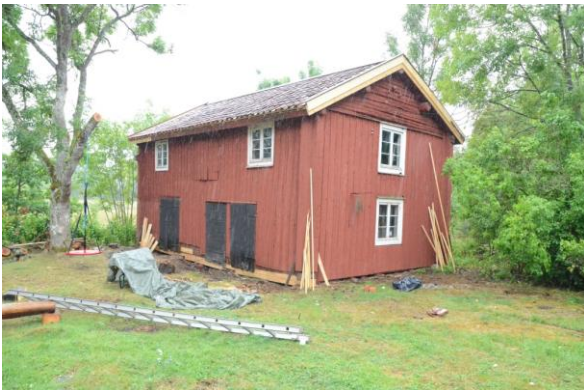
Loftboden efter utförda åtgärder. Tegelpannorna gick att återanvända. Målning kvarstår.