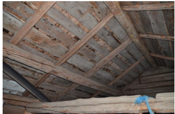
Pärten var skadad på flera ställen. Den kompletterades och boarden lades sedan på pärten.