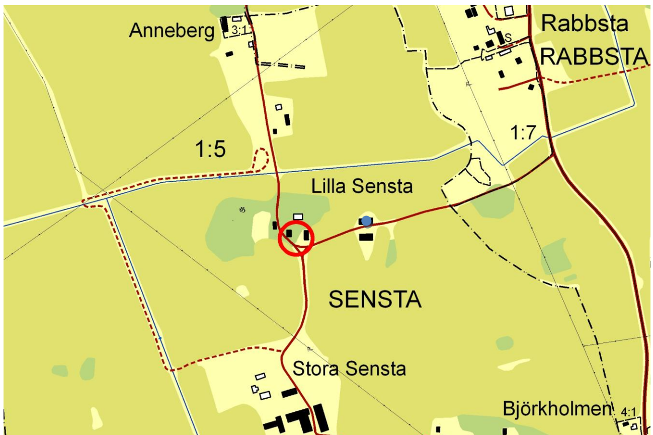
Fastigheten ligger i Munktorp socken. Loftboden ligger till vänster i den röda cirkeln. Logen är markerad med blå prick. Utdrag ur digitala fastighetskartan från 2004. Skala 1: 6000.

Länsstyrelsen beviljade bidrag till åtgärderna i beslut med dnr 434-5817-12 samt journalnummer 2013-2288. För antikvarisk medverkan svarade Västmanlands läns museum genom antikvarie Fredrik Ehlton och ärendet innefattade endast slutbesiktning. Fredrik Ehlton har även sammanställt rapporten.