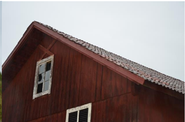
De nya vindskivorna utfördes likt de befintliga, med urtag för tegelpannorna.