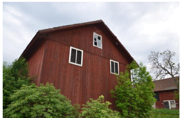
Logen har många mindre skador såsom krossade fönster.