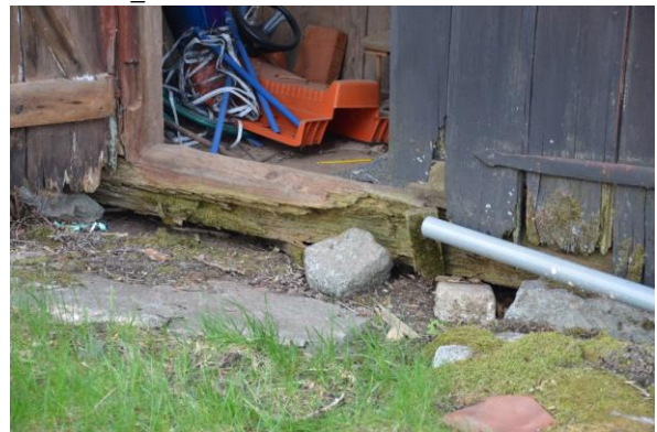
Den rötskadade syllstocken syntes vid byggnadens entré, skadorna var mer omfattande än beräknat. Foto: Vlm_kmvFE-2964.