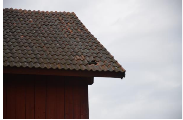
Taket hade hål och saknade på vissa ställen takpannor.