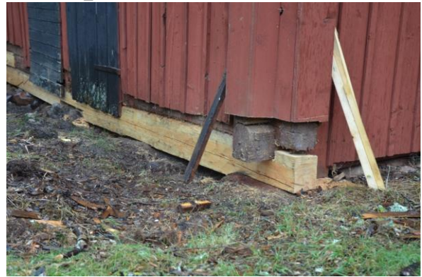
Lagning av syllstock.