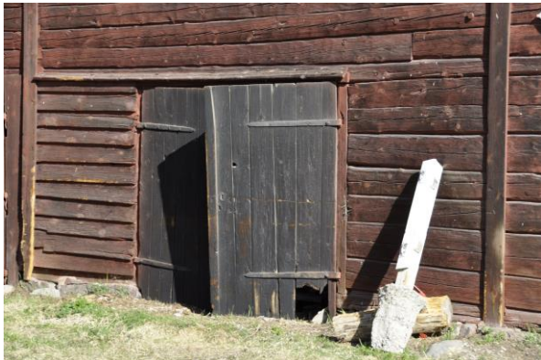
Norra stallets södra fasad, Vlm_kmvIM-2740