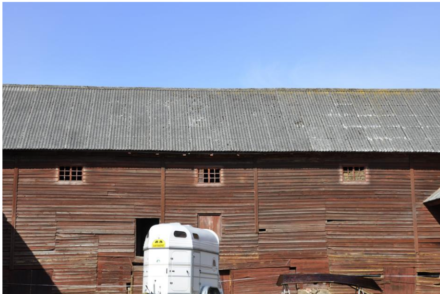
Logens östra fasad innan åtgärder, se omslagsbild för bild tagen efter åtgärderna. Vlm_kmvIM-2000