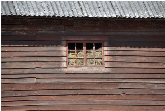
Logens östra fasad, Vlm_kmvIM-2760