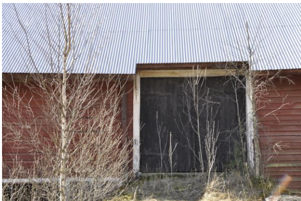
Norra stallets norra fasad, Vlm_kmvIM-2731