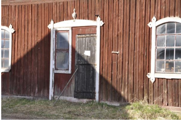
Dörr på södra stallet, Vlm_kmvIM-2735