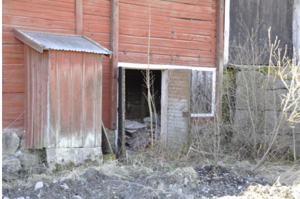
Norra stallets norra fasad, Vlm_kmvIM-2756