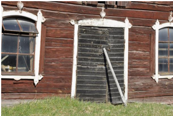
Norra stallets södra fasad, Vlm_kmvIM-2737