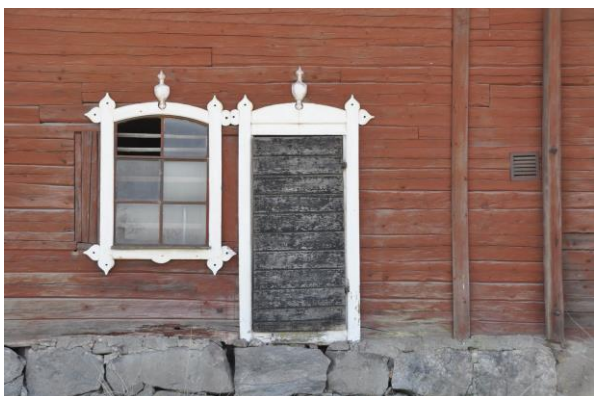
Norra stallets norra fasad, Vlm_kmvIM-2755