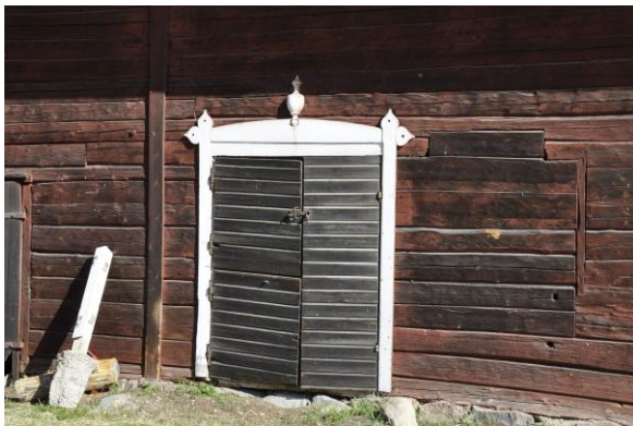
Norra stallets södra fasad, Vlm_kmvIM-2739