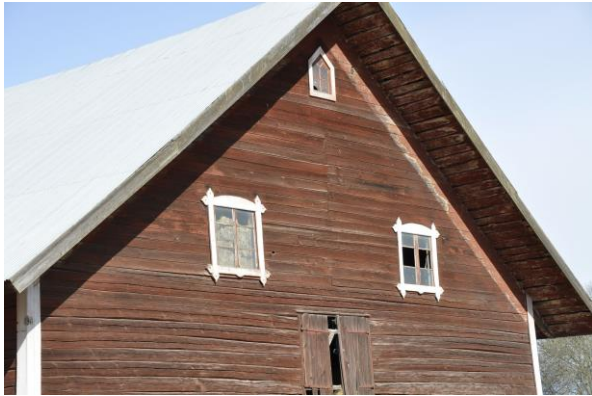
Norra stallets gavel, Vlm_kmvIM-2730