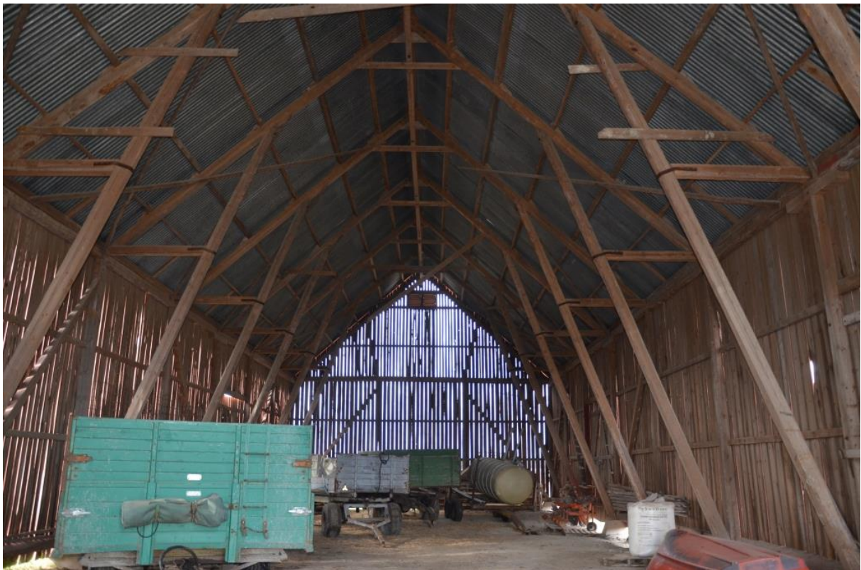
Ladans monumentala interiör innan åtgärder. Vlm_kmvFE-2806