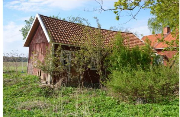
Norra långsidan, taket hänger på gavlarna. Vlm_kmvFE-2805