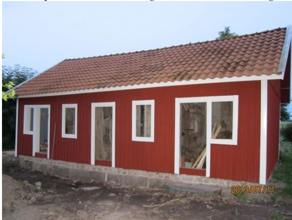
Byggnadens norra fasad.