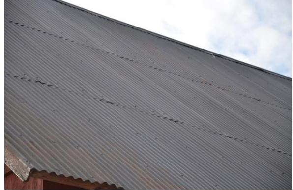
Takplåtarna släpper från takstolarna. Vlm_kmvFE-2809.