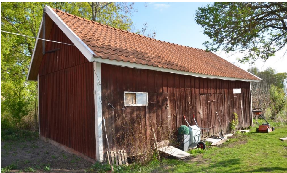
Herrskapsdassets södra långsida. Vlm_kmvFE-2803