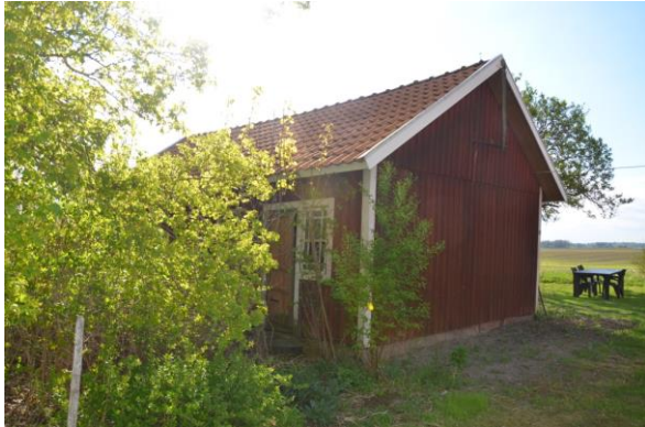
Västra gaveln. Vlm_kmvFE-2804