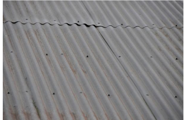
Takplåtarna skruvades fast. Vlm_kmvFE-4078