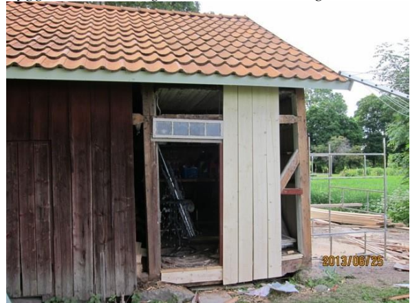
Utbyte av panel.