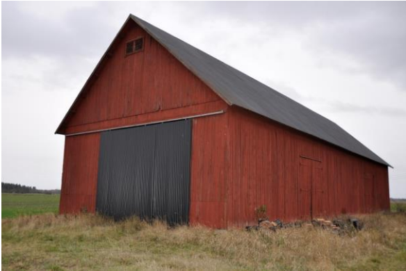
Ängsladan från norr. Vlm_kmvFE-4063