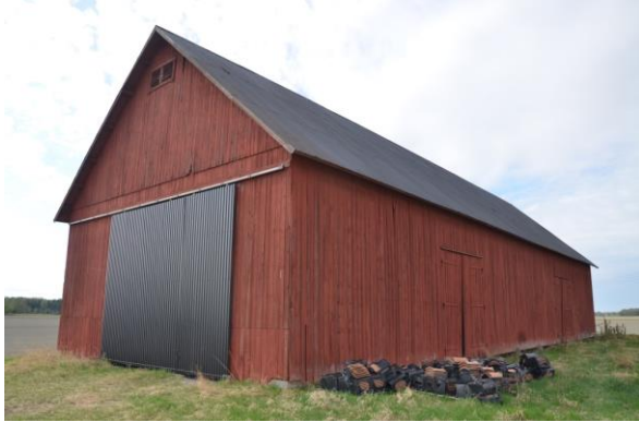
Ängslidan från norr. Vlm_kmvFE-2807