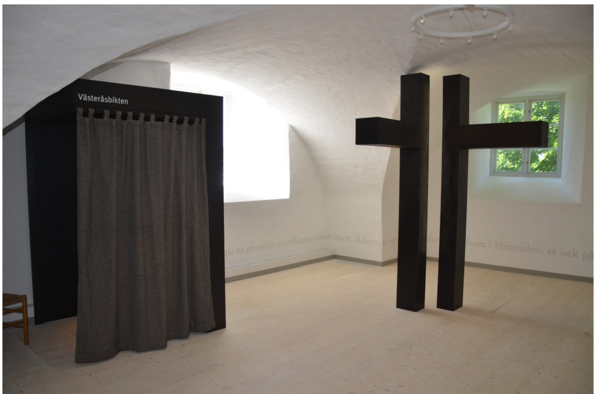
Bild 20, del av utställningen om Västerås slott av SFV