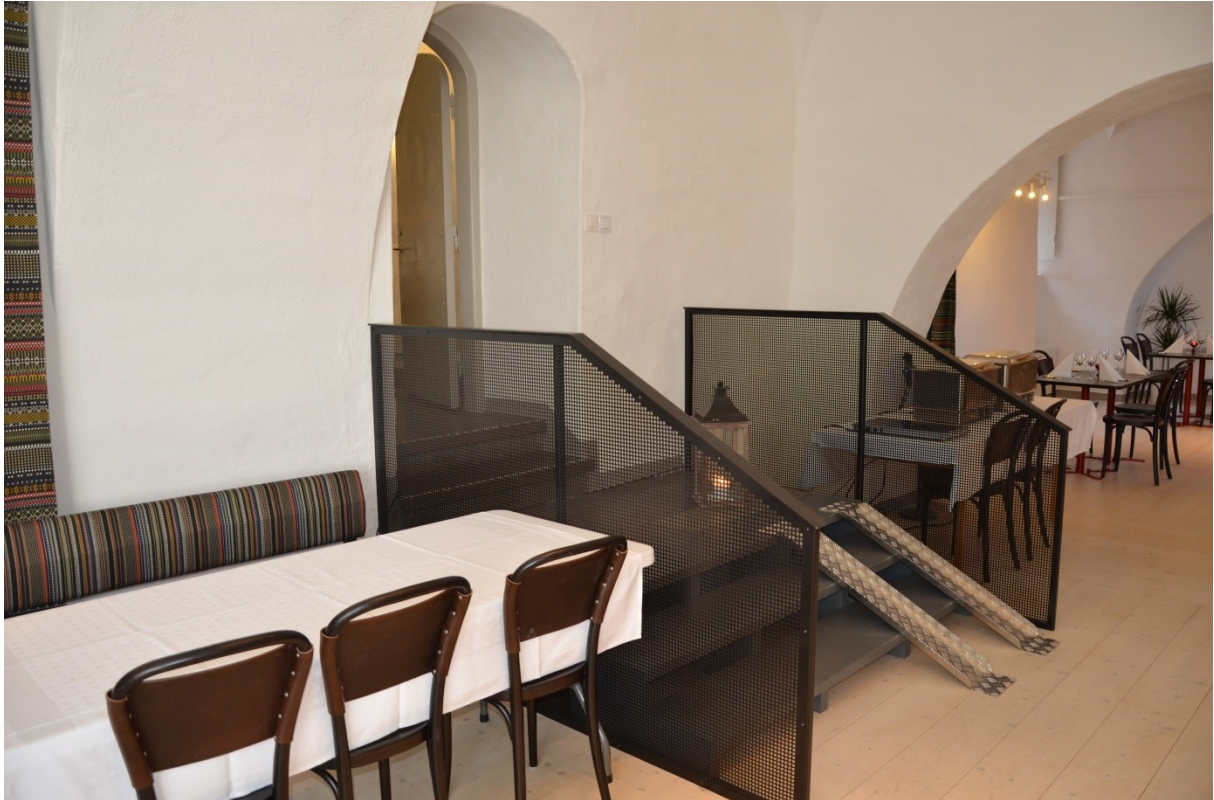
Bild 10, Ny trapp mellan rum 002 och 006