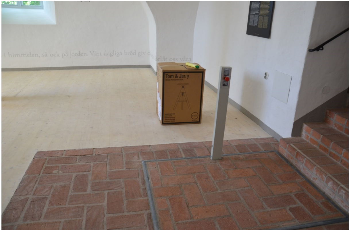
Bild 19, lyftbordet nedsänkt i tegelgolvet och det nya trägolvet