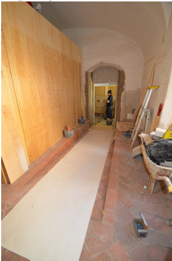
Bild 25, rampen klar och diskrummet påbörjat