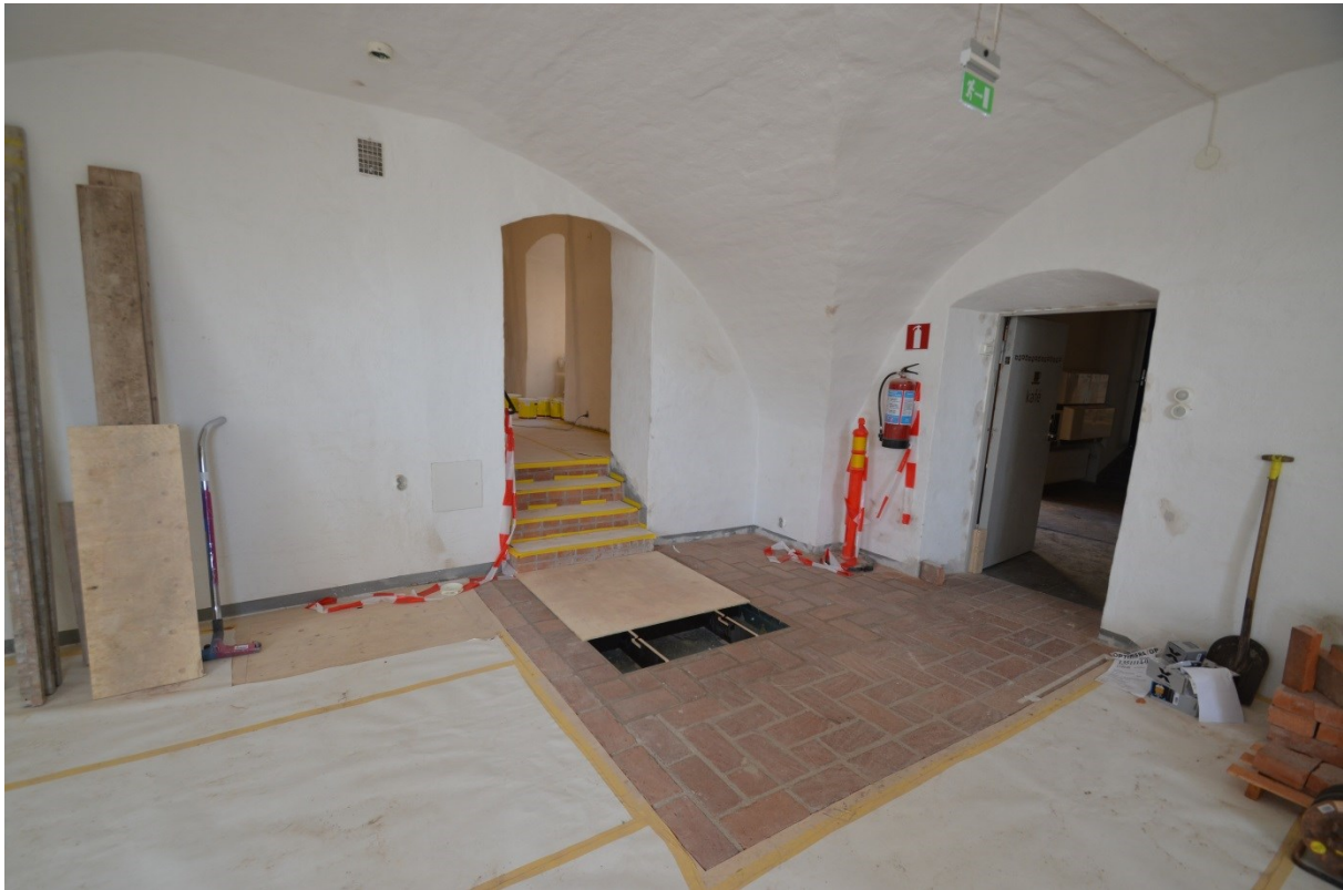
Bild 15, Nylagt trägolv som ger rummet en sammanhängande golvnivå

Inga ingrepp i stomme eller murar genomfördes.