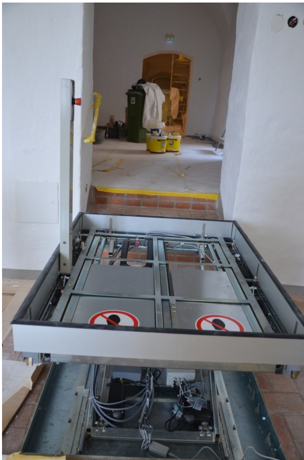
Bild 17, lyftbord under installation