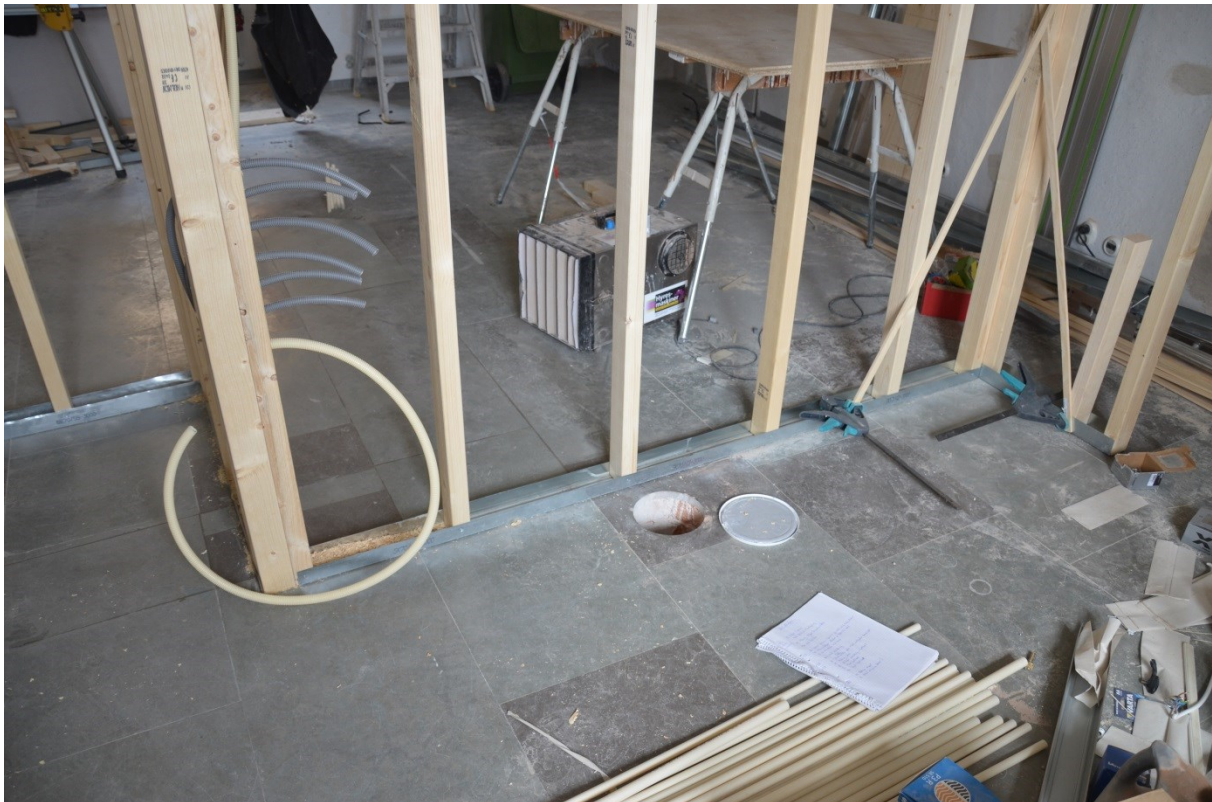
Bild 6, Håltagningen som den såg ut i rummet ovanför, det framtida köket