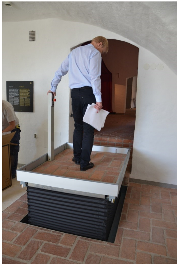
Bild 18, lyftbord installerat och i drift