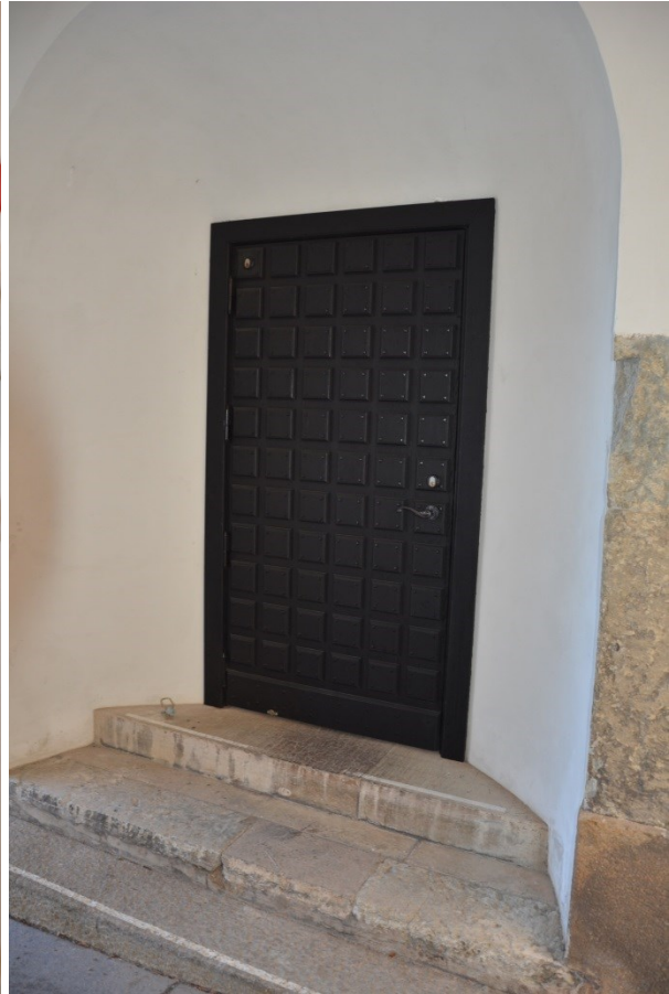
Bild 13, den nyttillverkade kopian av dörren