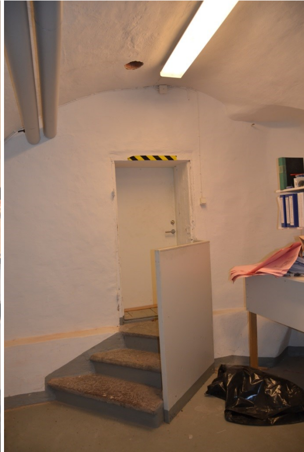
Bild 5, Efter håltagning