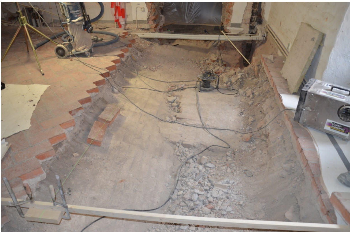
Bild 22, teglet borttaget och fyllning ned till källarens valvkappor