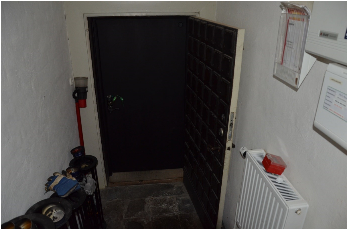
Bild 14, Den gamla dörren ställdes upp permanent på insidan