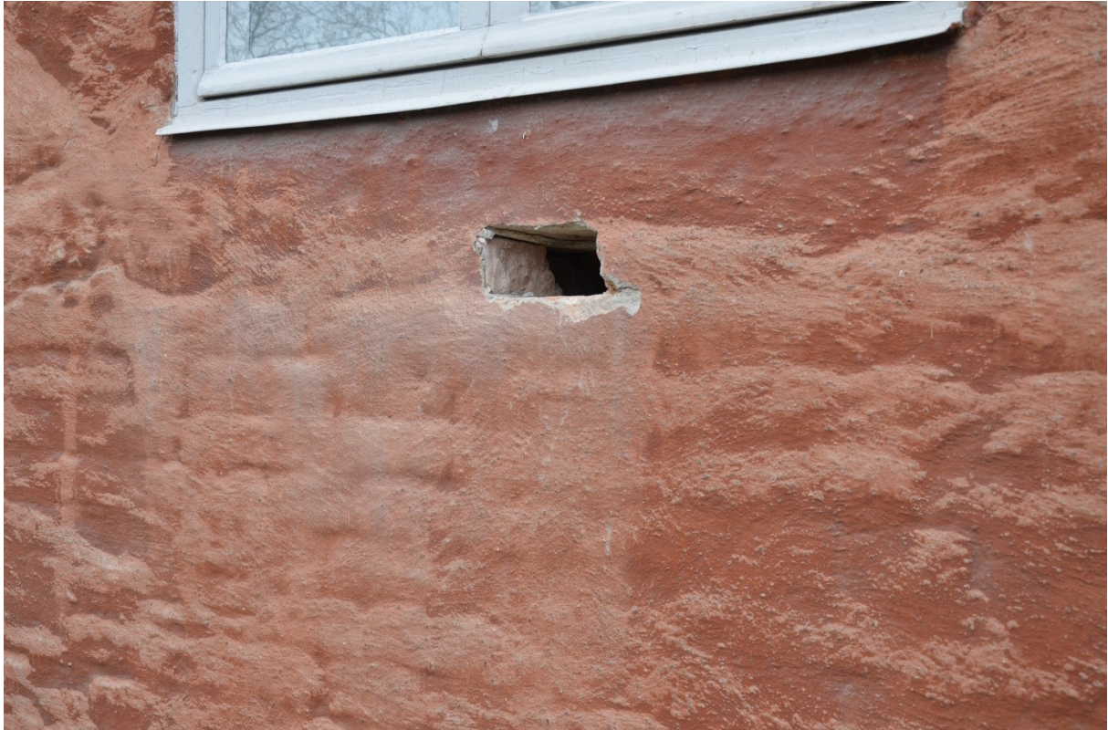
Bild 29, återupptagen kanal för ventilation in till diskrummet