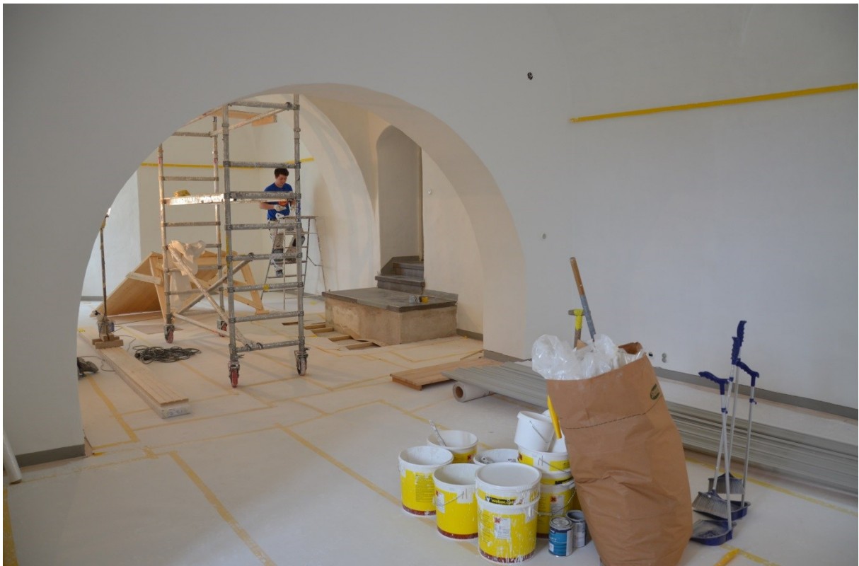
Bild 11, trappan på gång