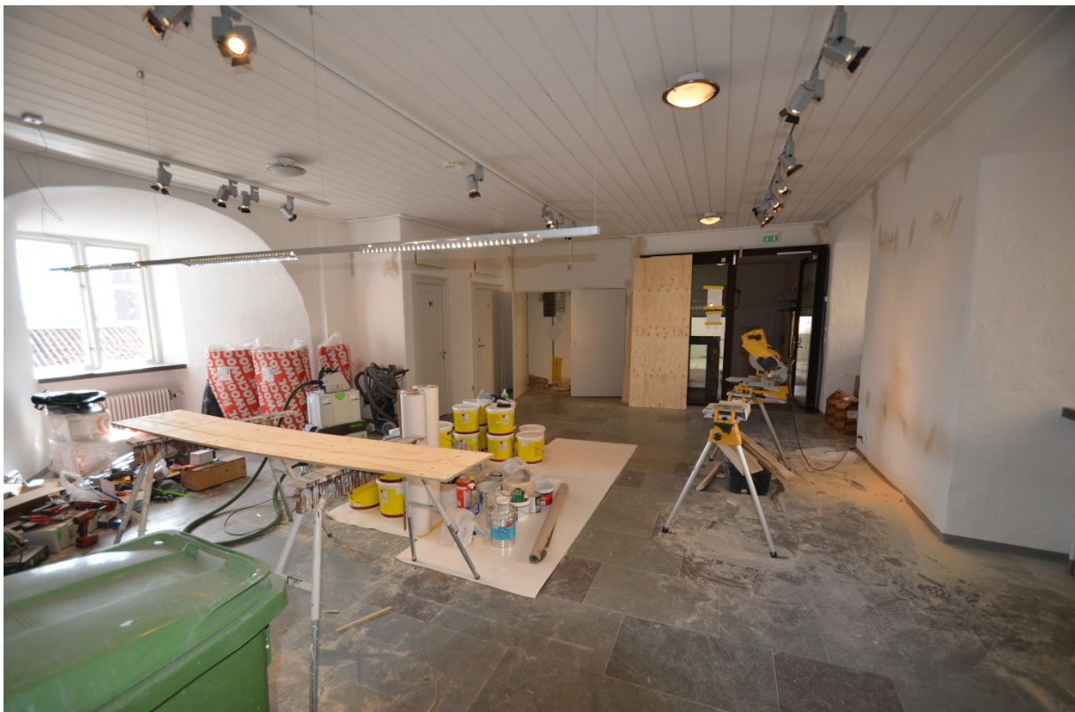
Bild 3, Rum 002 under ombyggnad

Enligt ansökan skulle ventilationen dras genom befintliga kanaler. Då arbetsmiljökrav ställer högre krav på tilluftmängder än beräknat gjordes en mindre avvikelse från ansökan. En ny håltagning i valvet var tvungen att genomföras för att få in luft via ett källarfönster från borggården. Alternativet var att göra hål i väggen in mot borggården. Åtgärden diskuterades på plats. Det första alternativet föredrogs då det ansågs göra minst inverkan på byggnaden. Valvet har redan flera håltagningar i sig, åtgärden är reversibel och ventilation kan dras in utan att inverka på upplevelsen av rummet. Det blir heller inga nya tillägg i fasad i form av till exempel ventilationsgaller.