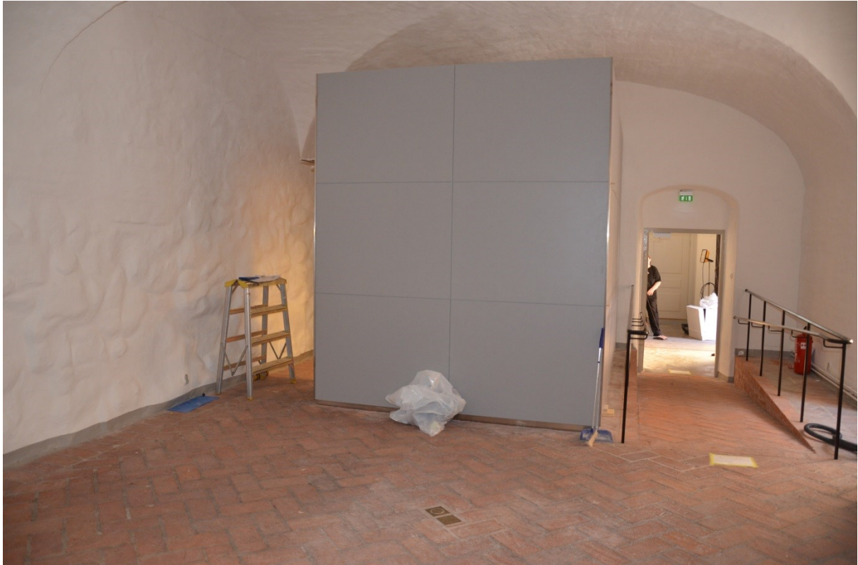
Bild 27, rampen har nu försetts med ett smidesräcke och diskrummet har klänts med grått skivmaterial