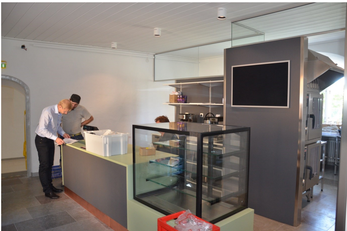
Bild 8, uppvärmningsköket på plats