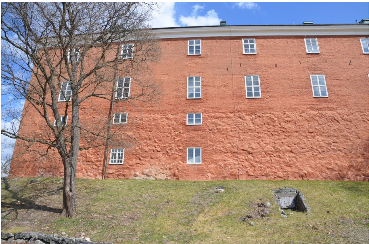
Bild 28, ventilationen in till diskrummet installerades genom en befintlig kanal i västra muren. På bilden är den fortfarande igensatt, under det andra fönstret från vänster i bottenplan