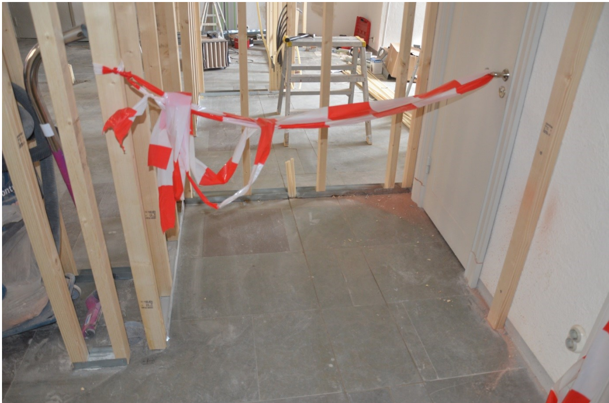
Bild 7, Ny ledningsdragnig gjordes i kanal i golvet genom att såg upp stensplattorna och sedan lägga tillbaka dem