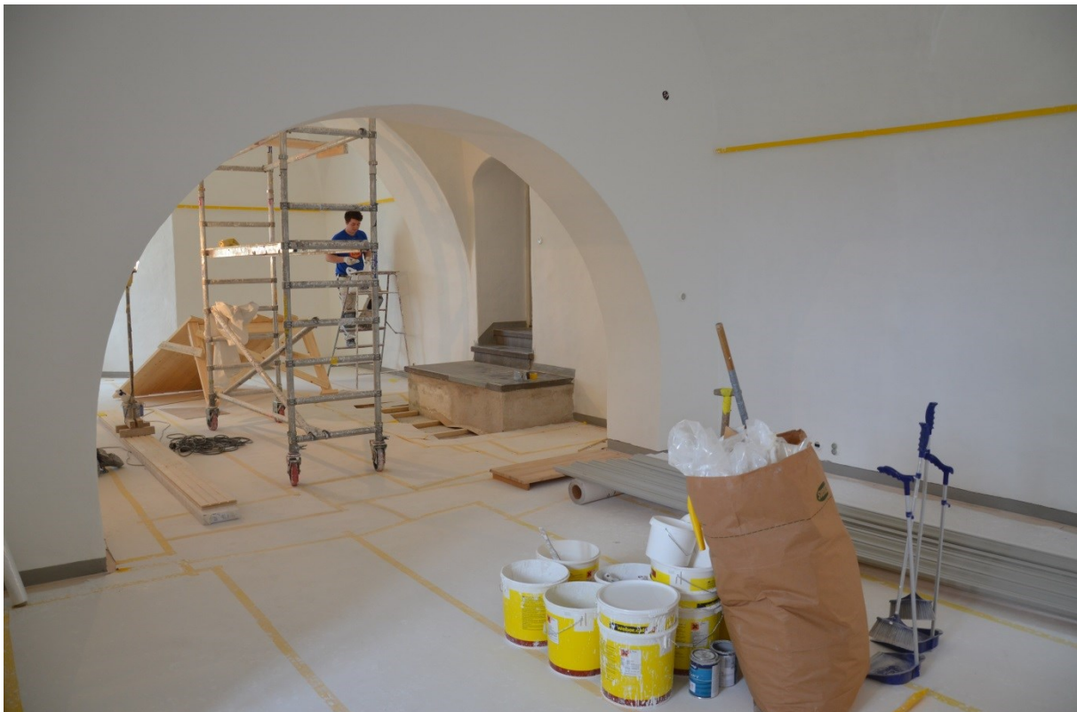
Bild 9, trappa mellan 026 och 027

Rum 009 som består av en mindre hall från borggårdsvalvet skulle anpassa till nya brandkrav. Dörren öppnades inåt vilket inte var godkänt enligt gällande regler kring brandsäkerhet. Förslaget var att vända på dörren med en del ingrepp i befintliga murar. Efter diskussion bestämdes det att en kopia av den gamla dörren skulle tillverkas och sättas dit. Den befintliga dörren skulle ställas upp och lämna kvar som ett pedagogiskt inslag i miljön. Inga ingrepp i stomme eller mur genomfördes.