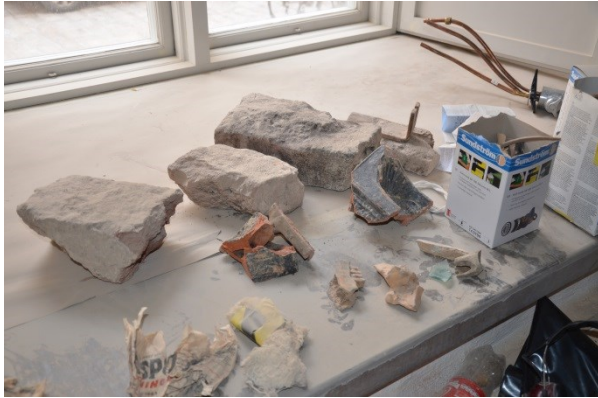
Bild 23, i fyllningen fanns bl a kakelugnsdelar, tidningar och djurben