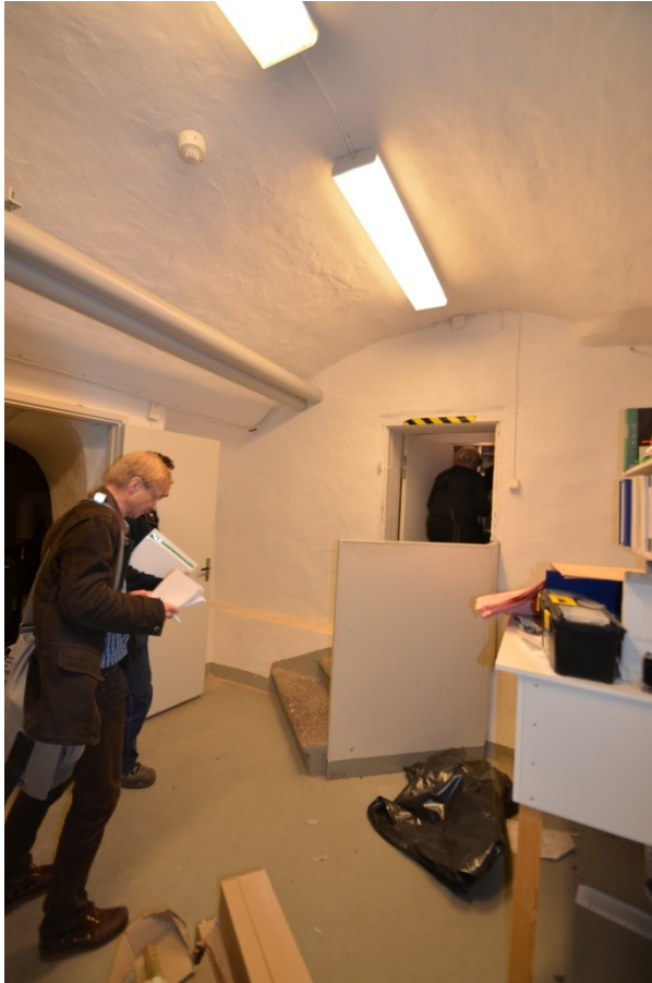
Bild 4, Källare direkt under kök innan håltagning