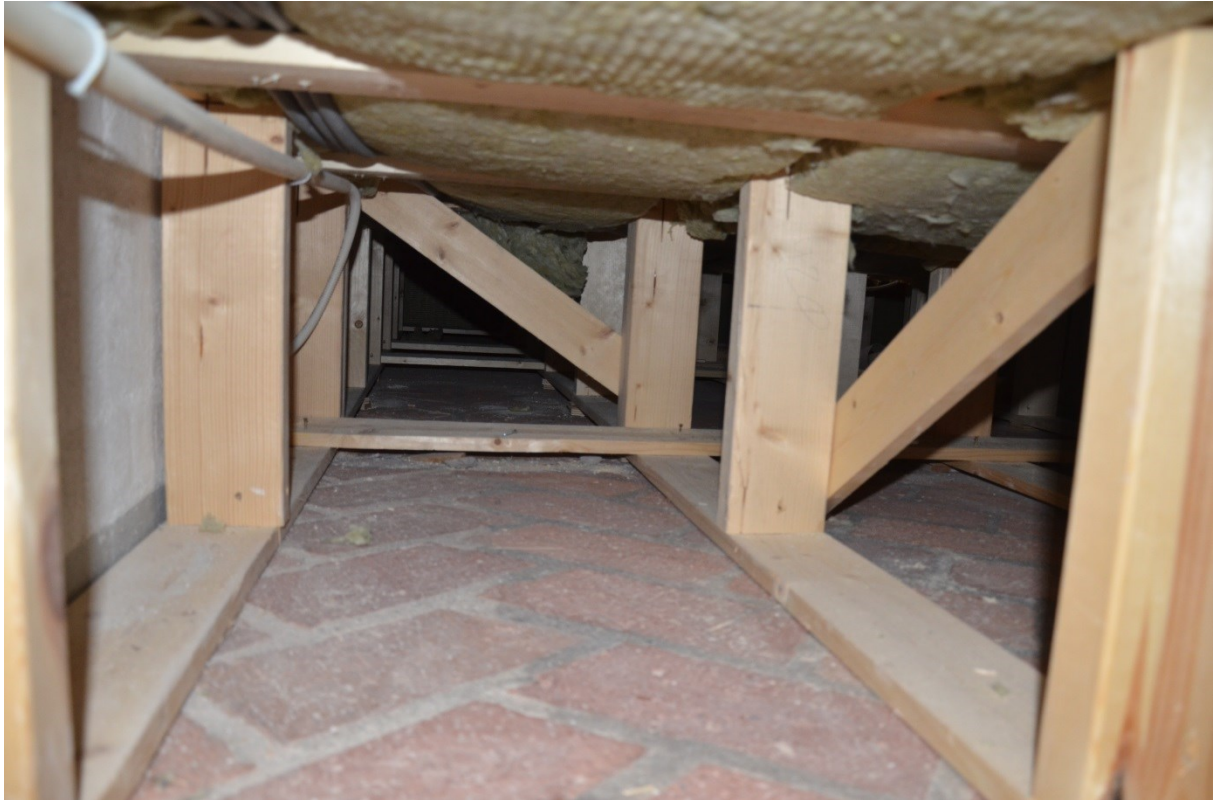
Bild 16, höjd golvnivå i rum 027