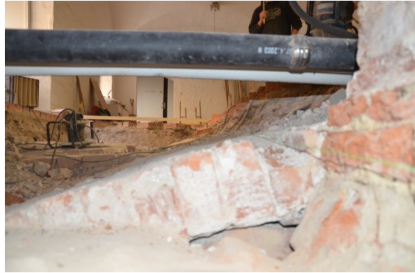
Bild 24, uppstickande valv från källaren