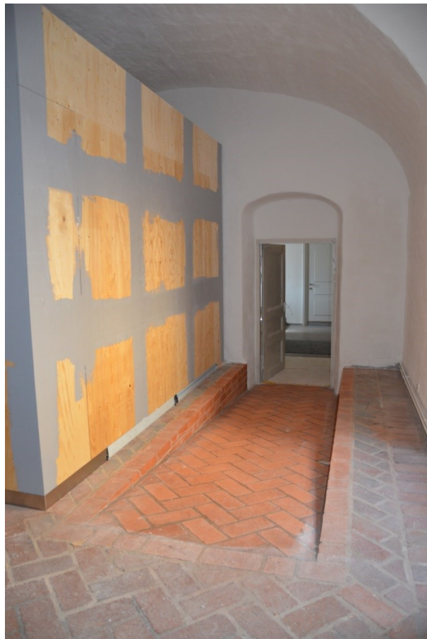
Bild 26, dörrpartiet färdigställt