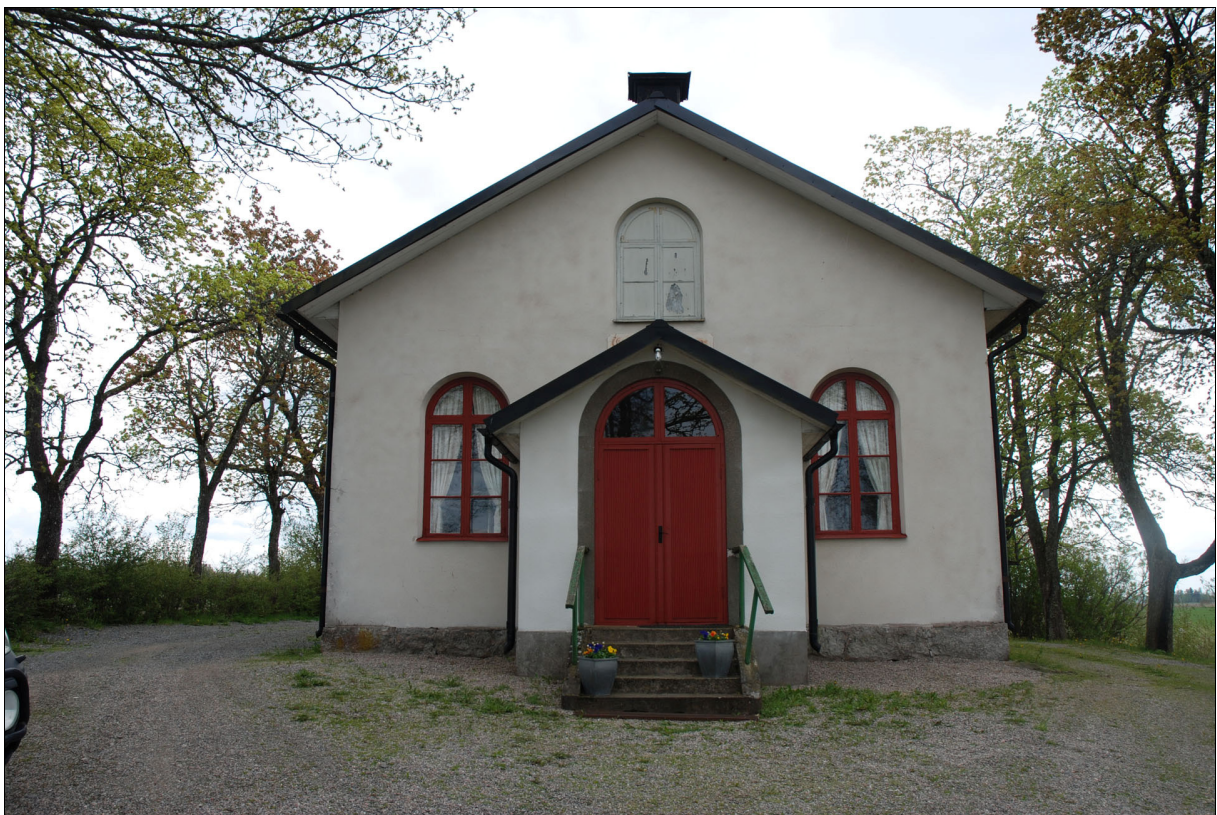
Bild 2: Byggnadens norra fasad före restaureringen. Församlingen hade sedan tidigare målat dessa fönsterbågar i den önskade röda kulören. Fönsterbågarna restaurerades på nytt i detta projekt.