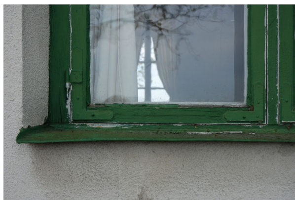
Bild 4 och 5: Behovet av restaurering var stort eftersom kitt hade fallit bort på flera fönsterbågar.