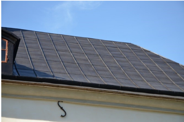
Bild 12, Detaljbild av nymålat tak