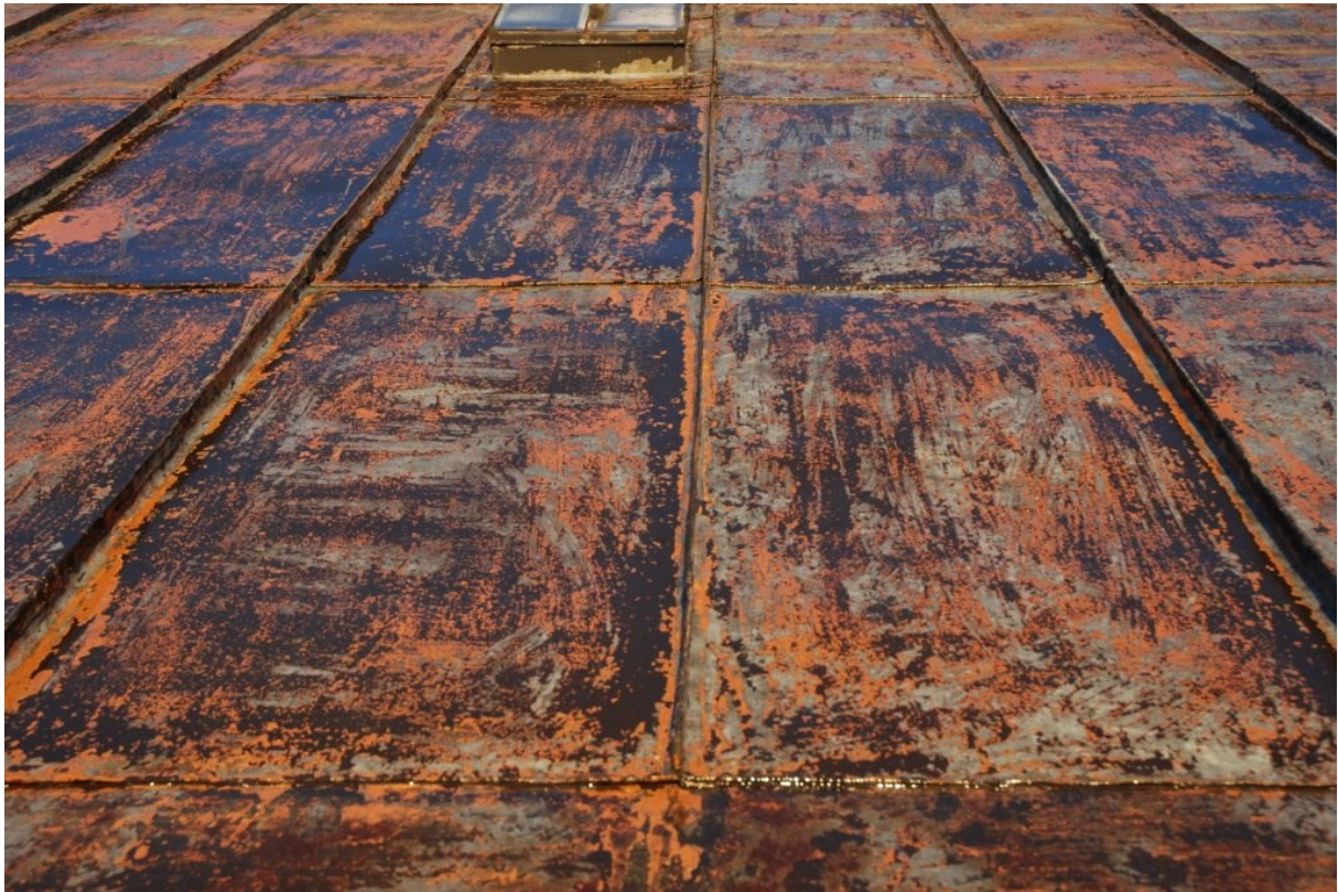
Bild 6, Efter den första rengöringen