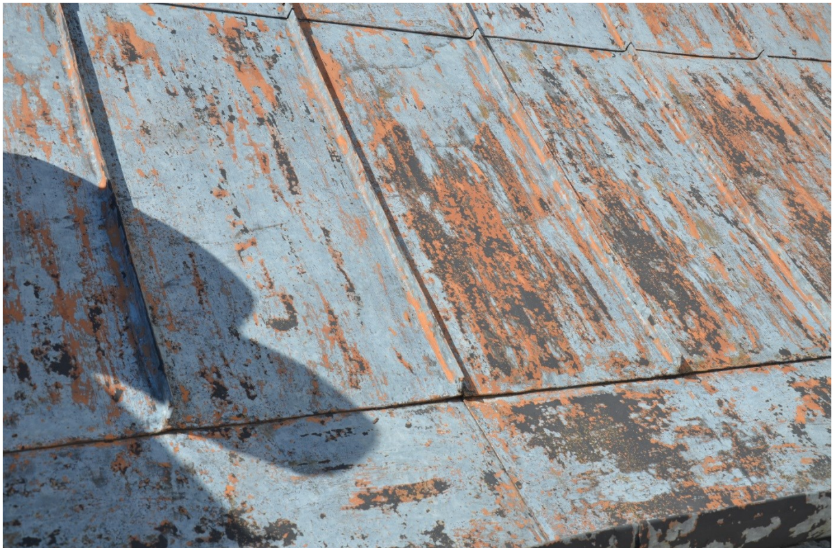
Bild 8, Resultatet var mycket tillfredställande och ytorna var tillräckligt rena