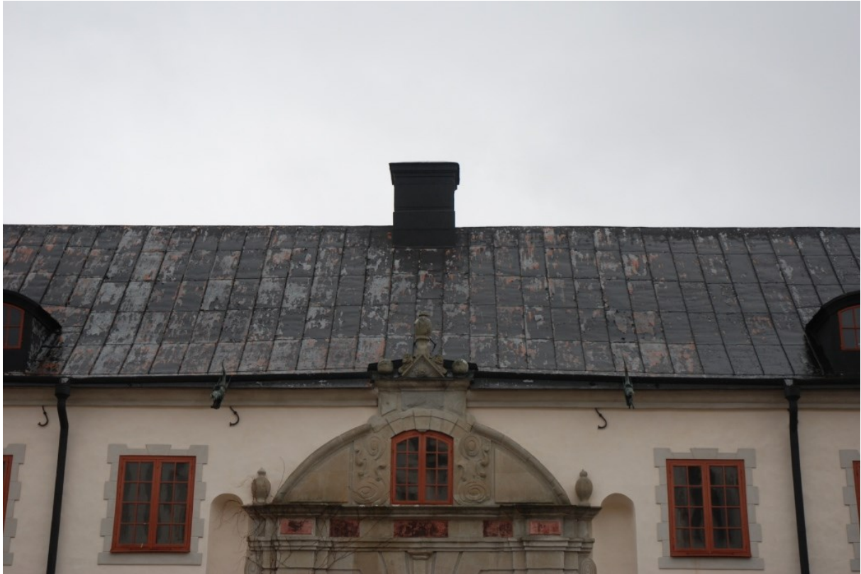
Bild 3, Tidö slott i oktober 2012 under pågåend rengöring.