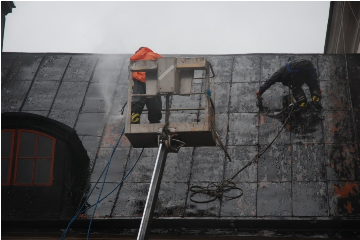
Bild 4, Pågående vattenblästring