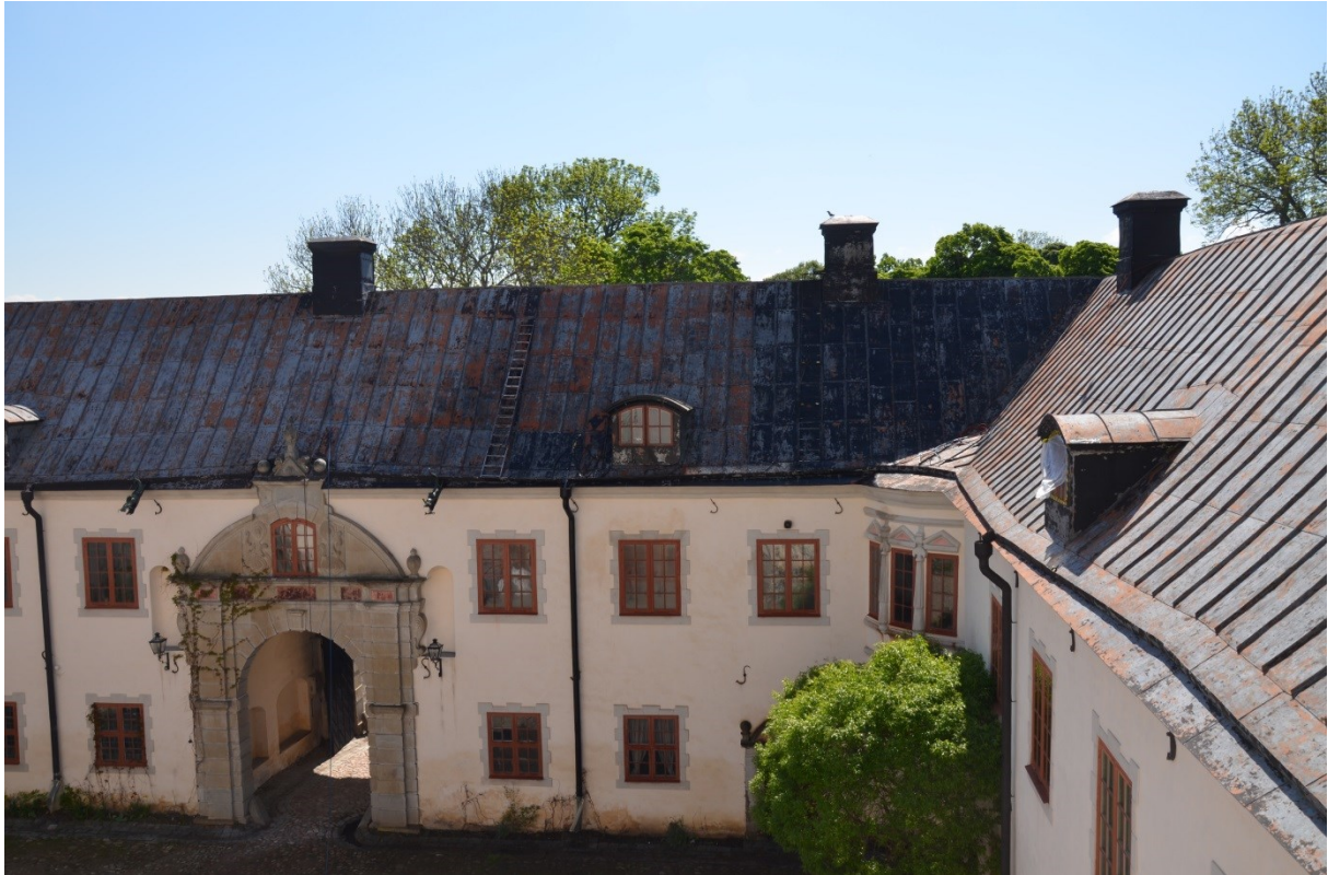
Bild 7, Under arbetet med den andra rengöringen då taket stått orört i ca 6 månader