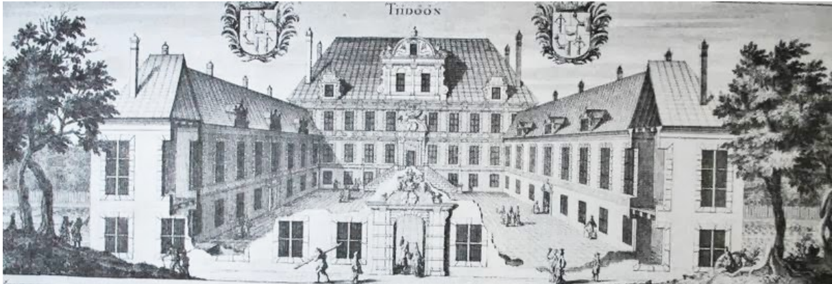
Tidö slott finns avbildad i Erik Dahlbergs Suecia antiqua och ser något annorlunda ut än idag. 1

Det nuvarande slottet är byggt i stram holländsk renässansstil på en grund av gråsten och murverk av slätputsat tegel. Huvudbyggnaden av rektangulär form i tre våningar under säteritak samt tre sammanhängande längor i två våningar med sadeltak, skapar en kringbyggd kvadratisk förgård. Ursprungligen täcktes taket av kopparplåt. Idag är taket skivtäckt med varmförzinkad plåt och horisontella tvärfalsar. Taket är målat i svart kulör.