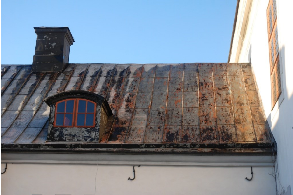
Bild 5, Tidö slott efter första rengöringen