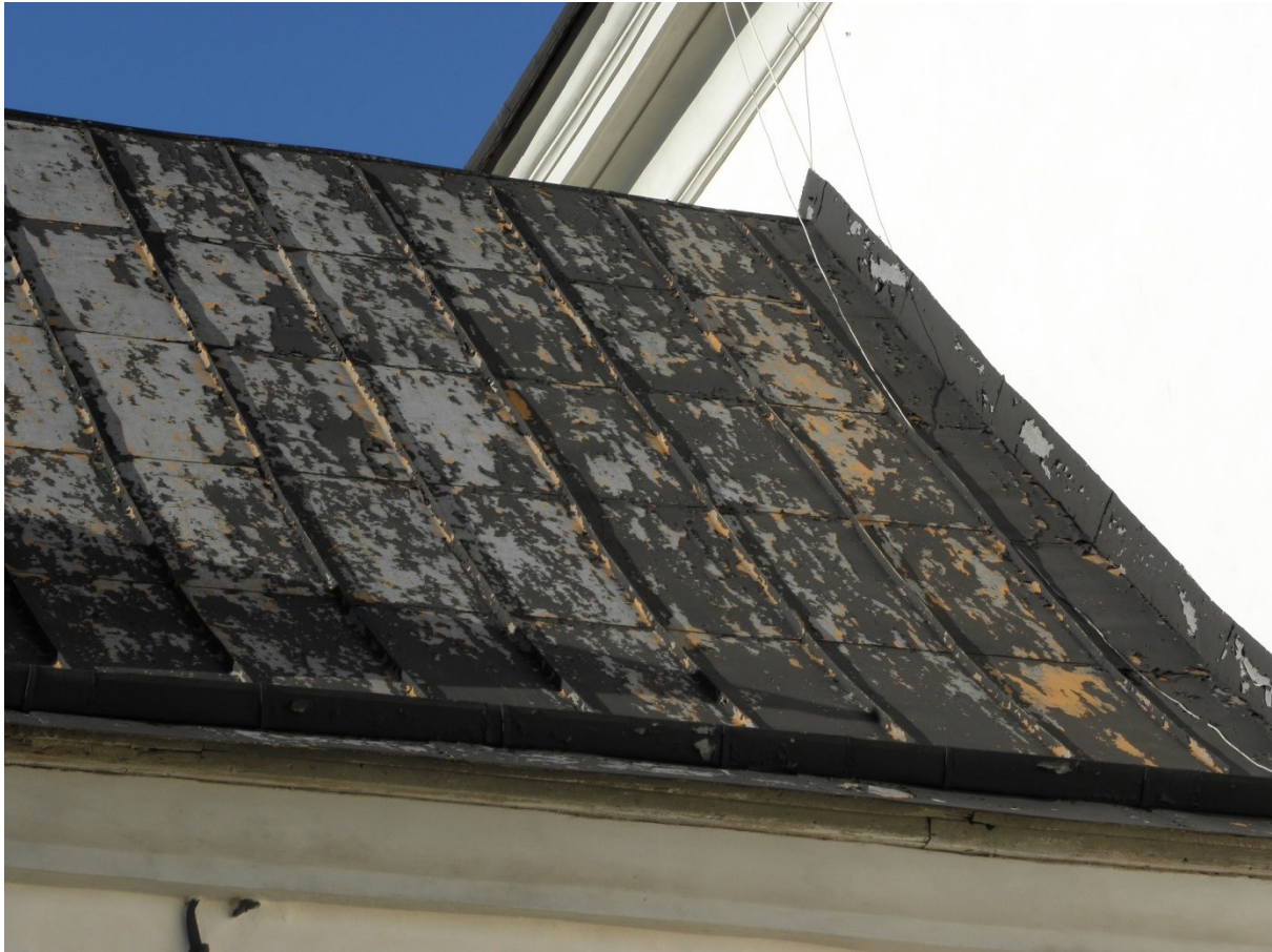
Bild 2, taket skick innan målning

Taket var slitet och i stort behov av ommålning. Färgen hade på vissa ställen fallit bort och spruckit vilket medfört sig rostskador.