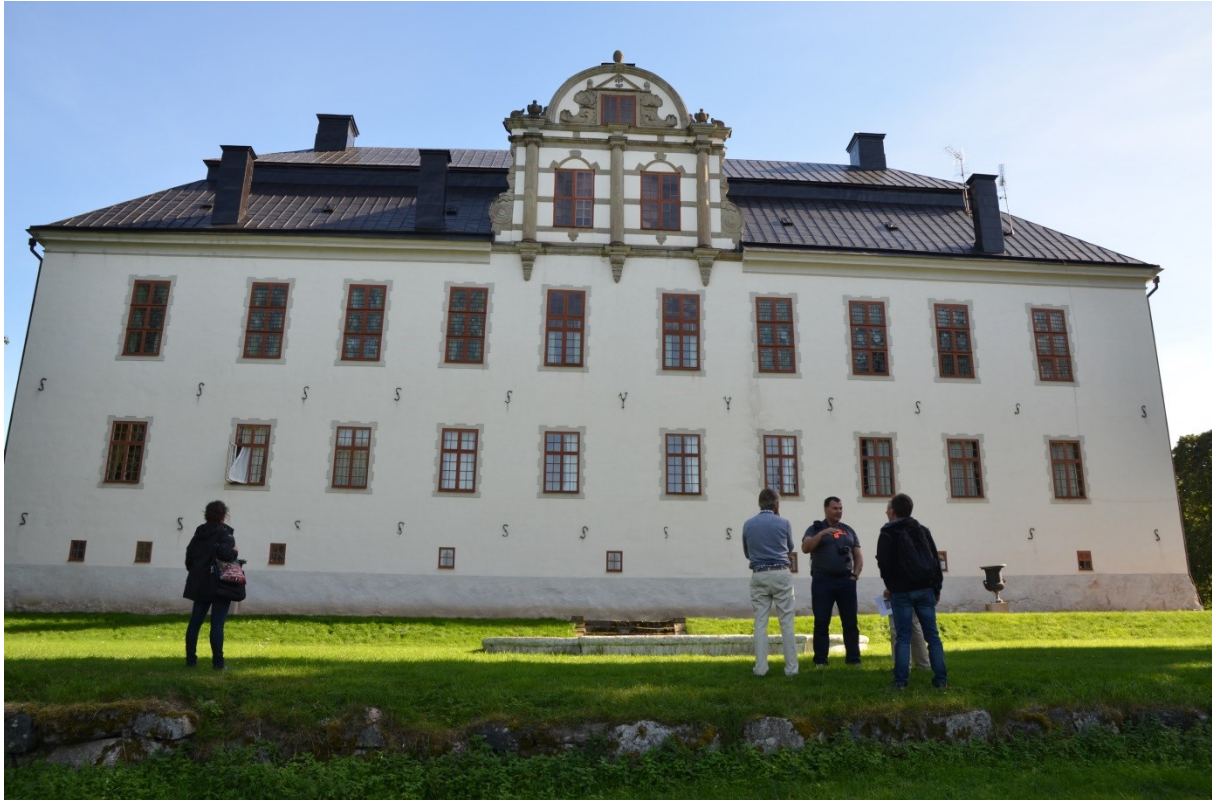
Bild 11, under slutbesiktning, slottets sydöstra fasad