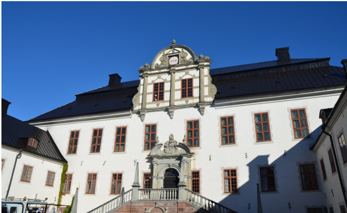
Bild 9, Efter slutstrykning med linoljefärg

Slutstrykning skedde sedan med svart linoljefärg (Pentur kultur) i två lager. Det sista lagret drogs med borste för att jämna ut ytan. 4