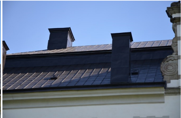
Bild 13, Detaljbild av nymålat tak