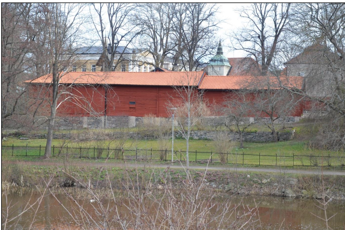
Biskopens stallar efter takomläggning. Vlm_kmvFE-4302