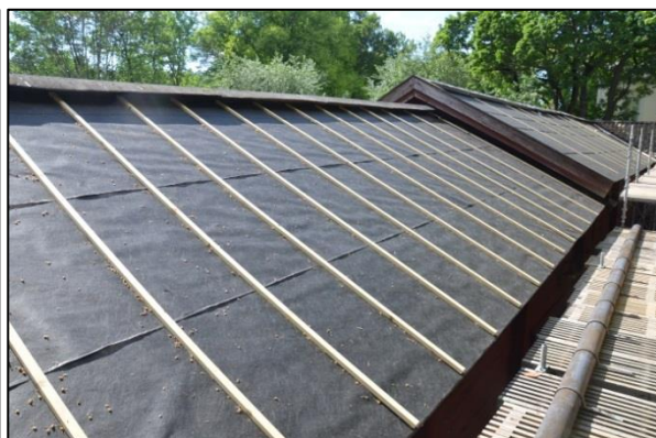
Nytt underlagstak med ströläkten utlagd. Vlm_kmvFE-3032