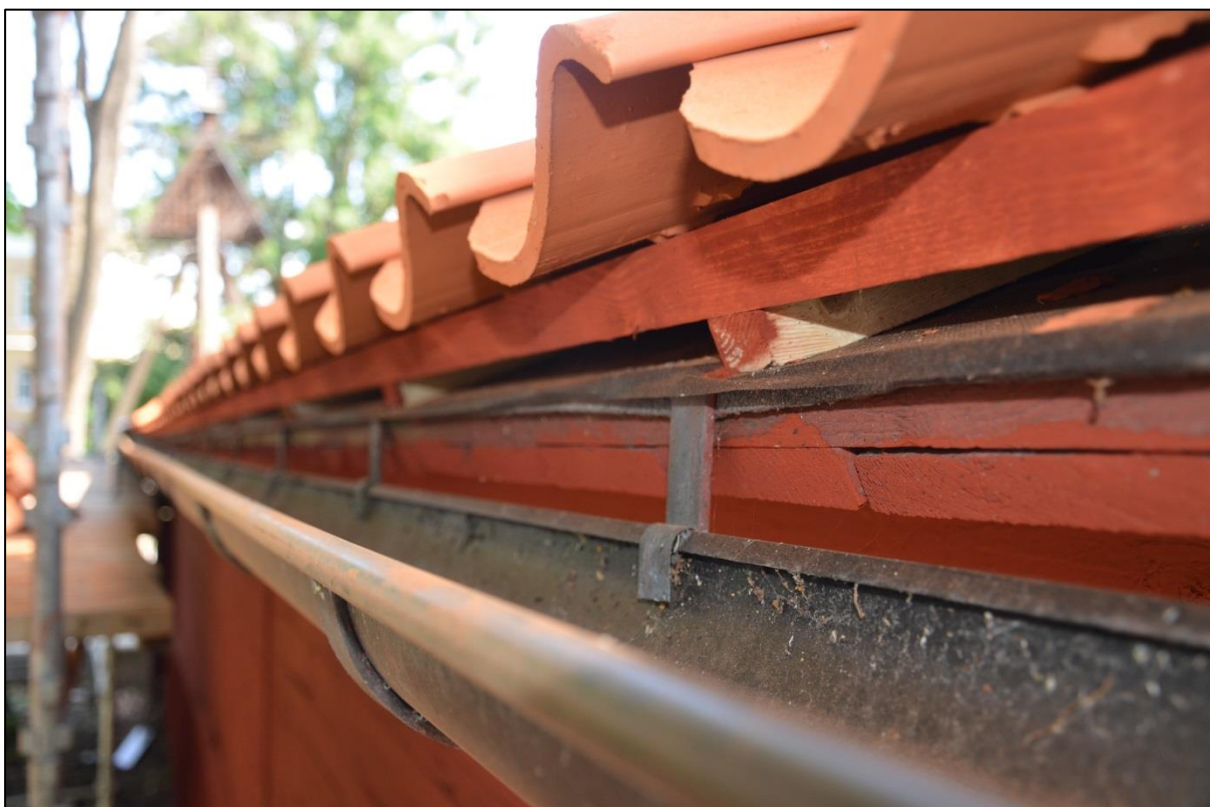
Läktning och nya pannor. Vlm_kmvFE-3402