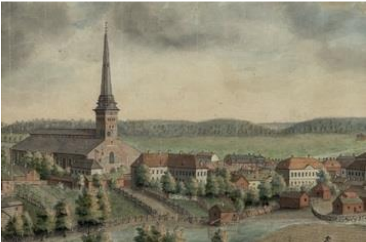
Detalj av målning från 1780-talet av Elias Martin.

Biskopens stallar är troligen uppförda under 1700-talet och förekommer på en avbildning av området av Elias Martin från 1780-talet.