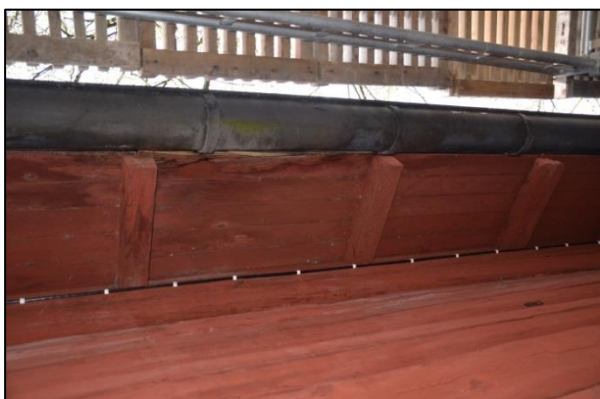
Takutsprång innan omläggning. Vlm_kmvFE-2813