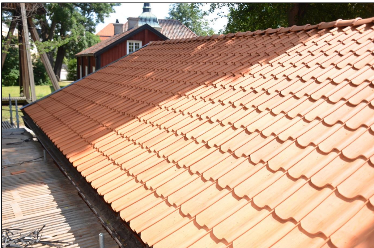
Omlagd del av taket. Vlm_kmvFE-3399