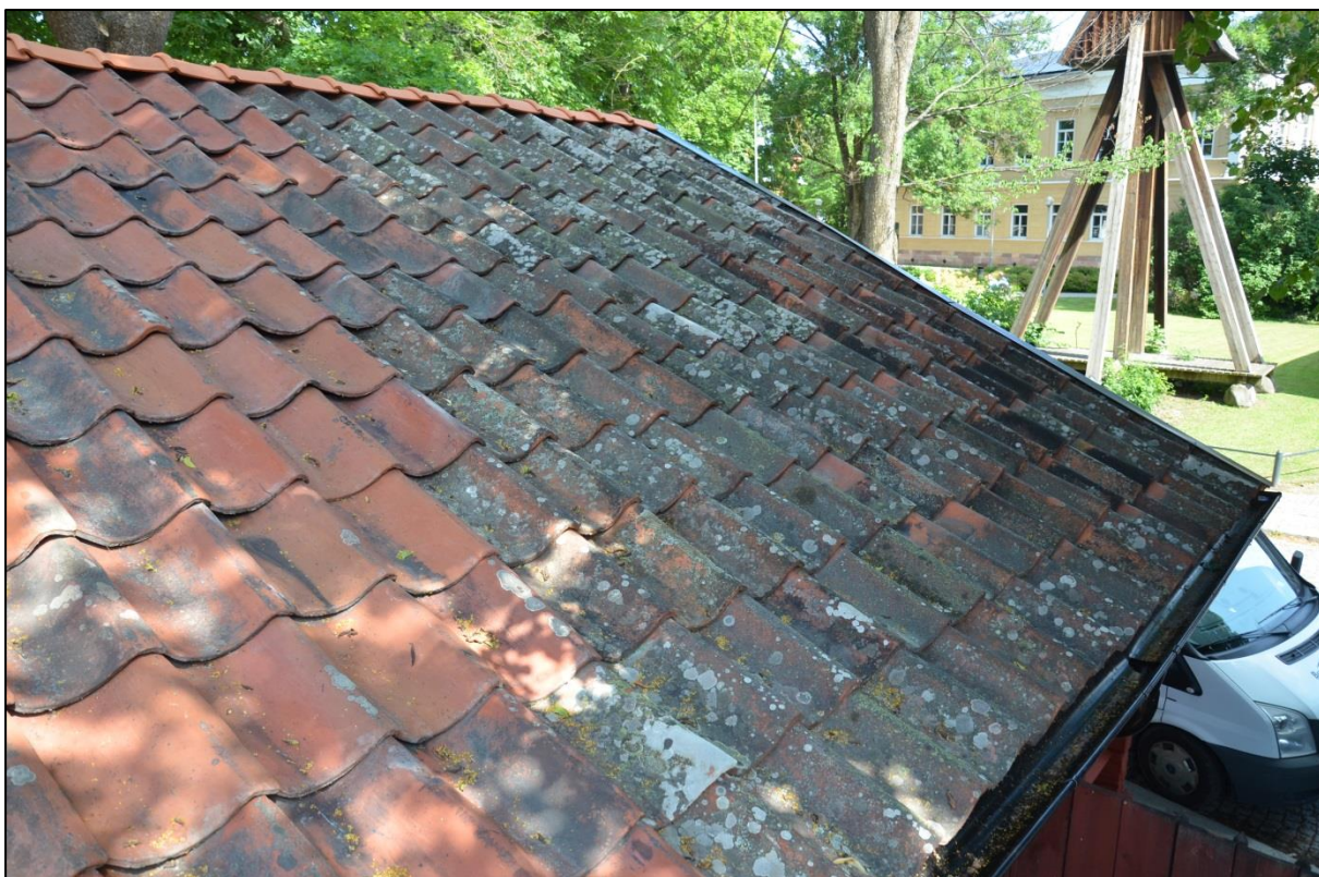
Äldre återvunna pannor i takfall mot Västra kyrkogatan. Vlm_kmvFE-3405