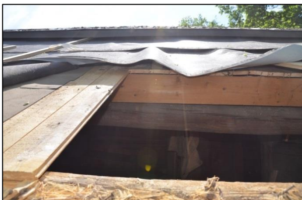
Taket under renovering, gamla takkonstruktionen Synlig. Vlm_kmvFE-3020