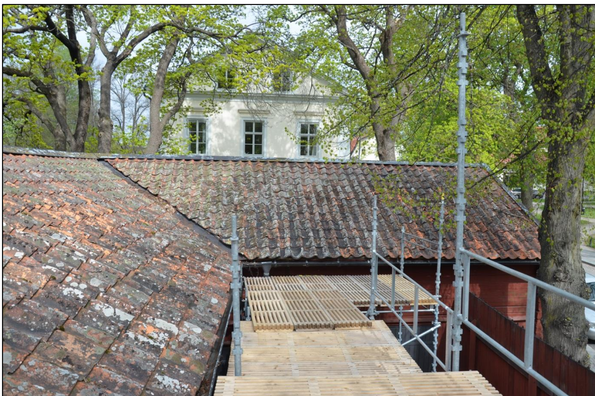
Taket innan omläggning. Vlm_kmvFE-2812