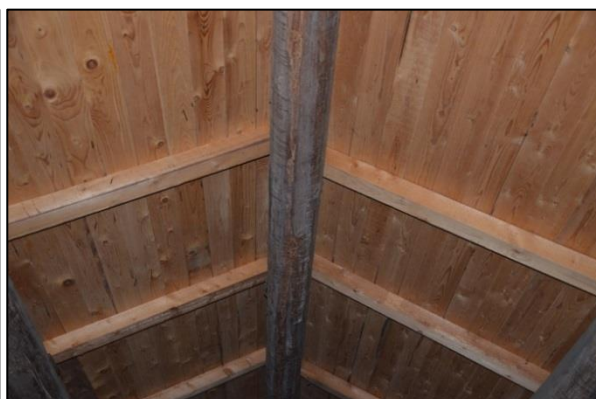
Undertak från insidan innan omläggning. Vlm_kmvFE-2816