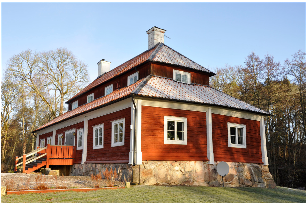
Bild 1: Valsta säteris huvudbyggnad från söder före skorstensrestaurering. Den södra skorstenen är närmast kameran. Notera skillnaden med den norra, putsade, skorstenen.

Den södra skorstenen var målad med vit färg direkt på teglet. Enligt en undersökning som fastighetsägaren gjort tillsammans med Wallins Bygg AB i Köping var färgen en plastfärg. Skorstenens färg flagnade kraftigt och vissa spjälkningsskador fanns på teglet, förmodligen till följd av målningen med plastfärg. Eftersom den norra skorstenen var putsad och vitmålad ville fastighetsägaren låta putsa även den södra, för att ge byggnaden ett mer enhetligt uttryck.