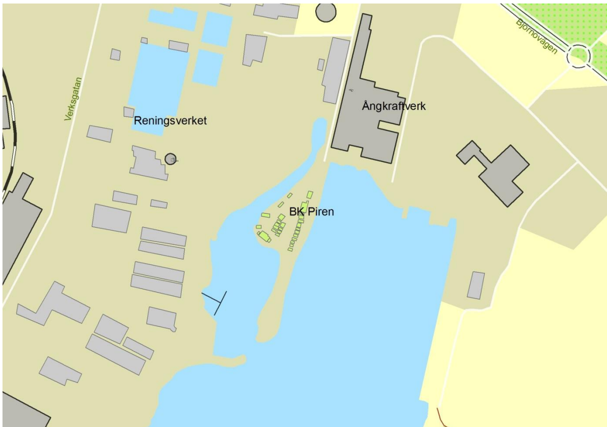
Karta över området kring BK Piren. Bodarna på Piren är markerade med grönt. Utdrag ur digitala fastighetskartan från 2004. Skala 1:4000.

Fråga om byggnadsminnesförklaring av BK Pirens plåt-och trähus med tillhörande skyddsområde väcktes av Eilif Petersen och K.G. Samourkas. Utredningens syfte är att bilda ett kunskaps- och beslutsunderlag för byggnadsminnesärendet och redogöra för områdets kulturhistoriska värden. Då BK Piren inte bara består av en fysisk kulturhistorisk miljö genomfördes etnologiska studier av klubben och dess medlemmar. Det etnologiska perspektivet användes som underlag för att utreda områdets immateriella kulturvärden.