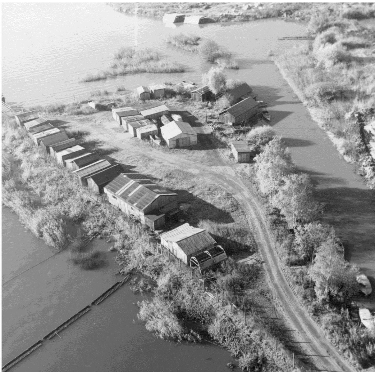
En tydlig bild över hur bebyggelsen på piren växer fram på 1950-talet. Flera av bodarna finns kvar idag. Foto från 1958. 18

På 1950-talet har piren fått den karaktär som finns bevarad än idag. Bodarna uppfördes med återvunnet material från bland annat ASEA:s verkstäder.