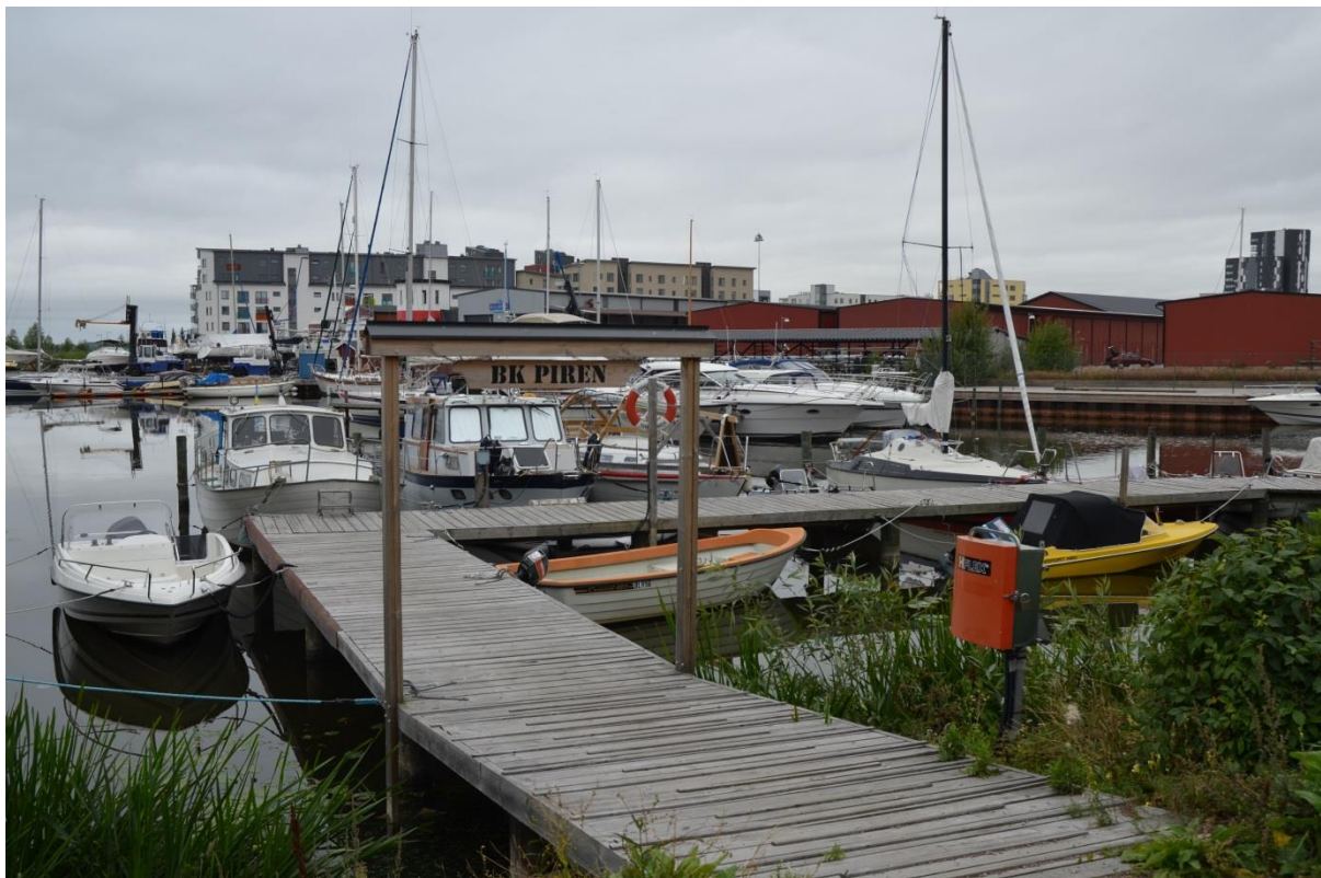
Vy över bryggan där BK-Pirens medlemmar har sina båtar.