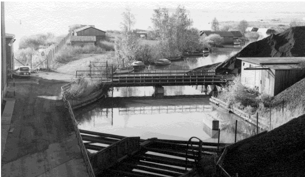
Foto troligen från 1950-talet. Båtverksamheten är väl etablerad på piren och bebyggelsen börjar likna dagens omfattning. Till höger i bild syns kolköarna som tillhör Ångkraftverket. 17

Bodbebyggelsen på piren växer succesivt men ingen formell båtklubb bildas. Piren blir en informell mötesplats där till och med hela familjer spenderar sin fritid. Båtarna används inte bara till nöje, många fiskar för att dryga ut matkassan. På 1950-talet har samlingen bodar vuxit och fyller ut piren.