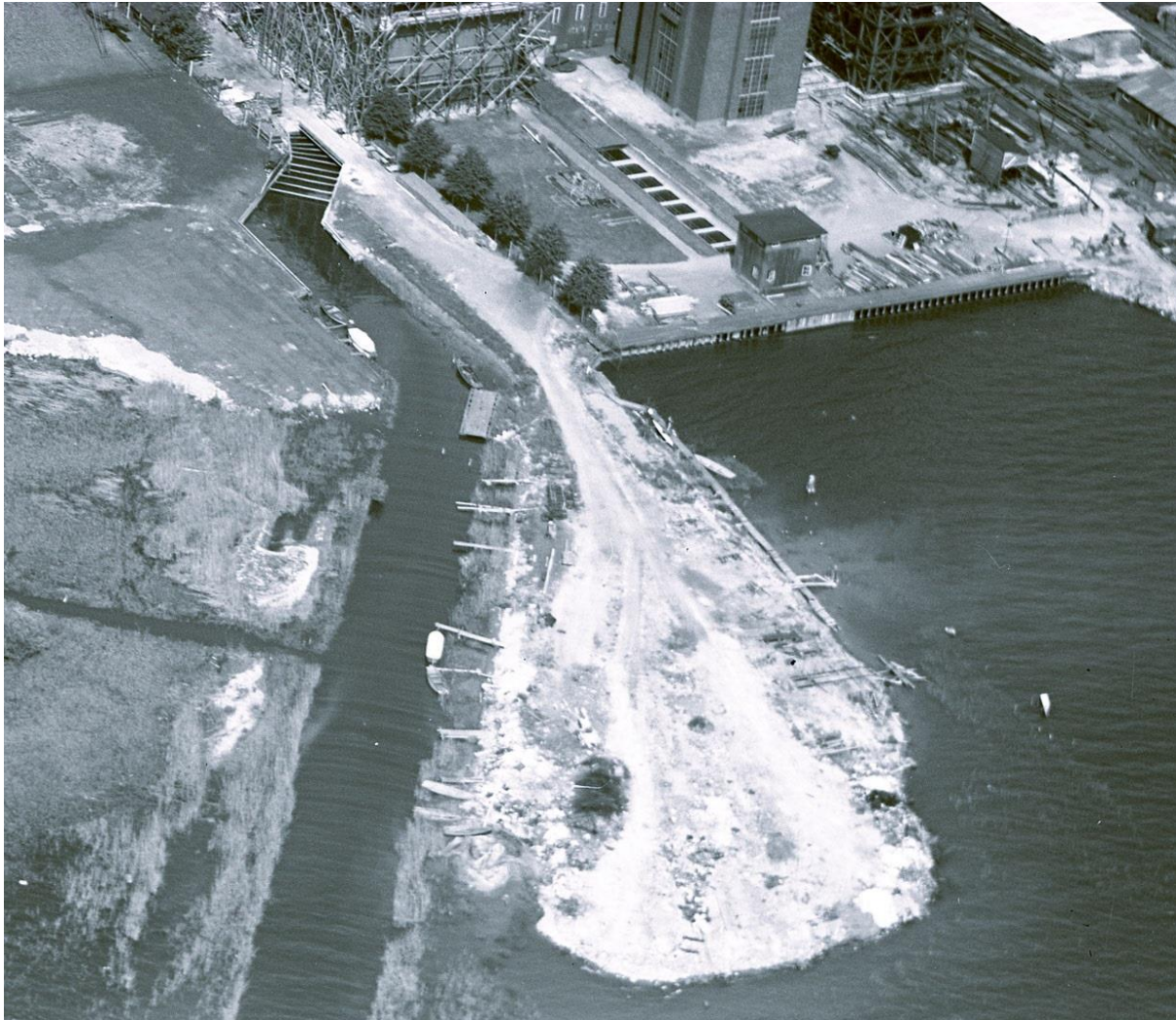
Flygfoto över piren och ångkraftverket. Bryggor har börjat att byggas och mindre båtar ligger i vattnet. Vlm_FLY 1015, Foto från 1930-talet början. 14

Piren består troligen av fyllnadsmaterial från tiden då ångkraftverket uppfördes 1915. Innan var här endast vassbevuxen våtmark och På häradskartan från 1905-11 syns inte piren. Båtverksamheten verkar kommit igång på 1920-talet, då i liten skala. På ett flygfoto från 1930-talets början syns bryggor och mindre båtar ligga i vassen. Enligt medlemmar i BK Piren ska de första bodarna byggts på 1930-talet.