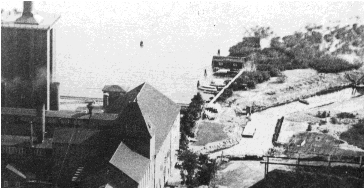
Bebyggelse har börjat växa fram på piren. Foto troligen från mitten av 1930-talet 16

På fotografier från senare delen av 1930-talet har några bodar uppförts och båtlivet kommit igång ordentligt och en brygga kan ses gå ut i vattnet.