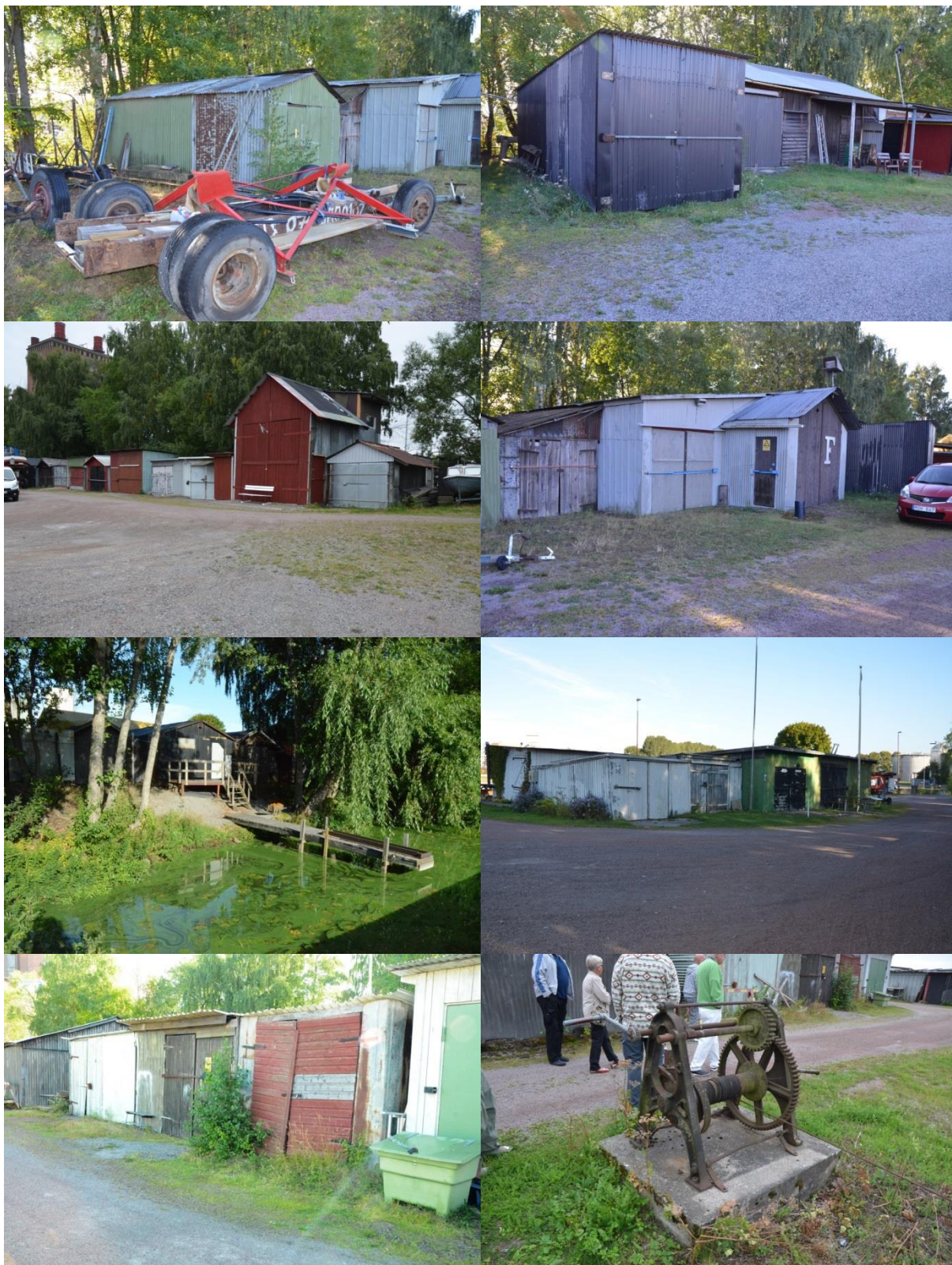
Foton som ger en uppfattning om bebyggelsens karaktär på BK-Piren. Foto: Vlm_kmvFE-3627, Vlm_kmvFE-3629, Vlm_kmvFE-3596, 3628, Vlm_kmvFE-3642, 3635, Vlm_kmvFE-3647, Vlm_kmvFE-3592.