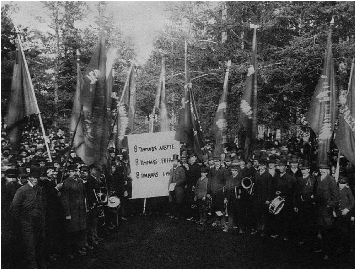
Foto från första maj demonstrationerna 1890 med plakat som kräver förändrade arbetsvillkor. 5

arbetstid. Man menade att dygnet skulle bestå av mer än bara arbete och vila. Parollen ”åtta timmars arbete, åtta timmars frihet, åtta timmars hvila” spriddes under första maj demonstrationerna i slutet av 1800-talet. De åtta timmarna av frihet skulle inte ägnas åt lättja, utan åt umgänge med vänner och familj. Dessutom ansågs det viktigt att vara politiskt aktiv och att utbilda sig. Möjlighet till fritid var långt in på 1900-talet en fråga om klass och social status. Ju mer det moderna samhällets välfärdsprogram utvecklades, ju mer demokratiserades också fritiden. 4 På 1930-talet ökade antal människor som fick möjlighet till fritid, mycket tack vare den lagstadgade semestern som infördes 1938.