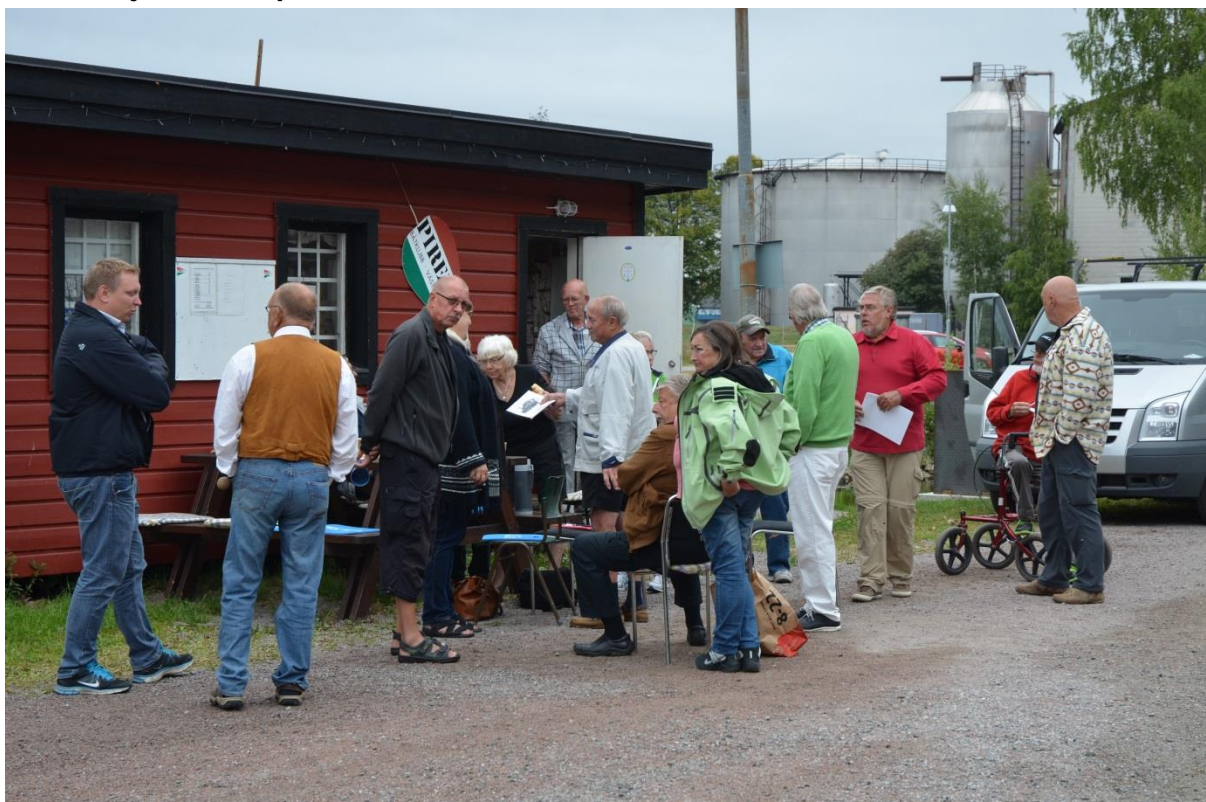
Medlemmar ur BK Piren under ett informationsmöte inför byggnadsminnesutredningen. Foto: Vlm_kmvFE-3586