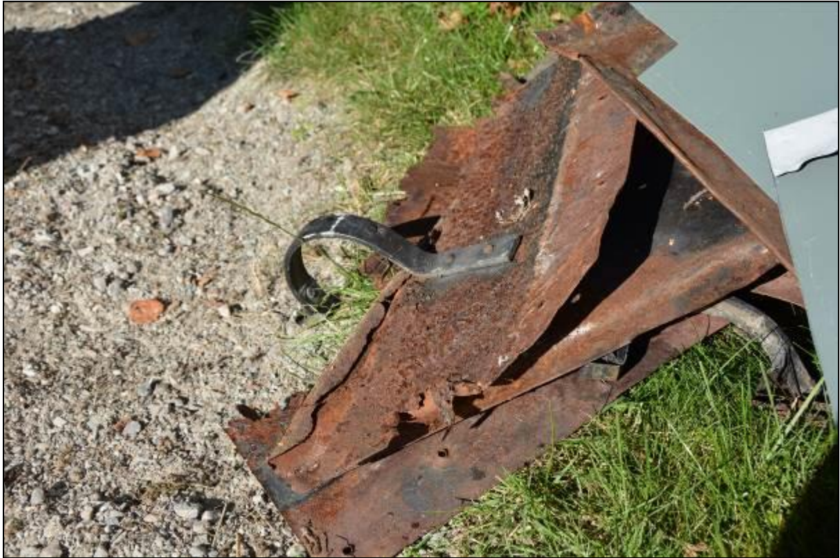
Äldre plåt med fastsatta krokar för hängrännor. Vlm_kmvSB-2492