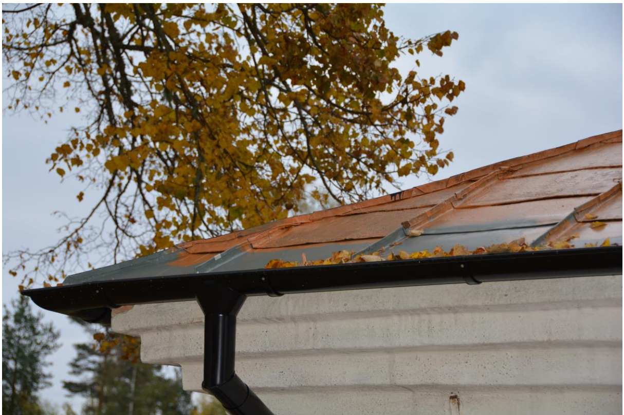
Delar av norra takfallet med nytt avvattningsystem. Vlm_kmvSB-2515