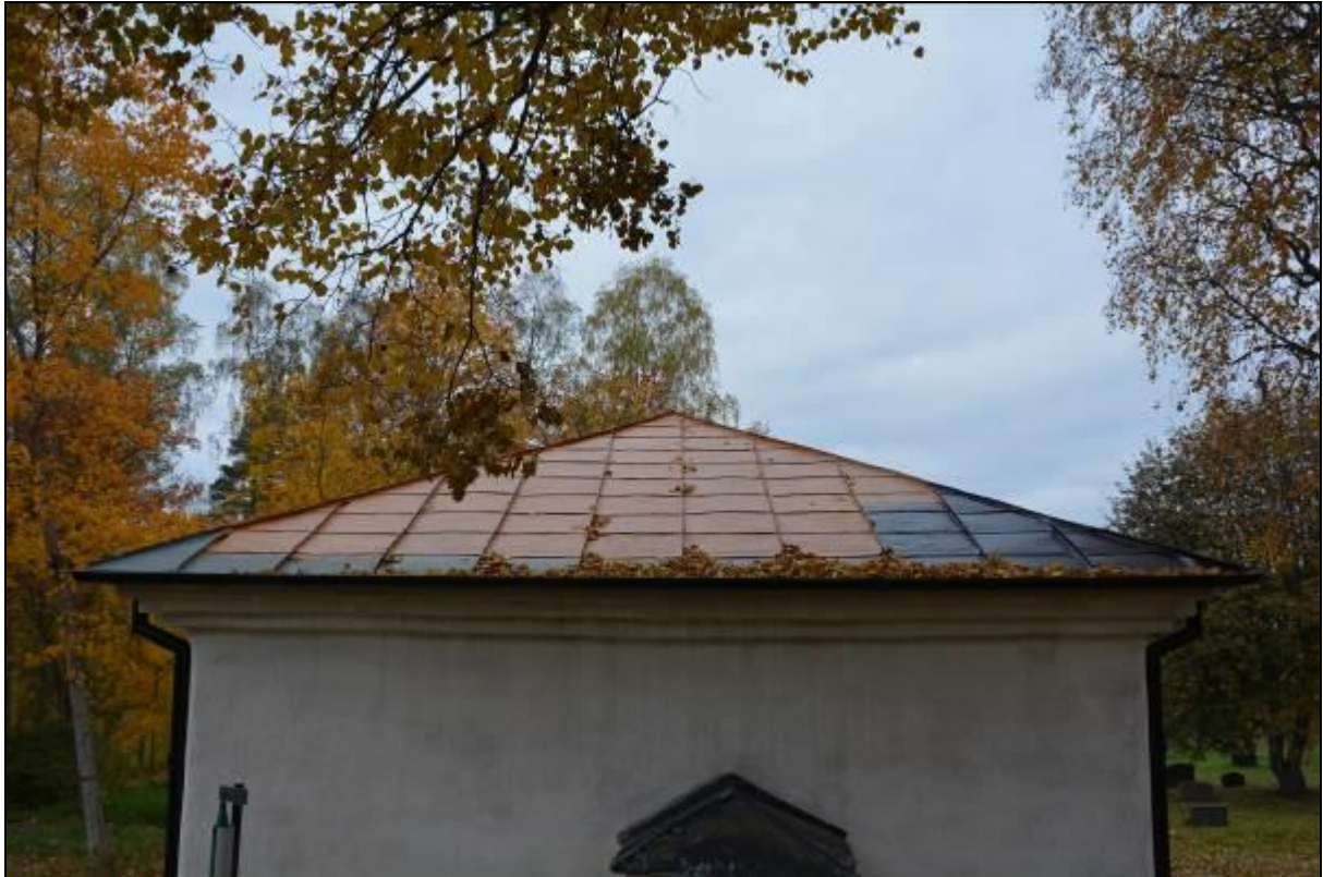
Östra takfallet efter plåtbyte och grundmålning. Vlm_kmvSB-2483