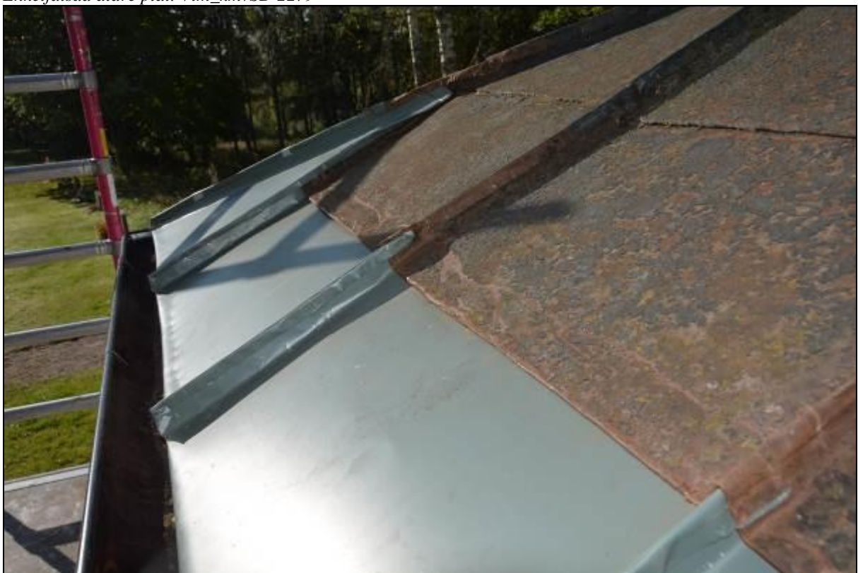
Ny plåt på nedersta varvet. Vlm_kmvSB-2488