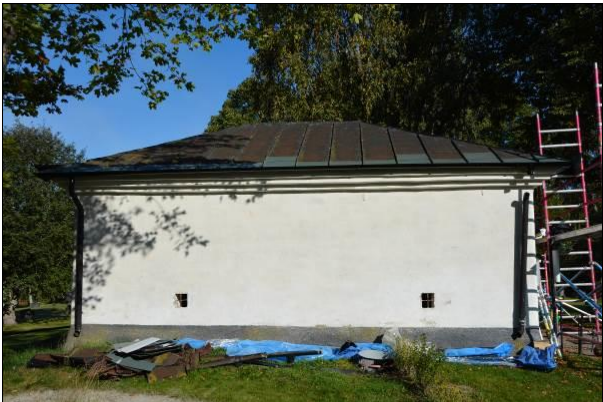
Södra takfallet efter plåtbyte. Vlm_kmvSB-2483