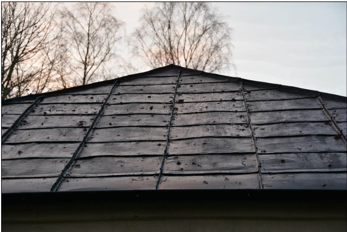
Östa takfallet efter färdigställande. Vlm_kmvSB-2617