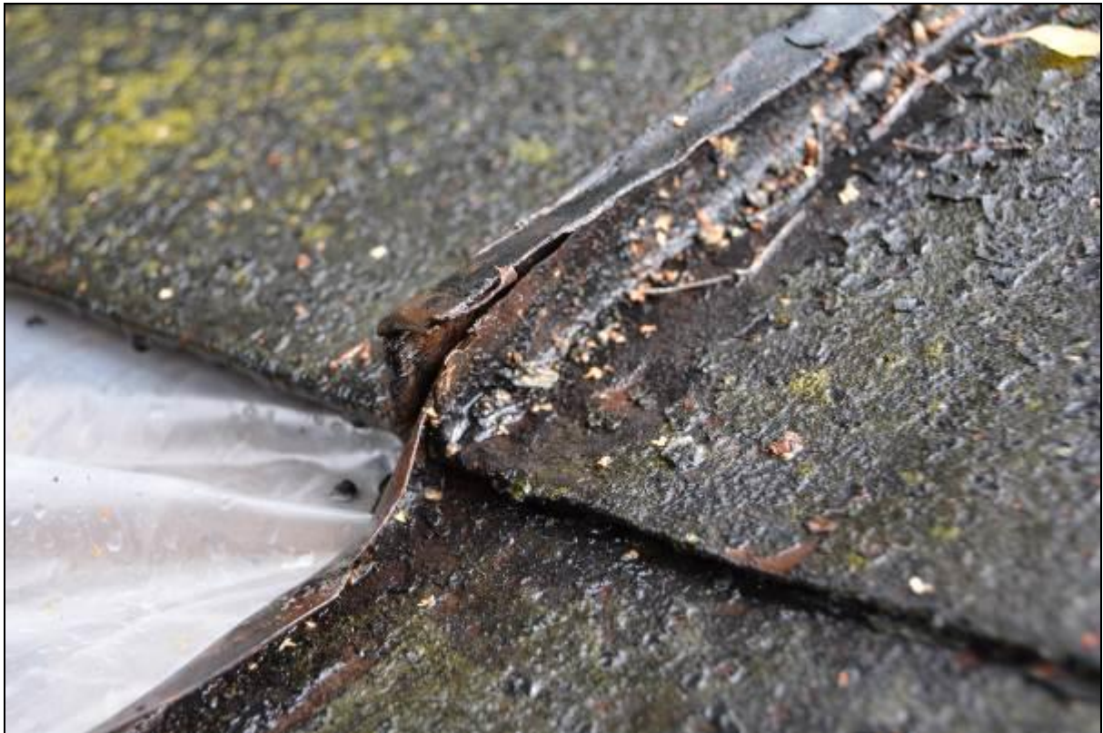
Enkelfalsad äldre plåt. Vlm_kmvSB-2279