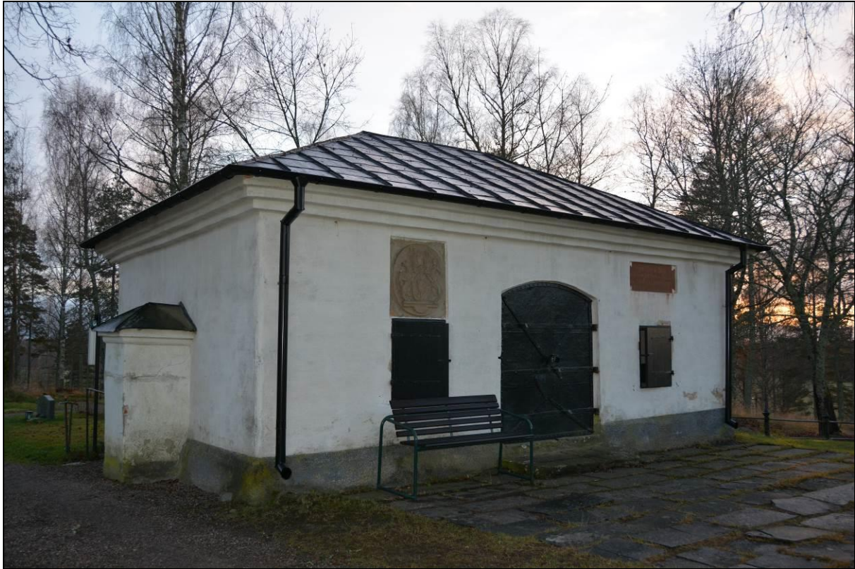
Norra fasaden efter färdigställande. Vlm_kmvSB-2611