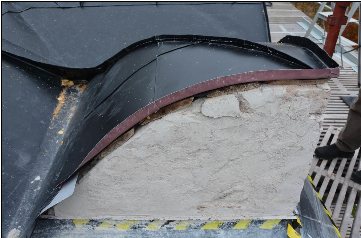
Ny plåttäckning på tak. Vlm_kmvSB-2505