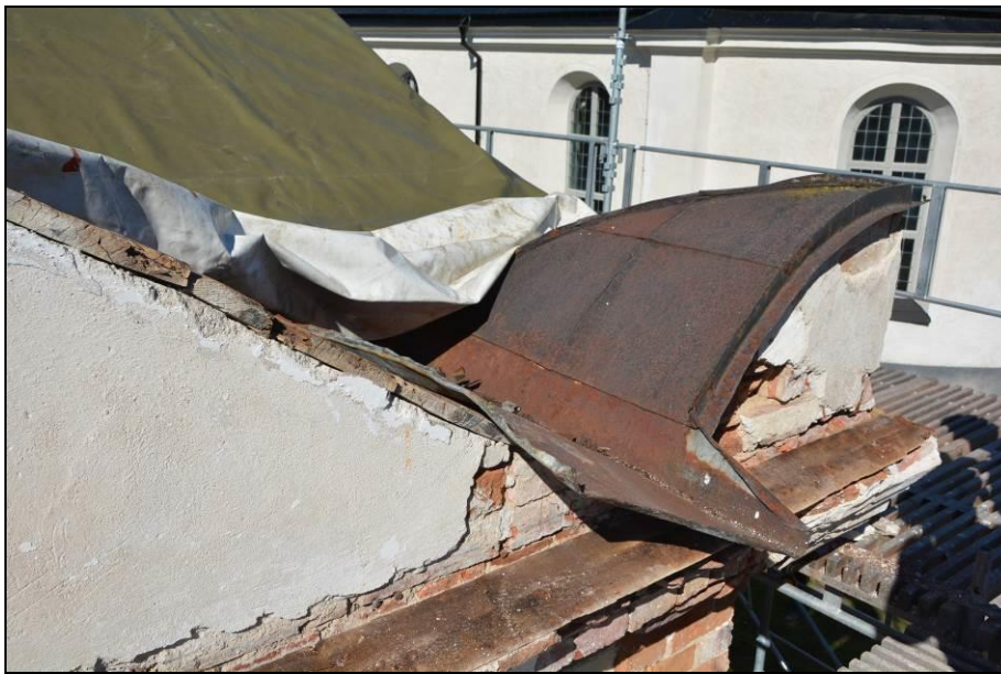
Plåttäckning på takets östra sida. Vlm_kmvSB-2457.