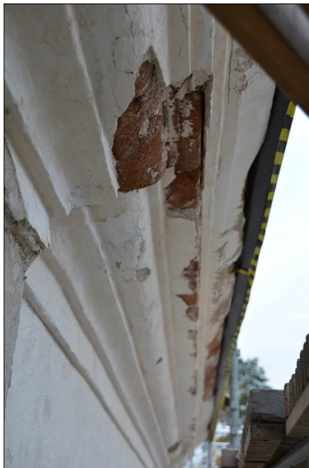
Putsskador på frisen. Vlm_kmvSB-2500.