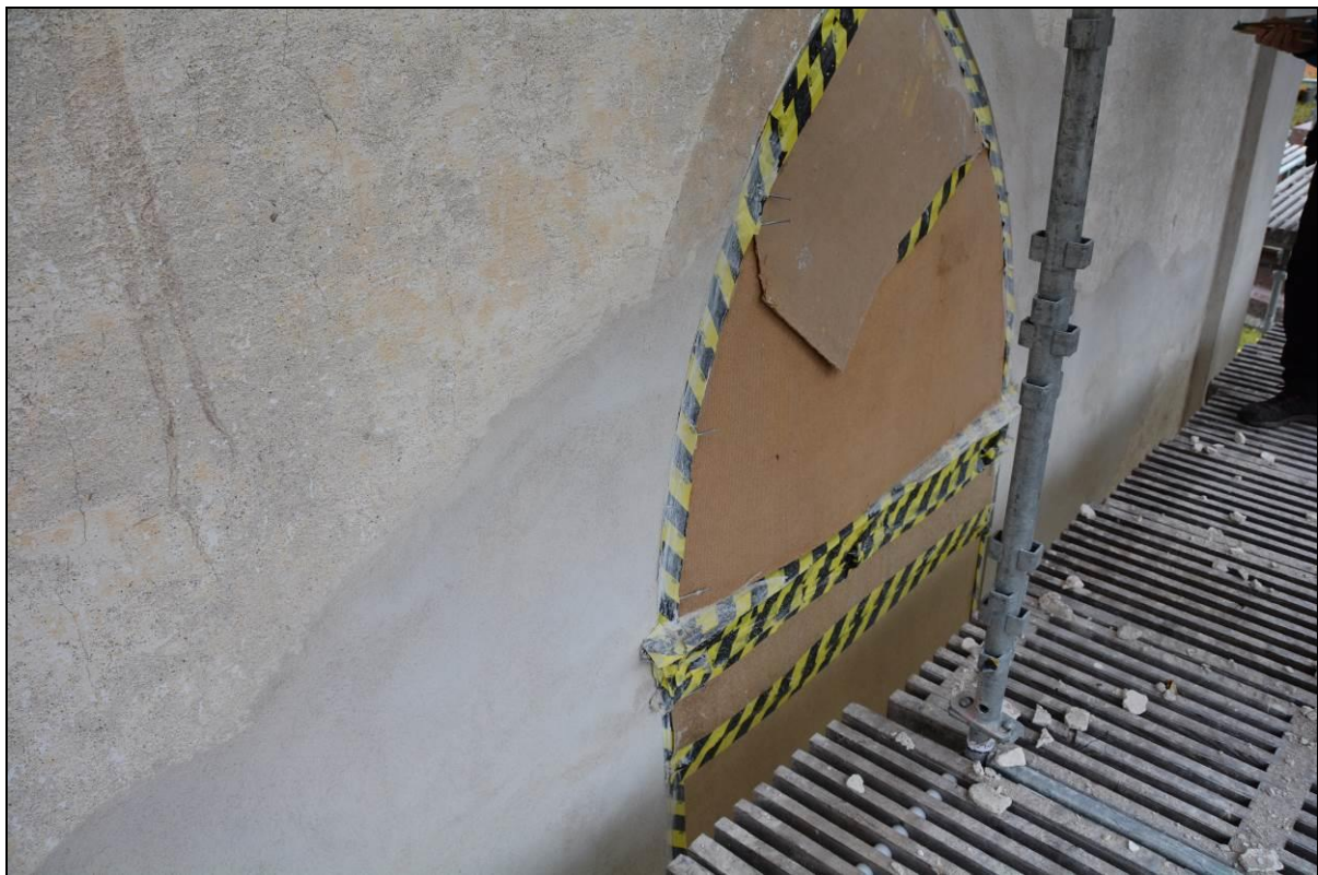
Putslagningar på fasad. Vlm_kmvSB-2496