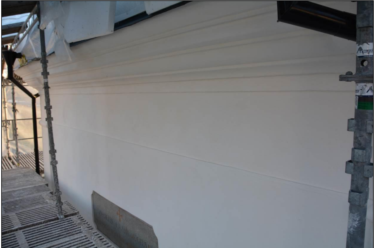
Norra fasaden efter slutstrykning. Vlm_kmvSB-2599