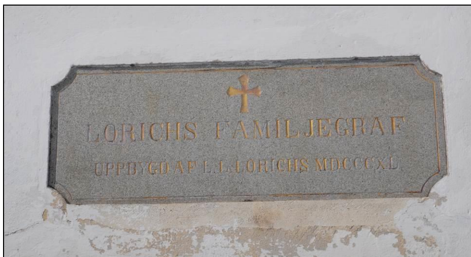
Inskriptionstavla ovanför gravkorets entré .

Bernshammars herrgård hade börjat användas som permanentbostad för familjen Lorichs 1819. Gravkoret byggdes i samband med att leksandskarlar uppförde naturstensmuren 1838-39 runt kyrkan som byggnaden delvis vilar på. Inskriptionen på stentavlan ovanför gravkorets entré uppfördes byggnaden 1840. Inskriptionstavla inne i gravkoret anger 1839.