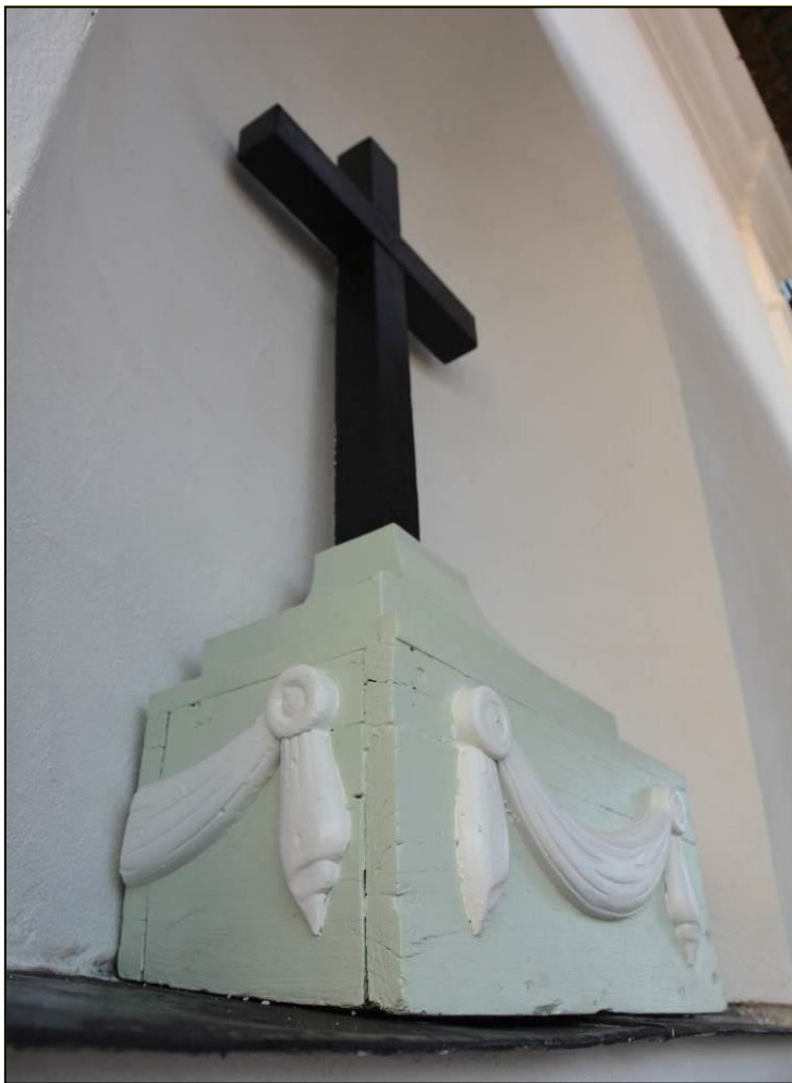
Träkors efter åtgärder. Vlm_kmvSB-2602