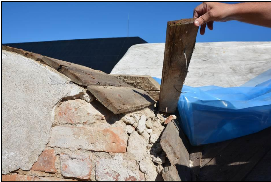
Södra akroterions bräddtäckning. Vlm_kmvSB-2451.