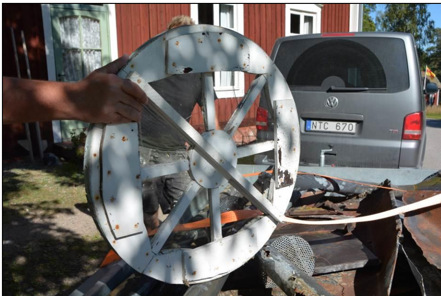
Nedmonterat fönster med sentida lagningar. Vlm_kmvSB-2339.