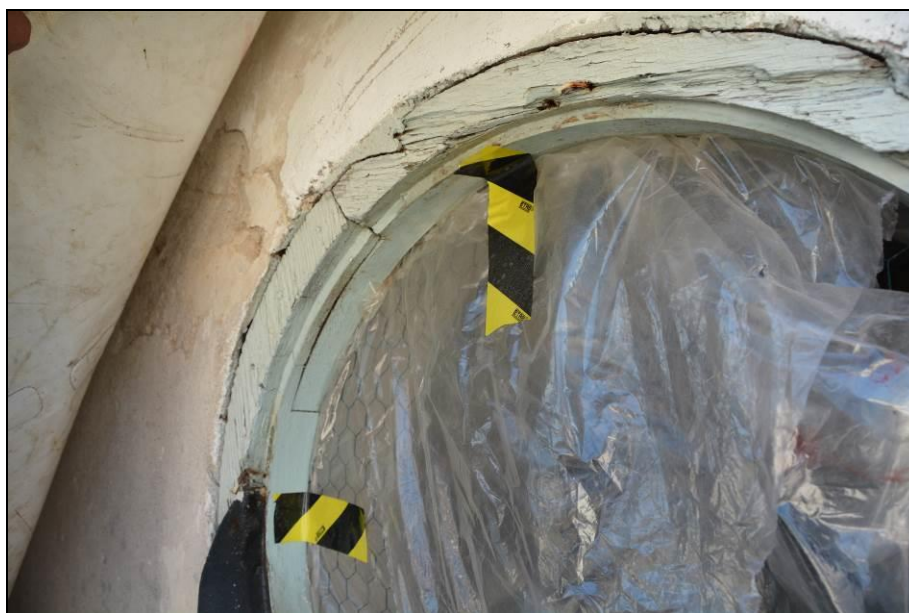
Skadad fönsterbåge. Vlm_kmvSB-2454.