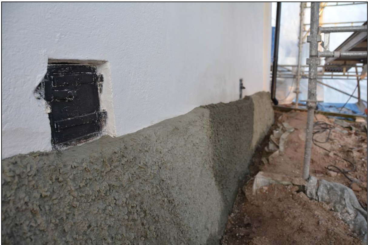
Sockeln efter åtgärder och under torkning. Vlm_kmvSB-2603