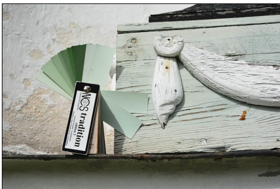
Trädekor med färgstickan som visar på färgprover som sedan användes till trädekor och nyttillverkade fönster. Vlm_kmvSB-2389.