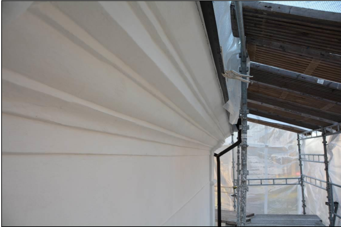
Nya listverk efter färdigställt arbetet. Vlm_kmvSB-2594