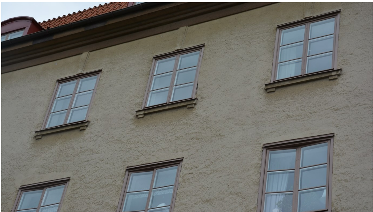
Bild 6: Detaljbild av fasaden ut mot Lidmansgatan efter restaurering.