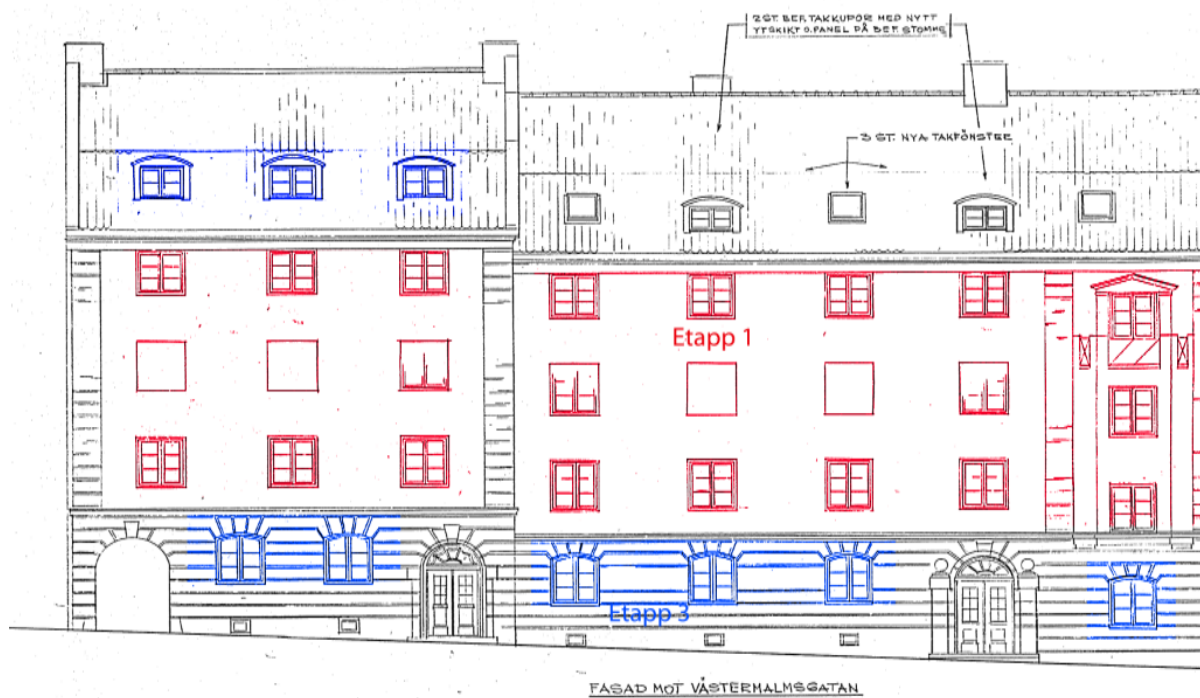
Ritning över fasaden mot Västermalmsgatan.