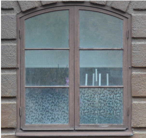
Bild 2 Fönster innan restaurering

Under etapp 3 anlätades en annan entreprenör än i etapp 1 och 2. Då det fanns risk för inbrott vid fönstrens avlägsnande skedde arbetet på plats. Fönstren sattes tillbaka varje kväll. All färg skrapades bort och bågarna kittades om där det var nödvändigt med traditionellt linoljekitt. Fönsterbågarna och karmarna målades sedan med traditionell linoljefärg.