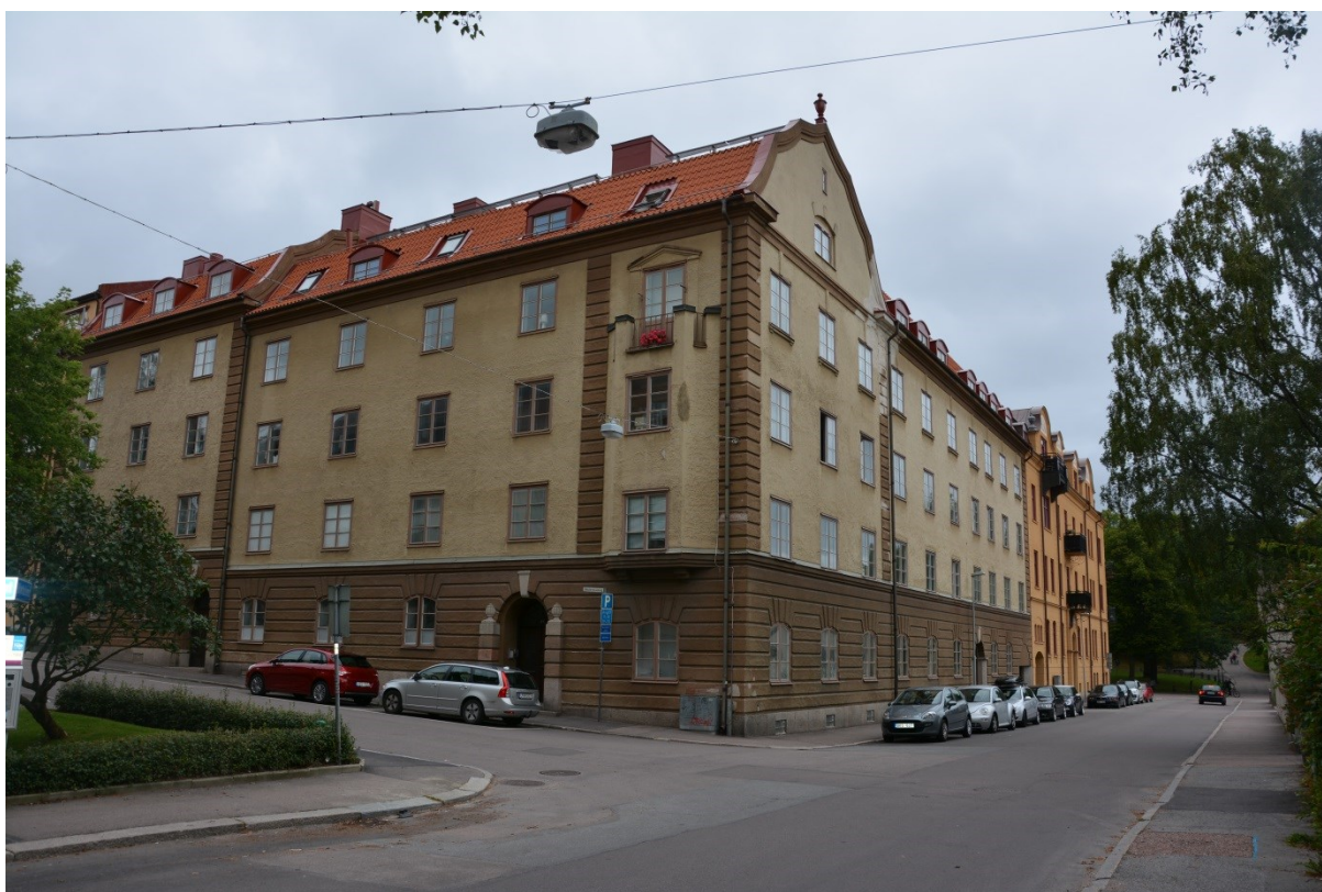
Bild 1: Byggnaden sträcker sig över hörnet i korsningen Källgatan och Västermalmsgatan. Byggnaden efter att fönstren blivit restaurerade.

Den aktuella byggnaden stod färdig 1921 i tegel i fyra våningar. Fasaden är putsad med rusticerad bottenvåning, lisener och hörnkedjor. Färgskalan är dov med slätputsade partier i beige medan de övriga är markerade med en brun kulör. Taket är brutet och täckt med enkupigt lertegel. Mot gatan finns omväxlande takkupor och takfönster, mot gården finns takkupor. Byggnaden präglas av en omsorg om detaljernas utformning, fasaden är relativt enkel med rusticeringen, takformen och portarna som dekorativa element. Fönstren ligger i liv med fasaden och är viktig del byggnadens uttryck. Fönstren är symmetriskt placerade i horisontella band på fasaden. De är av tvåluftstyp och fönsterbågarna är kopplade. I varje båge finns två spröjs och tre rutor med munbläst glas. 2