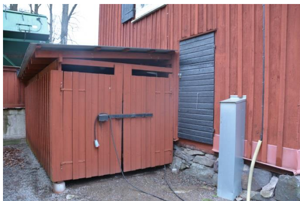
Sydvästra gavlels nedre del med tillbyggt skjul. BildID: Vlm_kmvSB-3559.