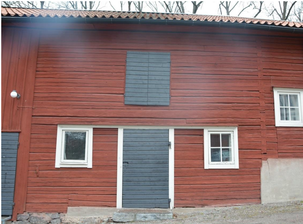
Mittersta delen av entrefasaden mot gård, 2013-03-23. BildID: Vlm_kmvSB-3553.

Den befintliga trädörren kommer byta plats med fönstret direkt till höger om dörren. Denna dörr kommer att fungera som enda entré till byggnaden. Befintliga material kommer att återanvändas och färgsättning lika befintlig. Vid behov byts material ut till nytt material i dimension lika det äldre. Öppningen med luckor på andra våningen kommer ersättas av ett liggande fönster utan fönsterfoder för att verka så diskret som möjligt. Luckorna kommer avlägsnas och sparas.