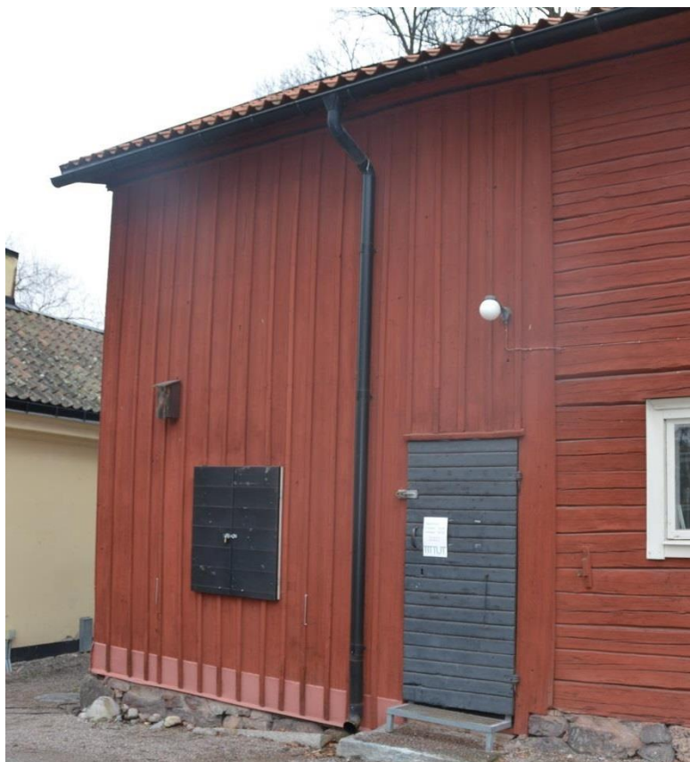
Södra delen av entrefasad mot gården 2015-03-23. BildID: Vlm_kmvSB-3554.

Dörröppningen kommer att sättas igen och kommer i fortsättningen vara en blinddörr. Ett liggande fönster utan fönsterfoder kommer att tas upp under takfoten. Fönstret bör vara spröjsat med tre rutor, se föregående bild.