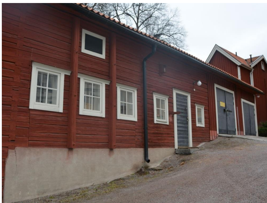
Norra delen av entrefasaden innan åtgärder 2015-13-13.

De befintliga dubbelportarna närmast gaveln berörs inte av förändring. Trädörren närmst i bild kommer att ersättas av ett fönster. Övriga fönster samt lucka under takfoten berörs inte av förändring. Fasadmaterial och färgsättning kommer vara lika befintlig.