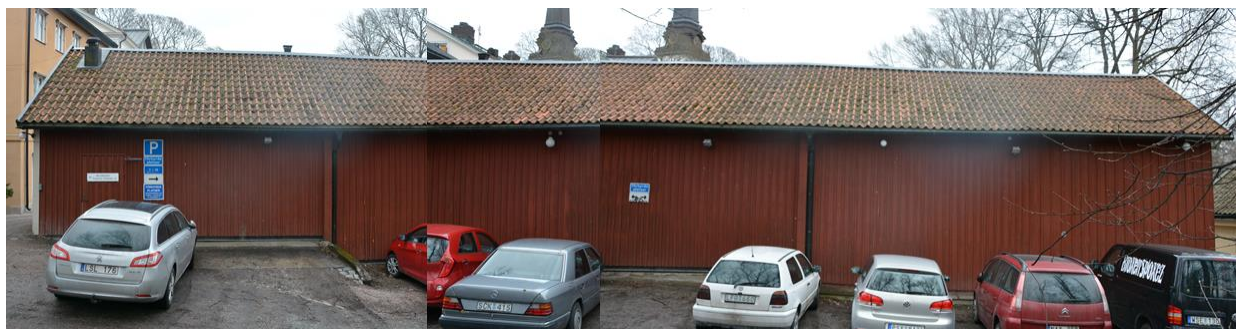
Fotomontage på långsida mot norr och Vattugränd 2015-03-23.

Röda längans norra långsida och baksida vetter mot Vattugränd och fasadgräns. Den har idag endast en röd port in till miljöboden i längans norra del (till vänster på bilden). Befintlig port kommer vara kvar. Två mindre fönster utan fönsterfoder tas upp under takfoten in till det stora rummet på andra våningen.