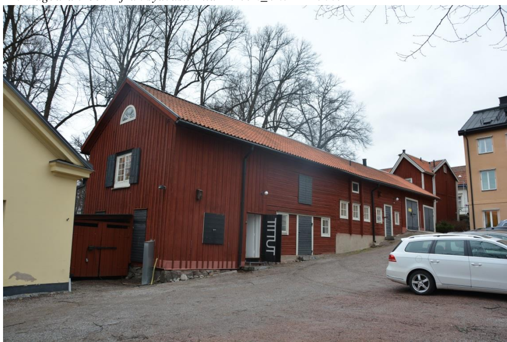
Röda längan från Sydväst. BildID Vlm_kmvSB-3573.