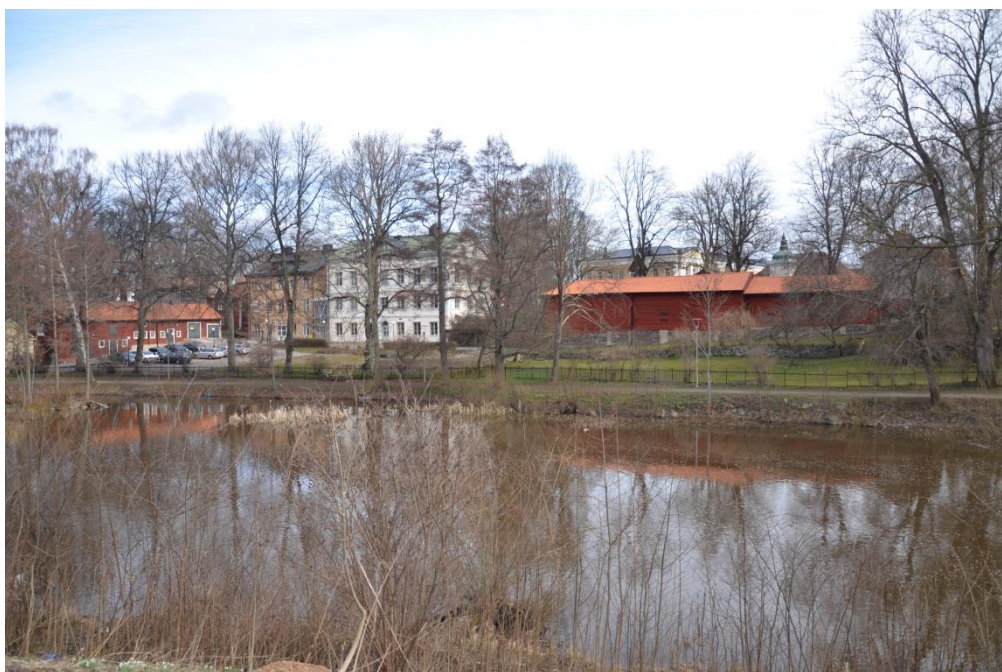
Kv Hagbard 3 och 4 från sydväst. BildID: Vlm_kmvFE-4300.

Röda längan är uppförd i timmer med olika bjälklagshöjder, som följer den sluttande topografin. Eftersom marken sluttar ned mot ån blir byggnaden högre mot väster. Gavlarna samt delar av entréfasaden är klädd med locklistpanel. Mittenpartiet mot gården visar timmerstomme. Baksidan är i helhet klädd med locklistpanel. Hela fasaden är målad med röd slamfärg. In mot gården finns flera sekundära fönster och dörrar, fasaden mot Vattugränd är helt sluten med enbart en dörr klädd med locklistpanel. Fönstersnickerier är vitmålade och dörrarna är svarta. Sadeltaket är belagt med enkupigt lertegel.