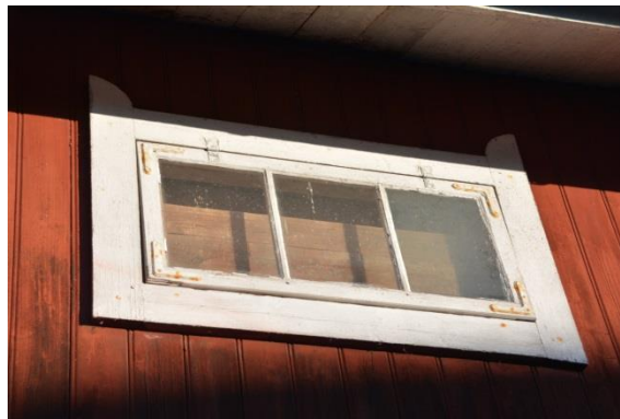
Förslag på spröjsindelning för nya fönster. Bild från ekonomibyggnad, Huddunge by, Upplands län.

För att anpassa arbetet till de värden som byggnaden har bör en strävan efter att göra nya fönster och dörr så diskret och väl anpassade till byggnaden som möjligt. De nya fönster som tas upp i fasaden bör vara spröjsat med tre rutor vilket är vanligt förekommande på ekonomibyggnader, se bild nedan.