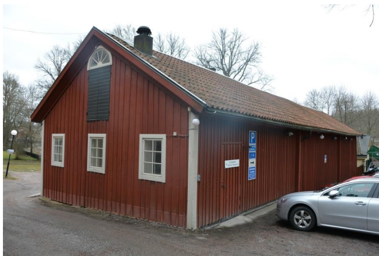
Norra gaveln 2015-03-23.

Inga åtgärder kommer att påverka utseendet på norra gaveln.