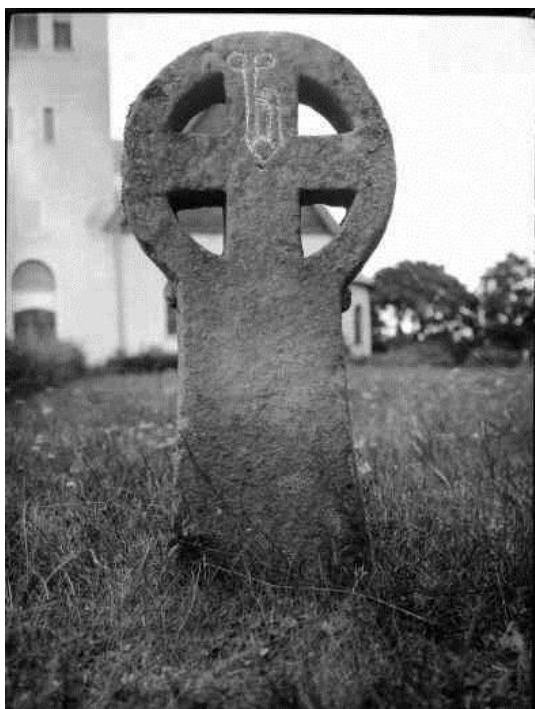
Bild 2. Medeltida hjulkors från Järsnärs kyrka Jönköping län.