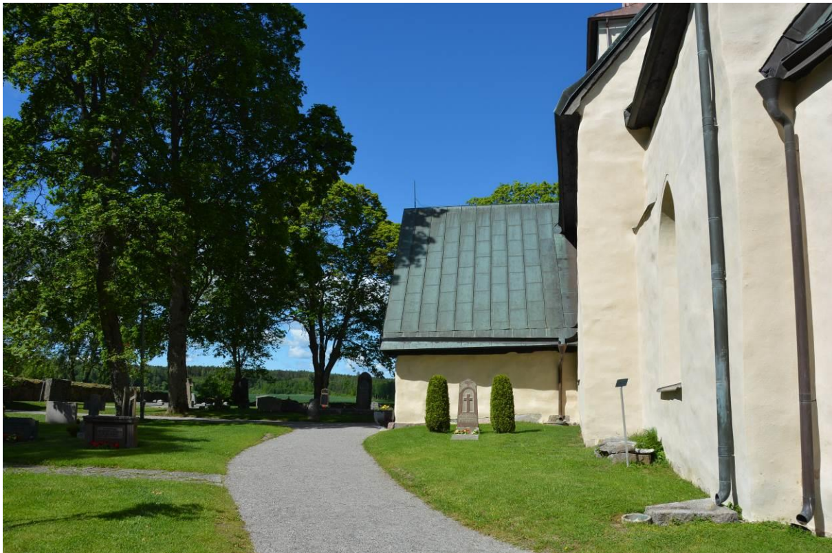
Tumbo kyrkas långhus och vapenhus. Stenkistan från 1200-talet syns intill fasaden till höger i bild. BildID: Vlm_trrSB-206.

Kyrkogårdens gravkvarter är samtliga gräsbevuxna. Under senare delen av 1900-talet har nästintill alla grusgravar ersatts med gräs som ytmaterial. Flera gravplatser inramas av stenramar som är rester efter tidigare grusgravar. Kvarteren avgränsas av grusade gångar alternativt gångar av kalksten. På den äldre delen av kyrkogården är gravvårdarna orienterade i nordsydlig riktning medan de på den utvidgade södra delen är orienterade i östvästlig riktning samt utmed gångarna.