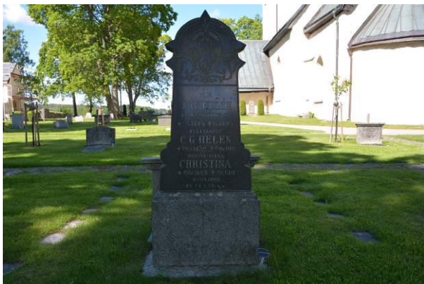
Bild 4. Gravvård från förra sekelskiftet med hög obeliskform i svart. Bild-ID Vlm_trrEHW-225

1990 års begravningslag överförde bestämmanderätten över gravvårdarnas utformning till gravrättsinnehavaren så länge man håller sig inom ”god gravkultur” (Begravningslagen (1990:1144) kap 7 26 §). Lagändringen har inneburit att vi från och med 1990-talet har vi fått mer individualistiskt formade gravvårdar.