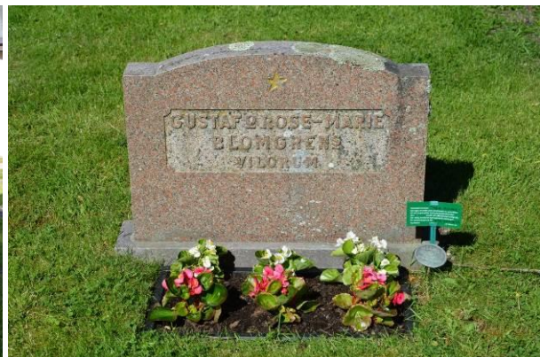
Bild 5. Gravvård från 1976. Typisk för 1970-talet med låg, bred form i röd granit. Bild-ID Vlm_trrSB-111