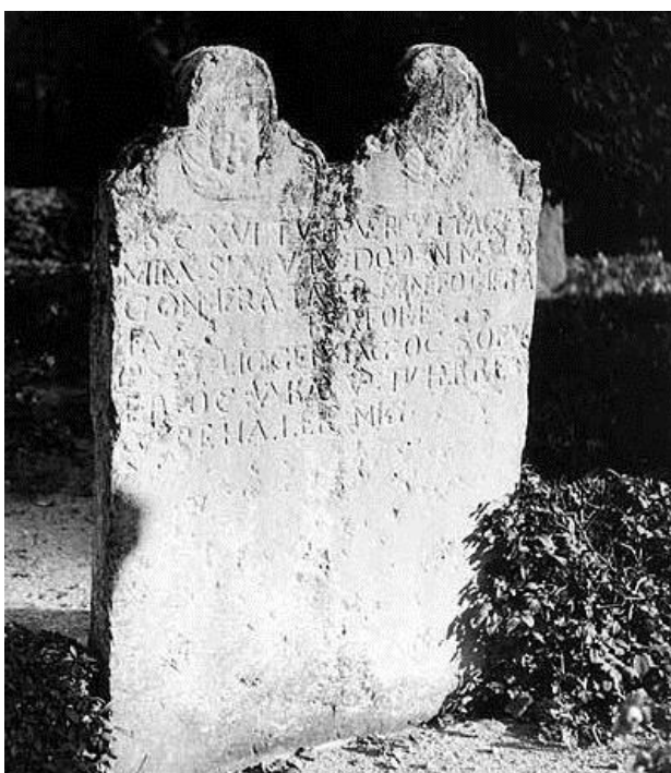
Bild 3. Äldre gravvårdar, trol. sekelskifte 1600- 1700-tal. Dannäs kyrka, Jönköping län.

Under 1800-talet växte Sveriges befolkning explosionsartat, särskilt i städerna. Med befolkningsväxten kom problemet med överfyllda kyrkogårdar. Mot 1800-talets slut blev det allt vanligare att anlägga nya begravningsplatser utanför stadsgränsen. Nya ideal och riktlinjer för begravningsplatser gjorde att de fick det parklika utseendet vi ser idag. Trädplanteringen fortsatte, nu enligt lag, och trädkranser och prydliga alléer växte fram. Gravarna lades i regelbundna kvarter, avskilda med gångar. Kring sekelskiftet 1800-1900 nådde dessa idéer även landsbygdens kyrkogårdar, och de flesta genomgick gestaltungsreformer med trädplantering och prydlig kvartersindelning. Många utvidgades för att ge plats åt den växande befolkningen.