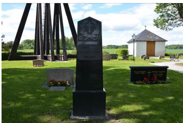
Bild 4. Gravvård från Råby-Rekarne kyrkogård. Typisk för sekelskiftet hög obeliskform i svart granit Bild-ID Vlm_trrEHW-282.

1990 års begravningslag överförde bestämmanderätten över gravvårdarnas utformning till gravrättsinnehavaren så länge man håller sig inom ”god gravkultur” (Begravningslagen (1990:1144) kap 7 26 §). Lagändringen har inneburit att vi från och med 1990-talet har vi fått mera individualistiskt formade gravvårdar.