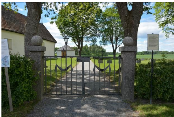
Ingång vid öster med grindstolparna utförda av natursten och grindarna av svartmålat järn BildID: Vlm_trrSB-279

Kyrkogården gravkvarter och askgravplats är gräsbevuxna. Gravvårdarna är orienterade i nord-sydlig riktning och i öst-västlig riktning i kvarteret norr om kyrkan. Flera gravar inramas av stenramar av natursten som visar att de tidigare var grusgravar. Under senare delen av 1900-talet har många av grusgravarna försvunnit på svenska kyrkogårdar. Den bevarade grusgraven inramas av ett svartmålat järnstaket.