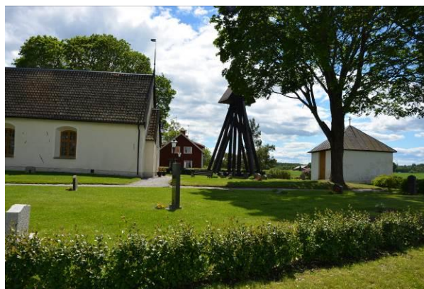
Kyrkomiljön sedd från norr med kyrka, klockstapel och bårhus samt den omgärdande lövhäcken. BildID: Vlm_trrSB-277