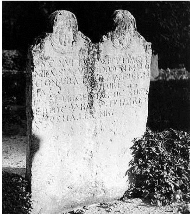
Bild 3. Äldre gravvårdar, trol. sekelskifte 1600- 1700-tal. Dannäs kyrka, Jönköping län.

Under 1800-talet växte Sveriges befolkning explosionsartat, särskilt i städerna. Med befolkningsväxten kom problemet med överfyllda kyrkogårdar. Mot 1800-talets slut blev det allt vanligare att anlägga nya begravningsplatser utanför stadsgränsen. Nya ideal och riktlinjer för begravningsplatser gjorde att de fick det parklika utseendet vi ser idag. Trädplanteringen fortsatte, nu enligt lag, och trädkranser och prydliga alléer växte fram. Gravarna lades i regelbundna kvarter, avskilda med gångar. Kring sekelskiftet 1800-1900 nådde dessa idéer även landsbygdens kyrkogårdar, och de flesta genomgick gestaltungsreformer med trädplantering och prydlig kvartersindelning. Många utvidgades för att ge plats åt den växande befolkningen.