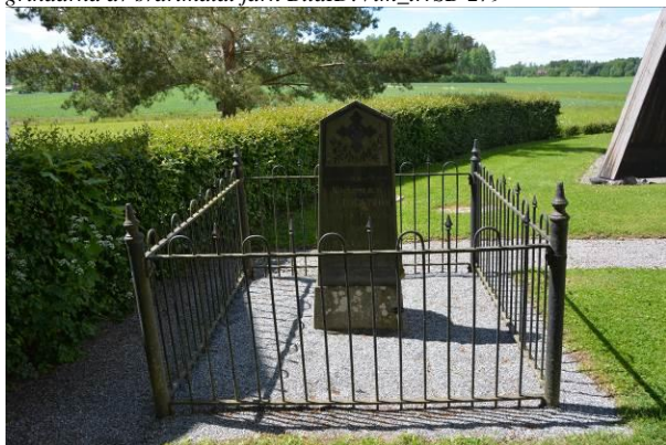
En av de kvarvarande grusgravarna samt en vy mot norr från kyrkans gavel. BildID: Vlm_trrEHW-290, -298.