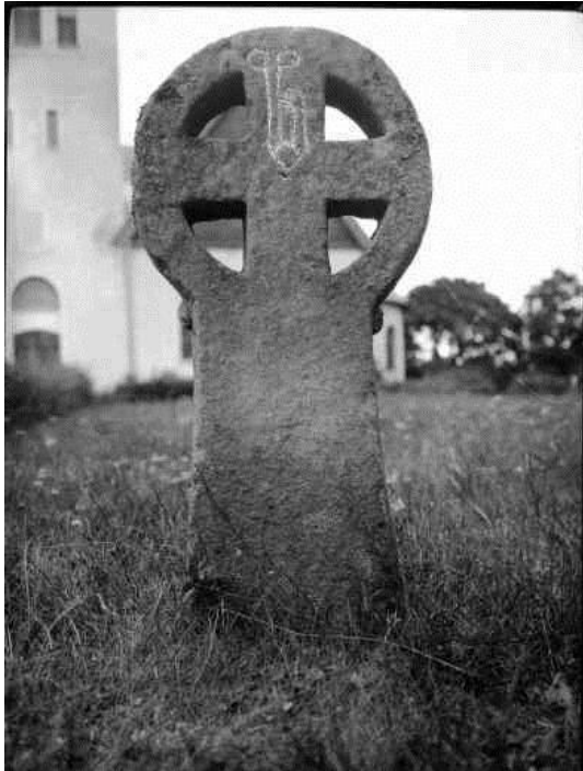
Bild 2. Medeltida hjulkors från Järsnärs kyrka Jönköping län.