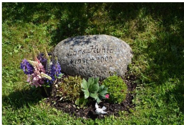
Bild 5. Gravvård från 2002. Typiskt för 2000-talet med liggande natursten. Bild-ID Vlm_trrSB-270.