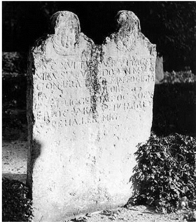
Bild 3. Äldre gravvårdar, trol. sekelskifte 1600- 1700-tal. Dannäs kyrka, Jönköping län.

Under 1800-talet växte Sveriges befolkning explosionsartat, särskilt i städerna. Med befolkningsväxten kom problemet med överfulla kyrkogårdar. Mot 1800-talets slut blev det allt vanligare att anlägga nya begravningsplatser utanför stadsgränsen. Nya ideal och riktlinjer för begravningsplatser gjorde att de fick det parklika utseendet vi ser idag. Trädplanteringen fortsatte, nu enligt lag, och trädkranser och prydliga alléer växte fram. Gravarna lades i regelbundna kvarter, avskilda med gångar. Kring sekelskiftet 1800-1900 nådde dessa idéer även landsbygdens kyrkogårdar, och de flesta genomgick gestaltungsreformer med trädplantering och prydlig kvartersindelning. Många utvidgades för att ge plats åt den växande befolkningen.