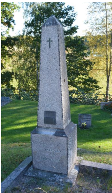
Bild 4. Gravvård från förra sekelskiftet. Vården är formad som en hög obelisk, vilket var vanligt för bemedlade familjer. Bild-id Vlm_svrEHW-121

1990 års begravningslag överförde bestämmanderätten över gravvårdarnas utformning till gravrättsinnehavaren så länge man håller sig inom ”god gravkultur” (Begravningslagen (1990:1144) kap 7 26 §). Lagändringen har inneburit att vi från och med 1990-talet har vi fått mer individualistiskt formade gravvårdar.