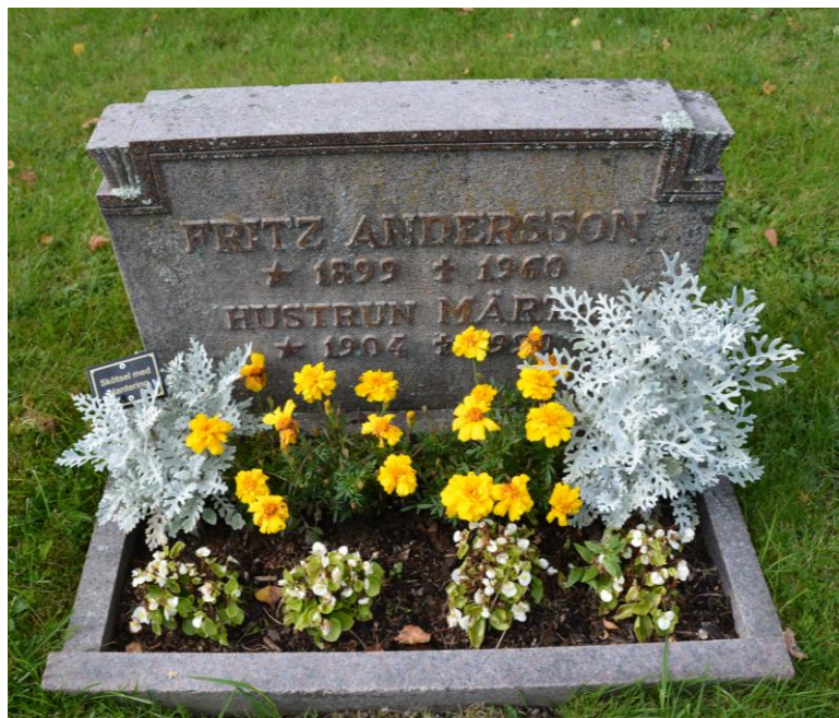
Bild 5. Gravvård från 1960-talet. Låg, bred form i röd granit är typiskt för 1960- och 1970-talets gravvårdar. Bild-id Vlm_svrAF-142