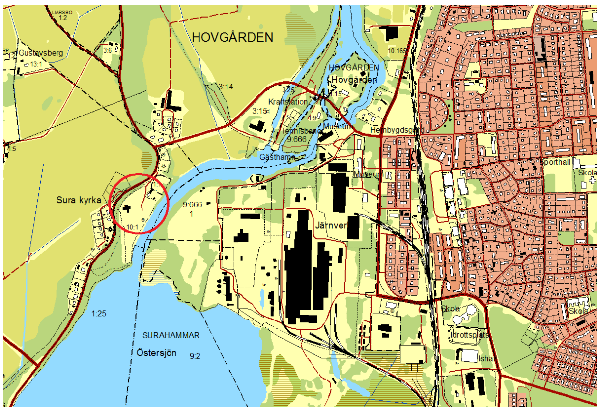
Bild 1. Karta över Surahammar. Sura kyrka är inringad.

Enligt kulturmiljölagen (SFS 1988.950) ska alla begravningsplatser vårdas och underhållas så att deras kulturhistoriska värde inte minskas eller förvanskas. En kyrkogård bär på ett gediget kulturarv, ofta med medeltida ursprung. Samtidigt som detta ska tas tillvara och förvaltas för oss och framtiden, ska man även kunna bruka kyrkogården för sitt ändamål. Syftet med inventeringen och värderingen är att ge samfälligheten ett underlag för framtida planering av vård och användning. Inventeringen visar hur kyrkogårdens gravvårdsbestånd ser ut idag, och den kulturhistoriska karakteriseringen och värderingen pekar ut vilka gravvårdar som har högt kulturhistoriskt värde och ska bevaras för framtiden.