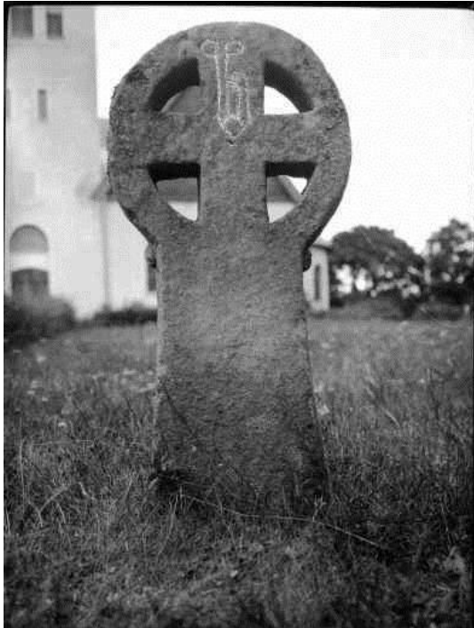
Bild 2. Medeltida hjulkors från Järsnärs kyrka Jönköping län.