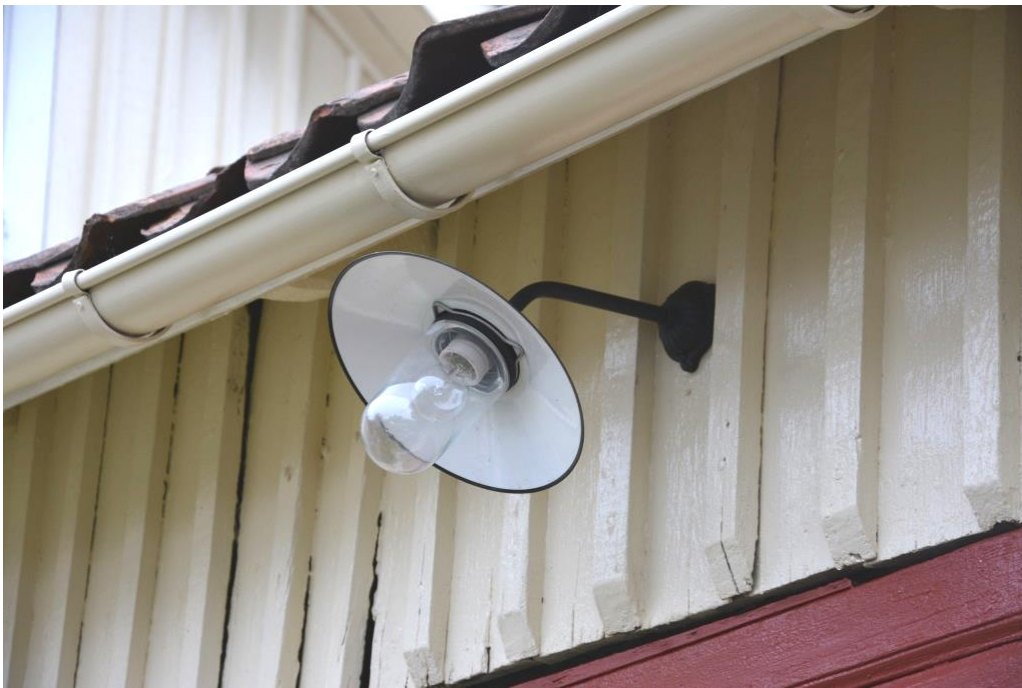
Som belysning valdes en modern armatur i traditionell stil som ska harmoniera i miljön.