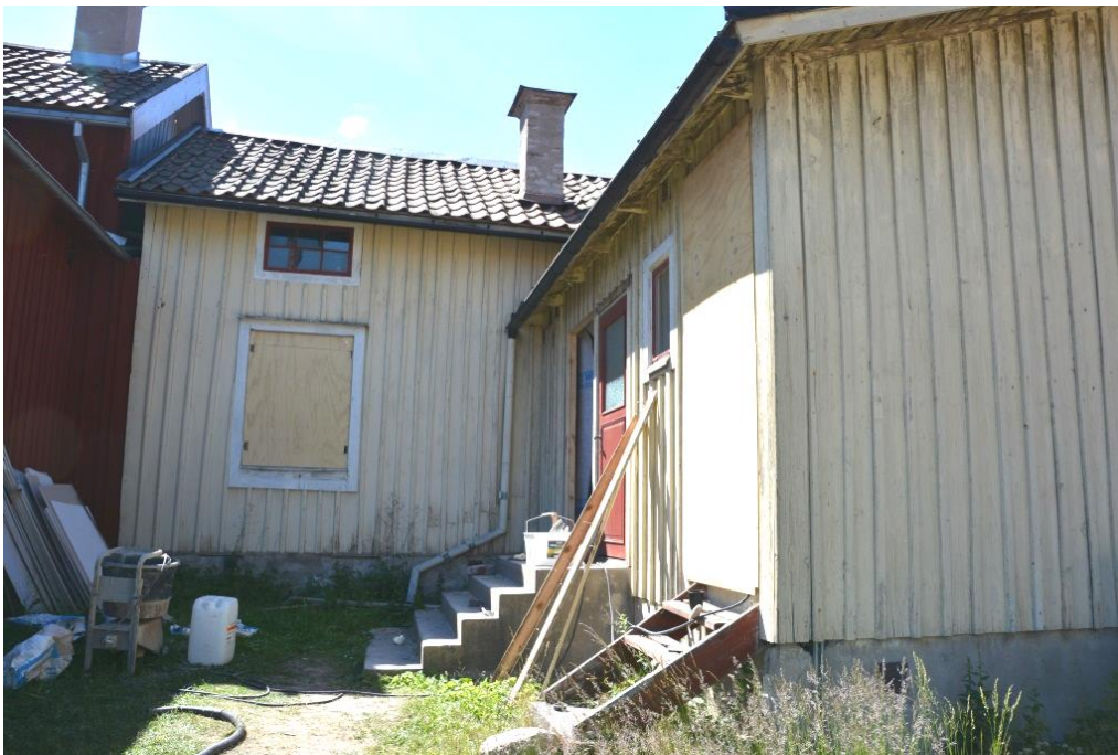
Boningshuset från gården. Fönstren är borttagna för målning på verkstad.