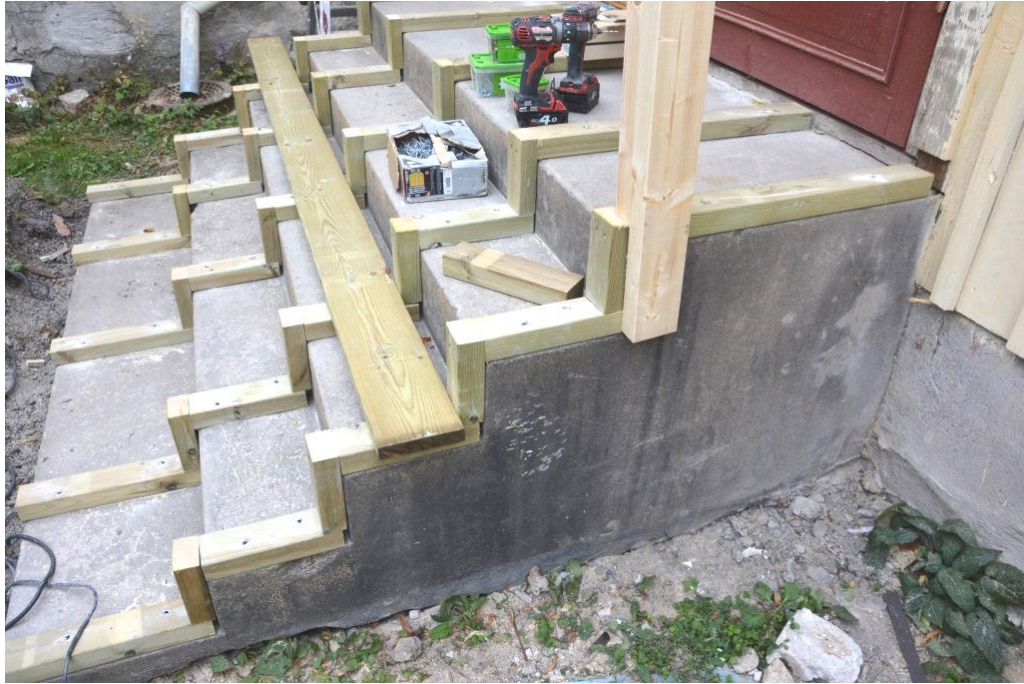
Betongtrappan byggdes in med trätrall.