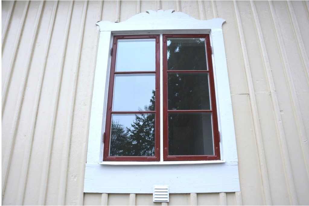
Nymålade fönster och fönsterfoder.