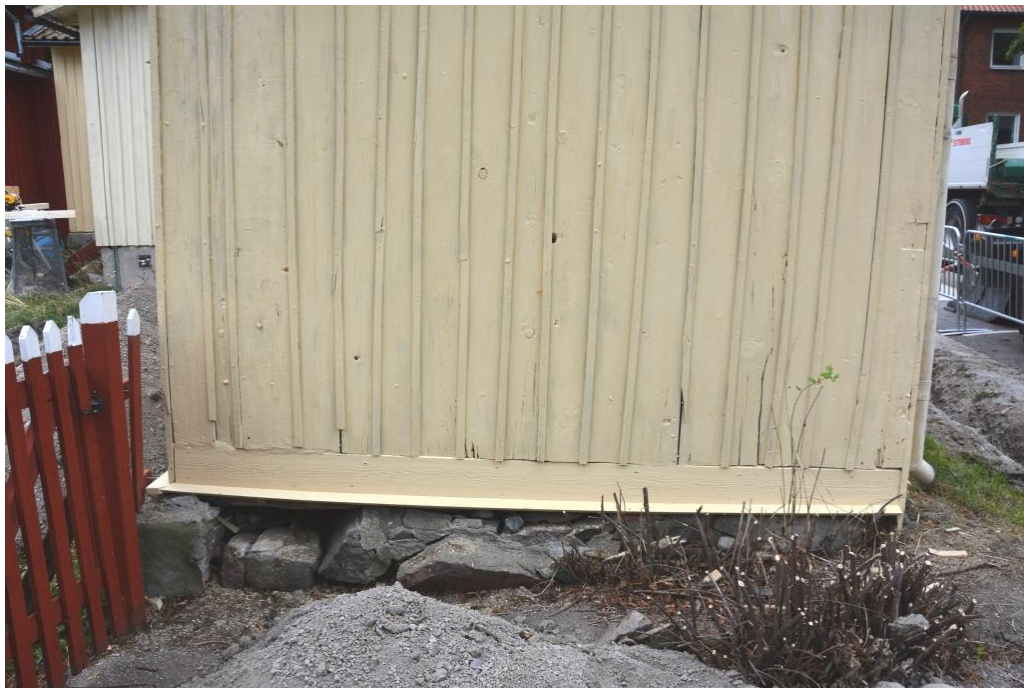
Östra fasaden efter att busken tagits bort och den nedre delen av panelen bytts ut till en liggande bräda. Grundstenarna monterades i efterhand.