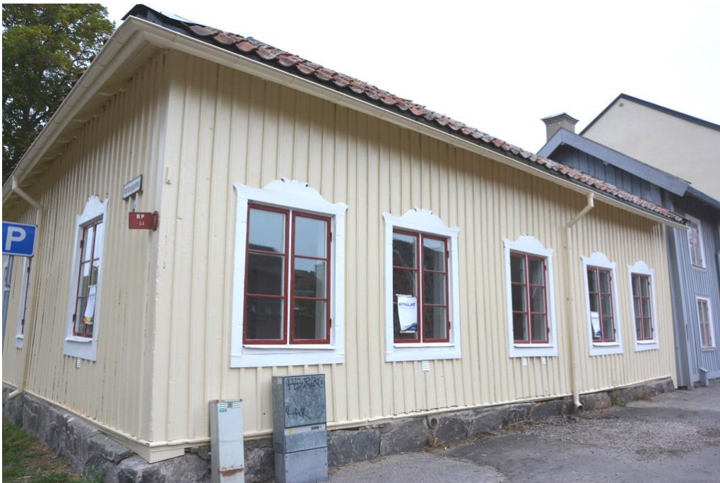
Fasad mot Östra Långgatan, Fasad och fönster är nymålade med Wibo linoljefärg. Stuprör målades i fasadfärg för att verka så diskret som möjligt.