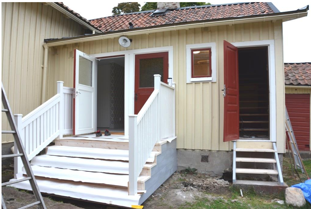
Delvis nya och nymålade entrédörrar och trappa under konstruktion.