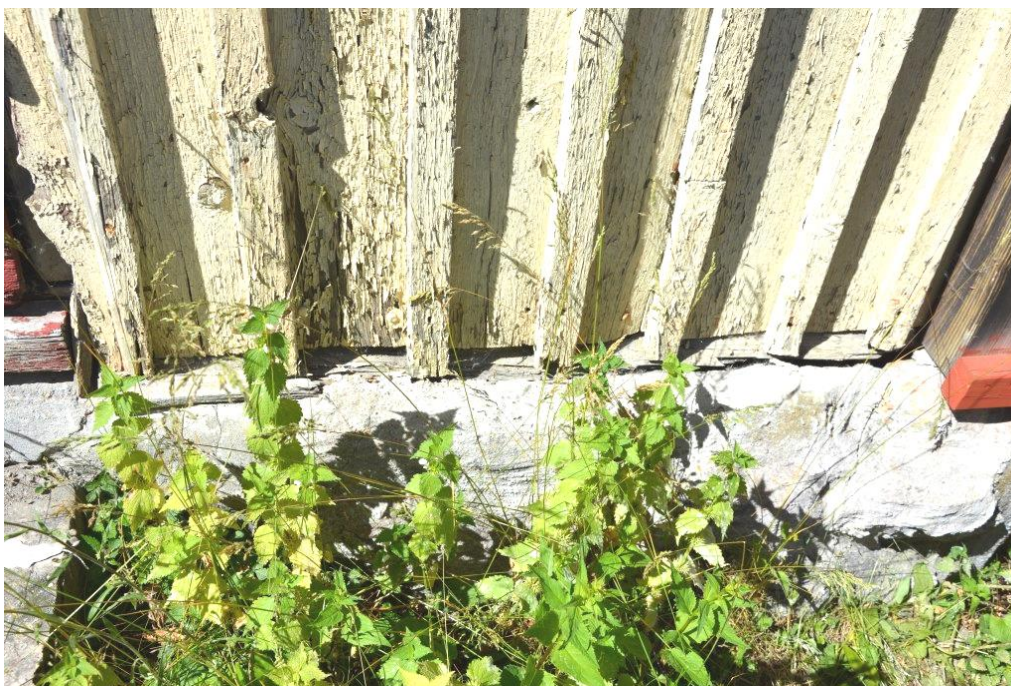
Delar av fasaden var dålig, särskilt dropplister som här på bilden nästan är obefintlig.