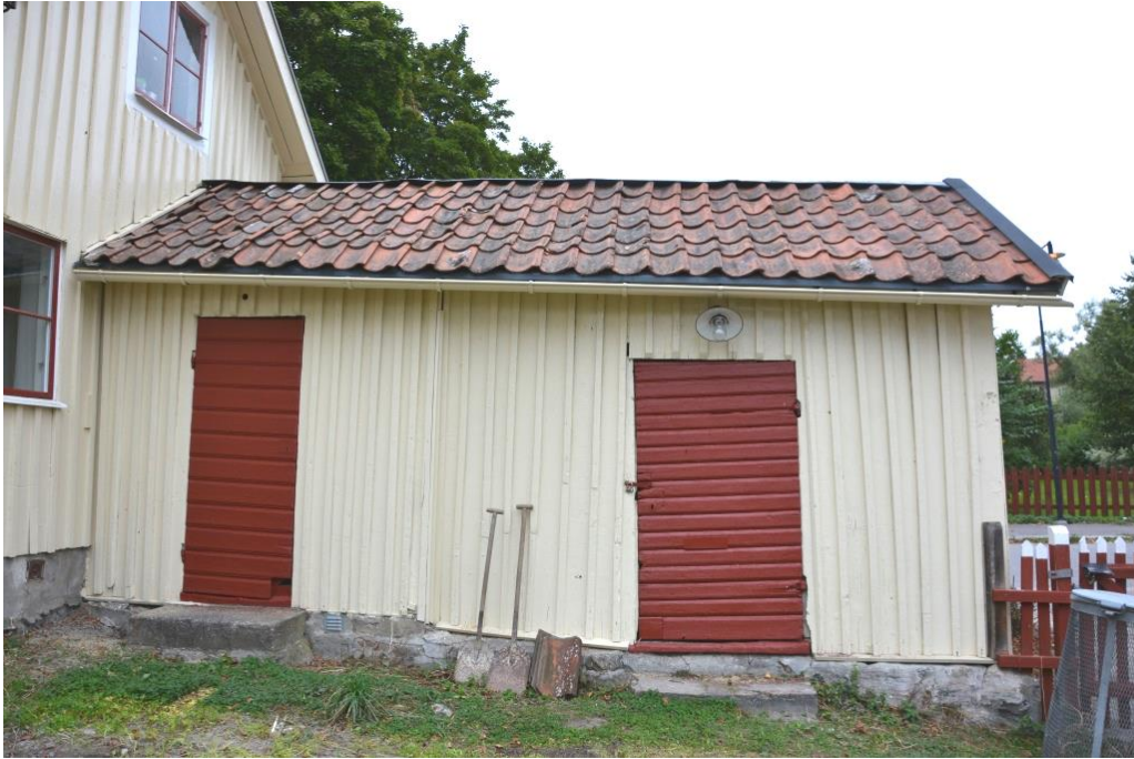
Förrådsutbyggnaden med dörrar målade med lionljefärg i kulören "engelskt röd".