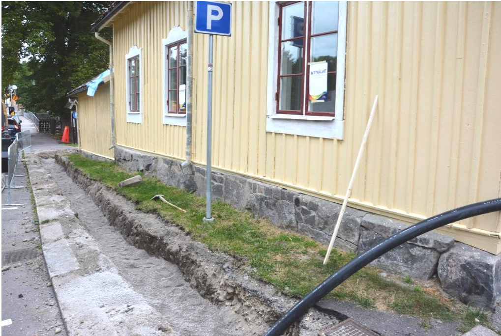
Fasad mot gatan efter skrapning och målning med linoljefärg.