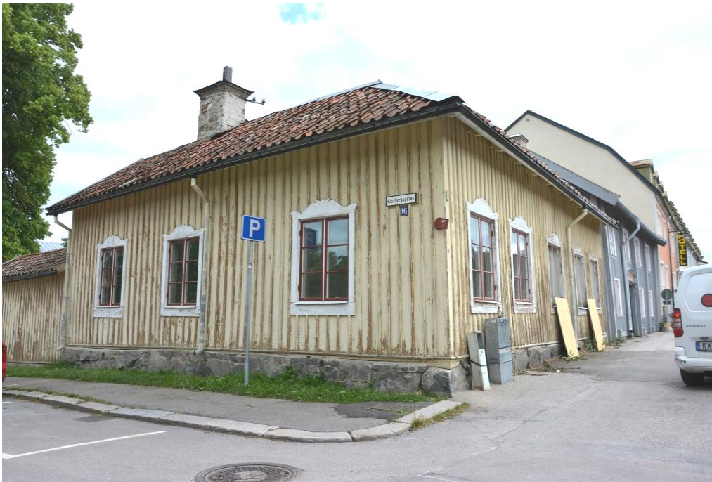
Boningshuset på Nyströmska gården innan fasadarbeten påbörjades.