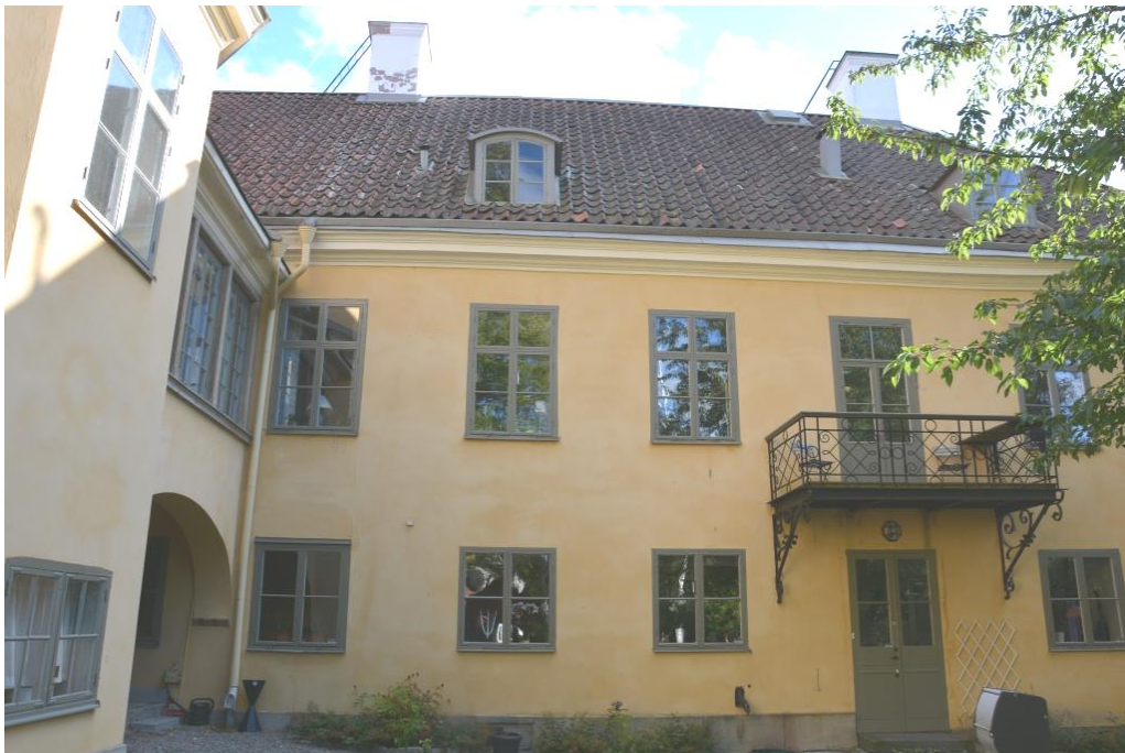
Norra fasaden från gården. Notera bristen på snörasskydd och den spruckna skorstenen.