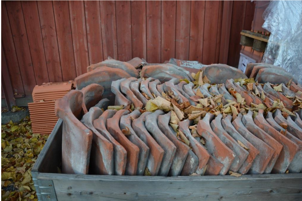
Delar av takteglet sparade och återanvändes på norra takfallet.