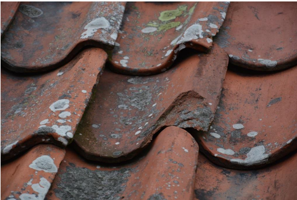
Spröda och spruckna pannor.