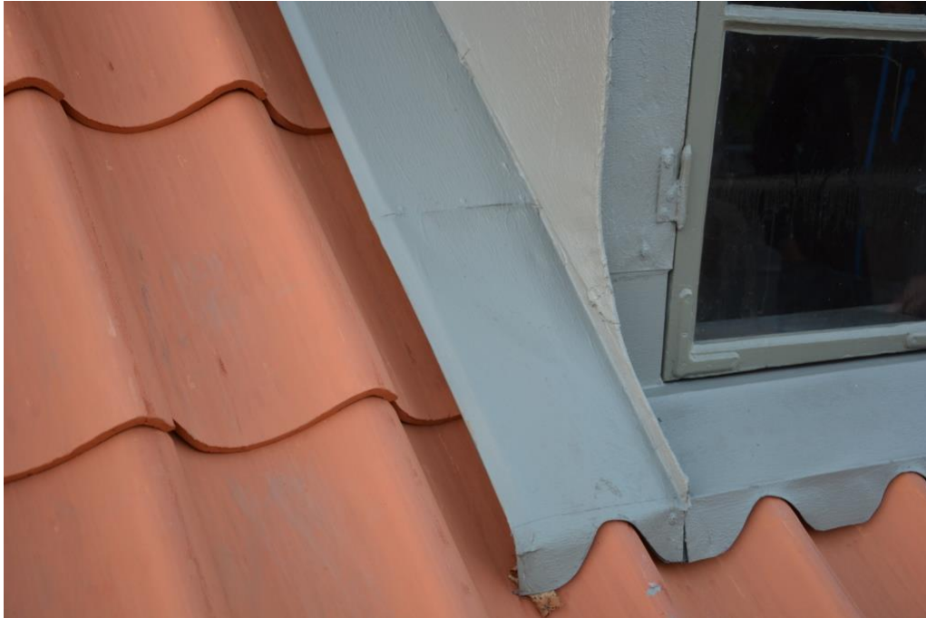
Målade plåtar kring takkupa.