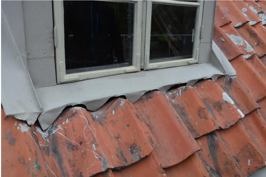
Plåtvingarna och fasoneringen var inte tillfredställande och regn- och smältvatten rann in under takpannorna.