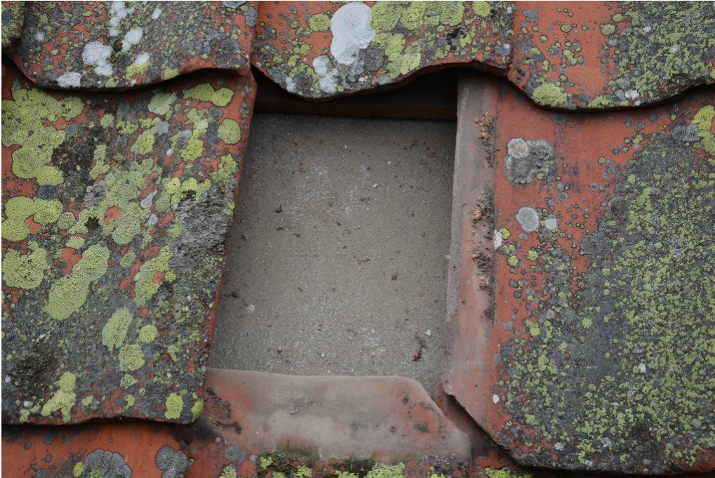
Pannorna var anfrätta av lav och underlagspappen spröd.