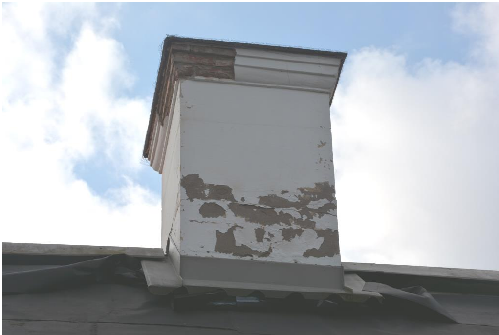
Skorsten med frostsador och putsbortfall.