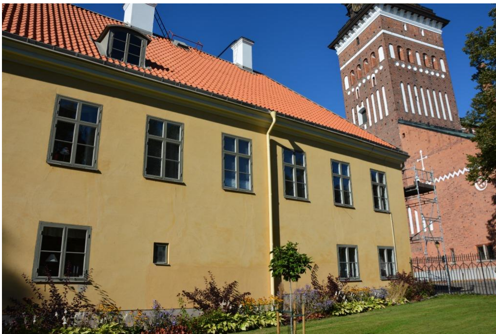
Södra fasaden efter färdigställt arbete.