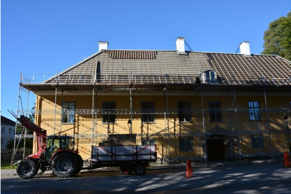
Östra takfallet under arbete. Halva takfallet är belagt med ny underlagspapp och läkt.