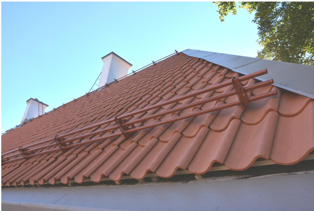
Nytt snörasskydd monterat över entrén.