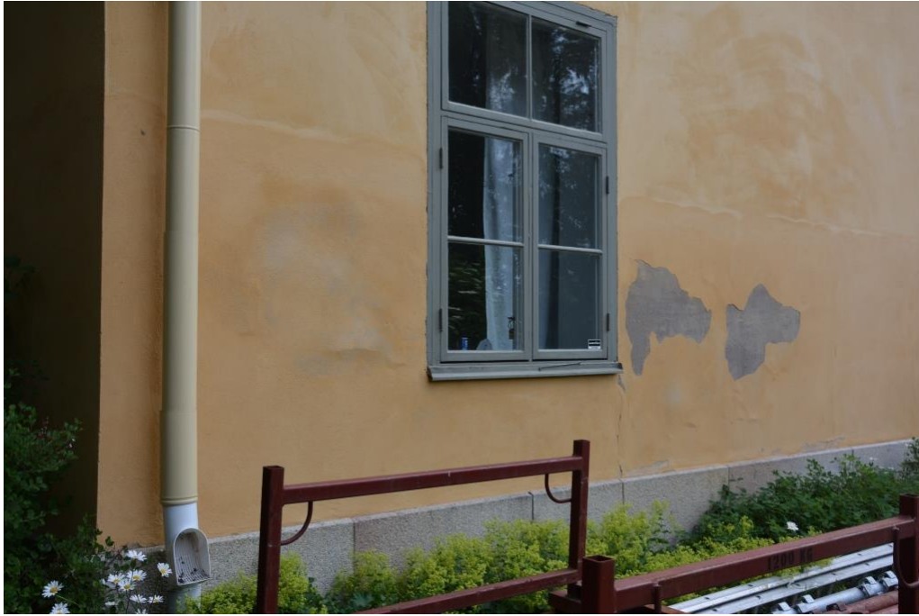
På flera ställen på fasaden fanns putsbortfall och sprickor.