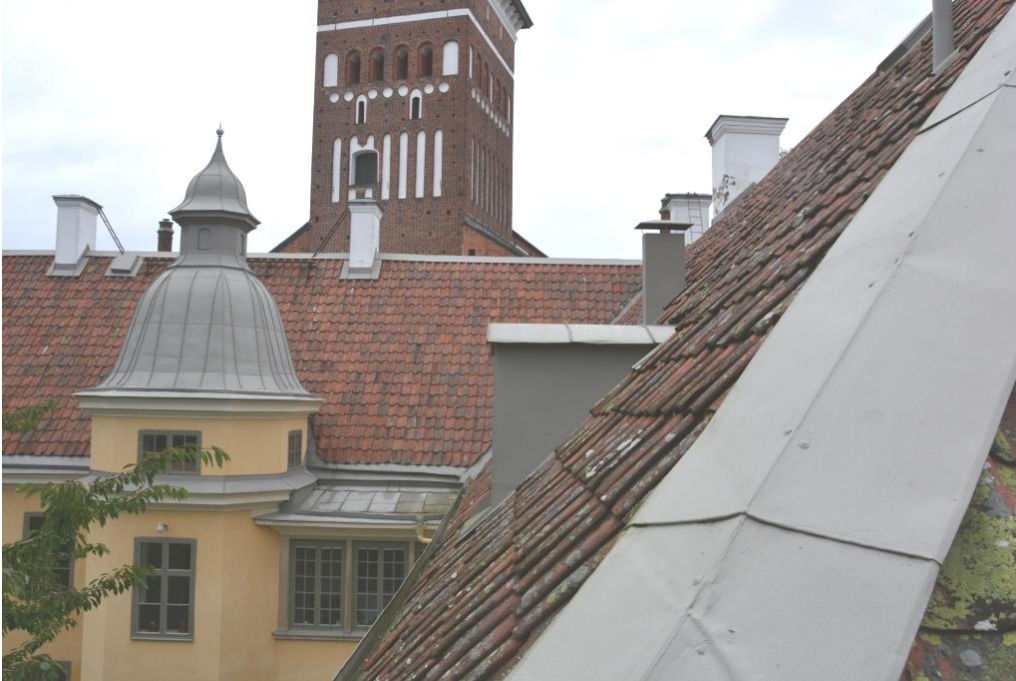
Yttertaket på Biskopsgården innan åtgärder 2015.