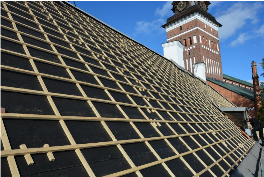
Ny underlagspapp och läkt på södra takfallet.