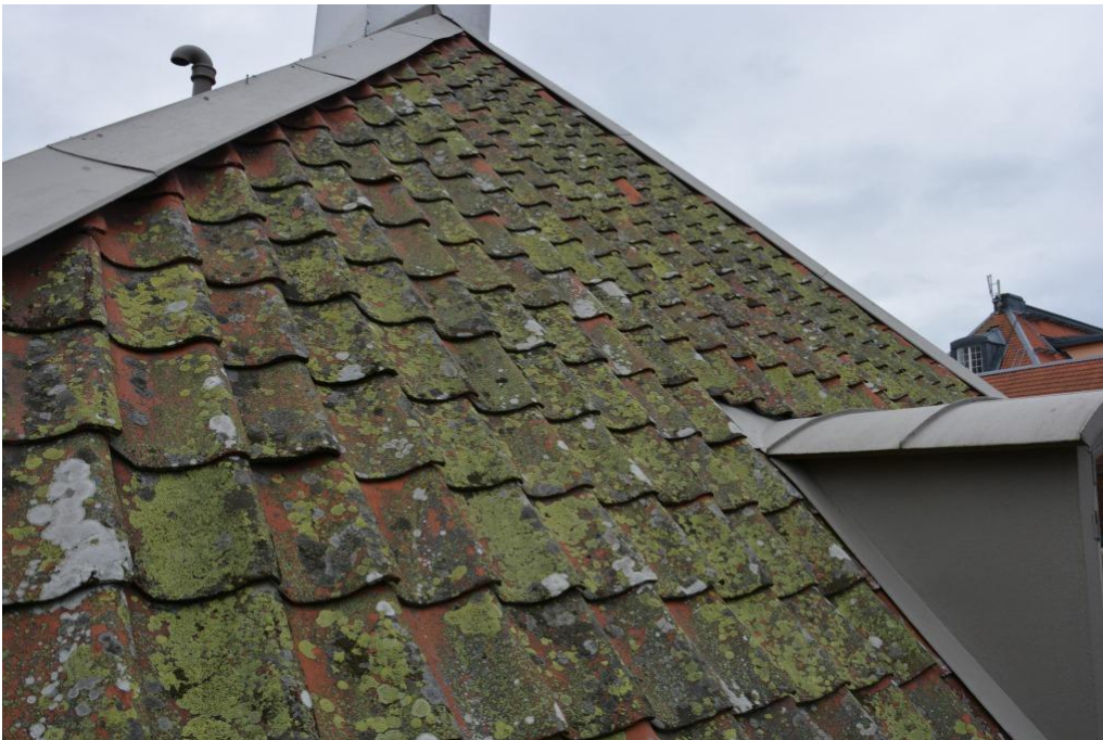
Västra gavelns takfall innan åtgärder påbörjats 2015.