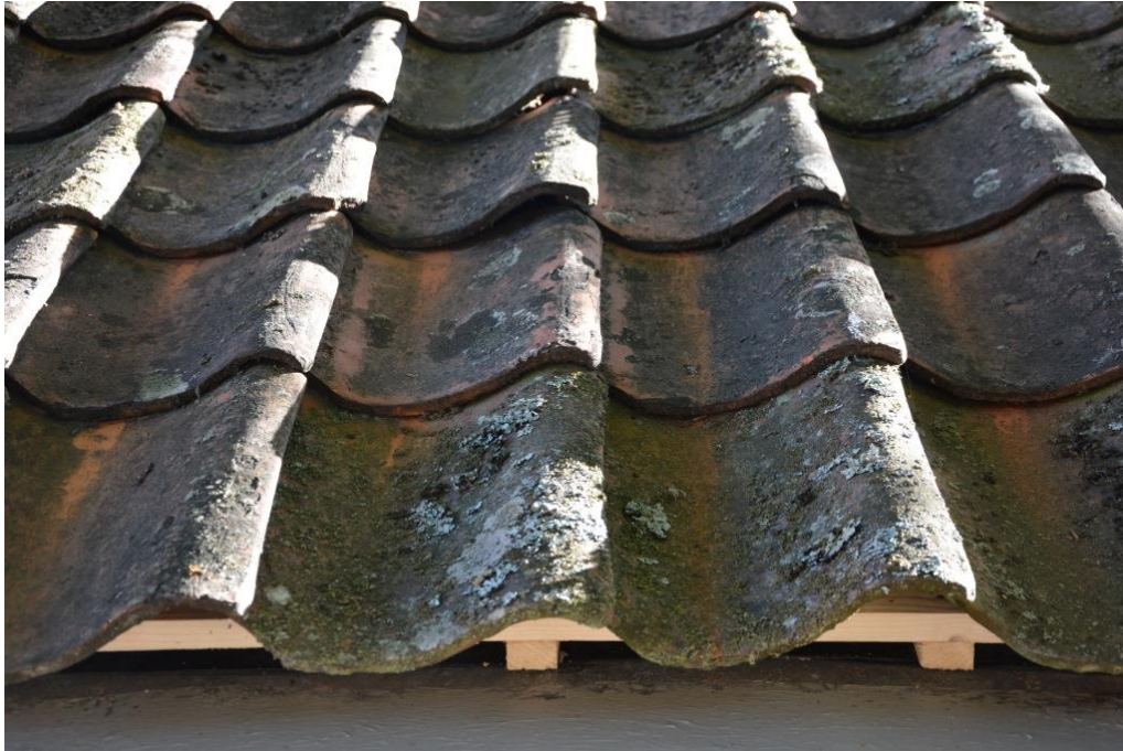
Delar av det äldre teglet sparade och lades på norra takfallet.