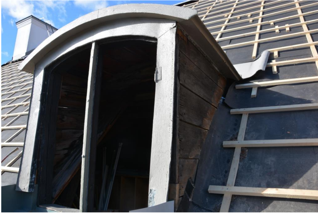
Fönsterbågarna plockades ut och målades.