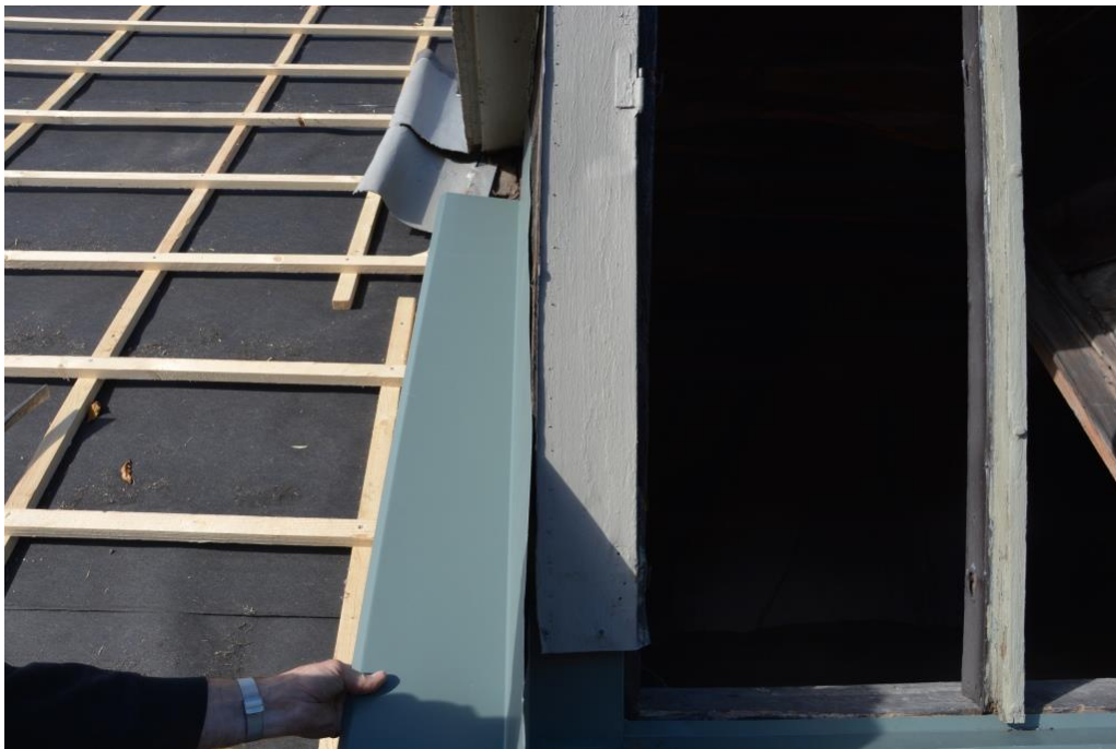
Vingarna vid sidan om takkuporna förlängdes och målades.