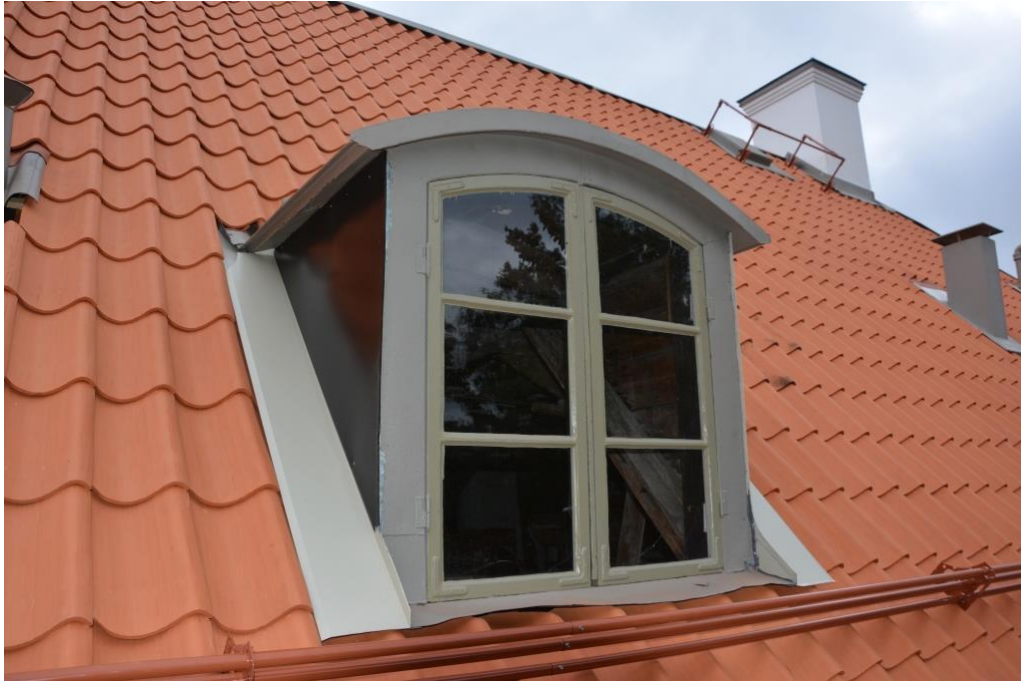
Nya tegelpannor, ny taksäkerhet kring lucka och snörasskydd. Plåtar monterade kring lucka.