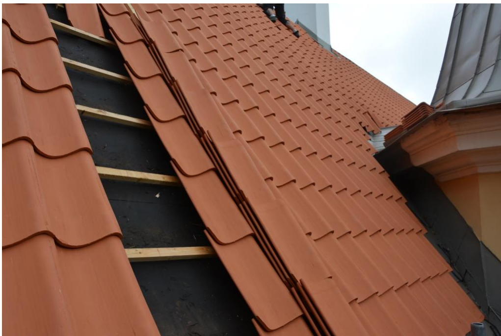
Fem av takfallen belades med nytt tegel.