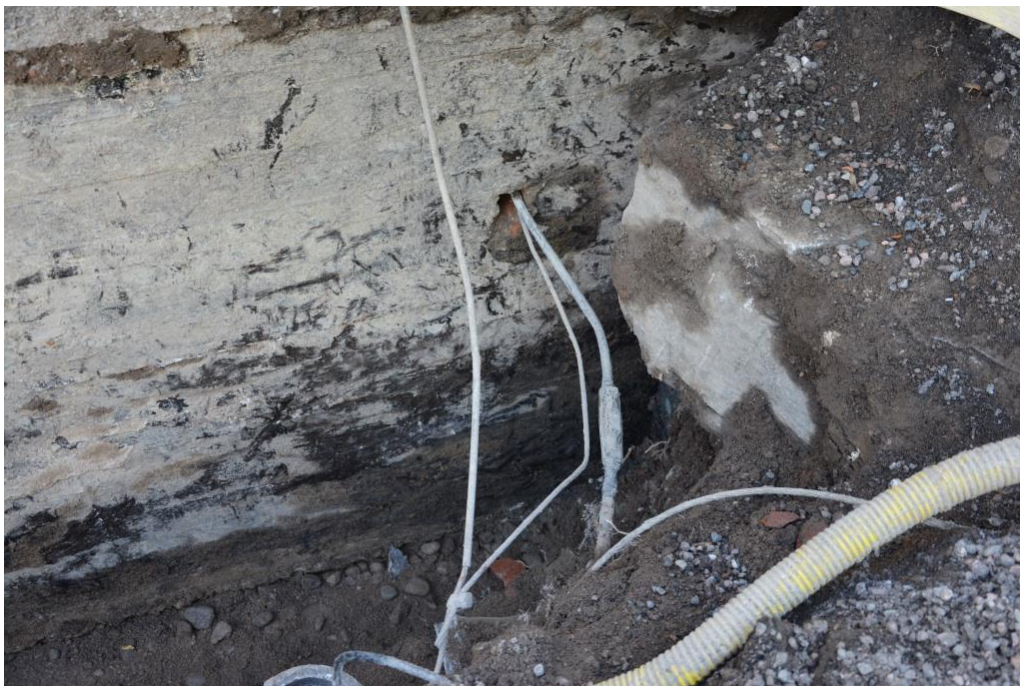
På bilden syns det hål där vatten runnit in i sakristians källare.