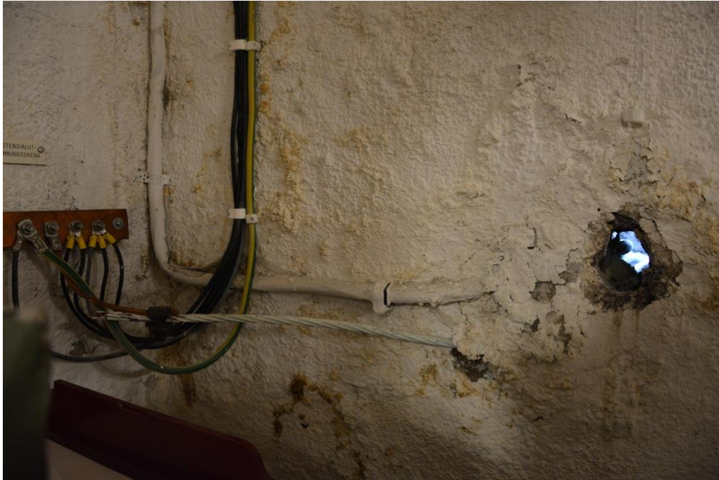
Samma hål från källaren efter att kablar tagit bort.