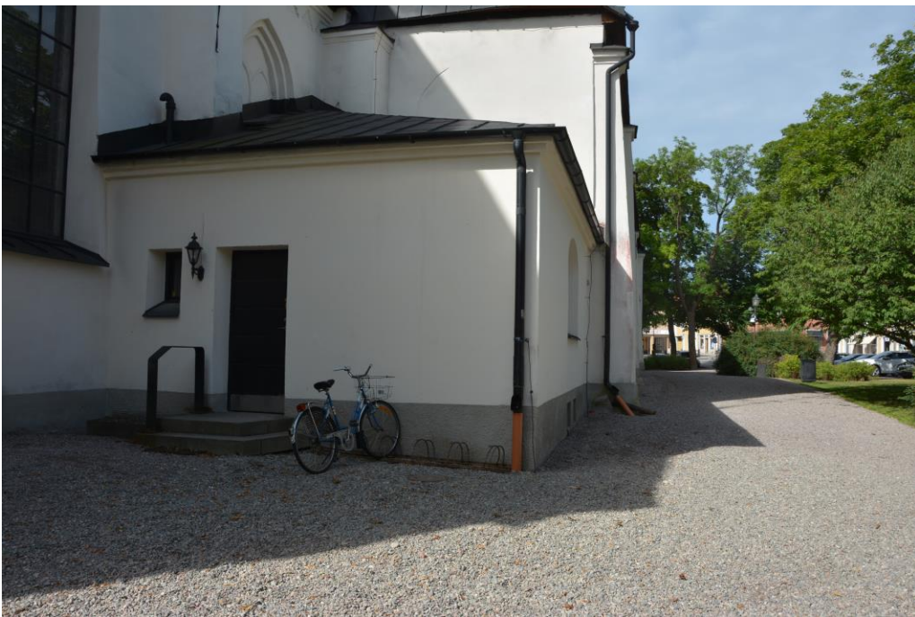
Efter arbetet återställdes ytorna kring sakristian.