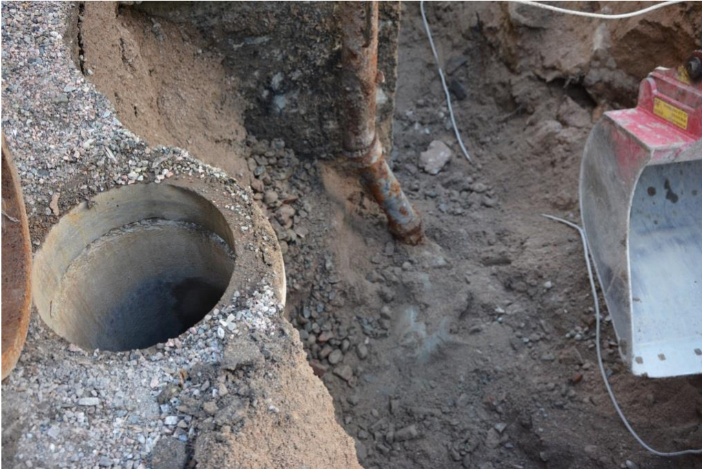
Dagvattenbrunnar och äldre vattenledning.