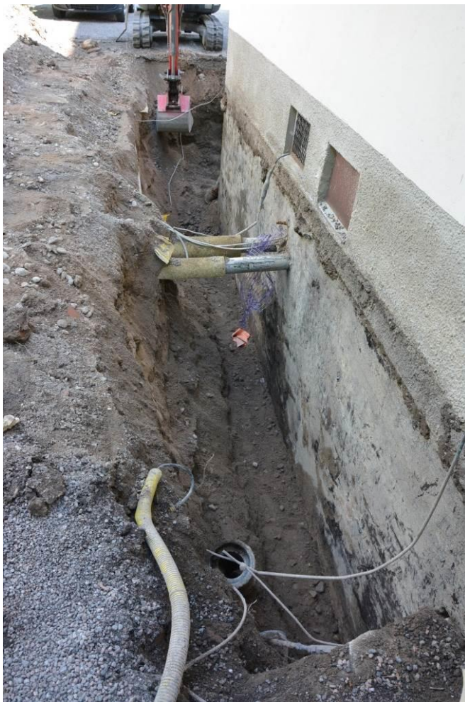
Marken kring sakristians norra vägg efter grävning.