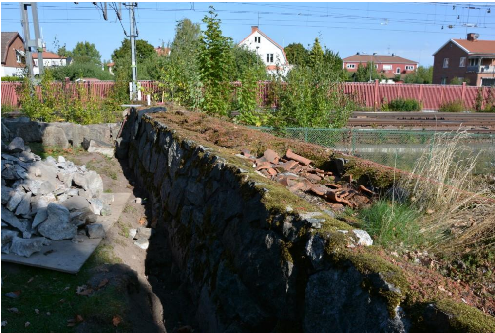
Under arbete med nordöstra hörnet och innan åtgärder på östra muren. Vlm_kmvSB-5327.