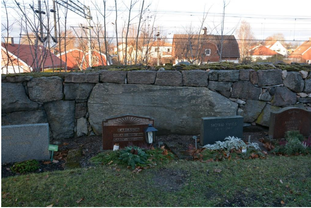
Norra muren efter återställande och återplacering av gravvårdar. Vlm_kmvEK-59.