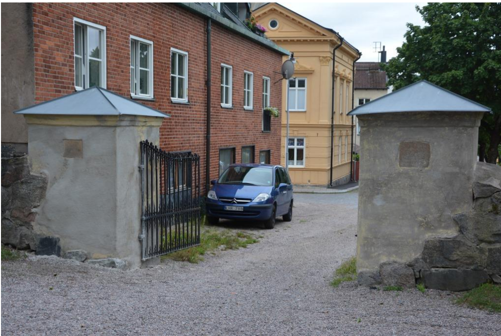
Grindstolparna under arbete med pytt putslager. Vlm_kmvSB-5169.