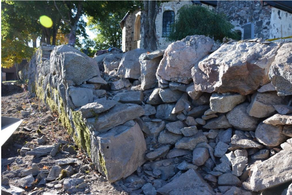
Nedplockning av östra muren. Av stenarna till vänster i bild är det fortfarande synligt hur muren lutade. Skalmurskonstruktionen syns tydligt där murens innanmäte är fyllt med mindre stenar. Vlm_kmvSB-5488