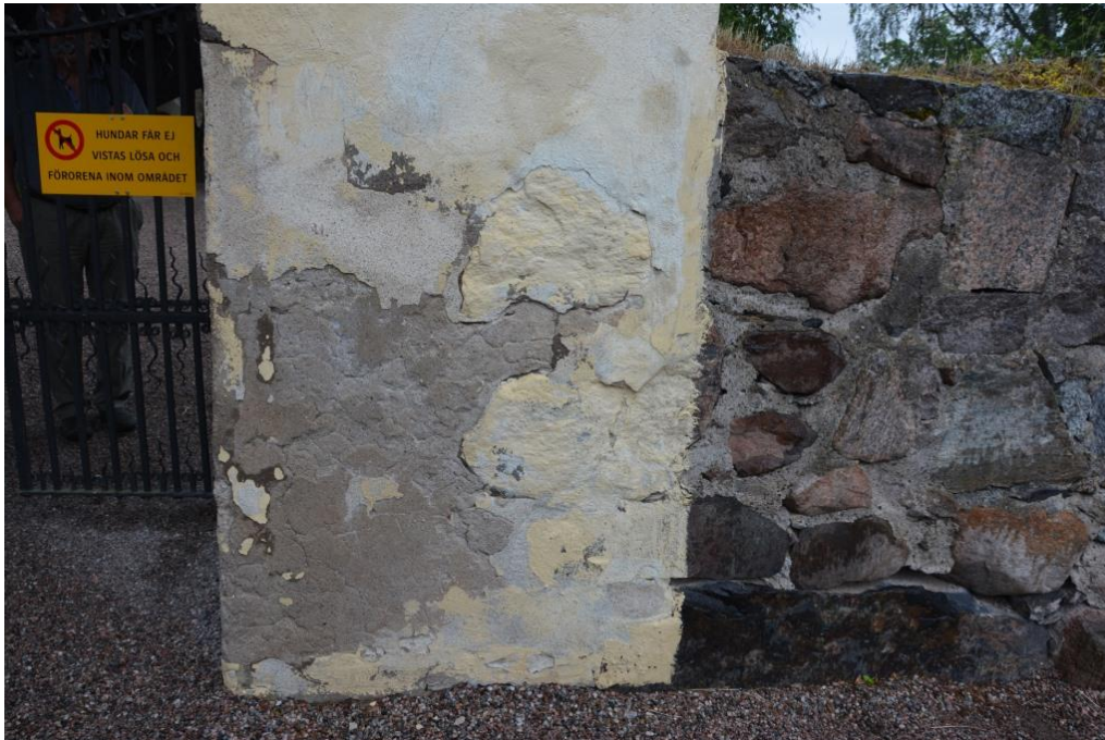
Stigluckan och delar av muren innan åtgärder. Cementlagningar och puts av olika kulörer syns. Vlm_kmvSB-4972.