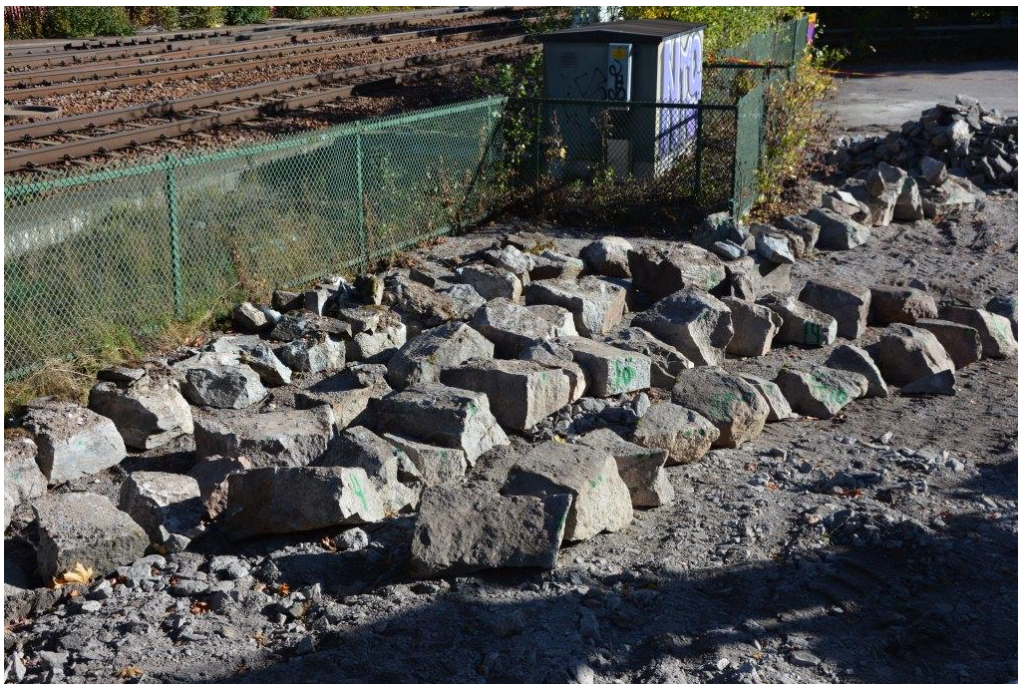
Under arbetet med östra muren och nordöstra hörnet plockade stenar i muren bort och lades i rader på den intilliggande parkeringsplatsen. Vlm_kmvSB-5482.