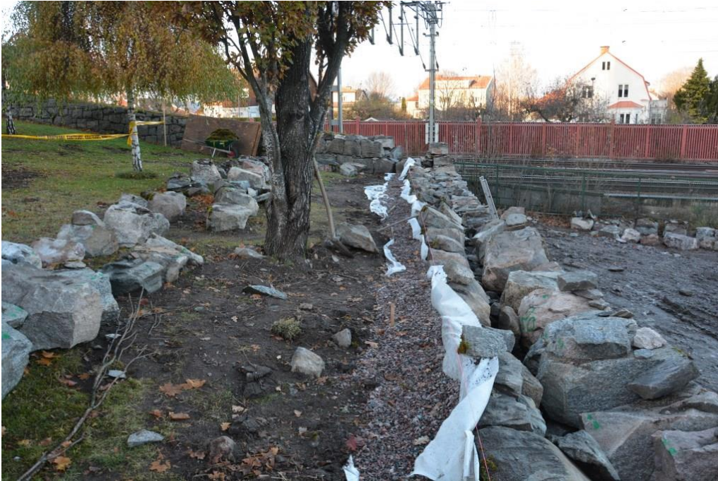
Under arbetet med den östra muren. En sträng med dräneringsgrus placerades intill muren för att underlätta dränering av vatten från den sluttande kyrkogården. Foto: Emma Karp, Vlm_kmv-63.