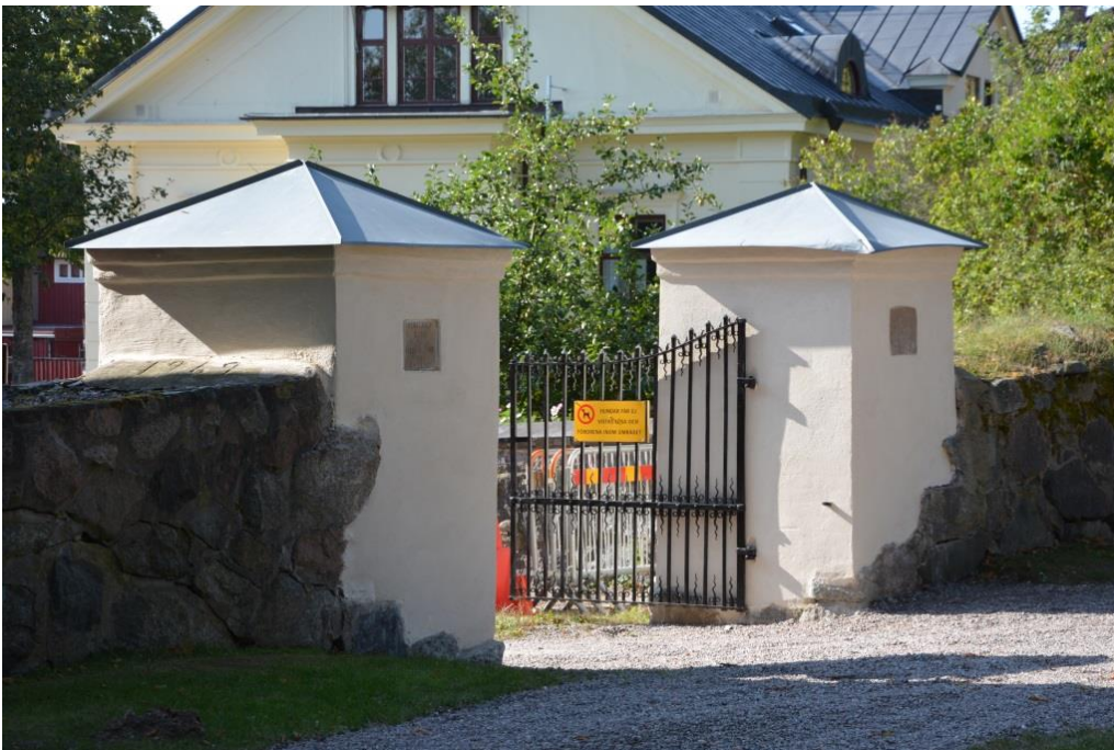
Grindstolpar efter färdigställandet med målad grind och vit kalkputs. Vlm_kmvSB-5331.