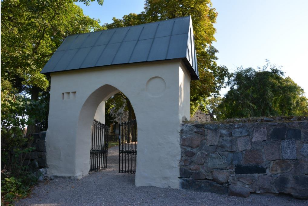
Stigluckan efter åtgärder och slutstrykning av ölandskalk. Vlm_kmvSB-5347