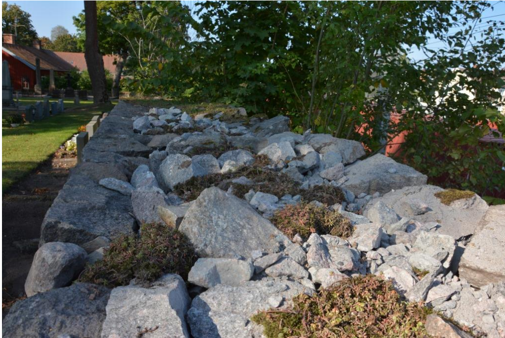
De befintliga sedumväxterna som växte på muren plockades ner och sparades under arbetets gång. De placerades ut efter klarställandet och kommer sprida sig över muren. Vlm_kmvSB-5318.