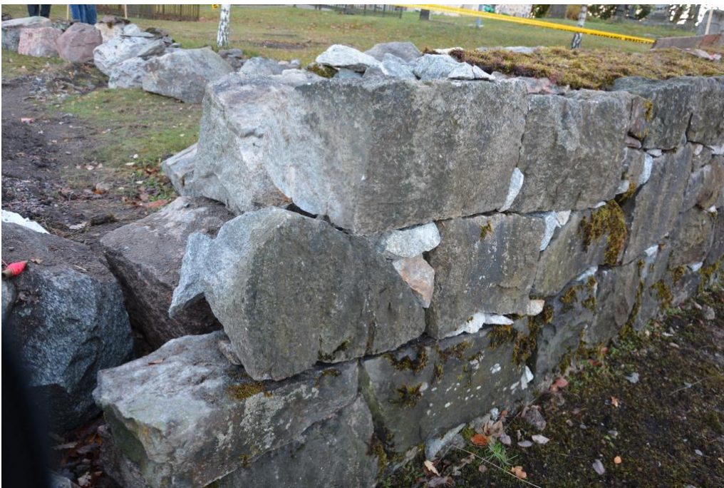
Östra muren är delvis färdigställd. Stenarna har återställt med ungefär samma placering som innan. Mindre stenar stabiliserar och fyller upp mindre hål i muren. Sedum har placerat på för att ta upp den del av vattnet som faller på muren. Vlm_kmvEK-70.