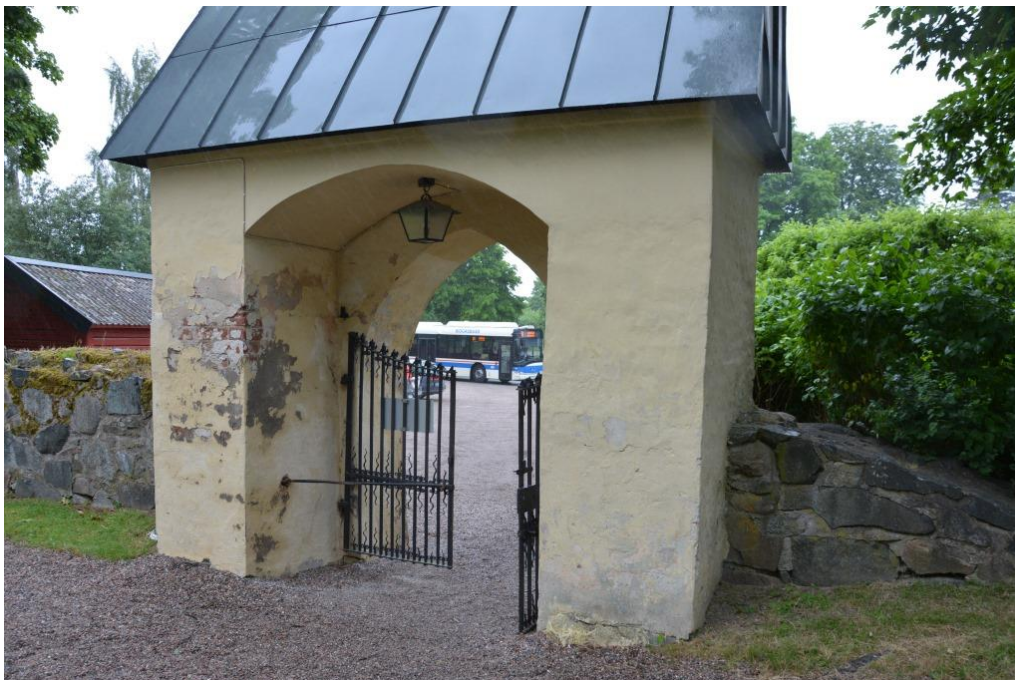
Stigluckan från kyrkogården. Frostsprängningar på teglet och cementlagningar syns på främst vänstra delen men gömmer sig bakom cementen. Vlm_kmvSB-4976.