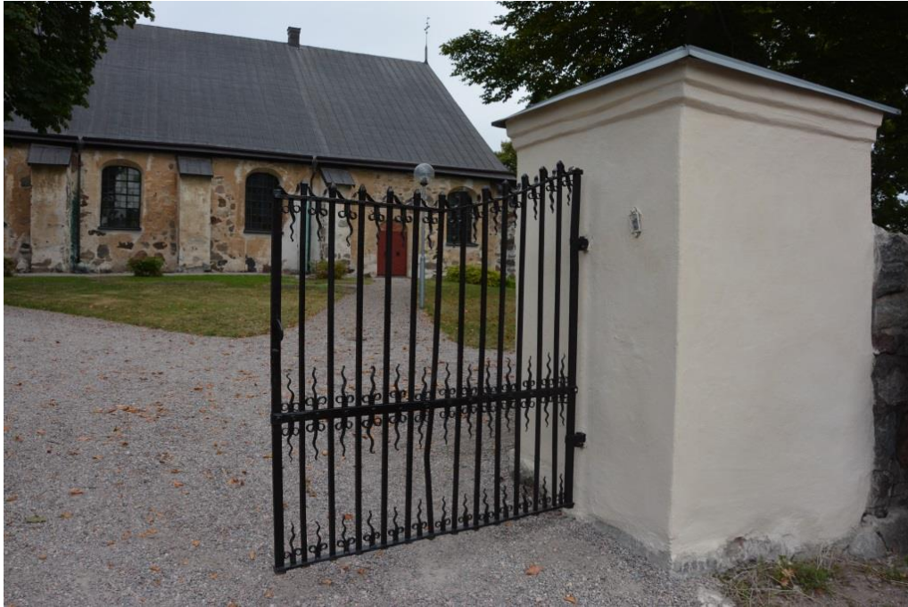
Grindstolpe med grind efter färdigställande med kyrkan i bakgrunden. Vlm_kmvSB-5343.