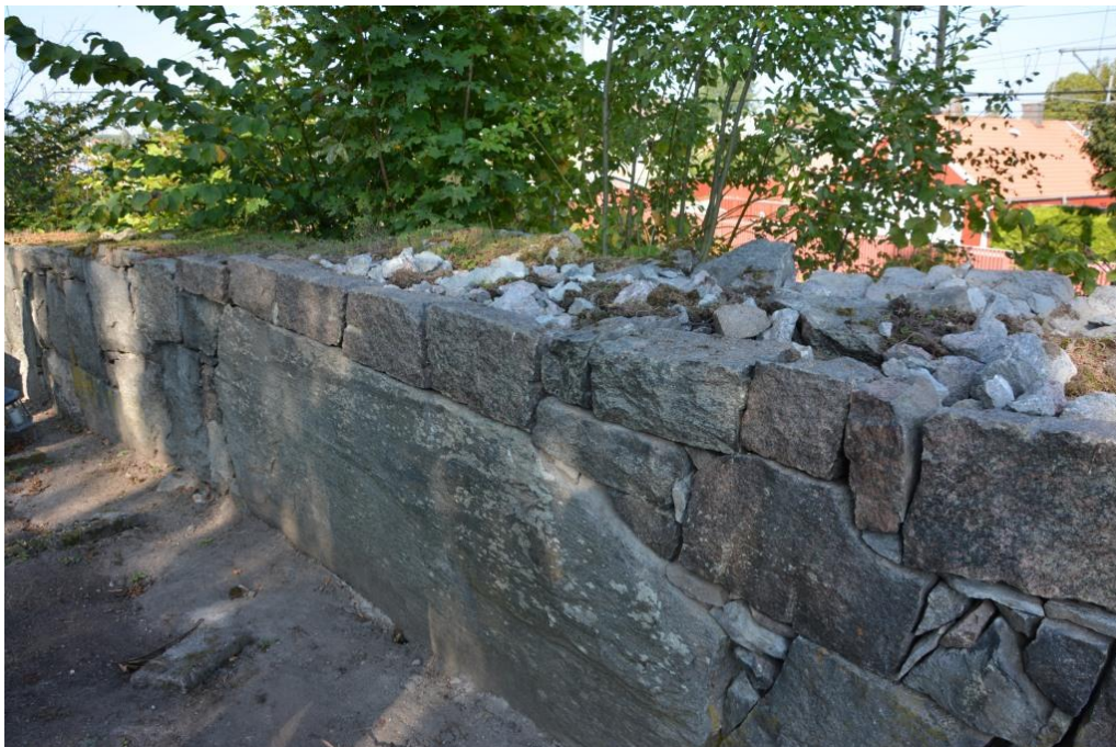
Efter färdigställandet av norra muren. Den stora stenen har inte kunnat rubbas. Stenarna kring den har åtgärdats och mindre stenar har placerats i mellanrum för att fylla och stabilisera muren. Vlm_kmvSB-5319.