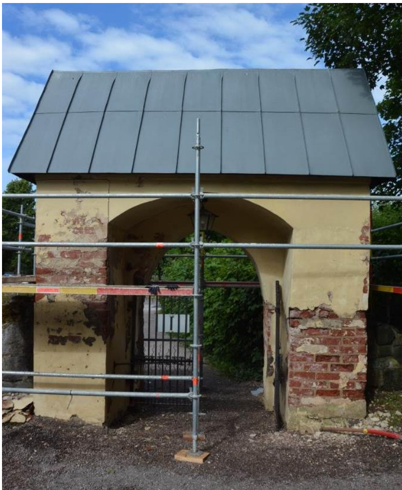
Bortknackning av cement på stigluckan mot parkeringen. Vlm_kmvSB-5164.