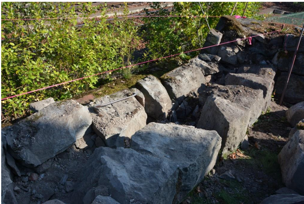
Arbetet med nordöstra hörnet. Stenar har placerats tillbaka och rättat efter rätsnören. Vlm_kmvSB-5323.