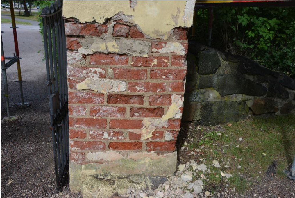
Synliga frostsador under bortknackade cementlagningar. Vlm_kmvSB-5161.