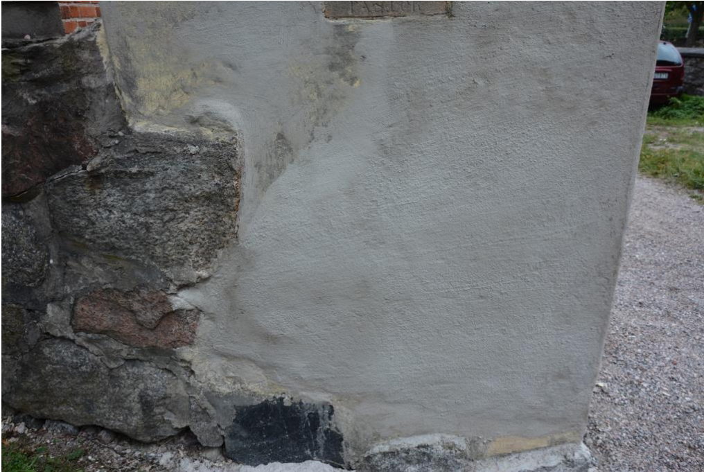
Putslagningar gjordes fram till murens naturstenar. Vlm_kmvSB-5171.