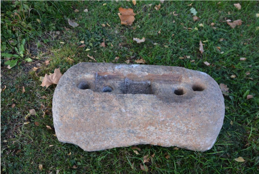
En av stenarna i muren bär märken efter en fastsättning. Troligen är detta en grundsten där det tidigare har suttit en gravvård. Vlm_kmvSB-5324.