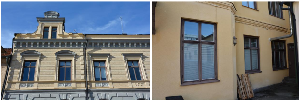
Brun kulör på fönsterkarmar och bågar innan fönsterrenovering. Arbetareföreningens gatufasad mot Slottsgatan t.v. och mot innergården t.h. Vlm-kmvVB-373, Vlm-kmvVB-338.

I april 2016 beslutade Westerås Arbetareförening i samråd med Västmanlands läns museum att samtliga fönster skulle renoveras med avseende på ytskikt. Vid tillfället fanns en oljefärg i en brun kulör på fönsterkarmar, bågar samt de två dörrarna på byggnadens baksida.