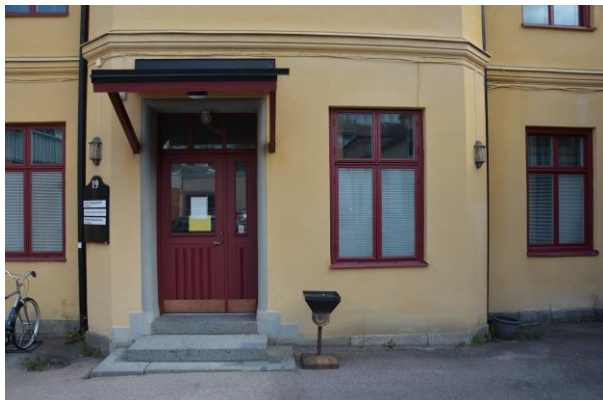
Entrédörr efter renovering. vlm-kmrvb-912.

Inför arbetet såg man även en risk för rötskadat trä. Detta påträffades på gårdsfasadens fönster på bottenvåningen, och även vid dörrlist. Östermalms Snickeri anlätades som underentreprenör för att åtgärda dessa innan fönstren målades. Inget trä behövde bytas på gatufasaden.