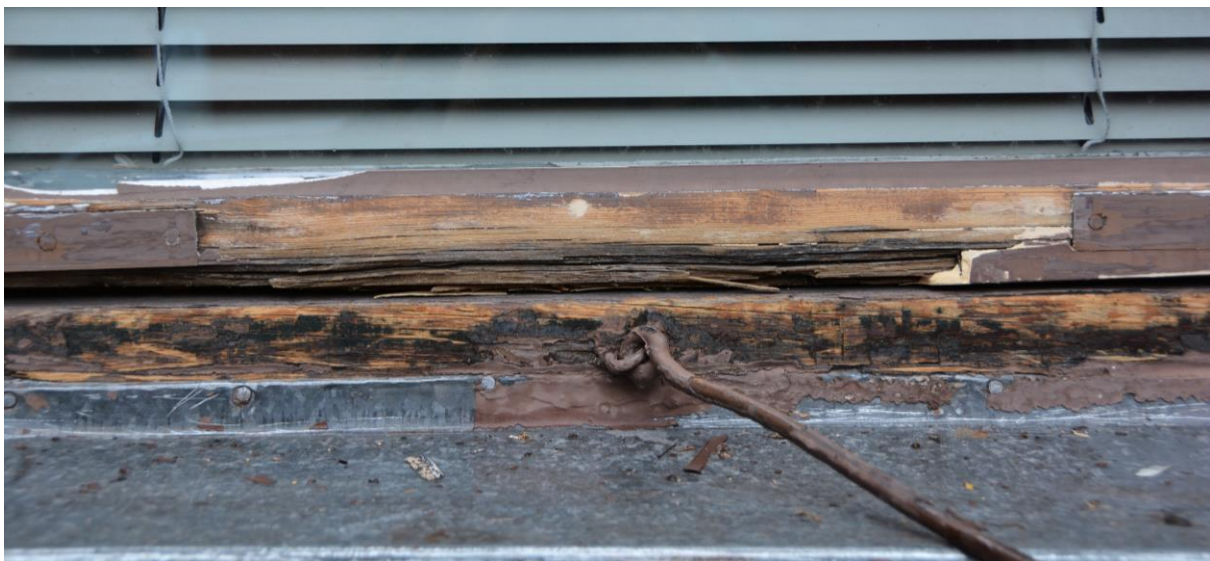
Rötskadat trä på fönster på gårdsfasaden. Vlm-kmvVB-487.

Inför arbetet nämndes det en risk för trasiga fönsterglas, i vilket fall de hade ersatts med så kallat polskt kulturglas. Inga fönster påträffades trasiga och inga gick sönder under arbetets gång. Fönsterkitt som inte var intakt kompletterades.