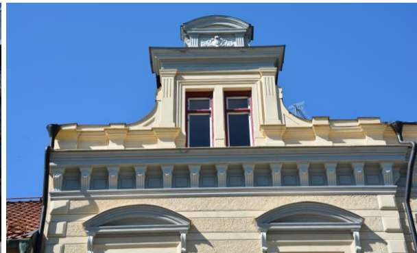
Detalj av frontespis och fronton åt söder på gatufasaden. Vlm-kmvVB-604.

Till skillnad från gatufasaden saknar fasaden in mot gården utsmyckningar förutom gördellisten som delar av den undre och övre våningen. Även denna fasad är indelad i tre vertikala fält, med en mittrisalit, mer framskjutande än sidorisaliterna på framsidan. Ovanför entrédörren finns ett skärmtak täckt i svart plåt, och de tre trappstegen som leder upp mot dörren är i granit, liksom sockeln som är lägre på gårdsfasaden än sockeln på gatufasaden. Fasaden är spritputsad, och den sandgula kulören är densamma på båda fasaderna. Taket är lagt i svart bandplåt och samtliga stuprör är svartmålade.