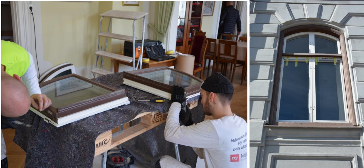
Pågående isärtagning av yttre fönsterbågar t.v. Borttagna yttre fönsterbågar t.h. Vlm-kmvVB-334, Vlm-kmvVB-377.

Målerispectrum som utförde måleriarbetet använde sig av linoljefärg från Wibo Färg AB, och använde Wibos 3-stegsmetod, kallad Wiboline 3-steg . All lös sittande färg skrapades bort och även allt löst sittande kitt. De trärena ytorna oljades med kinesisk träolja som grund, sedan följde tre strykningar med Wibos linoljefärg i en järnoxidröd kulör med NCS-numret 5040-R.