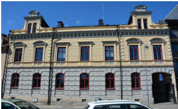
Byggnadens gatufasad under pågående fönsterrenovering. Vlm-kmvVB-600.

övervåningen. Fasaden är uppdelad i tre vertikala fält där de övre fönstren på mittpartiet har raka kornischer och de två sidofälten, som har svagt framskjutande risaliter, har fönster med segmentsformade kornischer. Sidorisaliterna kröns av gavelformade frontespiser med barockartade frontoner. Under fönstren på den övre våningen finns en gördellist med fyllningar av bladornament och ett S i relief. På platsen för det mittersta fönstret på den övre våningen har det tidigare funnits en balkong, och idag finns i gördellisten under sagda fönster bokstäverna ”WAF” (Westerås Arbetareförening) i relief. I det nedre hörnet mot norr finns en entré med en gjutjärnsgrind och med rundat överstycke som leder in mot innergården.