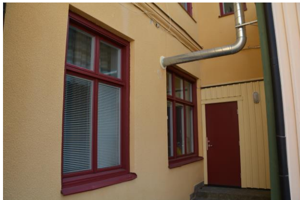
Sidodörr till höger om entrédörr. vlm-kmrvb-914.

Även huvudentrédörren målades i samma röda kulör som fönstren. Dörren erhöll även ett nytt sparkskydd i koppar. En sidodörr, placerad till höger om huvudingången, byttes ut i sin helhet och målades även den i samma kulör som övriga träarbeten. Den nya dörren erhöll inte samma utseende som den tidigare. Den nya dörren är helt slät medan den tidigare var spegelindelad.