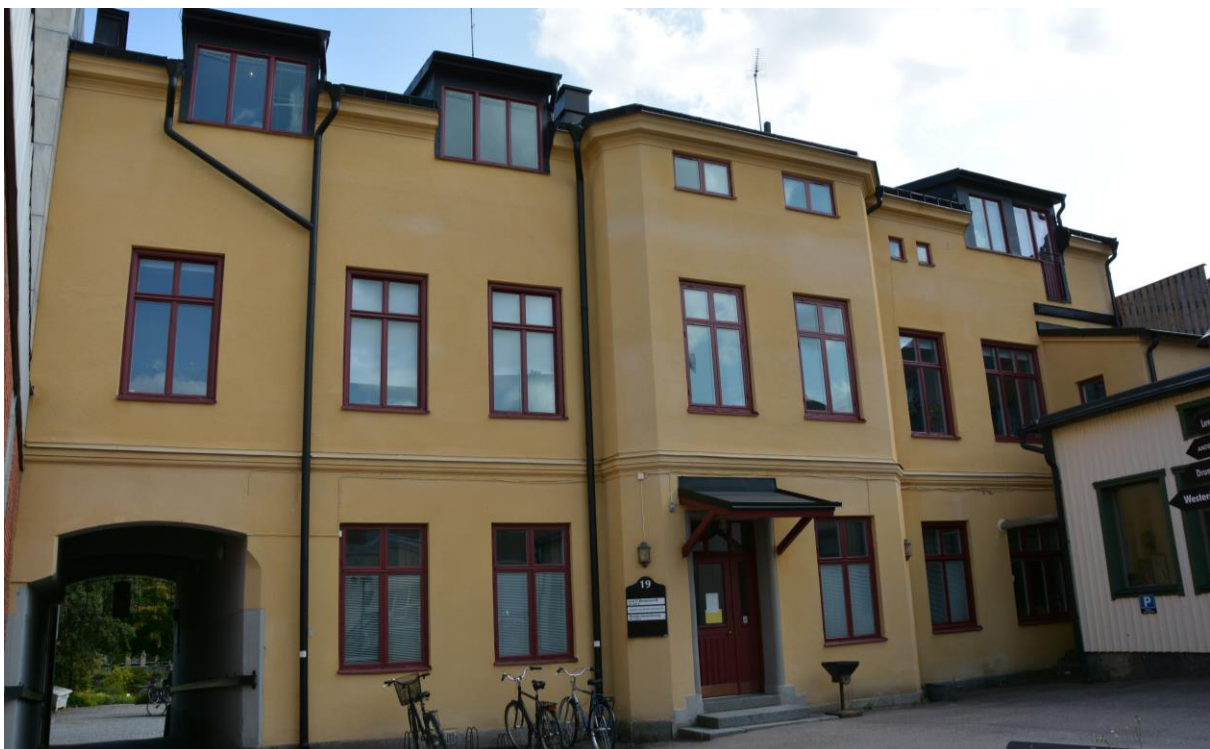
Byggnadens gårdsfasad efter utförd fönsterrenovering. vlm-kmvvb-906.

Till skillnad från gatufasaden saknar fasaden in mot gården utsmyckningar förutom gördellisten som delar av den undre och övre våningen. Även denna fasad är indelad i tre vertikala fält, med en mittrisalit, mer framskjutande än sidorisaliterna på framsidan. Ovanför entrédörren finns ett skärmtak täckt i svart plåt, och de tre trappstegen som leder upp mot dörren är i granit, liksom sockeln som är lägre på gårdsfasaden än sockeln på gatufasaden. Fasaden är spritputsad, och den sandgula kulören är densamma på båda fasaderna. Taket är lagt i svart bandplåt och samtliga stuprör är svartmålade.