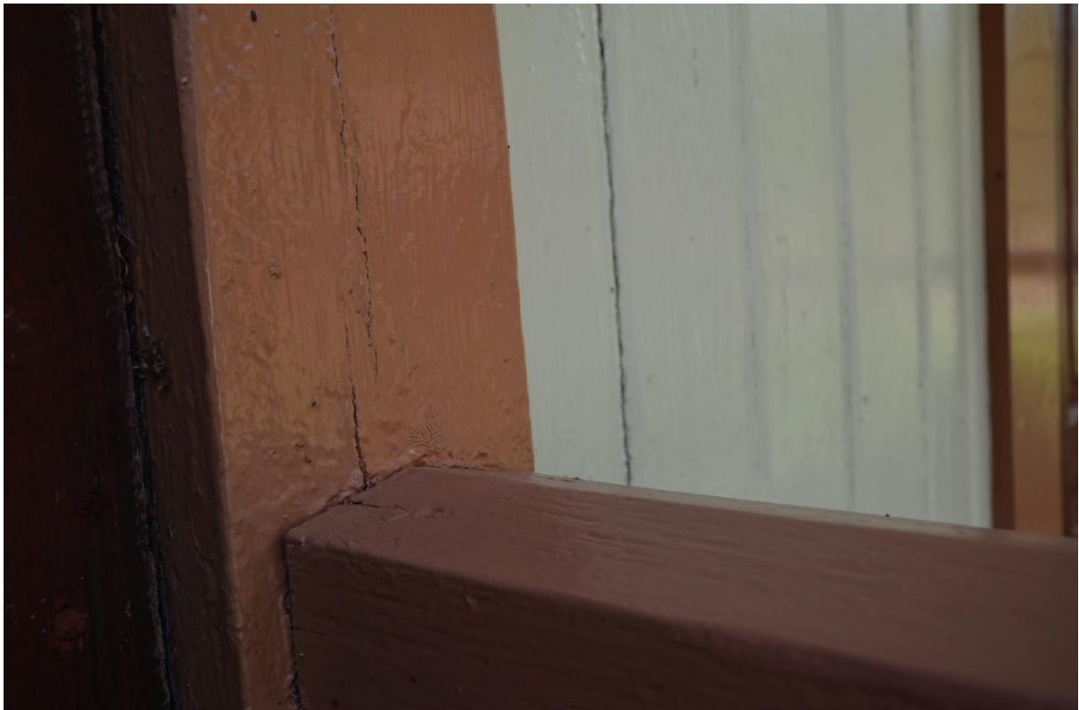
Andra slutbesiktningen. Kvarstående tjocka och ojämna lager med linoljefärg. Vlm-kmvat-0562