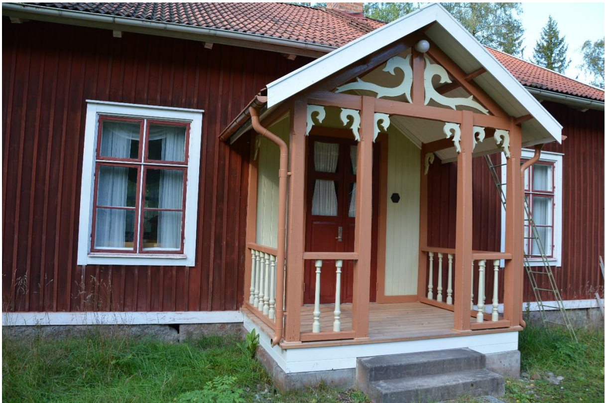
Första slutbesiktningen. Ny färgsättning och nytt golv. Vlm-kmvcm-1232