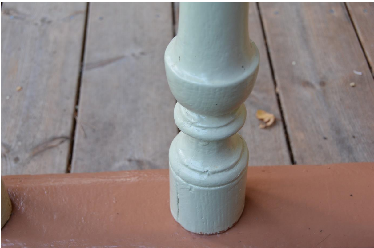
Slutbesiktning. Detaljfoto av balusterdocka. Skrynklor är åtgärdade men färgskiktet ger ännu ett något tjockt intryck. Vlm-kmvab-0203