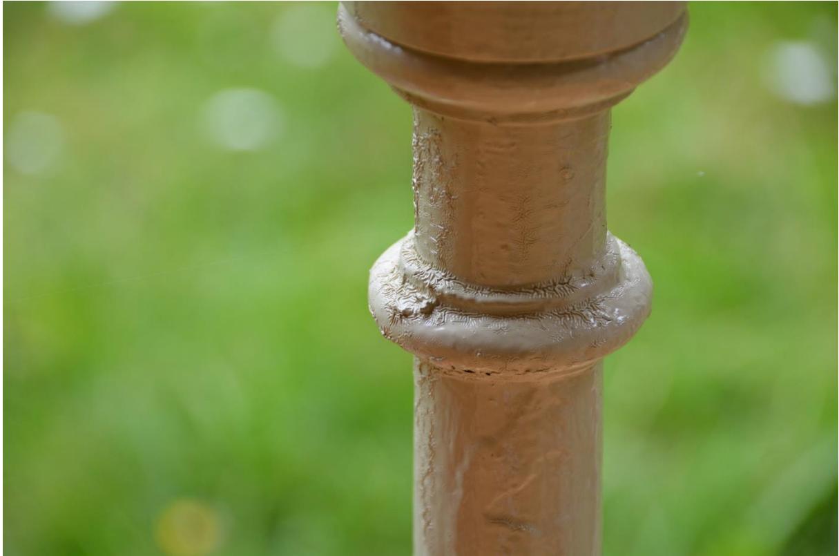
Första slutbesikningen. Balusterdocka med för tjockt lager linoljafärg, som skrynklat sig. Vlm-kmvcm-1102