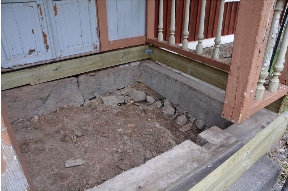
Verandagolvet borttaget. Vlm-kmvcm-1071