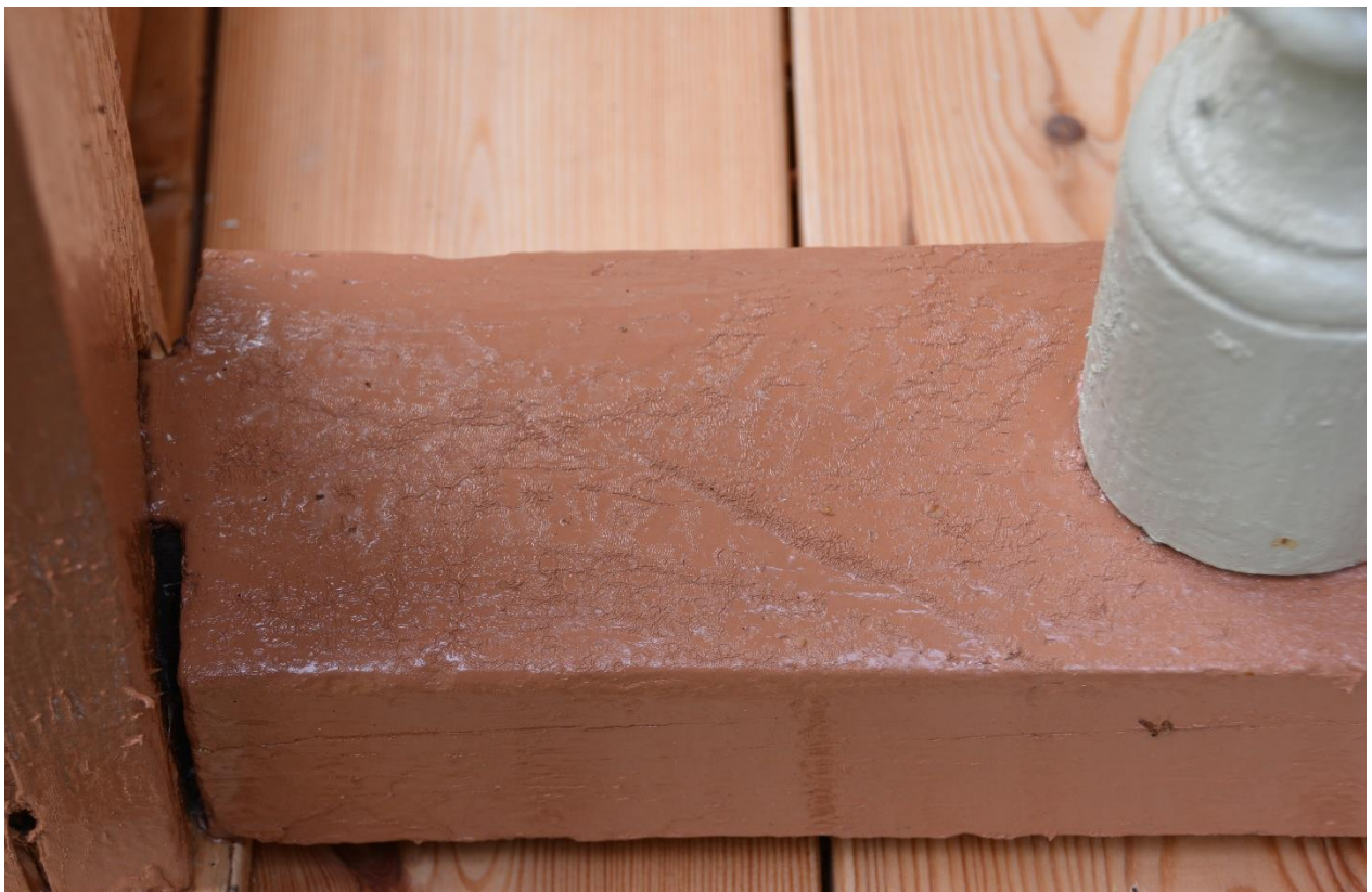
Första slutbesikningen. Underliggare med för tjockt lager linoljafärg som skrynklat sig. Vlm-kmvcm-1127