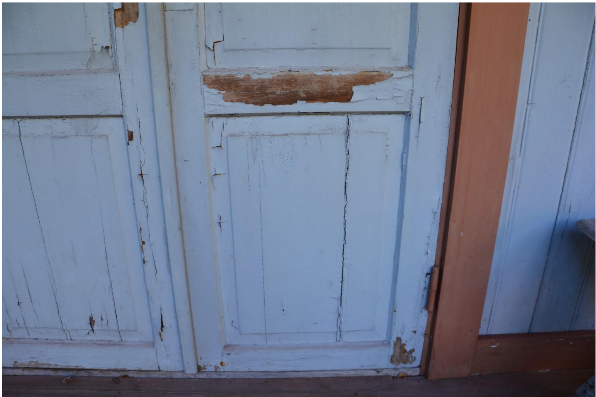
Flagnande färg på pardörrarna. Vlm-kmvm-0063