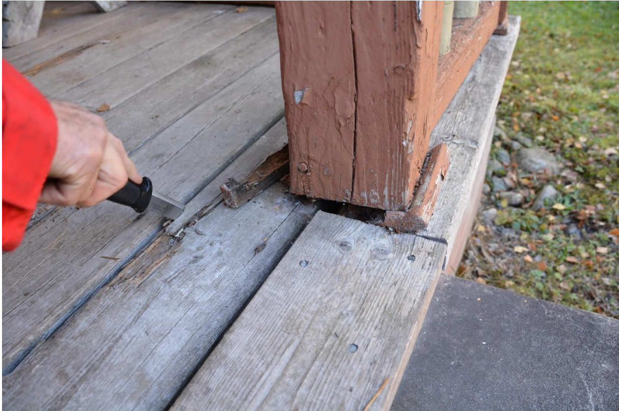
Rötskadat golv till verandan. Vlm-kmvm-0061