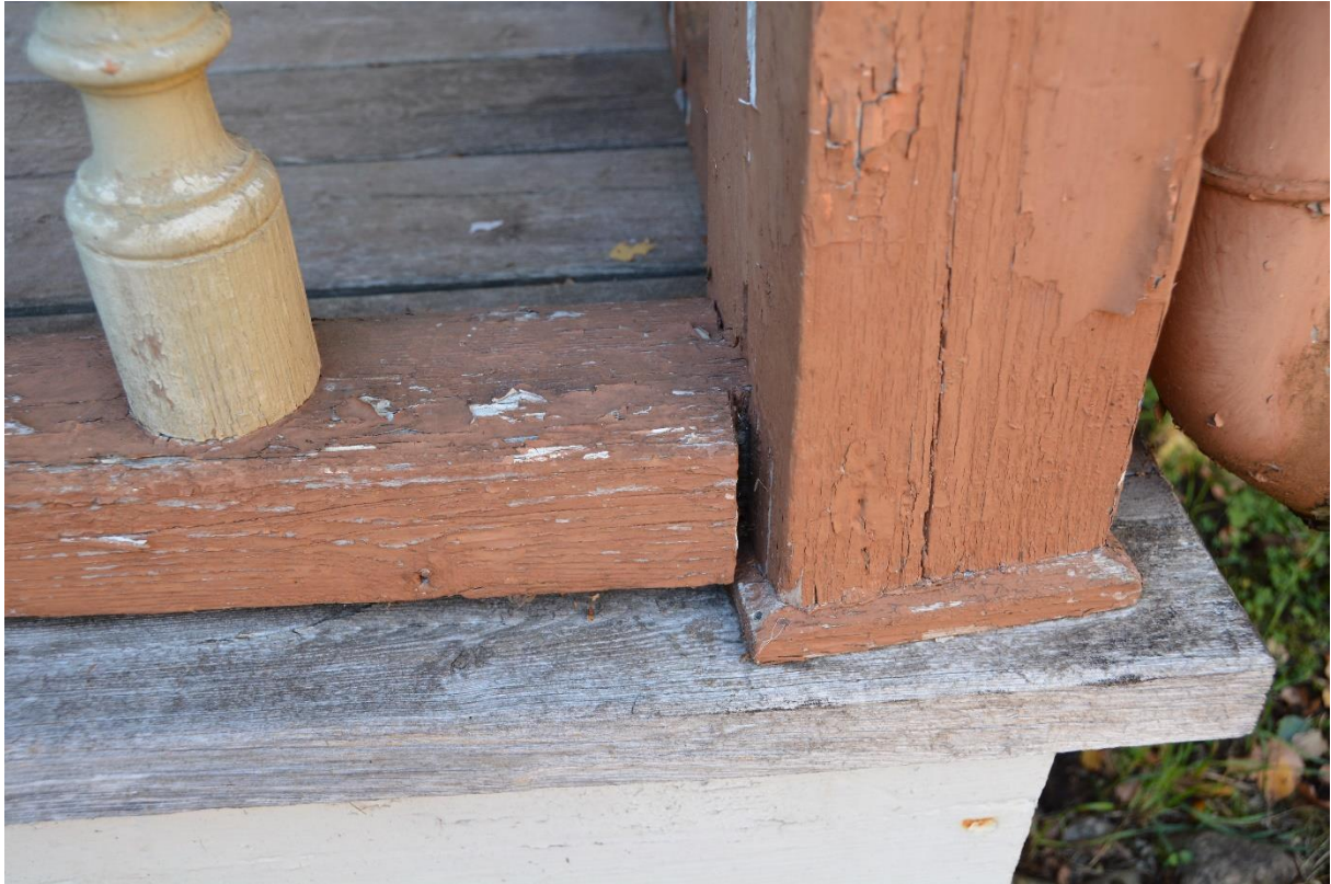
Flagnande färg på underliggare och stolpar. Vlm-kmvm-0053