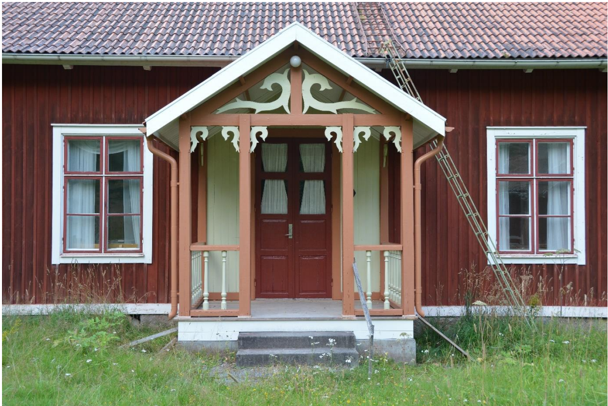
Slutresultat av renoveringsarbetena av Malma Spiras veranda. Vlm-knvab-0215