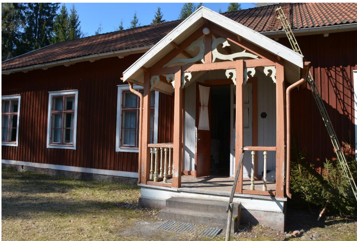
Verandan innan påbörjat arbete. vlm-kmvm-1043