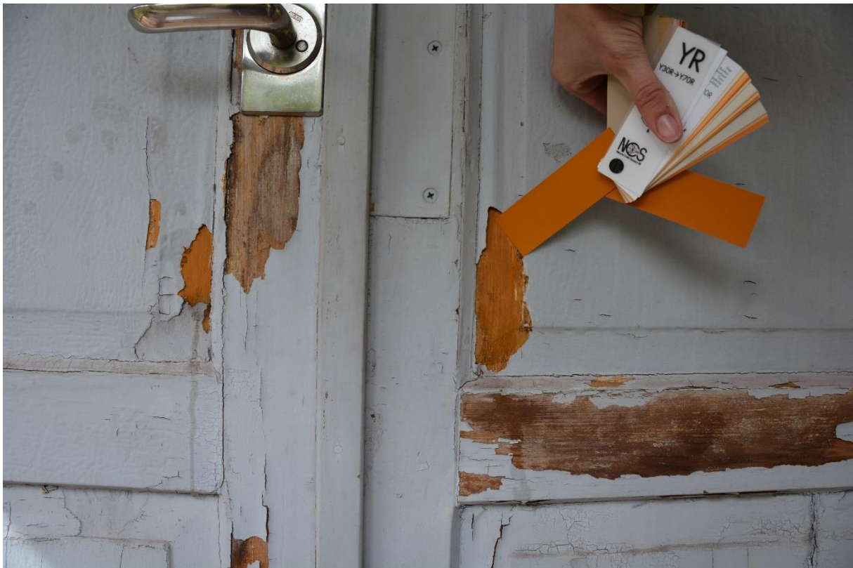
Bestämning av dörrens ursprungliga kulör. Vlm-kmvm-1061