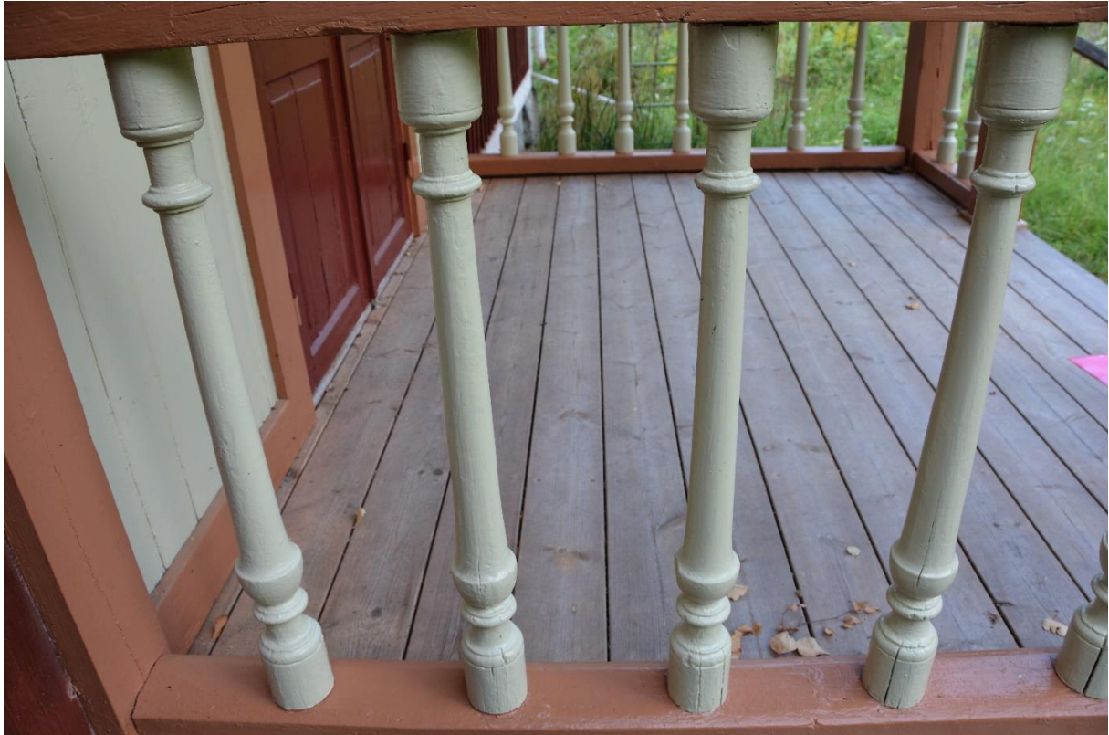
Slutbesiktning. Balusterdockor och det nya verandagolvet. vlm-kmvab-0199