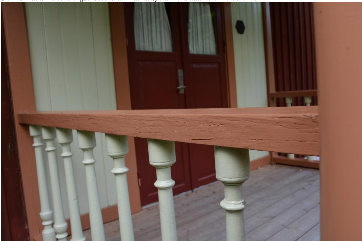
Slutbesiktning. Överliggare och balusterdockor. Vlm-knvab-0210