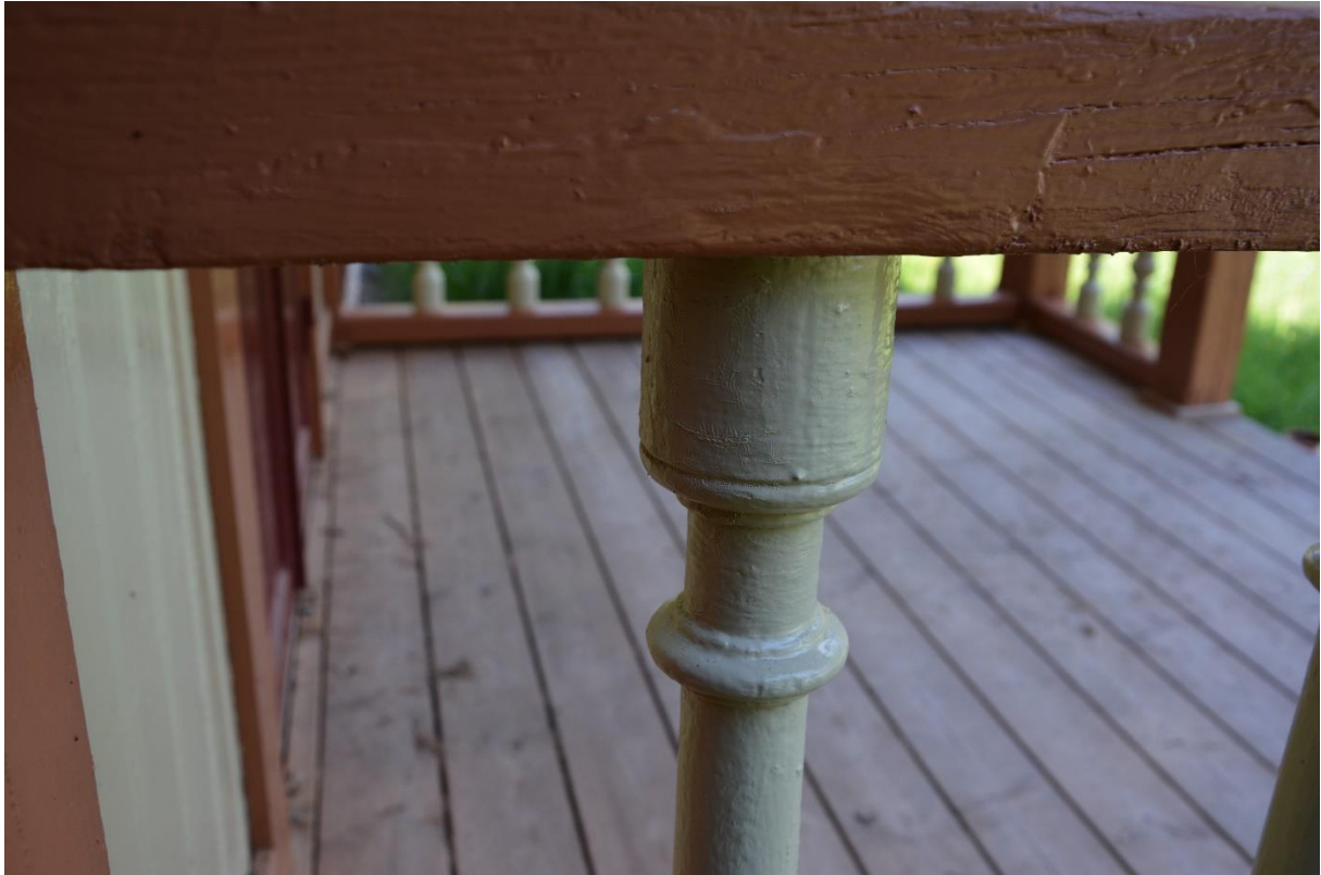
Andra slutbesiktningen. Färgskiktet ser bättre ut men rynkor och ojämnheter kvarstår. Rynkor kvarstår. Vlm-kmvat-0563