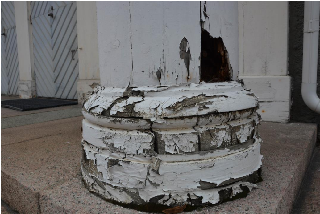
Rötskadad pelare vid entré innan fasadrenoveringen. Vlm-kmvek-2189.