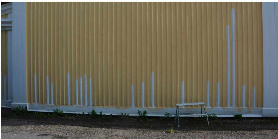
Utbytta locklister målas. Vlm-kmvek-2850.