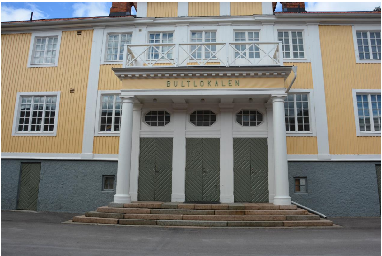
Entréparti på den södra fasaden. Vlm-kmvek-2878.