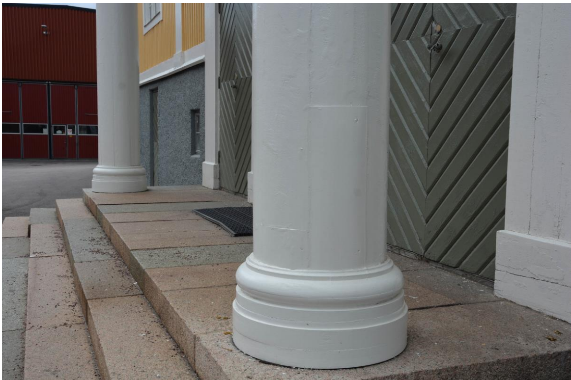
Renoverad pelare där rötskadade delar har bytts ut. Nymålad grön entrédörr. Vlm-kmvek-2864.