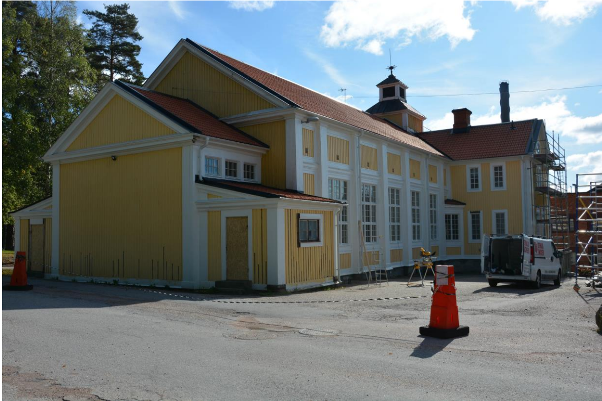
Skadade locklister har tagits bort på norra gaveln. Vlm-kmvek-2832.