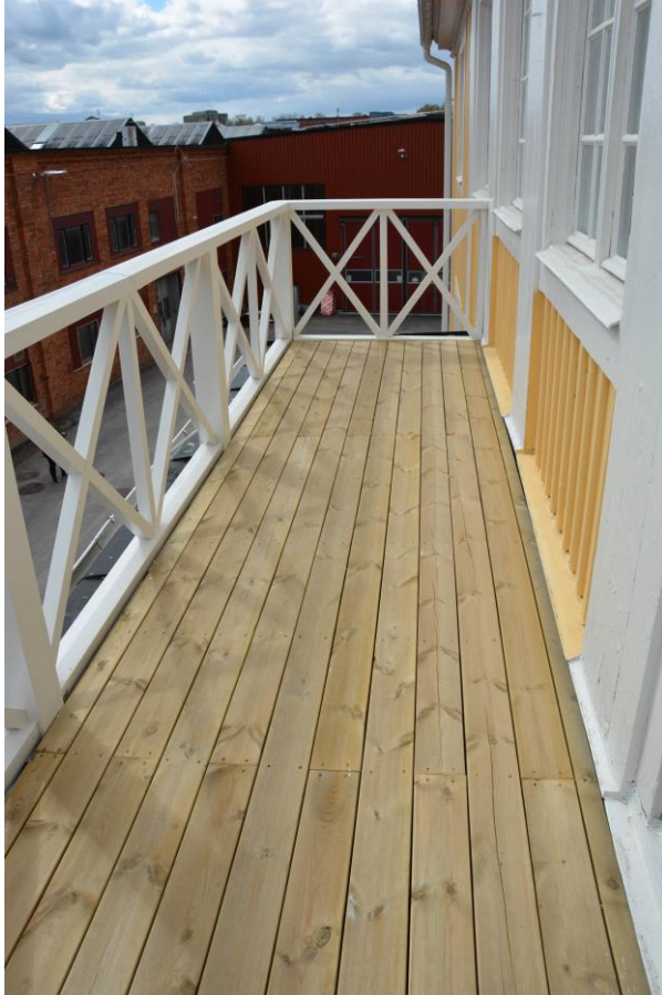
Ny trall på balkong och nya vitmålade räcken. Vlm-kmvek-2868.