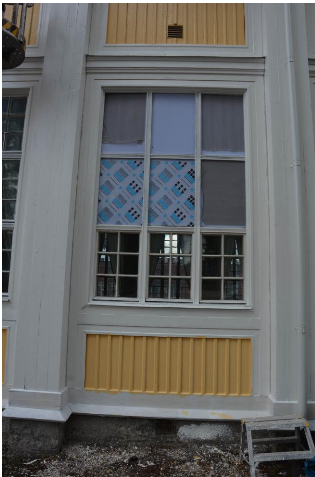
Fasaden har börjat att målas och fönster skickas successivt iväg för att kittas om. Vlm-kmvek-2797.