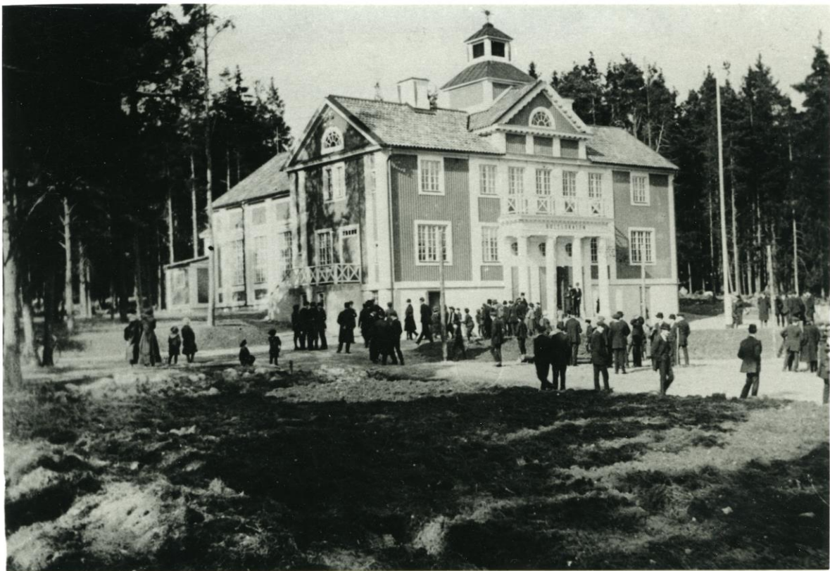
Nyuppförd Bultlokalen. Foto taget cirka 1914. Fotograf okänd. Notera att balkongräcken och fönster inklusive mittposter och karmar är vitmålade.