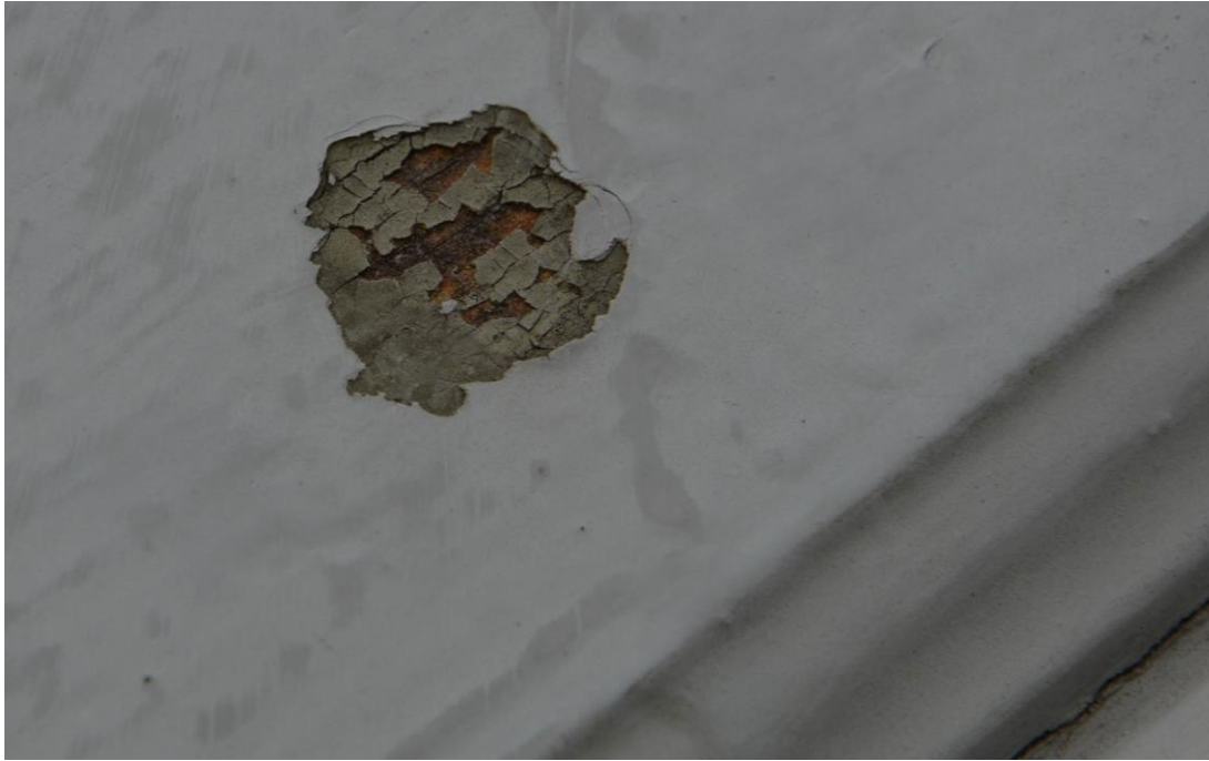
Grön kulör på dörrar har skrapats fram och efterliknas vid ommålning av dörrarna. Vlm-kmvek-2793.