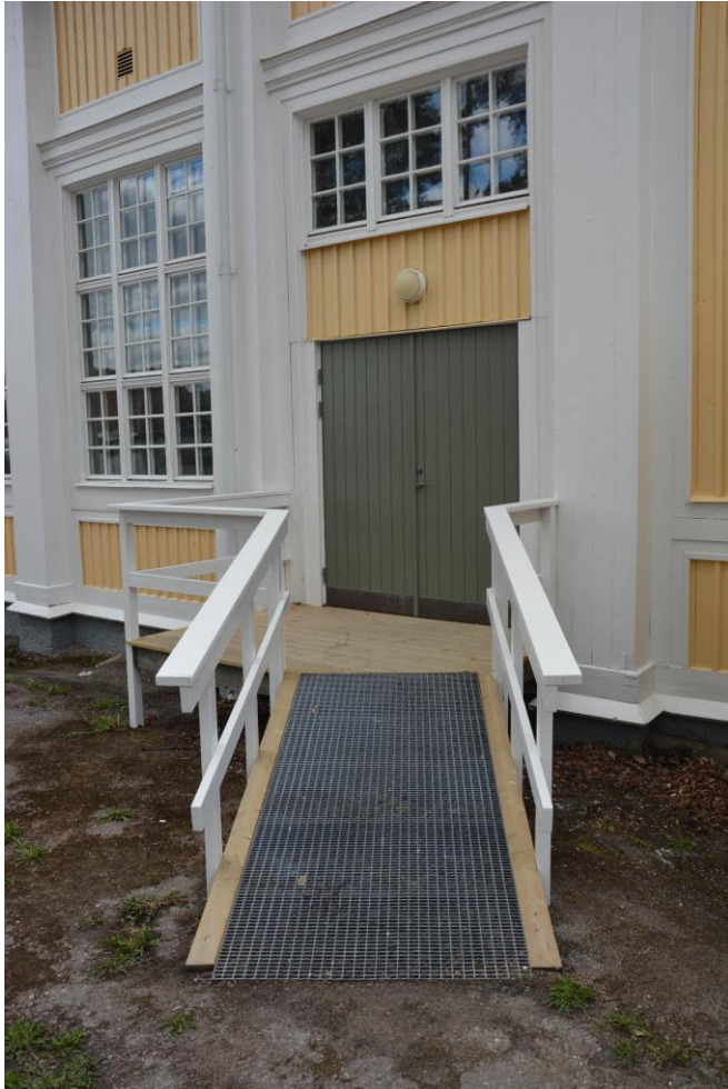
Ny handikappramp. Vlm-kmvek-2857.