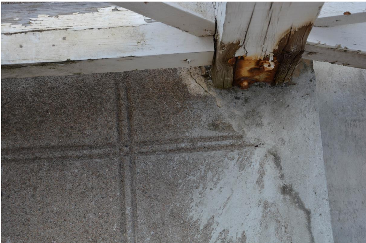
Trappan har lagats, men spårning fortsätter ej i lagad del. Vlm-kmvek-2789.