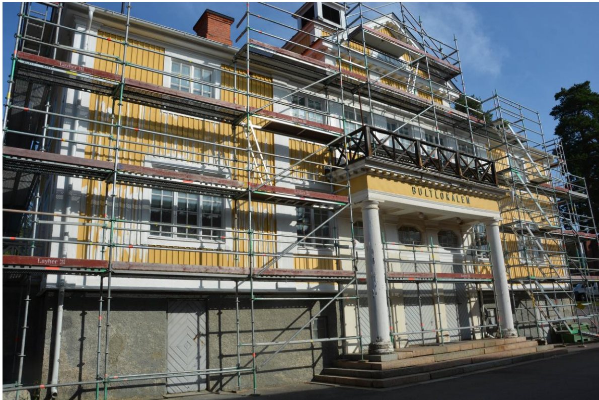
Byggställningar på den södra fasaden. Lagningar har gjorts i sockeln. Vlm-kmvek-2816.