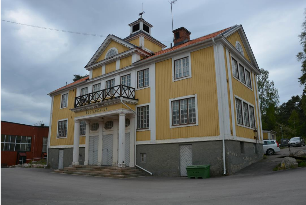
Bultlokalen innan fasadrenoveringen. Notera fönsterkarmar och verandaräcken målade i brun kulör samt att dörrar är ljusblåmålade. Vlm-kmvek-2187.