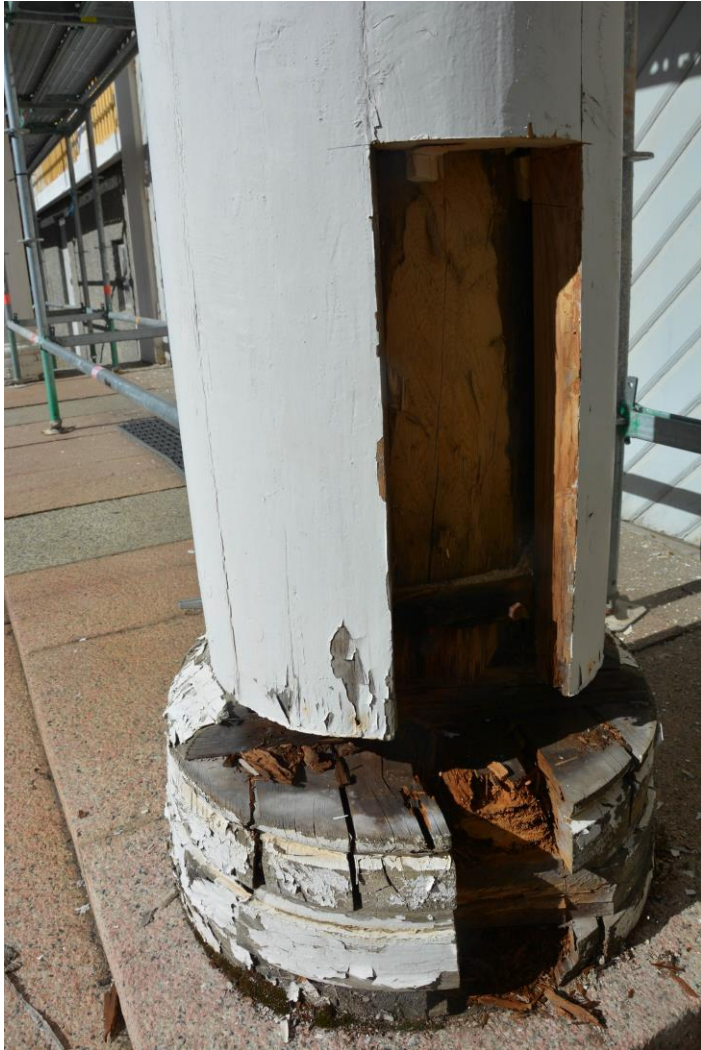
Skadade trädelar tas bort i pelare. I pelaren finns en timmerstock. Vlm-kmvek-2846.