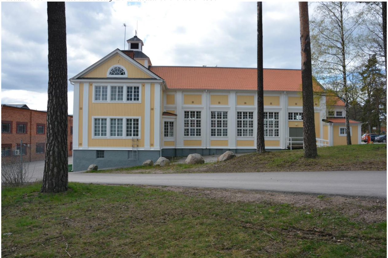
Den östra fasaden efter färdigställt renoveringsarbete. Vlm-kmvek-2873.