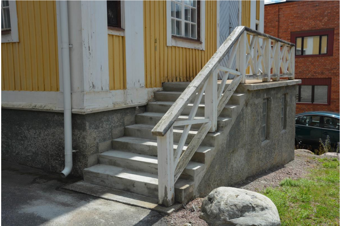
Lagad trappa, vilket gjordes tidigt i arbetsprocessen. Vlm-kmvek-2795.