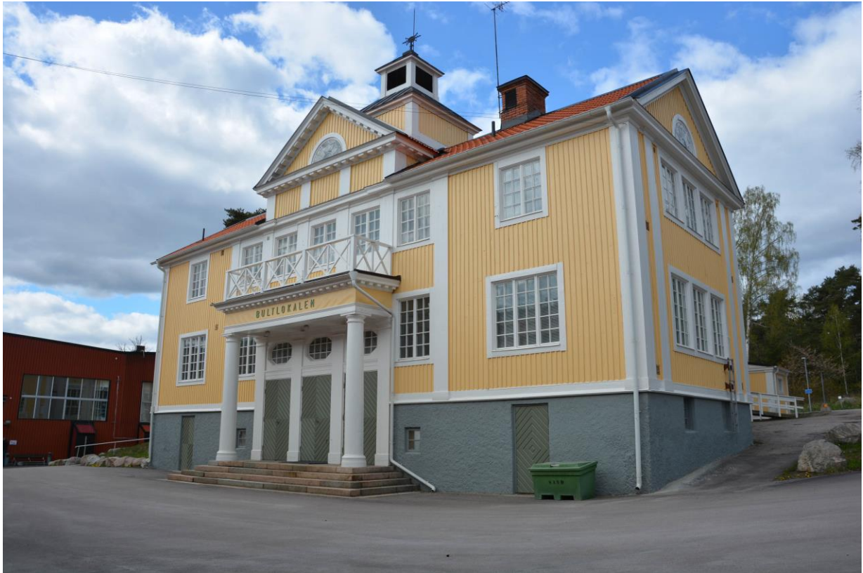
Fasadrenoverad Bultlokalen sett från sydost. Vlm-kmvek-2874.