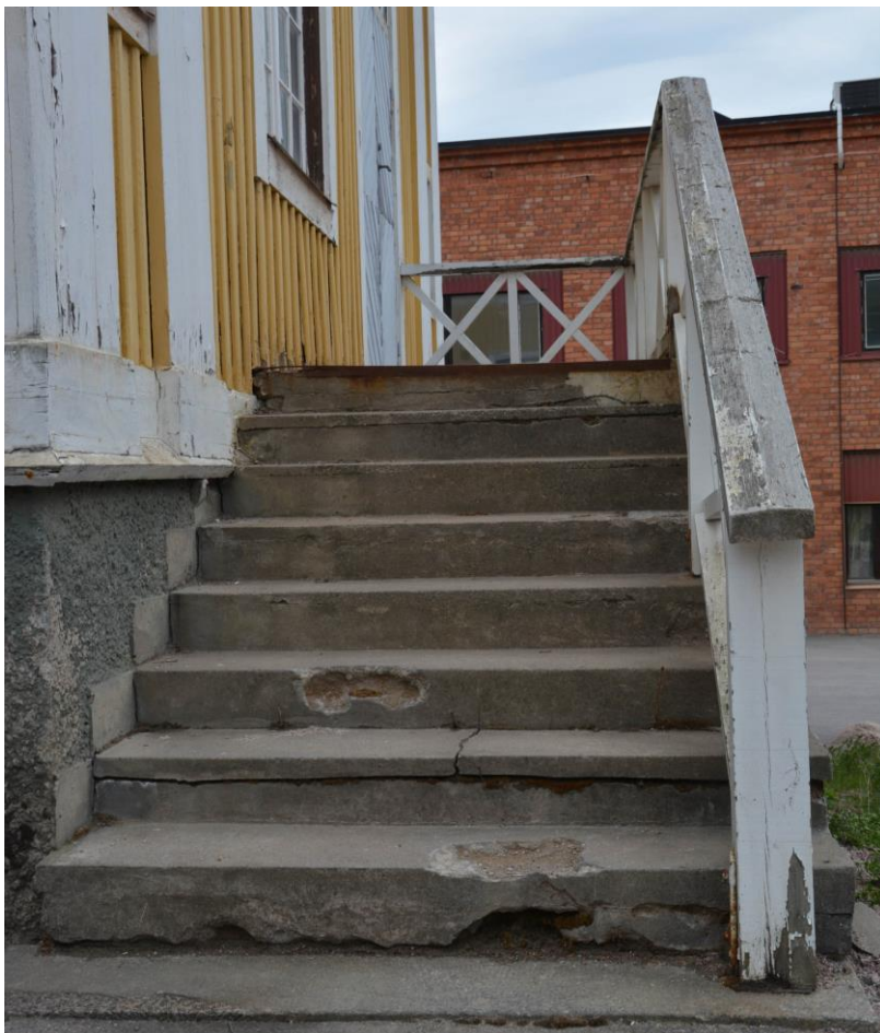
Skador i trappa och avflagnad färg på räcke innan renovering. Vlm-kmvek-2215.