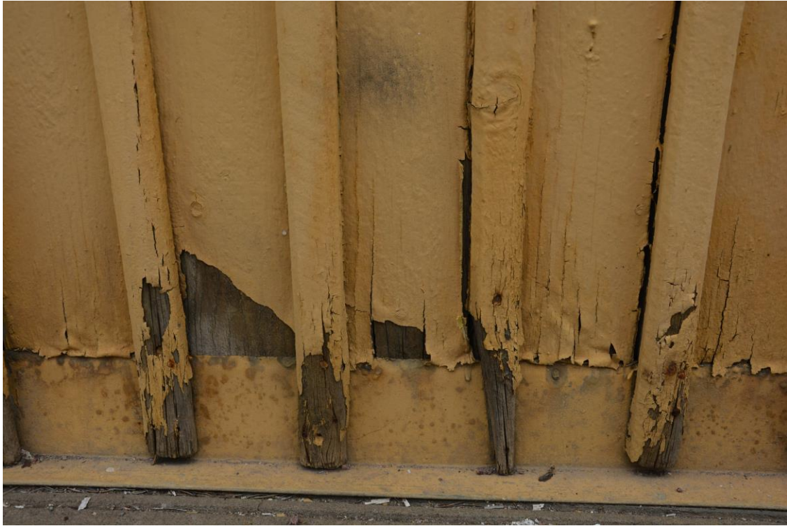
Fasadpanel i behov av renovering. Vlm-kmvek-2207.