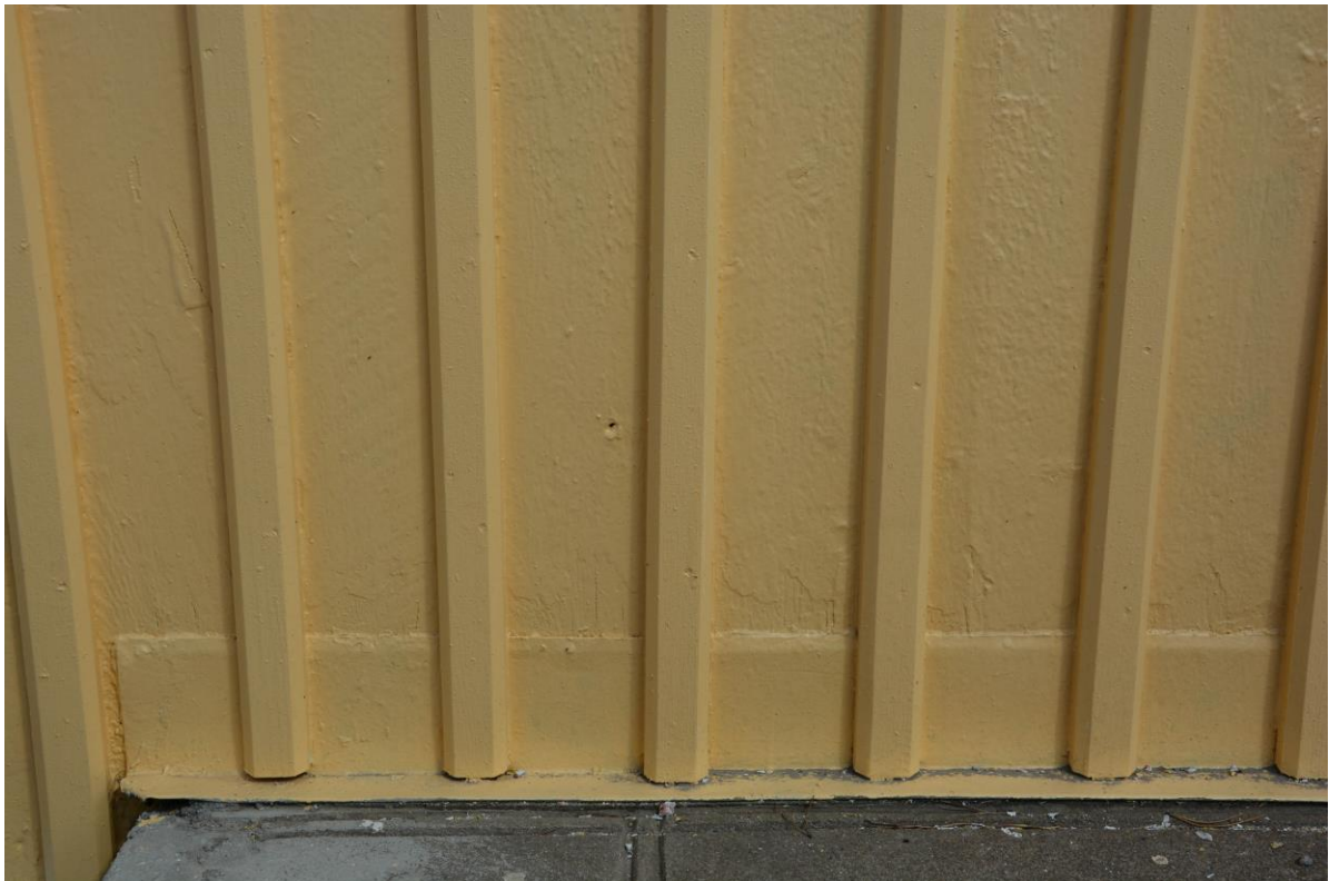
Nya locklister som har målats. Vlm-kmvek-2892.