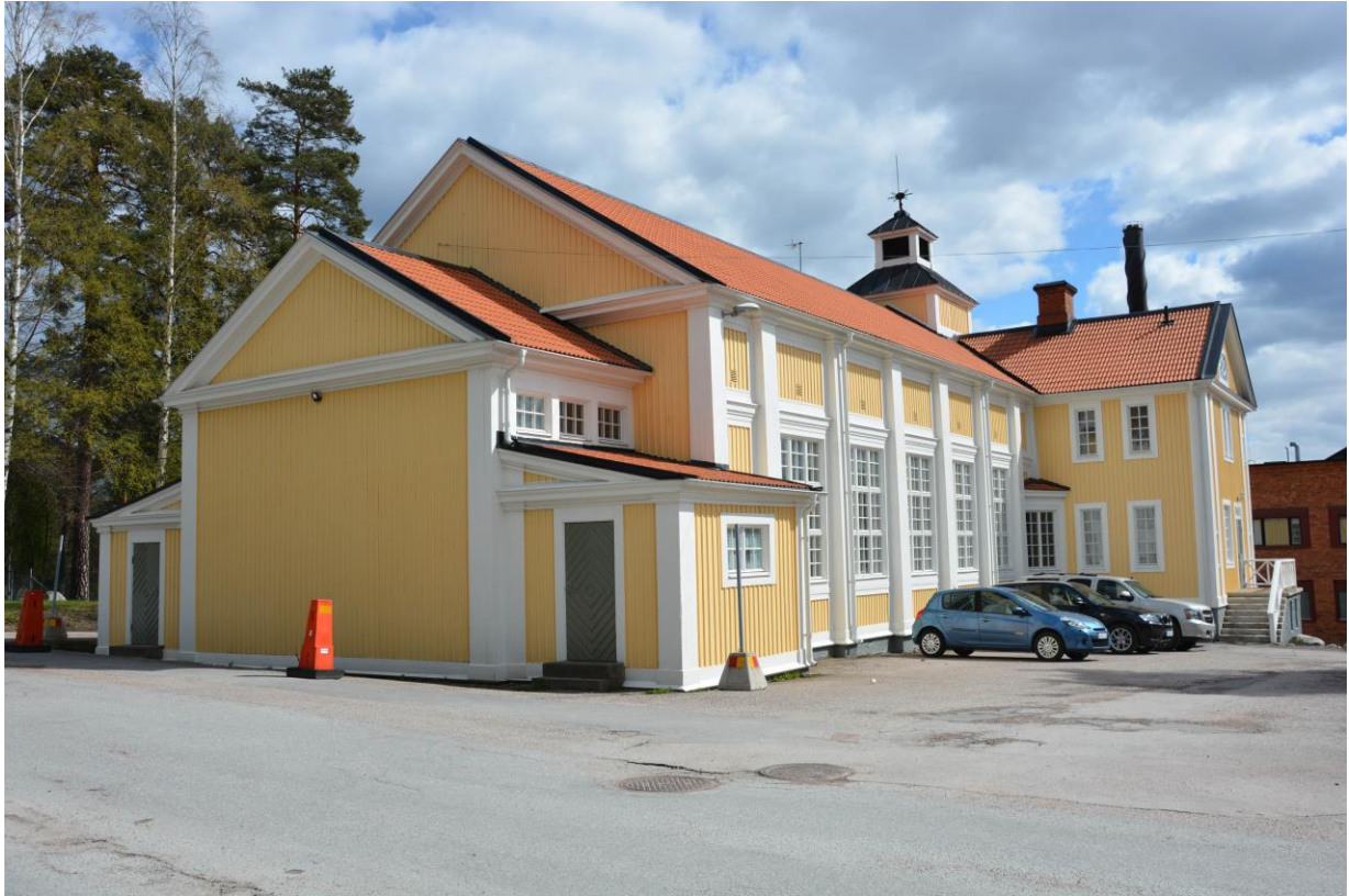
Fasadrenoverad Bulilokalen sett från nordväst. Vlm-kmvek-2899.