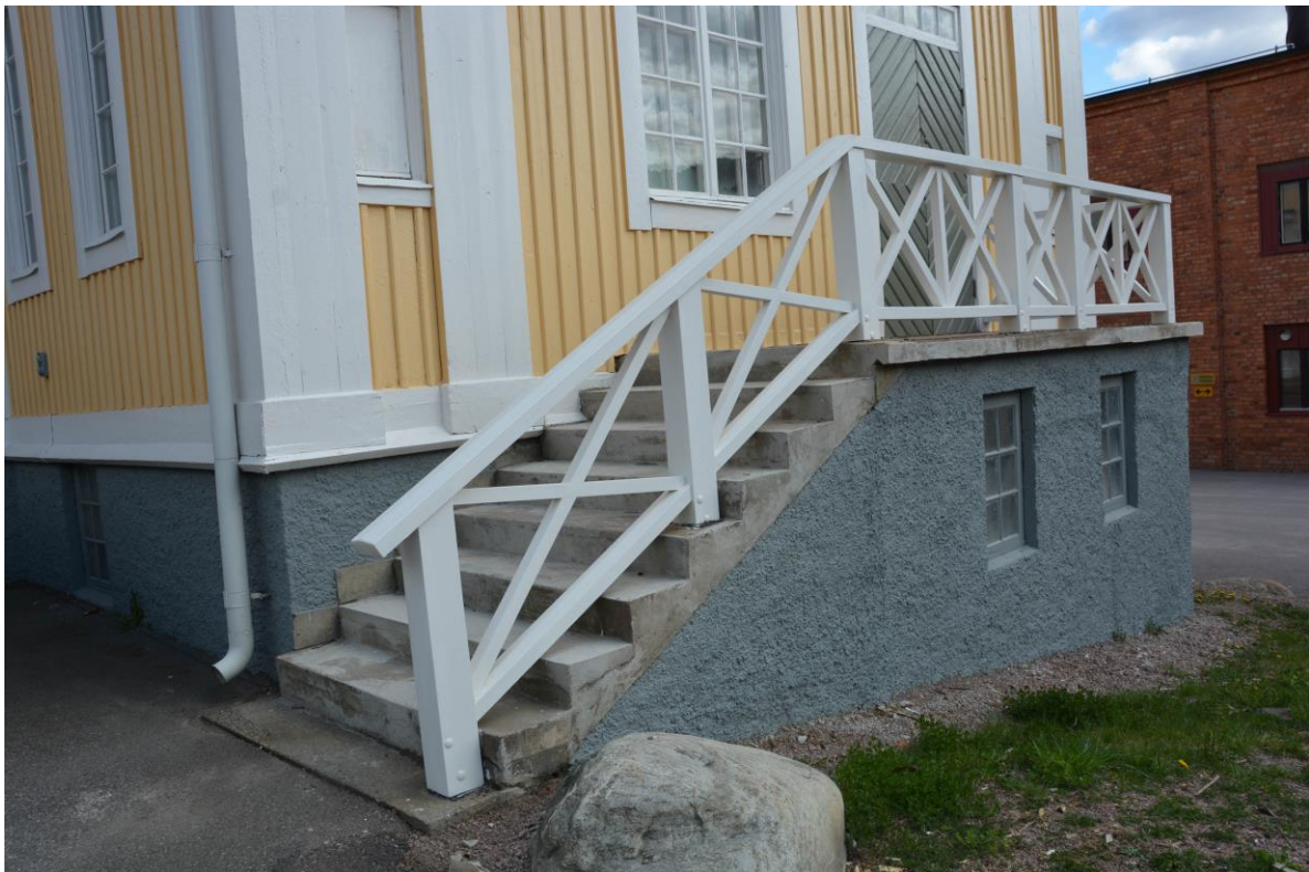
Renoverad trappa och nya räcken på den västra fasaden. Vlm-kmvek-2885.