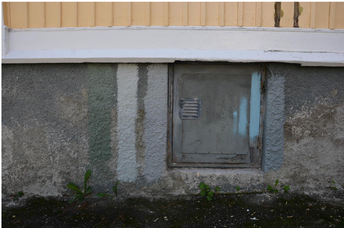
Provstrykningar har gjorts på sockeln och källarfönster. Vlm-kmvek-2822.