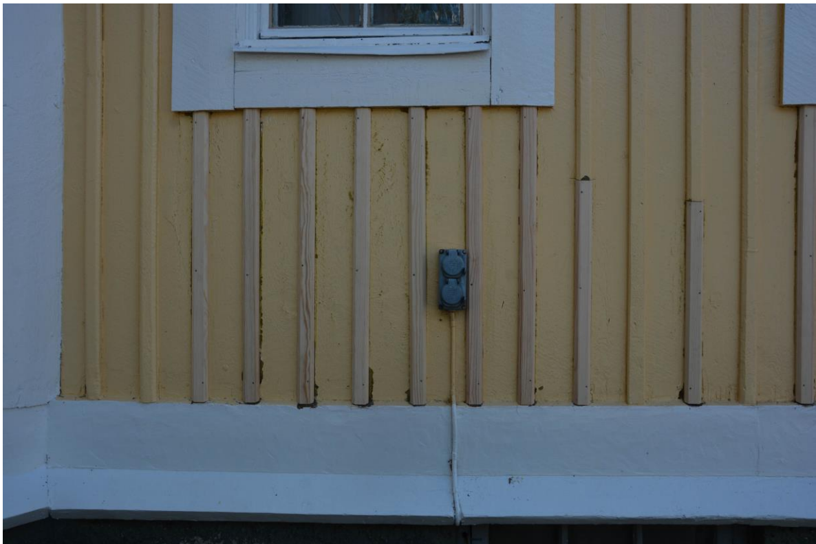
Skadade locklister har bytts ut mot nya. Vlm-kmvek-2837.