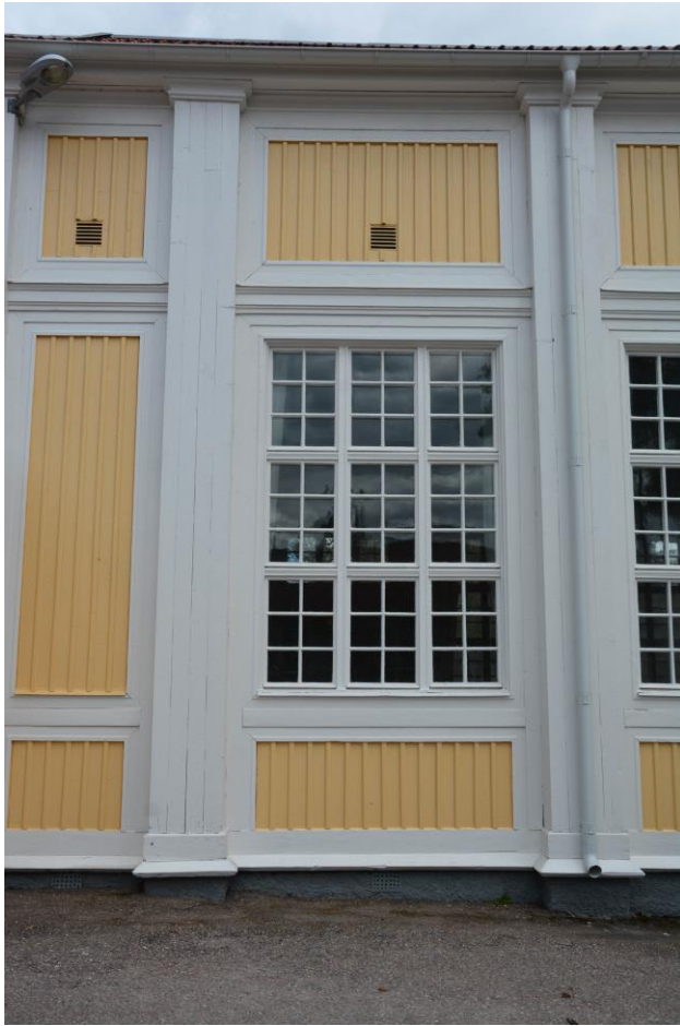
Nymålad fasad och fönster. Vlm-kmvek-2863.