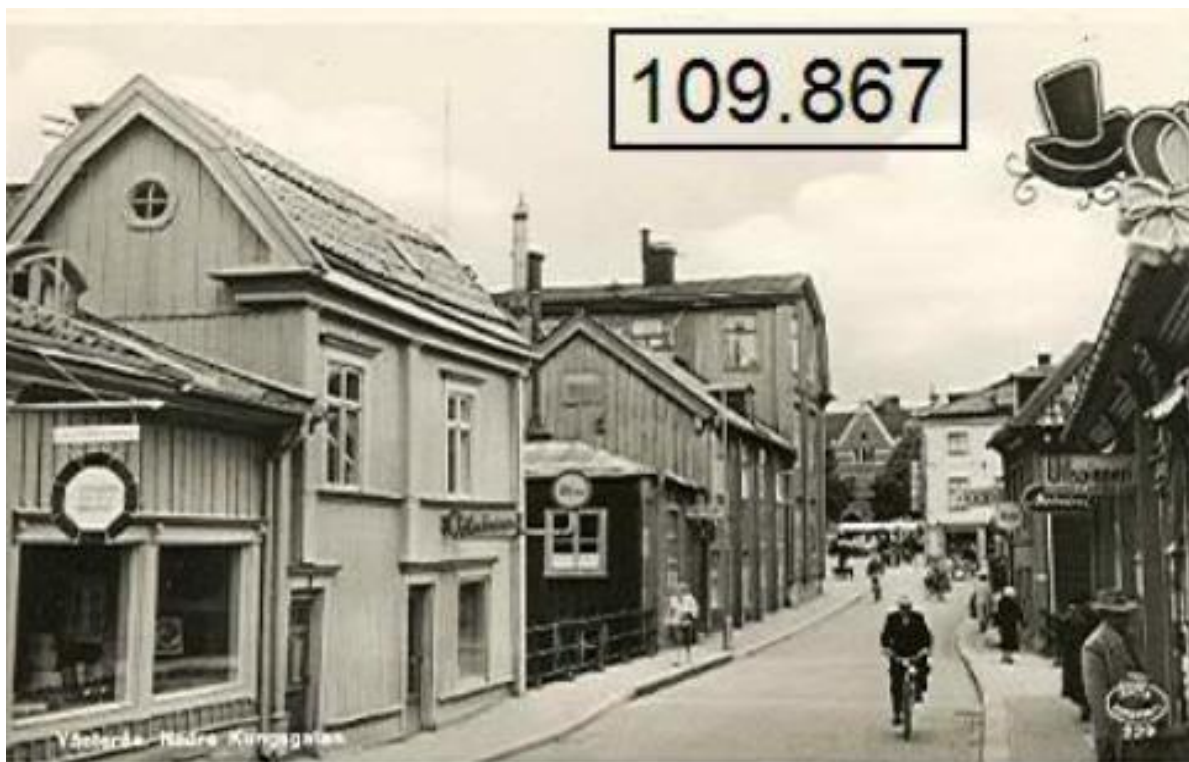
Kungsgatan, odaterad, troligen 1900-talet mitt. Kv Katarina, halva byggnad II och byggnad I till vänster i bild.