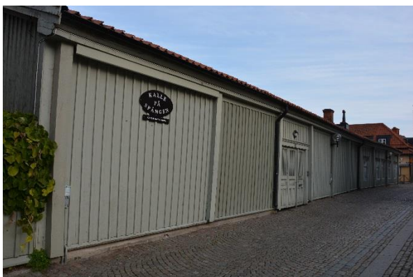
Byggnad V och den port som sammanbygger den med byggnad III.