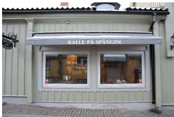
Byggnad II och de tidigare fönstren med aluminiumlist.