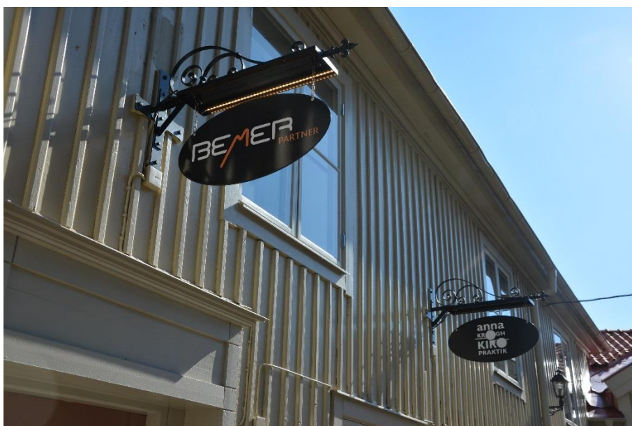
Ett gemensamt skyltprogram togs fram för samtliga kvarter som ingick i renoveringsarbetet. Här ex på skyltar från Polisgränd/Badhusgatan.