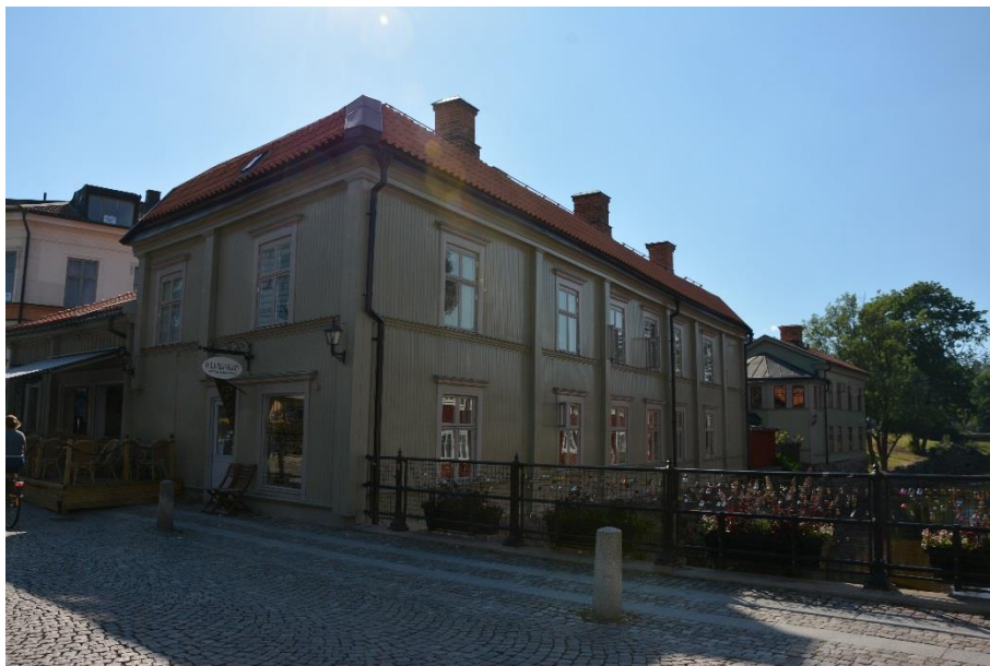
Byggnad I från bron.