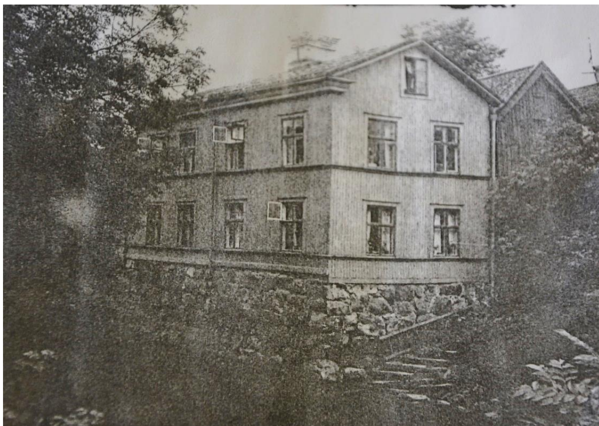
Foto på bostadshuset i kv. Katarina (byggnad IV) från 1939