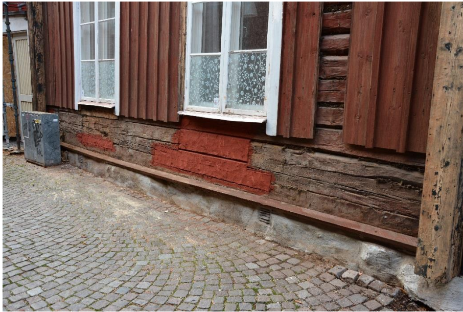
Byggnad på Badhusgatan med traditionella timmerlagningar och röd slamfärg.