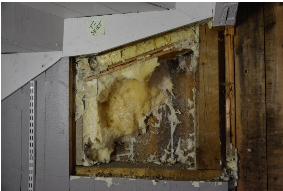
Fuktskadorna i trapphuset var en följd av att fogskum sprutats in i väggarna.