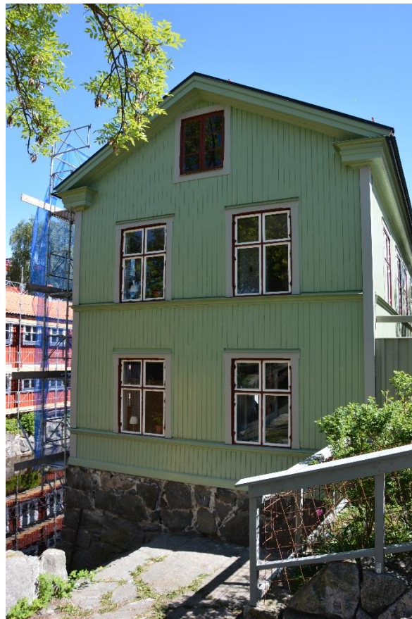
Byggnad IV under fönstermålning.