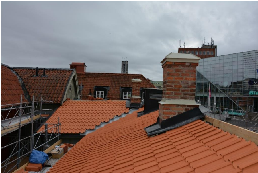
Taken på Kv. Katarina lades om med 1-kupigt lertegel.