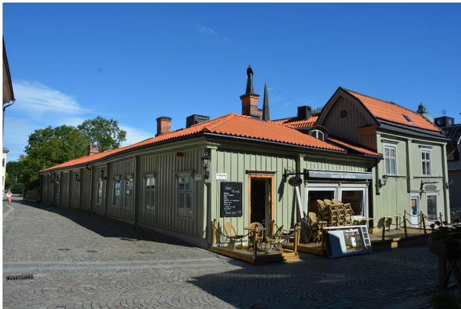
Kv Katarina i hörnet Slottsgatan/Kungsgatan.