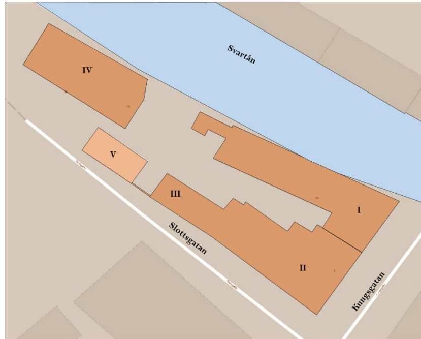
Ill 2, Utdrag ur fastighetskarta. Byggnaderna är numrerade enligt text ovan.

Ett timrat bostadshus ( IV ) i två våningar från mitten av 1800-talet ligger i kvarterets norra del. Byggnad V är ett förråd som genom en port är sammanbyggd med byggnad III.