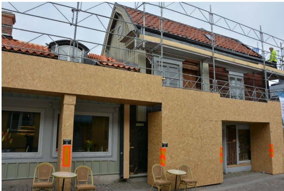
Fasaden är nerplockad på byggnad I och den rödslammade timmerväggen är synlig.