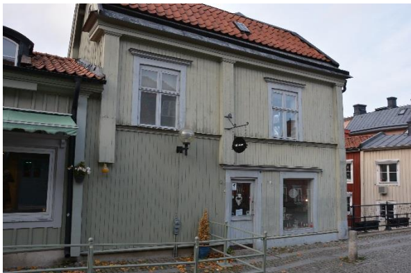
På byggnad I varierade fasadkulören och delar av fasaden mot Kungsgatan var i dåligt skick.