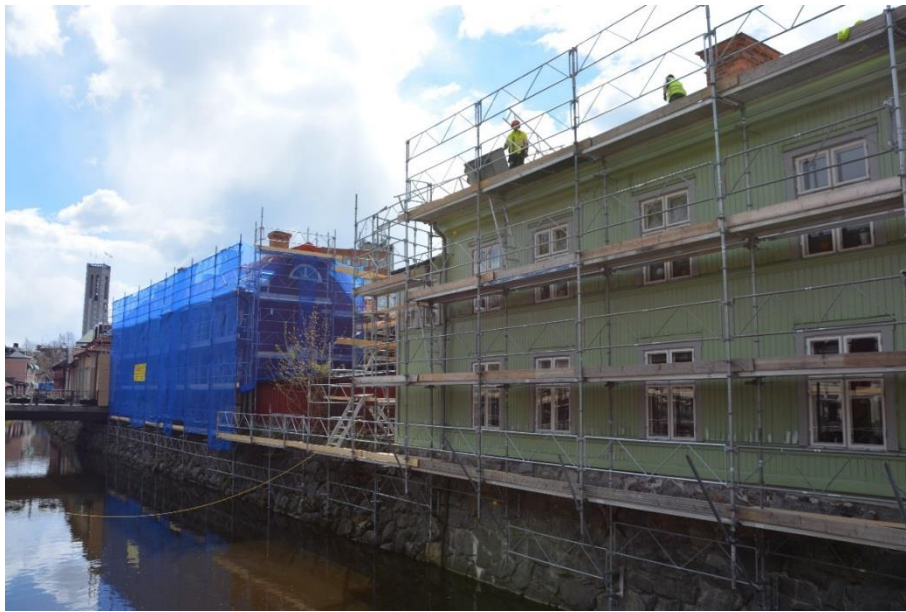
Byggnadsställningar i ån under fasadskrapning och målning.