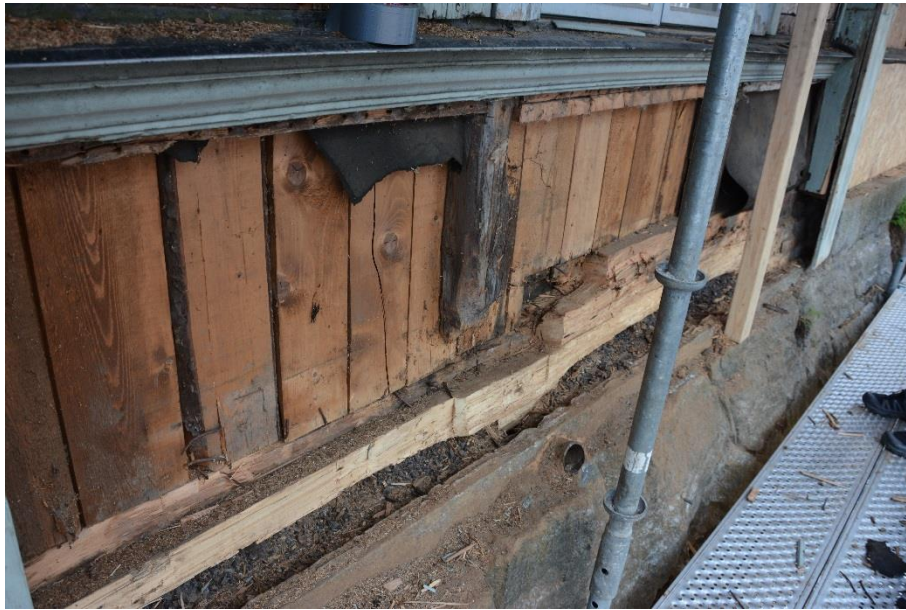
Mot ån plockades delar av fasaden ner för att ta bort svampangripet material.