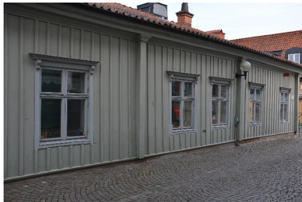
Byggnad II längs Slottsgatan.