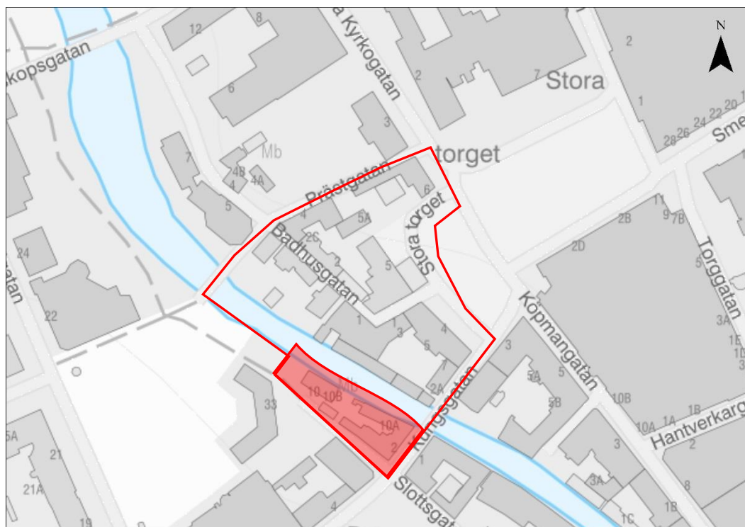
Ill 1. Utdrag ur fastighetskarta. Samtliga ovan nämnda kvarter är markerade med röd kontur. Kv Katarina är markerat helt i rött.