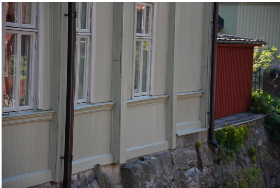
Byggnad I mot Svartån där ny panel ersatt svampangripna delar.