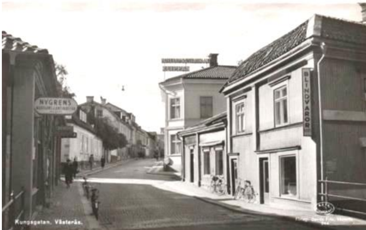
Foto på Kungsgatan, odaterad, troligen från 1900-talet mitt. Kv Katarina, byggnad I och II till höger.

Porten på Badhusgatan 3 behövde bytas ut. Efterforskningar visade att den porten som tillverkats under renoveringarna under sent 1900-tal var gjorda efter en äldre förlaga. Den nya porten tillverkades utifrån ett äldre fotografi som fanns i museets arkiv. Övriga fasadåtgärder har utförts med traditionella material och färgtyper som linolja, tjära och slamfärg. Flera äldre färgtyper där byggnaderna tagit skada tar skrapats bort.