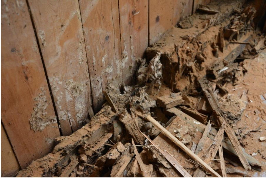
Trapphuset i byggnad I var angripet av hussvamp. Bilden visar en syll.