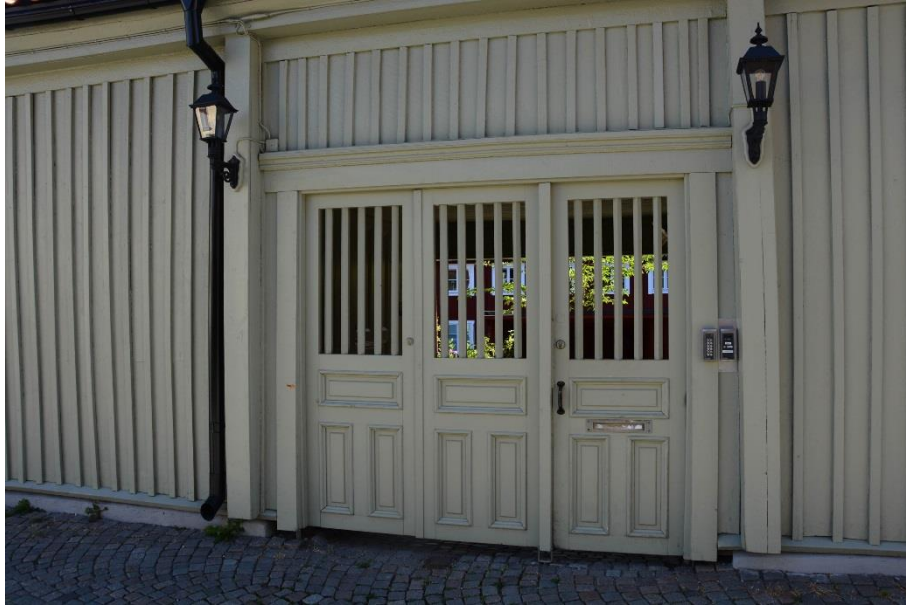
Porten mellan byggnad III och V på Slottsgatan med ny kulör i lonoljefärg och ny belysning.