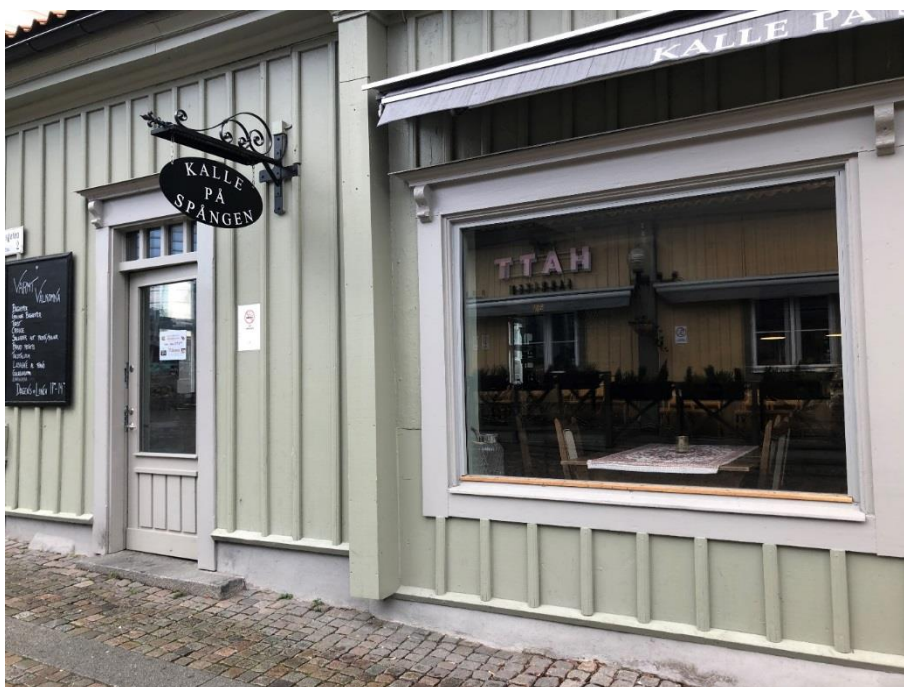
Byggnad II med nya fönster med träram och ny dörr.