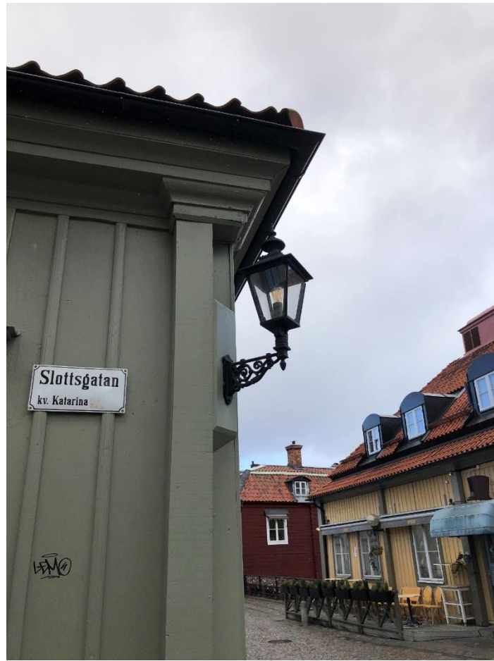
Ny belysning i hörnet Slottsgatan/Kungsgatan.