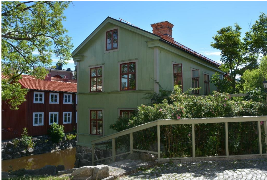
Byggnad IV från väster med ny färgsättning.