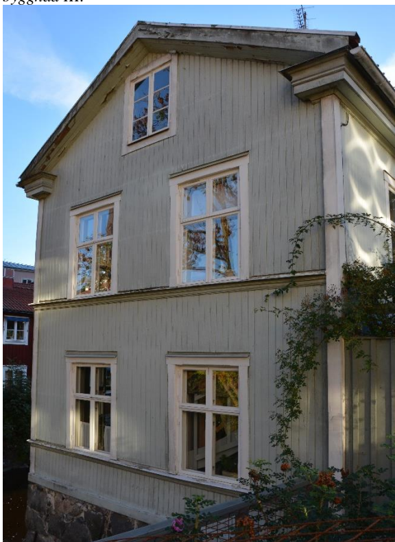
Byggnad IV mot norr.