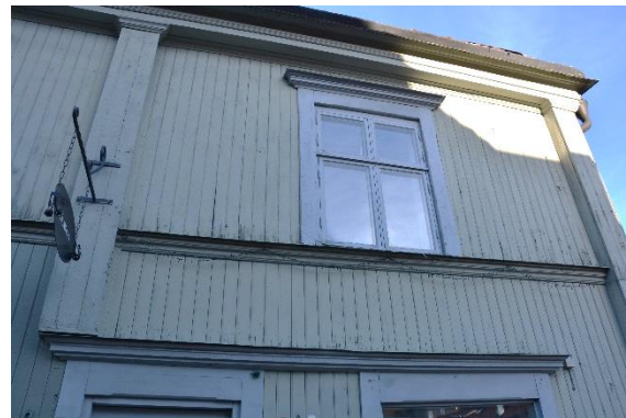
Byggnad I, fasad mot Kungsgatan