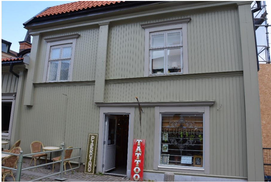
Ny panel är monterad på byggnad I och målad med Wibo linoljefärg.