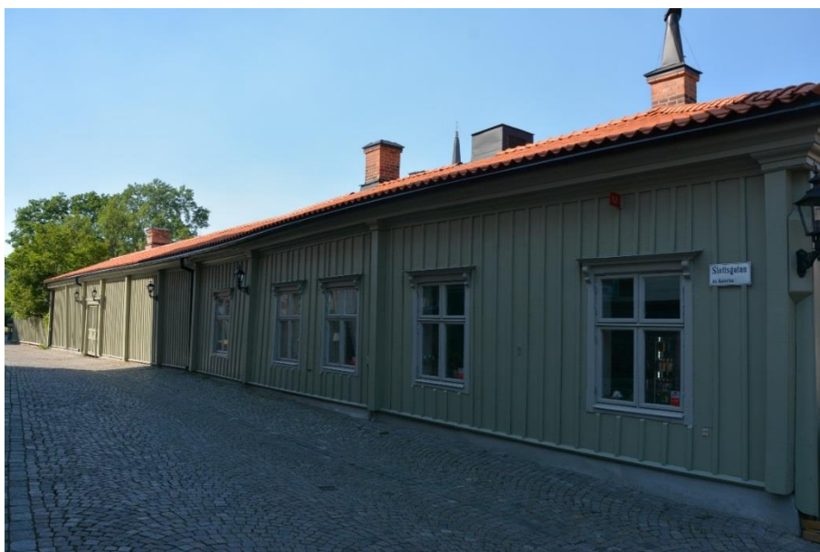
Byggnad III och V längs Slottsgatan med ny linoljefärg på fasad och ny belysning.