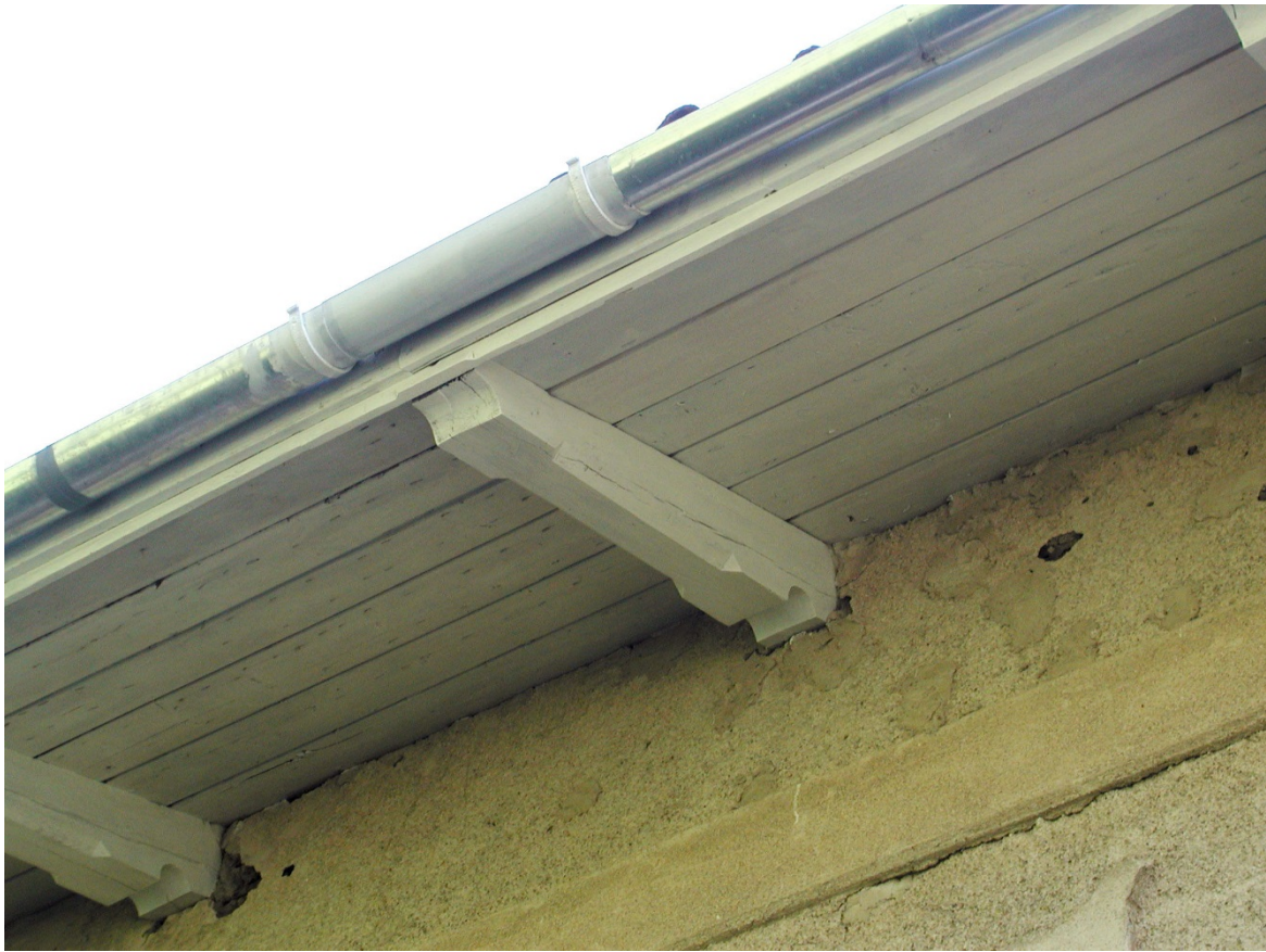
Takfot och skarvning av ränna med nya krokar.