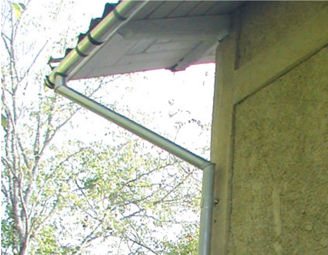
Detalj av stuprör med skarpa vinklar.