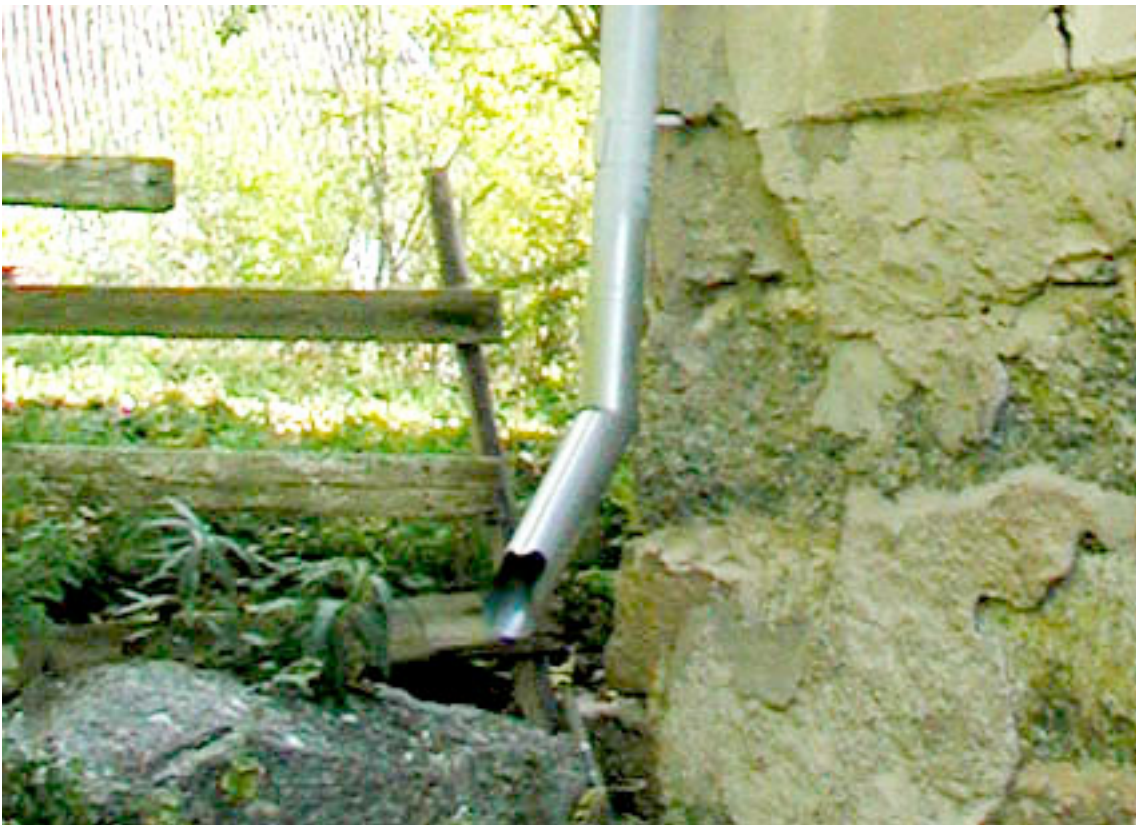
Utkastare med skarp vinkel.