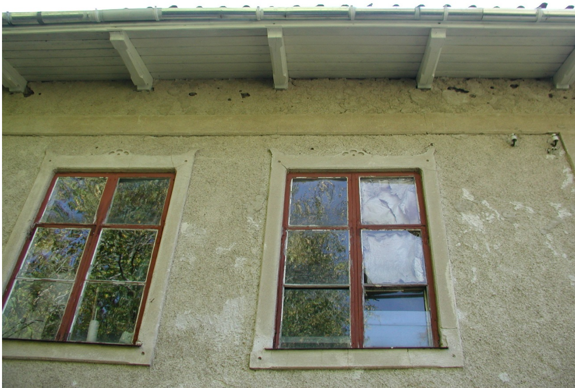
Delar av det målade taksprånget och ny hängränna.