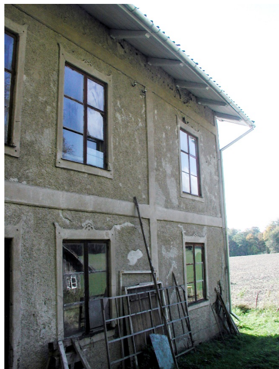
Nyttillverkade stuprör med skarpa vinklar