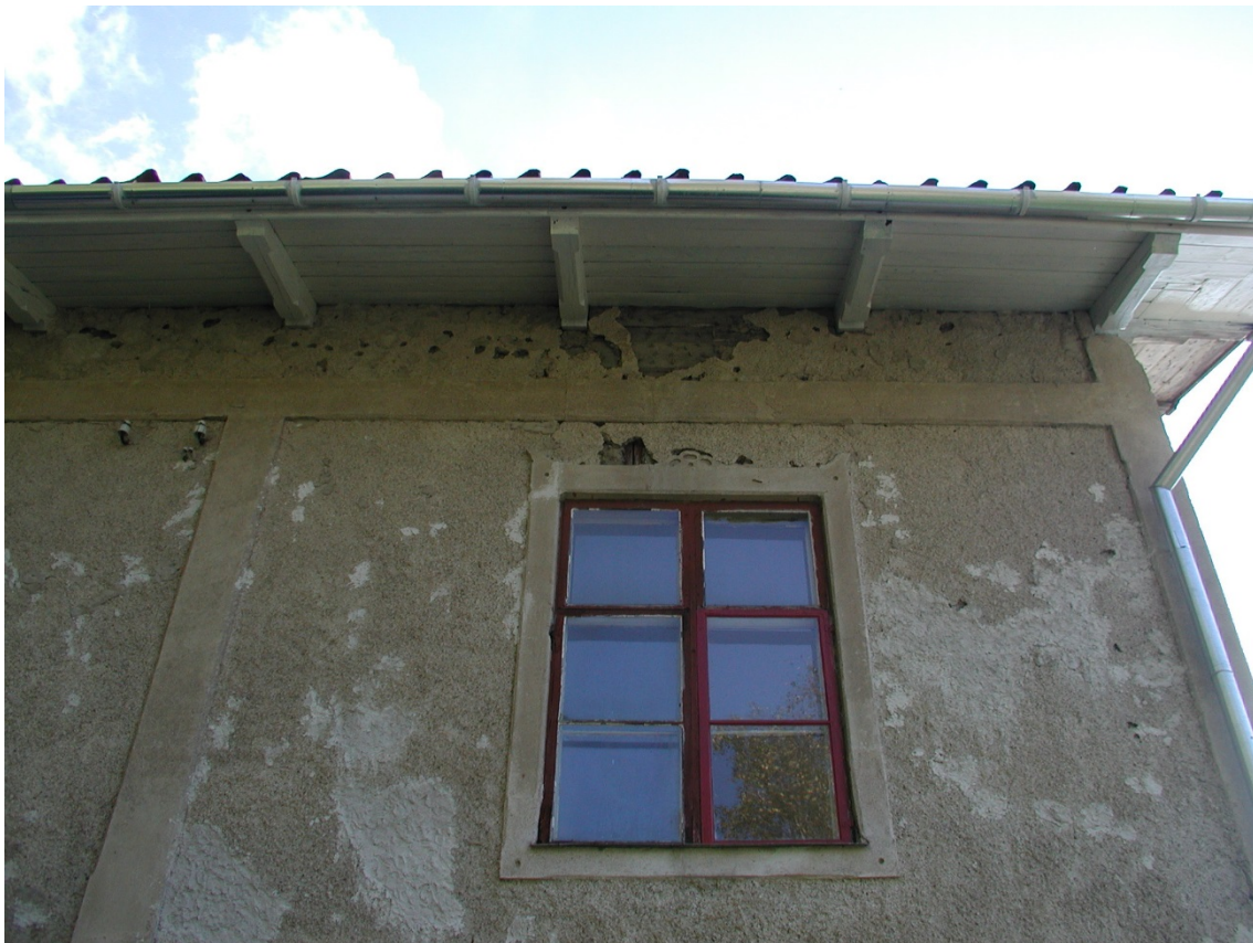
Det målade taksprånget och hängränna, delar av stupränna ses till höger.