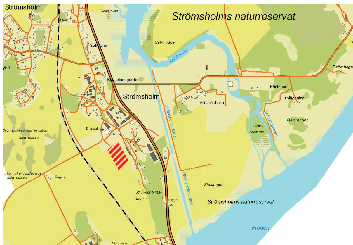
Bild 1: Karta över området. Ungefärlig placering av tågbanan och parkeringen är markerad med röd, streckad yta. Utdrag ur digitala fastighetskatan.

Byggnadsminnet omfattar inte bara Strömsholms slott utan även slottspark och ridskola. Till ridskolan hör bland annat Tågbanan, som fungerar som utomhusridbana. Det fanns en befintlig grusad parkering öster om Tågbanan. Planerna var att utöka denna med en ny, hårdgjord yta söder, väster och delvis norr om banan. Västmanlands läns museum (VLM) har deltagit i projektet som antikvarisk kontrollant. Kontrollen har utförts av Anna Ahlberg och rapporten har skrivits av Mia Jungskär, båda byggnadsantikvarier vid Västmanlands läns museum.