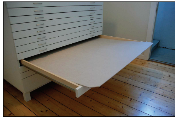
Bild 12 & 13. Den nya textilförvaringen försågs med demonterbara lådor med 83 cm utdrag, de lösa iläggsskivorna kapades i hörnen för bättre luftcirkulation (höger).