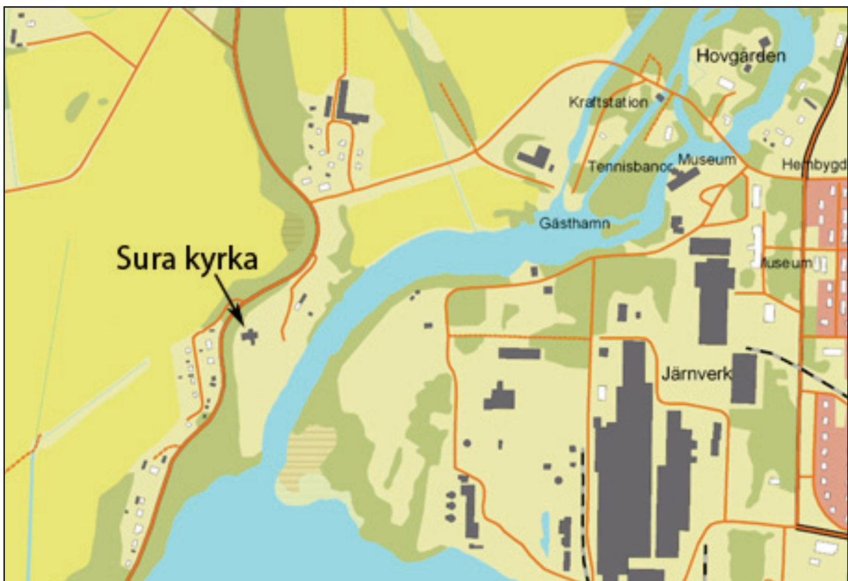
Bild 1. Kartan visar Sura kyrkas läge i Surahammar.