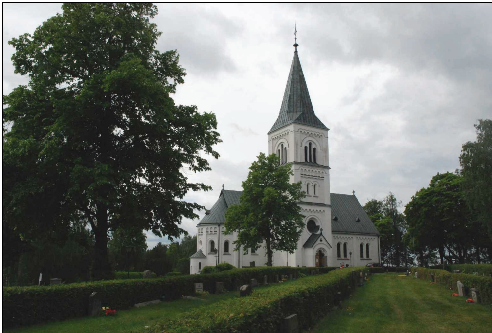
Bild 2. Sura nya kyrka sedd från nordöst, från den "nya" kyrkogården.

Sura nya kyrka, ritad av Överintendentsämbetets arkitekt Gustaf Pettersson, uppfördes i nyromanskstil mellan 1890-92, sedan den tidigare sockenkyrkan blivit för liten. Kyrkan är uppförd med grund av sprängblock och murar av tegel. De rikt dekorerade fasaderna har spritputsade väggfält med slätputsade omfattningar, pilastrar och rundbågsfriser. Kyrkan har en traditionell väst-östlig sträckning med torn vid östra delen av norra fasaden, absidavslutat kor och i söder en vid 1969 uppförd byggnadskropp innehållande sakristia m.m. Tornet har en spetsig spira täckt med ärggrön koppar, liksom långhusets brant sluttande sadeltak. Den utbyggda delen i söder har mot norr och öster oputsade gråstensväggar, putsad vägg mot väster, samt ett flackt koppertak. Innan omgestaltningen vid restaureringen 1936 var fasaderna rödgula med detaljer av hårdbränt tegel. År 1961 ersattes takets ursprungliga, svarta plåttäckning från Surahammars bruk, med koppar.