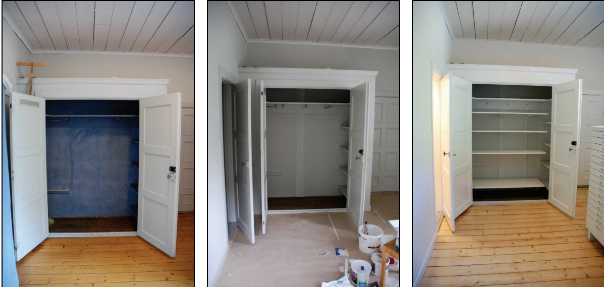
Bild 6, 7 & 8. Bilderna visar det äldre platsbyggda skåpet, innan åtgärder (vänster), underpågående arbete (mitten) och efter utförda åtgärder (höger).

Två yngre förvaringsskåp i gamla sakristian flyttades ned i bårhuset. Avlägsnandet av dessa ledde till ett par smärre reparationer; komplettering av vägsockeln och putsreparation av vägg. Det äldre platsbyggda skåpet längst den södra väggen fick vara kvar men kompletterades med flyttbar hyllinredning. Fyra stycken hyllor med 60 cm djup monterades på sparringskenor. Skåpet målades invändigt likt väggarna i gamla sakristian.