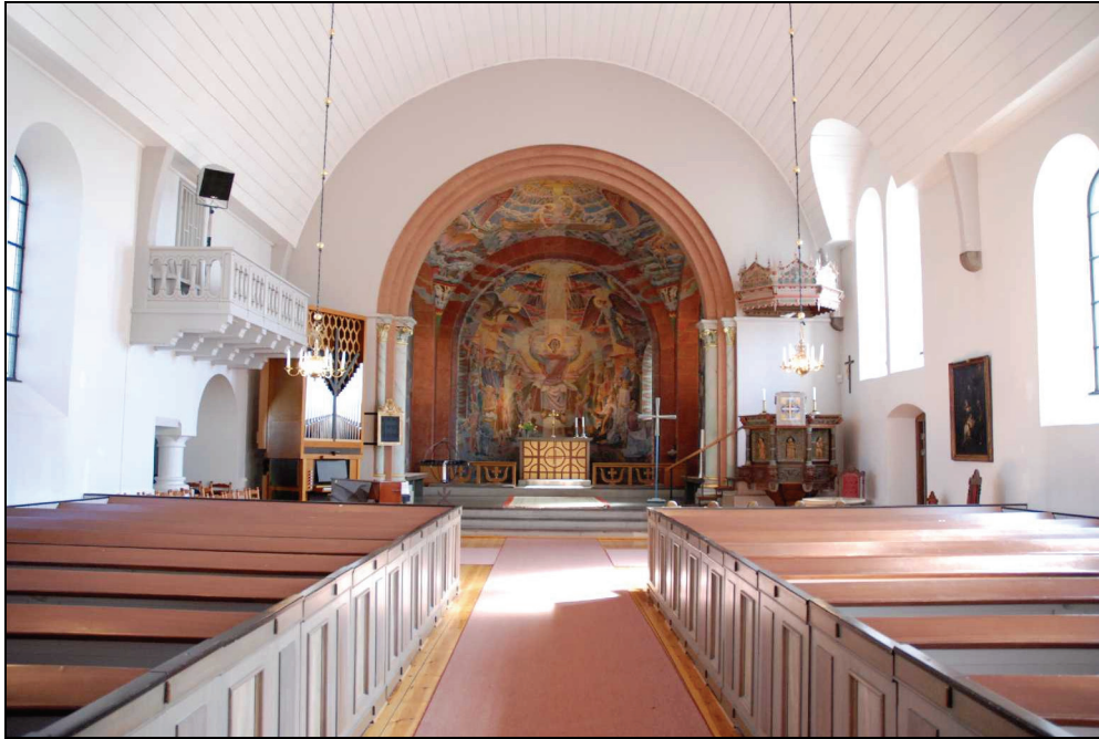
Bild 3. Långskeppets interiör, mot öster.