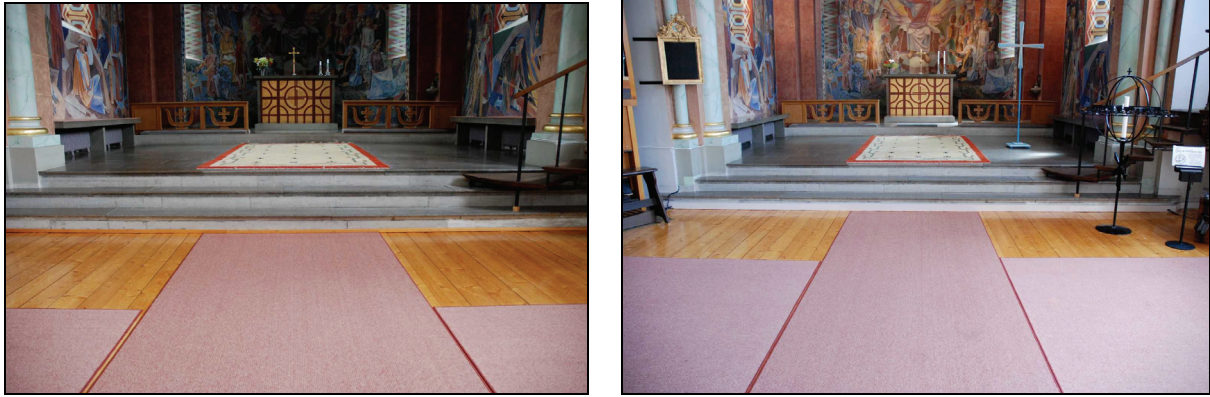
Bild 19 & 20. Den vänstra bilden är tagen innan golvsockeln är på plats och den högra bilden är tagen när golvsockeln är färdig.

Sockeln byggs hela vägen från trappa i vapenhus, framför koret i kyrkorummet, fram till sakristians dörr. Sockeln, med måtten H=110, B=20, målades med linoljefärg från Engvall & Claesson i kulör NCS S0502-Y mot sidoväggar och i kulör NCS S-2005-Y80R likt korvägg mot korstegen. Vid trappa i vapenhus användes trappans kulör NCS S4502-B på golvsockelns sista del. Sockelns skruvar har spacklats igen, dessa slipades av innan målning så att en liten markering indikerar skruvarnas läge i överliggaren.