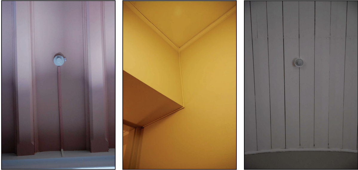
Bild 14, 15 & 16. Rökdetektor i vapenhuset med infärgad kabel (vänster). Kablarna har i största möjliga mån dragits för att inte vara iögonfallande (mitten). Rökdetektorerna i kyrkorummets tak är nedsänkbara och kabeldragningen är utförd på långhusvinden (höger).

Kabeldragningen har lokaliserats till hörn, foder och lister, där det ej varit möjligt har kabeln dragits rakt över vägg eller takyta. Riktlinjen har varit att estetiskt anpassa installationen efter kyrkorummet och i största möjliga utsträckning dölja kablar och apparatur varför dessa har färgats in mot underliggande material.