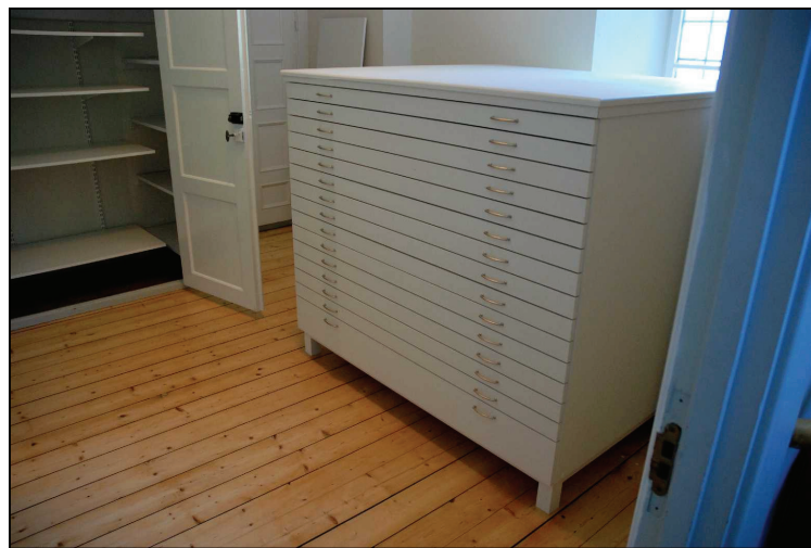
Bild 4 & 5. Två förvaringsskåp avlägsnades från gamla sakristian (vänster) för att ge plats åt den nya textilförvaringen (bild ovan).