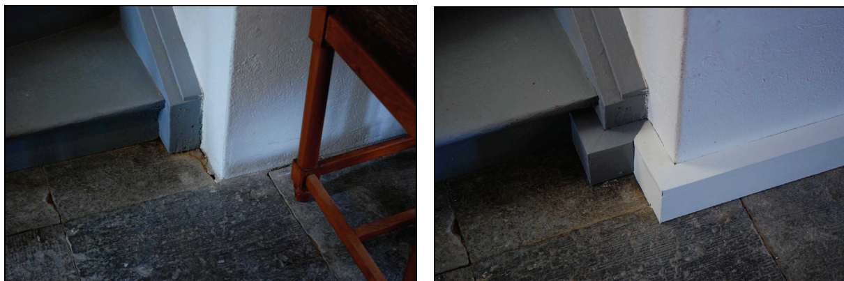
Bild 17 & 18. Golvsockeln för kabeldragning framför korstegen har infärgats efter angränsande kulör. Exemplet visar sockeln vid trappan i vapenhuset, innan och efter utfört arbete.

Sirener har placerats i källarens huvudutrymme och pannrum, bottenplanets kapprum, sakristians entréhall, vapenhuset, långhusvinden samt tornets fjärde plan.